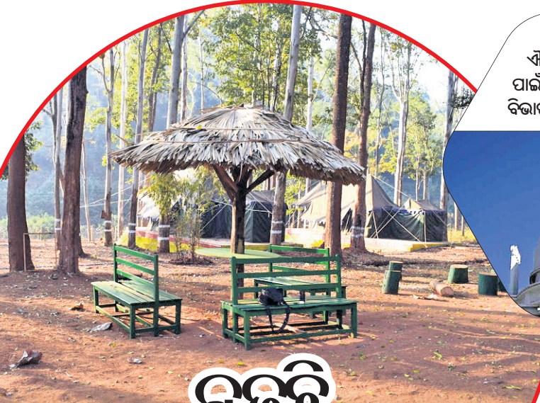
ରାଜ୍ୟରେ ବୌଦ୍ଧ ଏତିହ୍ୟ କାର୍ତ୍ତିରାଜିର ବିକାଶ ପାଇଁ ବିଭିନ୍ନ କାର୍ଯ୍ୟକ୍ରମ ପର୍ଯ୍ୟଟନ ବିଭାଗ ପକ୍ଷରୁ ହାତକୁ ନିଆଯାଇଛି।

ରାଜ୍ୟରେ ପର୍ଯ୍ୟଟନର ବିକାଶ ଲାଗି ପରିବେଶ ପର୍ଯ୍ୟଟନସ୍ଥଳୀଗୁଡ଼ିକରେ ହୋମ୍ ଷ୍ଟେ ବ୍ୟବସ୍ଥା କରିବାକୁ ରାଜ୍ୟ ସରକାର ନିଷ୍ପତ୍ତି ନେଇଛନ୍ତି। ପର୍ଯ୍ୟଟକମାନେ ଯେପରି ଓଡ଼ିଶାର ପାରମ୍ପରିକ ଖାଦ୍ୟ, ଏଠାକାର ଜଳା, ସଂସ୍କୃତି ଏବଂ ସାମାଜିକ ଚଳଣି ଆଦିକୁ ଅନୁଭବ କରିପାରିବେ ସେନେଇ ହୋମ୍ ଷ୍ଟେ ମାଲିକମାନଙ୍କୁ ମଧ୍ୟ ପ୍ରଶିକ୍ଷଣ ଦିଆଯିବ। ହୋମ୍ ଷ୍ଟେ ନେତୃତ୍ୱ ନିର୍ବାହୀ ଓଡ଼ିଶାର ଆଭ୍ୟନ୍ତରୀଣ ଅଞ୍ଚଳଗୁଡ଼ିକରେ ହୋମ୍ ଷ୍ଟେ ସୁବିଧା ଉପଲବ୍ଧ କରାଯିବ। ହୋମ୍ ଷ୍ଟେ ଗୁଡ଼ିକରେ ପର୍ଯ୍ୟଟକଙ୍କୁ ଉନ୍ନତମାନର ଆବିଷ୍କୃତ ସହ ସ୍ୱଳ୍ପ ପରିବେଶ, ସୁରକ୍ଷା ବ୍ୟବସ୍ଥା ଆଦି ଯୋଗାଇ ଦିଆଯିବ। ଏୟାର ବିଏନ୍‌ସି, ଓୟେମ୍ ଏବଂ ମେକ୍ ମାଉଁ ଟ୍ରିପ୍ ଭଳି ଅନୁଲାଇନ୍ ଟ୍ରାଭେଲ ଆଗେନ୍ତରେ ସହାୟତା ପ୍ରଦାନ କରିବାକୁ ହୋମ୍ ଷ୍ଟେ ଗୁଡ଼ିକ ଲିଙ୍କ୍ କରାଯିବ। ତେବେ ଏଥିଲାଗି ସ୍ଥାନୀୟ ହୋମ୍ ଷ୍ଟେ ଯୁକ୍ତି ମାଲିକ ଏବଂ ସରକାରୀ ଅଧିକାରୀଙ୍କୁ ପର୍ଯ୍ୟଟନ ଏବଂ ଜଙ୍ଗଲ ଓ ପରିବେଶ ବିଭାଗ ସହଯୋଗୀ ପ୍ରଶିକ୍ଷଣ ଦେବ। ହାରକ ଟ୍ରିଭୁଲ୍ ତଥା ବୁକିଂ ସର୍କିଟ୍ (ଉତ୍ତର-ଉତ୍ତର-ଲକ୍ଷିତର), କୋରାପୁଟ ଜିଲ୍ଲାର ଓକାଡେଲି, କେନ୍ଦ୍ରାପଡ଼ା ଜିଲ୍ଲାର ଭିତରକନିକା ଜାତୀୟ ଉଦ୍ୟାନ, ଖୋଲା, ଗୁପ୍ତି, ତାଳମାଳ, କନ୍ଧମାଳ ଜିଲ୍ଲାର ବାରିକପଡ଼ି, ବେଲପୁର, ମୟୂରଭଞ୍ଜର ଶିମିଳିପାଳ, ଯଶାପୁର, ପିଠାବାଟ, ଅନୁଗୋଳ ଜିଲ୍ଲାର ଚିକରପଡ଼ା, ସାତକୋଶିଆ, ଖୋର୍ଦ୍ଧାର ମଙ୍ଗଳାଯୋଡ଼ି ଓ ଚିଲିକା ଏବଂ ବରଗଡ଼ ଜିଲ୍ଲାର ଭୋଡ୍ରୋକୁସୁମ ଓ ଜିରୋ ପାଖରେ ପ୍ରଥମ ପର୍ଯ୍ୟାୟରେ ହୋମ୍ ଷ୍ଟେ ବ୍ୟବସ୍ଥା ଉପଲବ୍ଧ କରିବାକୁ ଗୁରୁତ୍ୱ ଦିଆଯିବ।