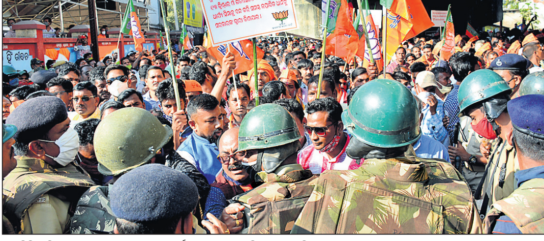
ଆରୁତ୍ତି ସଂଘ ସମ୍ବଲପୁରରେ ଭାଜପା ନେତା ଓ କର୍ମୀଙ୍କ ମଧ୍ୟରେ ପୋଲିସର ଧସ୍ତାଧସ୍ତି।

ସମ୍ବଲପୁରରେ ଚାଷୀ ଅଧିକାର ରାଲି ■ ୫୦ରୁ ଊର୍ଦ୍ଧ୍ୱ ଗିରଫ ■ ଥାନା ଭିତରେ ଧାରଣାରେ ବସିଲେ ନେତା