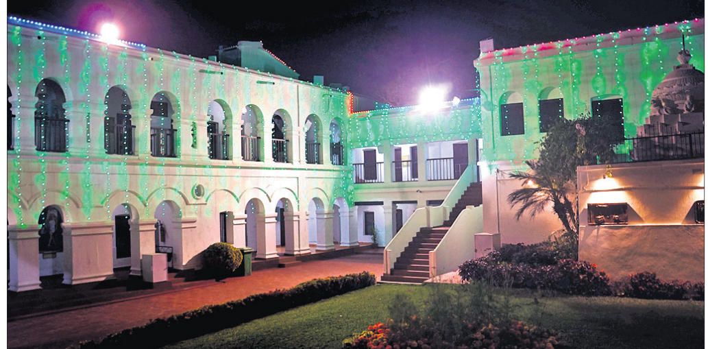
ନେତାଜୀ ଜୟନ୍ତୀ ଅବ୍ୟବହୃତ ପୂର୍ବରୁ କଟକ ଓଡ଼ିଆ ବଜାରସ୍ଥିତ ନେତାଜୀ ଜୟନ୍ତୀ ସଂଗ୍ରହାଳୟକୁ ଆଲୋକମାଳାରେ ସଜିତ କରାଯାଇଛି।

କକରୋନା କଟକଣା ଯୋଗୁ ଦୀର୍ଘ ୯ ମାସ ବନ୍ଦ ରହିବା ପରେ ଖୋର୍ଦ୍ଧା ଜିଲାର ପାର୍ଯ୍ୟଟନ ସ୍ଥଳୀଗୁଡ଼ିକ ଖୋଲିଛି। ଜିଲାର ପ୍ରମୁଖ ପାର୍ଯ୍ୟଟନ ସ୍ଥଳ ବରୁଣେଇ ପୀଠରେ ଧିରେ ଧିରେ ପାର୍ଯ୍ୟଟକଙ୍କ ଭିଡ଼ ଜମିବାରେ ଲାଗିଛି। ଏହାର ପ୍ରାକୃତିକ ମନୋରମ ପରିବେଶ, ମା' ବରୁଣେଇ ଓ କରୁଣେଇଙ୍କ ମନ୍ଦିର ଏଠାକୁ ପାର୍ଯ୍ୟଟକଙ୍କୁ ଟାଣି ଆଣେ। ତେବେ ବରୁଣେଇ ପୀଠ ଚାରିଆଡ଼େ ଅଳ୍ପିଆ ଆବର୍ଜନା ପଡ଼ିରହିଛି। ଫଳରେ ପାର୍ଯ୍ୟଟକଙ୍କ ମଧ୍ୟରେ ଅସନ୍ତୋଷ ପ୍ରକାଶ ପାଇଛି। ଏହା ଜିଲାର ଏକ ପ୍ରମୁଖ ପାର୍ଯ୍ୟଟନ ସ୍ଥଳ ହୋଇଥିଲେ ମଧ୍ୟ ଏଠାକାର ସ୍ୱଚ୍ଛତା ପ୍ରତି ସ୍ୱତନ୍ତ୍ର ଦୃଷ୍ଟି ଦିଆଯାଉନାହିଁ ବୋଲି ସାଧାରଣରେ ଅଭିଯୋଗ ହେଉଛି। କେବଳ ଶୌଚାଳୟକୁ ବାଦ ଦେଲେ ପାର୍ଯ୍ୟଟକଙ୍କ ଲାଗି କୌଣସି ବିଶେଷ ବ୍ୟବସ୍ଥା ନାହିଁ। ପାନୀୟଜଳ ବ୍ୟବସ୍ଥା ଜରାଜୀର୍ଣ୍ଣ ଅବସ୍ଥାରେ ରହିଛି। ପଲିଥିନ, ପ୍ଲାଷ୍ଟିକ ବୋତଲ, ପ୍ଲାଷ୍ଟିକ ପ୍ଲେଟ ପ୍ରଭୃତି ବରୁଣେଇ ପାର୍ଯ୍ୟଟନରେ ପଡ଼ିରହିଥିବା ଦେଖିବାକୁ ମିଳିଛି। ଫଳରେ ପରିବେଶ ଦୂଷିତ ହେଉଛି। ଜିଲାର ପ୍ରମୁଖ ପାର୍ଯ୍ୟଟନସ୍ଥଳରେ ଯଦି ଏଭଳି ଅବ୍ୟବସ୍ଥା ଚଳେ ଅଥବା ପାର୍ଯ୍ୟଟନସ୍ଥଳ ଅବସ୍ଥା କିଭଳି ଥିବ ତାହା