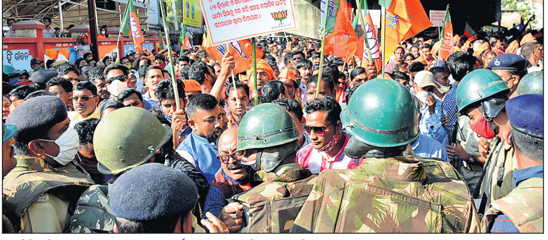
ଆରୁତ୍ତି ସଂଘ ସମ୍ବଲପୁରରେ ଭାଜପା ନେତା ଓ କର୍ମୀଙ୍କ ମଧ୍ୟରେ ପୋଲିସର ଧସ୍ତାଧସ୍ତି।

ସମ୍ବଲପୁରରେ ଚାଷୀ ଅଧିକାର ରାଲି ■ ୫୦ରୁ ଊର୍ଦ୍ଧ୍ୱ ଗିରଫ ■ ଥାନା ଭିତରେ ଧାରଣାରେ ବସିଲେ ନେତା