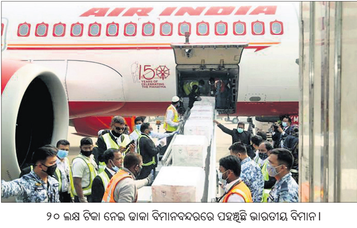
୨୦ ଲକ୍ଷ ଟିକା ନେଇ ଭାରତ ବିମାନବନ୍ଦରରେ ପହଞ୍ଚିଛି ଭାରତୀୟ ବିମାନ ।

ପୁଣେ, ୨୧୧ ଭାରତର କୋଭିଡ଼ ଟିକା ଗୁରୁବାର ବାଲ୍‌ମାଦେଶ ଓ ନେପାଳରେ ପହଞ୍ଚିଛି । ୩୦ ଲକ୍ଷ କୋଭିଡ଼ ଟିକା ନେଇ ଭାରତୀୟ ବିମାନ ଗୁରୁବାର ଦିନ ଓ କାଠମାଣ୍ଡୁରେ ଅବତରଣ କରିଛି । ଶୁକ୍ରବାର ସିଡିଲ୍ ଏବଂ ମ୍ୟାନ୍‌ମାରରେ ଏହି ଟିକା ପହଞ୍ଚିବ । ରୁଧିରୀ ଭୂତାନ ଓ ମାଳଦିବାସକୁ ଟିକା ପଠାଯାଇଥିଲା । ଏହାବ୍ୟତୀତ ଆଫଗାନିସ୍ତାନ, ଶ୍ରୀଲଙ୍କା ଓ ପାକିସ୍ତାନକୁ ଟିକା ପଠାଇବା ପାଇଁ ଭାରତ ଯୋଜନା କରିଛି । ଭାରତରୁ କୋଭିଡ଼ ଟିକା କିଣିବା ଲାଗି ୯୨ ଦେଶ ଅନୁରୋଧ କରିଛନ୍ତି । ବିଶ୍ୱ ଟିକା କେନ୍ଦ୍ର ଭାବେ ଭାରତର ପରିଚୟକୁ ଏହା ଆହୁରି ସୁଦୃଢ଼ କରିଛି । ଗତ ଶନିବାର ଠାଉ ଭାରତରେ ଟିକାକରଣ ଆରମ୍ଭ ହୋଇଥିବାବେଳେ ଏହାର ପାର୍ଶ୍ୱ ପ୍ରତିକ୍ରିୟା ନଗଣ୍ୟ ହୋଇଥିବାକୁ ଅଧିକାରୀ ଅଧିକ ଦେଶ ଭାରତୀୟ କୋଭିଡ଼ ଟିକା କିଣିବା ପାଇଁ ଆଗ୍ରହ ପ୍ରକାଶ କରିଛନ୍ତି । ବ୍ରାଜିଲ ଟିକା ନେବା ପାଇଁ ପୁଣେକୁ ସ୍ୱତନ୍ତ୍ର ବିମାନ ପଠାଇଛି ।