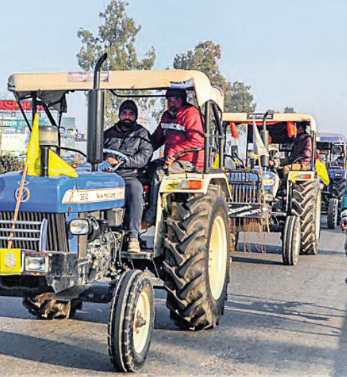
ଜାନୁୟାରୀ ୨୨ରେ ଦିଲ୍ଲୀରେ ହେବାକୁ ଥିବା ଟ୍ରାକ୍ଟର ରାଲି ପୂର୍ବରୁ ଅନୁପତ୍ତରରେ କୃଷକମାନେ ପ୍ରସ୍ତୁତି କରାଇଛନ୍ତି ।

ପୁଣେ, ୨୧୧ ଭାରତର କୋଭିଡ଼ ଟିକା ଗୁରୁବାର ବାଲ୍‌ମାଦେଶ ଓ ନେପାଳରେ ପହଞ୍ଚିଛି । ୩୦ ଲକ୍ଷ କୋଭିଡ଼ ଟିକା ନେଇ ଭାରତୀୟ ବିମାନ ଗୁରୁବାର ଦିନ ଓ କାଠମାଣ୍ଡୁରେ ଅବତରଣ କରିଛି । ଶୁକ୍ରବାର ସିଡିଲ୍ ଏବଂ ମ୍ୟାନ୍‌ମାରରେ ଏହି ଟିକା ପହଞ୍ଚିବ । ରୁଧିରୀ ଭୂତାନ ଓ ମାଳଦିବାସକୁ ଟିକା ପଠାଯାଇଥିଲା । ଏହାବ୍ୟତୀତ ଆଫଗାନିସ୍ତାନ, ଶ୍ରୀଲଙ୍କା ଓ ପାକିସ୍ତାନକୁ ଟିକା ପଠାଇବା ପାଇଁ ଭାରତ ଯୋଜନା କରିଛି । ଭାରତରୁ କୋଭିଡ଼ ଟିକା କିଣିବା ଲାଗି ୯୨ ଦେଶ ଅନୁରୋଧ କରିଛନ୍ତି । ବିଶ୍ୱ ଟିକା କେନ୍ଦ୍ର ଭାବେ ଭାରତର ପରିଚୟକୁ ଏହା ଆହୁରି ସୁଦୃଢ଼ କରିଛି । ଗତ ଶନିବାର ଠାଉ ଭାରତରେ ଟିକାକରଣ ଆରମ୍ଭ ହୋଇଥିବାବେଳେ ଏହାର ପାର୍ଶ୍ୱ ପ୍ରତିକ୍ରିୟା ନଗଣ୍ୟ ହୋଇଥିବାକୁ ଅଧିକାରୀ ଅଧିକ ଦେଶ ଭାରତୀୟ କୋଭିଡ଼ ଟିକା କିଣିବା ପାଇଁ ଆଗ୍ରହ ପ୍ରକାଶ କରିଛନ୍ତି । ବ୍ରାଜିଲ ଟିକା ନେବା ପାଇଁ ପୁଣେକୁ ସ୍ୱତନ୍ତ୍ର ବିମାନ ପଠାଇଛି ।