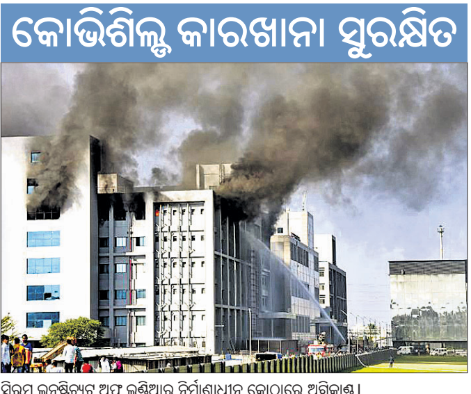
ସିରମ୍ ଇନ୍‌ଷ୍ଟିଚ୍ୟୁଟ୍ ଅଫ୍ ଇଣ୍ଡିଆର ନିର୍ମାଣାଧୀନ କୋଠାରେ ଅଗ୍ନିକାଣ୍ଡ।