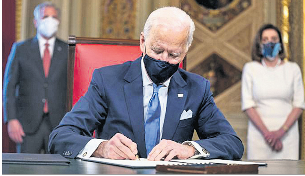
ଓଗ୍ଷ୍ଟିନରେ କ୍ୟାପିଟୋଲର ପ୍ରେସିଡେନ୍ସିଆଲ୍ ରୁମ୍‌ରେ ଆମେରିକା ରାଷ୍ଟ୍ରପତି ଜୋ ବାଇଡେନ୍ ।

ଜୋ ବାଇଡେନ୍ ରାଷ୍ଟ୍ରପତି ହେବା ପରେ ସର୍ବପ୍ରଥମେ ସେ ୧୫ ଏକ୍ସିକ୍ୟୁଟିଭ୍ ଅର୍ଡର ଉପରେ ସ୍ୱାକ୍ଷର କରିଛନ୍ତି । ଏଥିରେ କରୋନା ମହାମାରୀର ମୁକାବିଲାରେ ସରକାରଙ୍କୁ ସହଯୋଗ ମିଳିବା ସମ୍ପର୍କିତ ଅର୍ଡର ମଧ୍ୟ ସାମିଲ ଅଛି । ଏହା ବ୍ୟତୀତ ଜଳବାୟୁ ସଙ୍କଟ ଓ ଆତ୍ମହତ୍ୟା ସମ୍ପର୍କିତ ଟ୍ରମ୍ପ୍‌ଙ୍କ ନାତିଗୁଡ଼ିକୁ ବଦଳାଇବା ପାଇଁ ନୂଆ ଆଦେଶ ମଧ୍ୟ ରହିଛି । ଏହା ପୂର୍ବରୁ କଳା ମାଧ୍ୟମିକ ଓଭାଲ୍ ଅଫିସ୍‌କୁ ଆସିଥିବା ରାଷ୍ଟ୍ରପତି ବାଇଡେନ୍ ଓଭରଦାତାମାନଙ୍କ ସହ ଆଲୋଚନା ବେଳେ କହିଥିଲେ, କୋଭିଡ୍ ସଙ୍କଟ, ଆର୍ଥିକ ସଙ୍କଟ ଓ ଜଳବାୟୁ ସଙ୍କଟ ତାଙ୍କ ବଡ଼ ପ୍ରାଥମିକତା ମଧ୍ୟରେ ରହିଛି । ବାଇଡେନ୍‌ଙ୍କ ରାଷ୍ଟ୍ରପତିତ୍ୱରେ ପ୍ରଥମ ସରକାରୀ ଅର୍ଡର ହେଉଛି ବିଶ୍ୱ ସ୍ୱାସ୍ଥ୍ୟ ସଙ୍ଘଠନ (ଡିଏଚ୍‌ଏସ୍‌)ରେ ଆମେରିକାର ପୁନଃ ଯୋଗଦାନ ସମ୍ପର୍କିତ । ପୂର୍ବସୂତା ଡୋନାଲ୍ ଟ୍ରମ୍ପ୍ ଗତବର୍ଷ ଡିଏଚ୍‌ଏସ୍‌କୁ ଅଧିକାର ଭାବେ ଅଭିହିତ କରିଥିଲେ । ଏହାସହ କରୋନା ମହାମାରୀ ଉପରେ ଚାଲିନାମ ଚାପରେ ନିର୍ଦ୍ଦିଷ୍ଟିତ ଦର୍ଶାଇ ଜାତିସଂଘର ସ୍ୱାସ୍ଥ୍ୟ ସଂଗ୍ରାହୀ ଆମେରିକା ଓହରିଯିବା ନେଇ ସେ ନିଷ୍ପତ୍ତି ନେଇଥିଲେ । ଗତବର୍ଷ ଏପ୍ରିଲରେ ସାରା ବିଶ୍ୱକୁ କରୋନା ସଂକ୍ରମଣ ବ୍ୟାପିଥିବାବେଳେ ଟ୍ରମ୍ପ୍ ଡିଏଚ୍‌ଏସ୍‌ ଚାଲିନାମ ଦ୍ୱାରା ନିୟନ୍ତ୍ରିତ ବୋଲି କହି ଏହାକୁ ଆମେରିକାର ପାଣ୍ଡି ପ୍ରଦାନ ବନ୍ଦ କରିଦେଇଥିଲେ । ଆସନ୍ତା ଜୁଲାଇରେ ତାଙ୍କ ଅର୍ଡର ସମ୍ପର୍କିତ ଭାବେ କାର୍ଯ୍ୟକାରୀ ହେବାକୁ ଥିବାବେଳେ ବାଇଡେନ୍‌ଙ୍କ ଅର୍ଡର ଏହାକୁ ରଦ୍ଦ କରିଛି । ଜାତିସଂଘ ମହାସଭାରେ ଆଞ୍ଚଳିକ ଗୁଡେରସ୍‌କୁ ରୁଧିରୀ ଏକ ପତ୍ର ଲେଖିଛନ୍ତି । ଘାତକ କରୋନା ଭାଇରସ୍ ବିରୋଧୀ ଲଢେଇରେ ଡିଏଚ୍‌ଏସ୍‌ ବିଶ୍ୱରେ ଗୁରୁତ୍ୱପୂର୍ଣ୍ଣ ଭୂମିକା ନେଉଛି । ତେଣୁ ଆମେରିକା ନିଜ ସଦସ୍ୟତା ବଜାୟ ରଖିବାକୁ ଚାହେଁ ବୋଲି ସେ ଏଥିରେ ଉଲ୍ଲେଖ କରିଛନ୍ତି । ଗୁଡେରସ୍ ବାଇଡେନ୍‌ଙ୍କ ପ୍ରସ୍ତାବକୁ