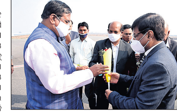
କେନ୍ଦ୍ର ଇସ୍ମାତ ରାଷ୍ଟ୍ରମନ୍ତ୍ରୀଙ୍କୁ ସ୍ୱାଗତ କରାଯାଇଛି।