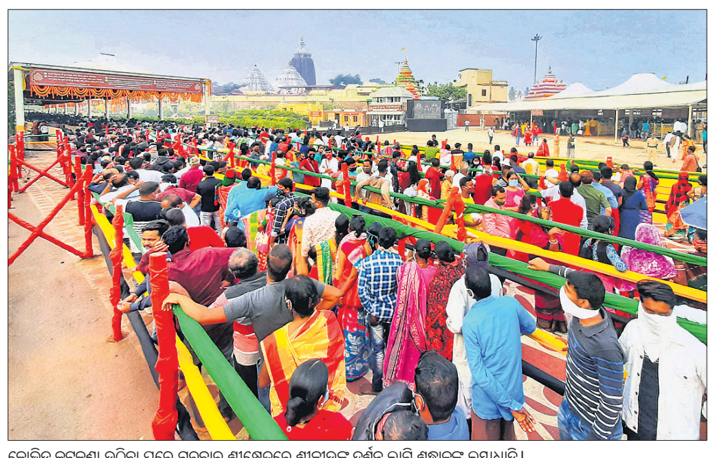
କୋଭିଡ଼ି କଟକଣା ଉଠିବା ପରେ ଗୁରୁବାର ଶ୍ରୀକ୍ଷେତ୍ରରେ ଶ୍ରୀକାନ୍ତଙ୍କୁ ଦର୍ଶନ ଲାଗି ଶ୍ରଦ୍ଧାଳୁଙ୍କ ଲାୟାଧି।