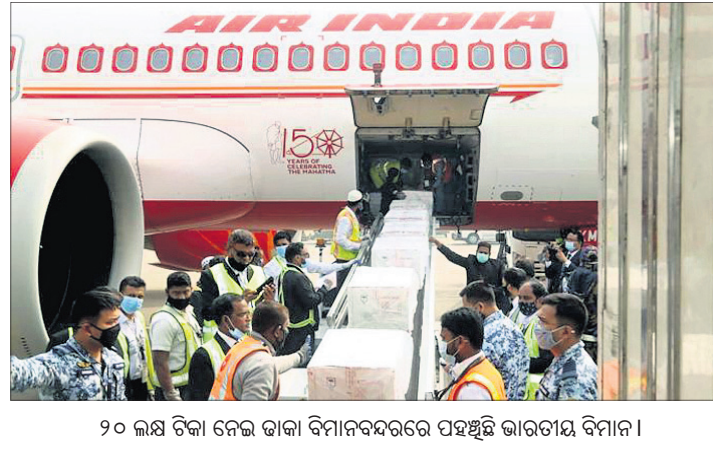
୨୦ ଲକ୍ଷ ଟିକା ନେଇ ଭାରତୀୟ ବିମାନବନ୍ଦରରେ ପହଞ୍ଚିଛି ଭାରତୀୟ ବିମାନ ।

ପୁଣେ, ୨୧୧୧ ଭାରତର କୋଭିଡ଼ ଟିକା ଗୁରୁତ୍ୱର ବାକାଦେଶ ଓ ନେତାକରେ ପହଞ୍ଚିଛି । ୩୦ ଲକ୍ଷ କୋଭିଡ଼ ଟିକା ନେଇ ପୁଲଟି ଭାରତୀୟ ବିମାନ ଗୁରୁବାର ଦ୍ୱାରା ଓ କାଠମାଣ୍ଡୁରେ ଅବତରଣ କରିଛି । ଶୁକ୍ରବାର ସିଡିଲ୍ ଏବଂ ମ୍ୟାନ୍ମାରରେ ଏହି ଟିକା ପହଞ୍ଚିବ । ରୁଧିରୀର ଭୁବନ ଓ ମାଳଦ୍ୱୀପକୁ ଟିକା ପଠାଯାଇଥିଲା । ଏହାବ୍ୟତୀତ ଆଫଗାନିସ୍ତାନ, ଶ୍ରୀଲଙ୍କା ଓ ପାକିସ୍ତାନକୁ ଟିକା ପଠାଇବା ପାଇଁ ଭାରତ ଯୋଜନା କରିଛି । ଭାରତରୁ କୋଭିଡ଼ ଟିକା କିଣିବା ଲାଗି ୯୨ ଦେଶ ଅନୁରୋଧ କରିଛନ୍ତି । ବିଶ୍ୱ ଟିକା କେନ୍ଦ୍ର ଭାବେ ଭାରତର ପରିଚୟକୁ ଏହା ଆହୁରି ସୁଦୃଢ଼ କରିଛି । ଗତ ଶନିବାରଠାରେ ଭାରତରେ ଟିକାକରଣ ଆରମ୍ଭ ହୋଇଥିବାବେଳେ ଏହାର ପାର୍ଶ୍ୱ ପ୍ରତିକ୍ରିୟା ନଗଣ୍ୟ ହୋଇଥିବାରୁ ଅଧିକରୁ ଅଧିକ ଦେଶ ଭାରତୀୟ କୋଭିଡ଼ ଟିକା କିଣିବା ପାଇଁ ଆଗ୍ରହ ପ୍ରକାଶ କରିଛନ୍ତି । ବ୍ରାଜିଲ ଟିକା ନେବା ପାଇଁ ପୁଣେକୁ ସ୍ୱତନ୍ତ୍ର ବିମାନ ପଠାଇଛି ।