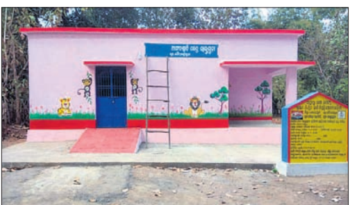
ନୂଆ ଅଙ୍ଗନୱାଡି କେନ୍ଦ୍ର ଫଳକ ଖବର ପ୍ରକାଶ ପାଇବା ପରେ।