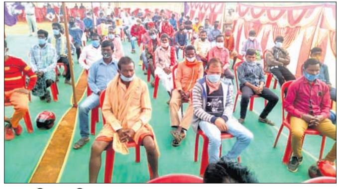
ଜନଶୁଣାଣିରେ ଉପସ୍ଥିତ ଗ୍ରାମବାସୀ।