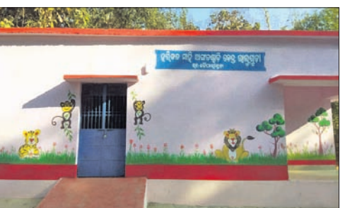
ନୂଆ ଅଙ୍ଗନୱାଡି କେନ୍ଦ୍ର ଫଳକ ଖବର ପ୍ରକାଶ ପାଇବା ପୂର୍ବରୁ।

କୋରାପୁଟ ଜିଲା ବୈପାରିଗୁଡ଼ା ବ୍ଲକ ରାମଗିରି ପଞ୍ଚାୟତର ଡାକଗୁଡ଼ା ଗ୍ରାମରେ ଏକ ନୂତନ ଅଙ୍ଗନୱାଡି ଗୃହକୁ ନେଇ ବିବାଦ ଦେଖାଯାଇଛି। କିଛିଦିନ ତଳେ ଉକ୍ତ ଅଙ୍ଗନୱାଡି ଗୃହ ସମ୍ପୂର୍ଣ୍ଣ ହୋଇଥିବା ବେଳେ ସେଠାରେ ଲାଗିଥିବା ଫଳକ ନେଇ ଲୋକେ ପ୍ରଶ୍ନ ଉଠାଇଥିଲେ। ଉକ୍ତ ଫଳକରେ ହରିଜନ ଉପାଧି ଅଙ୍ଗନୱାଡି କେନ୍ଦ୍ର ଉଲ୍ଲେଖ ଥିଲା। ତେବେ ହରିଜନ ସାହିରେ ୨ ବର୍ଷ ତଳେ ଅନ୍ୟ ଏକ ଅଙ୍ଗନୱାଡି ଗୃହ ନିର୍ମିତ ଲୋକେ ପର୍ଯ୍ୟନ୍ତ ହୋଇ ଅଧ୍ୟାପକରିଆ ଅବସ୍ଥାରେ ପଡିଛି। ଏହାର କାରଣ ସ୍ପଷ୍ଟ