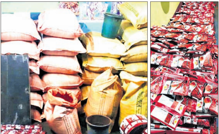
ଜବତ ଭେଜାଲ ହଳଦୀ ଓ ଲଙ୍କା ଗୁଣ୍ଡ।

■ ମିଶ୍ର ଲେଖିକା, ରଙ୍ଗ, କାଠଗୁଣ୍ଡ ■ ବିପୁଳ ପରିମାଣର ଭେଜାଲ ସାମଗ୍ରୀ ଜବତ, ୩ ଅଟକ