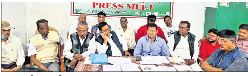
ଖବରଦାତା ସମ୍ମିଳନୀରେ ଉପସ୍ଥିତ କଂଗ୍ରେସ ନେତାମାନେ।