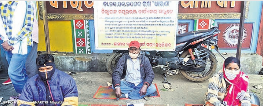
ଜିଲ୍ଲାପାଳଙ୍କ କାର୍ଯ୍ୟାଳୟ ଆଗରେ ଧାରଣା ଦେଇଥିବା ବାସନ୍ତ ପରିବାର।