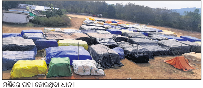
ମଣ୍ଡିରେ ଗଦା ହୋଇଥିବା ଧାନ।

କୋରାପୁଟ ଜିଲାରେ ଚଳିତ ଖରିଫ ଋତୁରେ ଅମଳ ପରେ ୨୫ ପ୍ରତିଶତ ଧାନ ଚାଷୀ ବିକ୍ରି କରିଥିବା ବେଳେ ୭୫ ପ୍ରତିଶତ ଧାନକୁ ଦାୟି ଏକ ମାସ ହେବ ମଣ୍ଡିରେ ପଡିବାରୁ ଚାଷୀ ଅସହ୍ୟ ଅଭାବେ ଧାନ ଜଗିଛନ୍ତି। ନଭେମ୍ବରରୁ ଚାଷୀ ପଞ୍ଚାକରଣ ଅନୁଯାୟୀ ବିଭିନ୍ନ ଅୟୋଗୀ ମଣ୍ଡିଗୁଡ଼ିକରେ ଧାନ ଗଦେଇଛନ୍ତି। ପ୍ରତି ମଣ୍ଡିରେ ଯେଉଁ ଚାଷୀଙ୍କର ପଞ୍ଚାକରଣ ହୋଇଥାଏ ସେହି ଚାଷୀଙ୍କଠାରୁ ପ୍ରଶାସନ ଧାନ କିଣିଥାଏ। ଚଳିତବର୍ଷ ଜାନୁୟାରୀ ୧ରୁ ପ୍ରଶାସନ ଚାଷୀଙ୍କ ଧାନ କିଣିବା ସମ୍ପୂର୍ଣ୍ଣ ବନ୍ଦ କରିଦେଇଛି। କେତେକ ଗ୍ରାମରେ ପ୍ରତିବାଦରେ ରାସ୍ତାରୋକୋ ହୋଇଛି। ବର୍ତ୍ତମାନ ସୁଦ୍ଧା ମଣ୍ଡିରେ ପ୍ରାୟ ୧ ଲକ୍ଷ ୨୫ହଜାର କୁଇଣ୍ଟାଲ ଖରିଫ ଧାନ କେବଳ କୁନ୍ତୁରା ବ୍ଲକରେ କ୍ରୟ ହୋଇପାରିନାହିଁ। ଆରମ୍ଭରୁ ପ୍ରଶାସନ ଧାନ ସଂଗ୍ରହ ଲାଗି