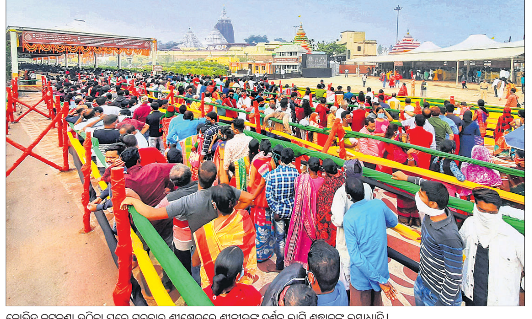
କୋଭିଡ଼ କଟକଣା ଉଠିବା ପରେ ଗୁରୁବାର ଶ୍ରୀକ୍ଷେତ୍ରରେ ଶ୍ରୀକାର୍ତ୍ତିକ ଦର୍ଶନ ଲାଗି ଶ୍ରଦ୍ଧାଳୁଙ୍କ ଲାୟାଧି।