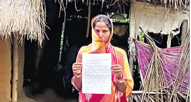
ବୁକ୍ ଅଫିସରଙ୍କୁ ପତ୍ରର ନକଲ ଦେଖାଉଛନ୍ତି ।