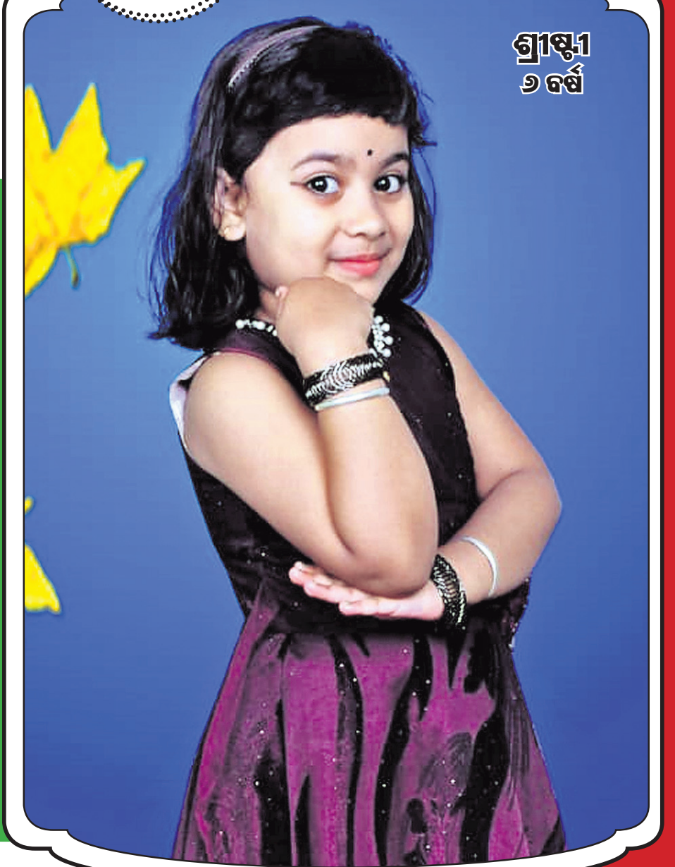
ଗ୍ରୀଷ୍ମୀ ୬ ବର୍ଷ

—ଅଧ୍ୟାପକ ଶରତ କୁମାର ଦାସ ବତବିଲ ମହାବିଦ୍ୟାଳୟ, ବତବିଲ, କେନ୍ଦୁଝର