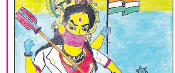
ରାଧେଶା ବିଶ୍ୱାଳ କ୍ଲାସ-୨, ସାଉଥ ପଏଣ୍ଟ ସ୍କୁଲ, କୋଲକାତା -୧୯