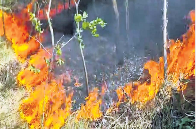
ବନୀକରଣ ସ୍ଥାନରେ ଭୟଙ୍କର ନିଆଁ।

ଗ୍ରାମବାସୀଙ୍କଠାରୁ ଖବରପାଇ ବିଭାଗୀୟ କର୍ମଚାରୀ ଏବଂ ଅଗ୍ନିଶମ କର୍ମଚାରୀ ପହଞ୍ଚି ନିଆଁ ଲିଭାଇବା ଉଦ୍ୟମ କରିଥିଲେ ମଧ୍ୟ ଆୟତ୍ତ କରିପାରି ନ ଥିଲେ। ମୋଟ ୧୫ ହେକ୍ଟର ଜାଗାରେ ୧୦୧୮-୧୯ ମସିହାରେ ଓଡ଼ିଶା ଫରେଷ୍ଟ ଡେଭଲପମେଣ୍ଟ କୋର୍ପୋରେଶନ ଦଶ ହଜାର ଗଛ ପୋଡ଼ି ଯାଇଥିବା ଜଣାପଡ଼ିଛି। ଅଗ୍ନିକାଣ୍ଡର କାରଣ ଜଣାପଡ଼ି ନ ଥିବାବେଳେ କେହି ଦୁର୍ଭିକ୍ଷ ନିଆଁ ଲଗାଇ ଦେଇଥିବା ଅନୁମାନ କରାଯାଇଛି। ଘଟଣାରୁ ଜଣାପଡ଼ିଛି, ବନୀକରଣ ସ୍ଥାନରେ ନିଆଁ ଲାଗିଥିବା