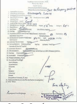
ନକଲି କୋଭିଡ୍ ରିପୋର୍ଟ।

ମାତ୍ର ୩୦ ଟଙ୍କା ବିନିମୟରେ ମିଳୁଛି କୋଭିଡ୍ ରିପୋର୍ଟ। ପାରାଦୀପ ଅଭିଯୋଗପୁର ଥାନାଠାରୁ ମାତ୍ର ୨୦୦ ମିଟର ଦୂରରେ ଥିବା ଏକ କେରକ୍ ଦୋକାନରୁ ଏହି ରିପୋର୍ଟ ଦିଆଯାଇଥିଲା। ପାରାଦୀପ ଗୋଷ୍ଠୀ ସ୍ୱାସ୍ଥ୍ୟକେନ୍ଦ୍ର ପକ୍ଷରୁ ଶୁକ୍ରବାର ଏନେଇ ଖୋଜାତ କରାଯାଇଛି। ଖବରପାଇ ପୋଲିସ ସେଠାରେ ପହଞ୍ଚି ଦୋକାନରୁ ୩ ଜଣଙ୍କୁ ଡ଼ାକି ଆଣି ପଚରାଉଚୁରା କରୁଛି। ମିଳୁଥିବା ସୂଚନା ଅନୁଯାୟୀ, ପାରାଦୀପ ଟେକ ବିଶ୍ୱାଧିକାରୀ ପ୍ରକଳ୍ପରେ କାର୍ଯ୍ୟରତ ଶ୍ରମିକ ଓ କର୍ମଚାରୀଙ୍କ ପ୍ରବେଶ ପାଇଁ କୋଭିଡ୍ ନେଗେଟିଭ ରିପୋର୍ଟ ଅପରିହାର୍ଯ୍ୟ କରାଯାଇଛି। ନେଗେଟିଭ ଯାଇ କୋଭିଡ୍ ଟେଷ୍ଟ ରିପୋର୍ଟ ଆଣିବା ସମୟସାପେକ୍ଷ ହେଉଥିଲା। ଏହାର ସୁଯୋଗ ନେଇ ଅଭିଯୋଗ କେରକ୍