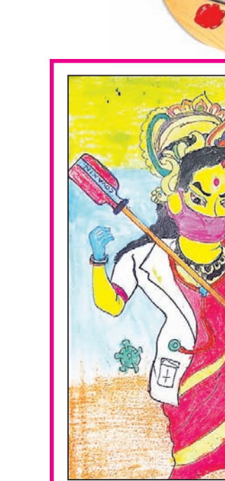
ଶୋଖର କୁମାର ସାଲ୍ କ୍ଲାସ-୫, ଏସପିଏ ମେଡିକାଲ ପବ୍ଲିକ୍ ସ୍କୁଲ, କଟକ