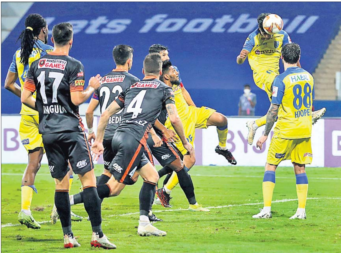
କେରଳ ଟ୍ଵେଣ୍ଟି୨୦ ଓ ଏସ୍‌ଏସ୍ ଗୋଆ ମଧ୍ୟରେ ଅନୁଷ୍ଠିତ ମ୍ୟାଚ୍‌ରେ ଏକ ସଂଘର୍ଷପୂର୍ଣ୍ଣ ମୁହୂର୍ତ୍ତ।