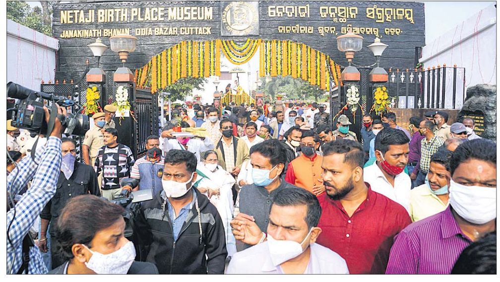
ନେତାଜୀ ଜନ୍ମସ୍ଥାନ ସଂଗ୍ରହାଳୟ ପରିସରରେ ଲୋକଙ୍କ ରହଇ।