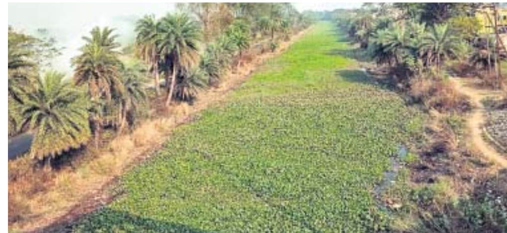
କେନାଲରେ ଭର୍ତ୍ତି ହୋଇଥିବା ବିଳାତି ଦଳ ।

କେନ୍ଦ୍ରାପଡ଼ା ଜିଲ୍ଲା ସର୍ବୋତ୍ତମ ଅନୁପାୟା ମଧ୍ୟମ ଓ ବୃହତ୍ ଶିଳ୍ପ ସଂଖ୍ୟା ଶୂନ । ଜିଲ୍ଲାର ଅର୍ଥନୀତି ୭୯ ପ୍ରତିଶତ ଚାଷ ଦ୍ୱାରା ପରିଚାଳିତ । ଜିଲ୍ଲାର ୭ ନଦୀ ଓ ୨୭ ଶାଖା ନାଳ ଅଛି । ଏଥିସହିତ ବାର୍ଷିକ ହାରାହାରି ୭୧ ଦିନ ବର୍ଷା ସହିତ ୧୩୪୦ ମିଲିମିଟର ବୃଷ୍ଟିପାତ ହେଉଛି । ସେହିପରି ୧, ୮୨, ୧୮୪ ହେକ୍ଟର ଚାଷ ଜମି ଅଛି । ଏସବୁ ସତ୍ତ୍ୱେ ଭିଡିଭୁମି ଆଭାବ ଦର୍ଶାଇ ଚାଷୀ ଚାଷ ଛାଡୁଛନ୍ତି । ଅର୍ଦ୍ଧଧିକ ଜମି ଜଳସେଚନକୁ ବଞ୍ଚିତ ହୋଇଛି । ପାଣି ପଞ୍ଚାୟତ ଗଠନ ଓ ପରିଚାଳନାଗତ ତ୍ରୁଟି ଚାଷୀଙ୍କ ସମସ୍ୟାକୁ ଦୂରୀକୃତ କରିଛି । କୃଷକଙ୍କ ପ୍ରକୃତ ସମସ୍ୟା ପ୍ରତି ଅଣଦେଖା କରାଯାଉଥିବା ଅଭିଯୋଗ ହେଉଛି ।