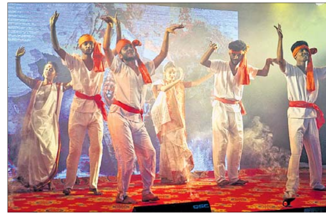
ମହାରାଷ୍ଟ୍ର କଳାକାରଙ୍କ ଦ୍ୱାରା ପରିବେଷିତ ସଂସ୍କୃତିକ କାର୍ଯ୍ୟକ୍ରମ।