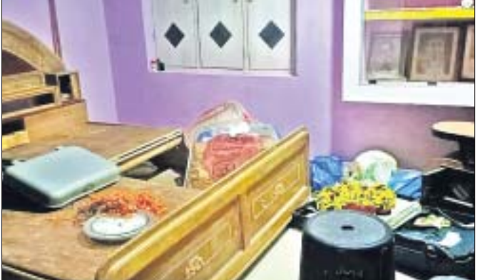
ଡକାୟତି ପରେ ଘରେ ଆସବାବପତ୍ର ଲତସ୍ତର ହୋଇ ପଡ଼ିଛି ।