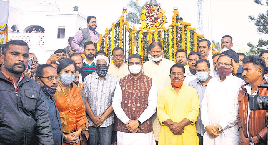
ନେତାଜୀ ଜନ୍ମସ୍ଥାନ ସଂଗ୍ରହାଳୟ ପରିସରରେ ଥିବା ତାଙ୍କ ପ୍ରତିମୂର୍ତ୍ତିରେ ମାଲ୍ୟାର୍ପଣ ପରେ ଉପସ୍ଥିତ କେନ୍ଦ୍ରମନ୍ତ୍ରୀ ଧର୍ମେନ୍ଦ୍ର ପ୍ରଧାନ ଓ ଭାବପା ନେତୃବୃନ୍ଦ। ନେତାଜୀଙ୍କ ପ୍ରତିମୂର୍ତ୍ତିରେ ମାଲ୍ୟାର୍ପଣ ପରେ ଉପସ୍ଥିତ ବିଧାୟକ ଓ କଂଗ୍ରେସ ନେତୃବୃନ୍ଦ। ନେତାଜୀ ସଂଗ୍ରହାଳୟ ପରିସରରେ ଆୟୋଜିତ ଚିତ୍ରକଳା ପ୍ରଦର୍ଶନୀ।