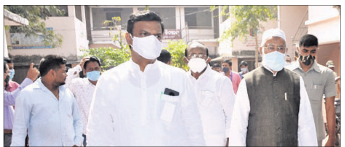
ଆନ୍ଧ୍ର ବିଧାନ ପରିଷଦ ଅଧ୍ୟକ୍ଷ ଓ ପ୍ରତିନିଧି ଦଳ ହାଇସ୍କୁଲ ପରିଦର୍ଶନ କରୁଛନ୍ତି