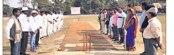
ଅତିଥିଙ୍କ ଦ୍ଵାରା ଖେଳ ଉଦ୍‌ଘାଟନ କରାଯାଇଛି।

ଖଇରା, ୨୩।୧ (ଡି.ଏନ.ଏ.): ବାଲେଶ୍ଵର ଜିଲ୍ଲା ଖଇରା କ୍ଲବ୍ ଅଧୀନ ପରିଚାଳିତ ମିନିଷ୍ଟ୍ରିୟମରେ ଶନିବାର ବିଗତ ଚତୁର୍ଦ୍ଦଶତମ ମେମୋରିଆଲ ଆନ୍ଧ୍ର ଲିଗ୍ କ୍ରିକେଟ ଟୁର୍ନାମେଣ୍ଟ ଉଦ୍‌ଘାଟିତ ହୋଇଯାଇଛି। ପ୍ରଥମ ଦିବସରେ କଟକର ଆରସି ଯଜ୍ଞଶ୍ଵର ଭଦ୍ରକର ଭଦ୍ରକ ଷ୍ଟାଡିୟମରେ ଖେଳାଯାଇଥିଲା। ପ୍ରଥମେ ବ୍ୟାଟିଂ କରି ଭଦ୍ରକ ୨୦ ଓଭରରେ ୨୪୨ ରନ୍ ସଂଗ୍ରହ କରିଥିଲା। ଜବାବରେ କଟକ ୧୬ ଓଭରରେ ୬ ଉଇକେଟ ବିନମୟରେ ଆବଶ୍ୟକ ରନ୍ କରି ବିଜୟୀ