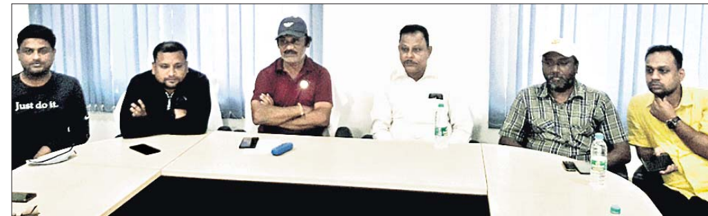
ଖବରଦାତା ସମ୍ପର୍କରେ ଟୁର୍ନାମେଣ୍ଟ ଆୟୋଜକ କମିଟିର ସଦସ୍ୟମାନେ।