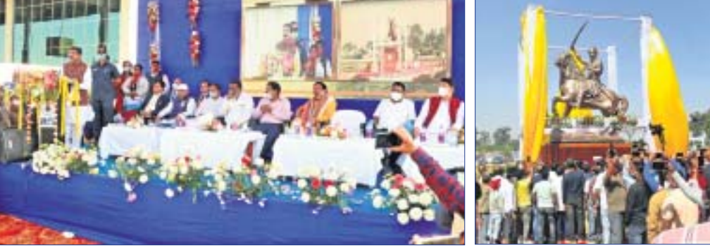
ପ୍ରତିମୂର୍ତ୍ତି ଉନ୍ମୋଚନ କାର୍ଯ୍ୟକ୍ରମରେ ମହାସାଧନ ଅତିଥିବୃନ୍ଦ ଏବଂ ସାଧାରଣ ସଂଗ୍ରାମୀ ବୀର ସୁରେନ୍ଦ୍ର ସାଏଙ୍କ ୧୪୪୯୯ ଉଚ୍ଚର ଗ୍ରୋଷ୍ଟା ମୂର୍ତ୍ତି ।