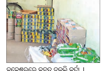
ଜଳେଶ୍ୱରରେ ଜବତ ନକଲି ଜର୍ଦ୍ଦା

କଟକ, ଭୁବନେଶ୍ୱରରେ ବିଭିନ୍ନ ନକଲି ମସଲା ଓ ଖାଦ୍ୟ ସାମଗ୍ରୀର କାରଖାନା ଠାବ ହେବା ପରେ ଏବେ ବାଲେଶ୍ୱର ଓ ଭଦ୍ରକରେ ବିପୁଳ ପରିମାଣର ନକଲି ଜର୍ଦ୍ଦା ଜବତ ହୋଇଛି। ଶନିବାର ଏସ୍.ଏଫ୍ ଏବଂ ବାଲେଶ୍ୱର ଜିଲ୍ଲା ଜଳେଶ୍ୱର ଅଞ୍ଚଳରେ ଚଢ଼ାଉ କରି ୨ କୁଇଣ୍ଟାଲ ଓଜନର ବିଭିନ୍ନ ବ୍ରାଣ୍ଡର ନକଲି ଜର୍ଦ୍ଦା ଜବତ କରିବା ସହ ୨ଜଣଙ୍କୁ ଅଟକ ରଖି ପଚରାଉଚରା କରୁଛି। ସେହିପରି ଭଦ୍ରକ ପୁରୁଣାବନ୍ଦର ଥାନା ପୋଲିସ୍ ଗୁଚ୍ଚବାର ବିଳମ୍ବିତ ରାତିରେ