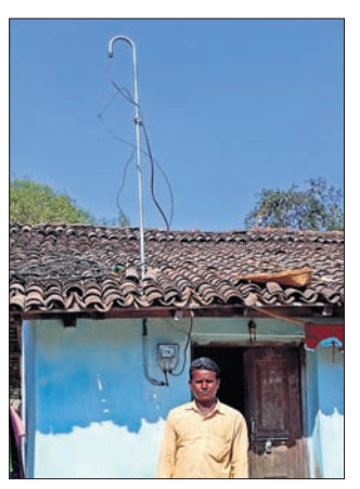
ବିଦ୍ୟୁତ୍ ସଂଯୋଗ ଅପେକ୍ଷାରେ ବାହାଦୁରପଦର ଗ୍ରାମର ଜଣେ ହିତାଧିକାରୀ ।

କଳାହାଣ୍ଡି ଜିଲ୍ଲା କେସିଙ୍ଗା ବ୍ଲକ ପଞ୍ଚାୟତ ଗ୍ରାମପଞ୍ଚାୟତ ବାହାଦୁରପଦର ଗ୍ରାମର ଗରିବ ହିତାଧିକାରୀମାନେ ବିଦ୍ୟୁତ୍ ଆଲୋଚନା ପାଇବାକୁ ବଞ୍ଚିତ ହୋଇ ଅନ୍ଧାରରେ ଜୀବନ କାଟୁଛନ୍ତି ।