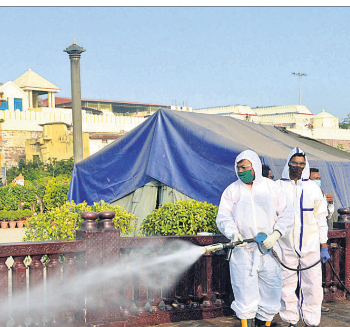
ଶ୍ରୀମନ୍ଦିର ସମ୍ମୁଖ ସ୍ଥାନକୁ ବିଶୋଧନ କରାଯାଇଛି।

See Career Appointment on every Wednesday & Saturday