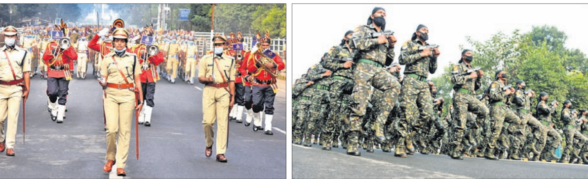
ରାଜ୍ୟସ୍ତରୀୟ ସାଧାରଣତନ୍ତ୍ର ଦିବସ ପାଇଁ ଭୁବନେଶ୍ଵର ଗାନ୍ଧୀ ମାର୍ଗରେ ରବିବାର ଅନୁଷ୍ଠିତ ପୂର୍ଣ୍ଣ ତ୍ରେସ୍ ଅଭ୍ୟାସ ପରେଟି।

ଭୁବନେଶ୍ଵର, ୨୪।୧ (ବୁଧବାର) ସ୍ଵାଧୀନତା ସଂଗ୍ରାମୀ ଖୋର୍ଦ୍ଧାର ବକ୍ସି ଜଗବନ୍ଧୁ ବିଦ୍ୟାଧର ମହାପାତ୍ରଙ୍କ ବକ୍ସି ତ୍ୟାଗ, ଅପୂର୍ବ ସାହାଯ୍ୟ, ବୀରତ୍ଵ ଓ ଆତ୍ମୋତ୍ସର୍ଗ ଓଡ଼ିଶା ଇତିହାସରେ ଏକ ଗୌରବୋଦ୍ଧକ ଅଧ୍ୟାୟ।