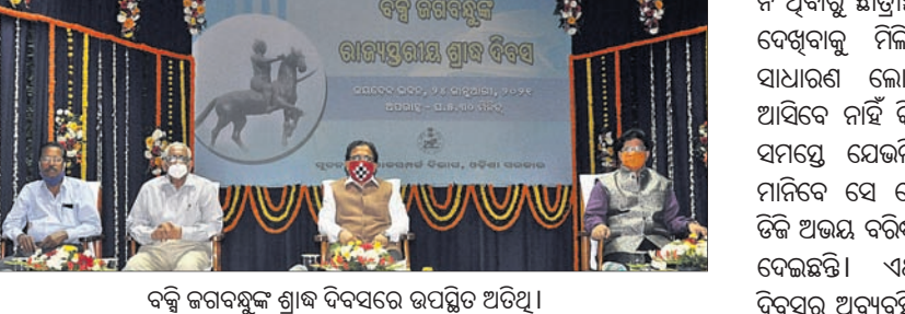
ବକ୍ସି ଜଗବନ୍ଧୁଙ୍କ ଶ୍ରୀକ୍ଷ ବଦଳରେ ଉପସ୍ଥିତ ଅତିଥି।