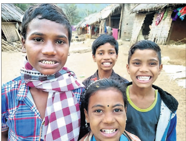
ପିଲାଙ୍କ ଦାନ୍ତ ଫ୍ଲୋରୋସିସ୍ ଯୋଗୁ ପିଲ କସରା ରଙ୍ଗ ହୋଇଯାଇଛି ।

ନୟାଗଡ଼ ଜିଲ୍ଲା ଦକ୍ଷିଣକୁ ବୁଲି ଭୋଗବାଡି ପଞ୍ଚାୟତ ପୁରୁବାରୀ ଗାଁର ଦକ୍ଷିଣ ଲୋକେ ବିକଳ ନ ଥିବାରୁ ଫ୍ଲୋରୋସିସ୍ ସୂଚକ ପାଣି ପିଇ ଦନ୍ତ ଓ ଅସ୍ଥି ଫ୍ଲୋରୋସିସ୍ ରୋଗରେ ଆକ୍ରାନ୍ତ ହେଉଛନ୍ତି ।