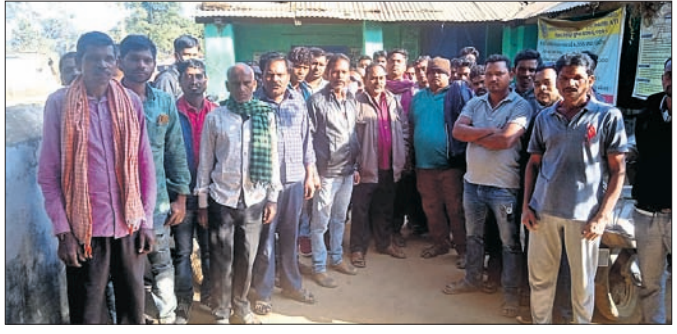
ଉଦ୍ଧାରଣ ଚାଷୀ ପ୍ୟାକ୍ଟରେ ତାଲା ପକାଇଛନ୍ତି । କି.ଗ୍ରା. ନେତୃତ୍ଵରେ ଅଭିଯୋଗ ହେଉଛି ।

ଆଜକୁ ପ୍ରାୟ ୨୦ ଦିନରୁ ଉର୍ଦ୍ଧ୍ଵ ହେବ ସଦର ବ୍ଲକ ପରକୋଟ ଅଧୀନ ୪ଟି ମଣ୍ଡିରୁ ଧାନ ଉଠା ନ ଯିବାରୁ ଉଦ୍ଧାରଣ ଚାଷୀ ପରକୋଟ ପ୍ୟାକ୍ଟରେ ତାଲା ପକାଇଛନ୍ତି ।