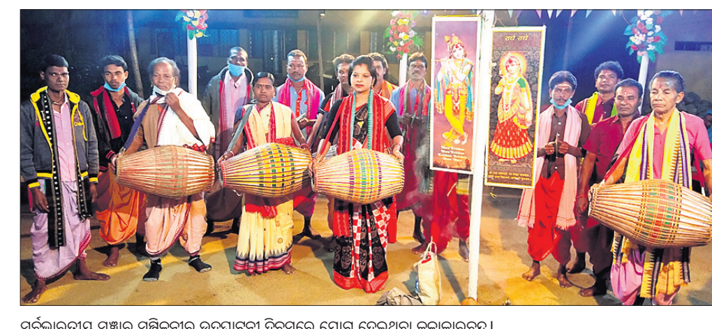
ସର୍ବଭାରତୀୟ ସଞ୍ଚାର ସମ୍ମିଳନୀରେ ମତ ଦେଇଥିବା ସଞ୍ଚାରୀମାନେ ।

ସଞ୍ଚାର ଏକ ପ୍ରାଚୀନ ଲୋକକଳା । ବୃହତ୍ ମୁକ୍ତାକାଶ ରଙ୍ଗମଞ୍ଚ ବରଗଡ଼ ଧନୁଯାତ୍ରା ମହୋତ୍ସବର ଏହା ମୂଳ ଅଙ୍ଗ ।