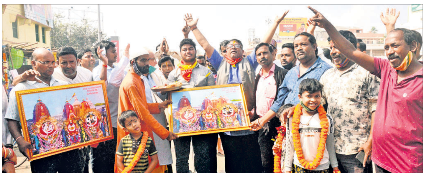
୨୦୨୦ ରଥଯାତ୍ରା ଆୟୋଜନକୁ ଅନୁମତି ଦେବା ପାଇଁ ସୁପ୍ରିମକୋର୍ଟରେ ଲଢ଼ାଇଥିବା ଲୋକମାନଙ୍କର ଉପସ୍ଥାପନା ସମୟରେ ଉପସ୍ଥିତ ଲୋକମାନଙ୍କର ଫୋଟୋ।