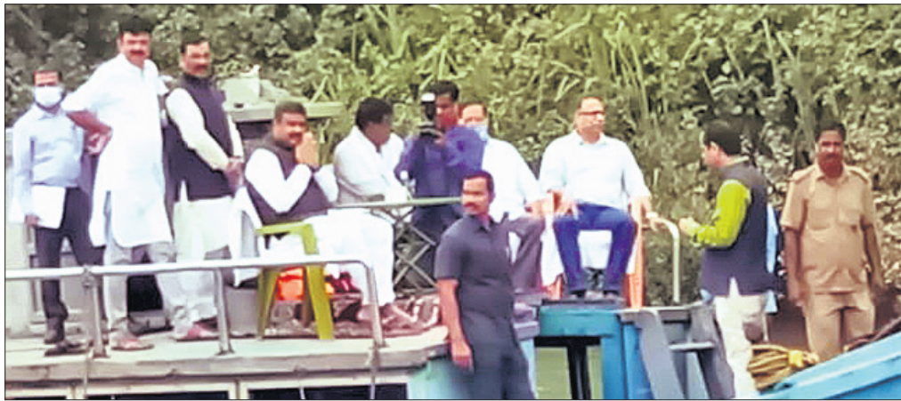
ବୋର୍ଡର ଭିତରକନିକା ବୁଲୁଛନ୍ତି କେନ୍ଦ୍ରମନ୍ତ୍ରୀ ଧର୍ମେନ୍ଦ୍ର ପ୍ରଧାନ ଓ ଅନ୍ୟମାନେ ।

କେନ୍ଦ୍ରାପଡ଼ା ଅଧିକ/ରାଜନଗର/ ପଞ୍ଚମୁଖାଳ, ୨୫୧୧ (ଡି.ଏନ.ଏ.)