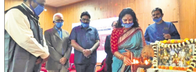
ଉପନଗର ସରକାରୀ ହାଇସ୍କୁଲ ଅତିଚୋରିଘନରେ କନ୍ୟାକିରଣ କାର୍ଯ୍ୟକ୍ରମରେ ଉପସ୍ଥିତ ଅତିଥି