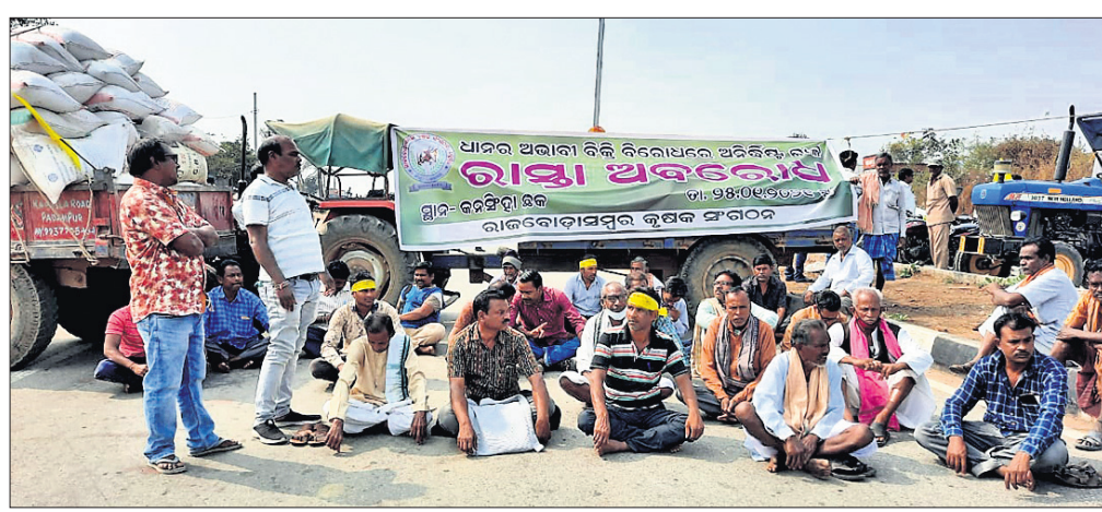
ରାସ୍ତାରେ ଆନ୍ଦୋଳନର ଚାଷୀ।

ମଣ୍ଡି ଗୁଡ଼ିକୁ ବନ୍ଦ କରି ଦିଆଯାଇଛି। ଅନ୍ୟପକ୍ଷେ ଚାଷୀଙ୍କୁ ମିଳିଥିବା ଟୋକନ ଅବଧି ମଧ୍ୟ ସରିଗଲାଣି। ଫଳରେ ଚାଷୀମାନେ ଧାନ ବିକ୍ରି କରି ନ ପାରି ବହୁ ଅସୁବିଧାର ସମ୍ମୁଖୀନ ହେଉଛନ୍ତି। ଏହାର ପ୍ରତିବାଦରେ ସେମାନେ ଆନ୍ଦୋଳନମୁହାଁ ହୋଇଛନ୍ତି। ସୋମବାର ରାଜବୋଡ଼ାସର କୃଷକ ସଙ୍ଗଠନ ନେତୃତ୍ୱରେ ଚାଷୀମାନେ କନସିଂହା ଛକରେ ଧାନ ବୋହେଇ ଟ୍ରାକ୍ଟର ରଖି ପତ୍ତୁପୁର- ସୋହେଲା ରାସ୍ତା ଅବରୋଧ କରିଥିଲେ। ଚାଷୀଙ୍କ ପାଖରେ ରହିଥିବା