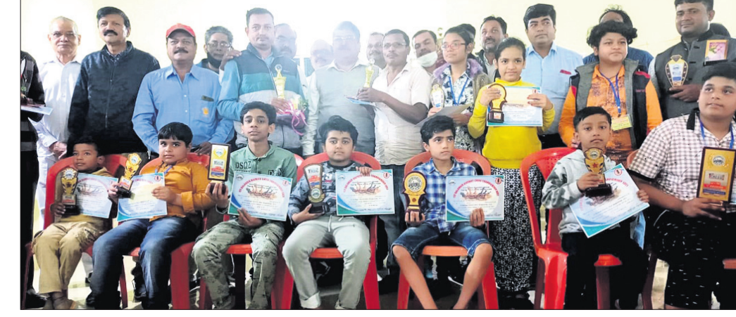
ଚେସ୍ ଚାମ୍ପିୟନଶିପ୍‌ରେ ଭାଗ ନେଇଥିବା ଖେଳାଳି ।