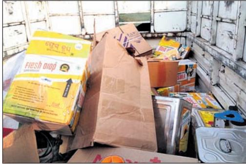
ଜବତ ହୋଇଥିବା ତେଲ।

ପୋଲିସ୍ ଓ ଖାଦ୍ୟ ଅଧିକାରୀଙ୍କ ପକ୍ଷରୁ ଚଢ଼ାଉ। ଭାବେ ଚଢ଼ାଉ କରିଥିଲେ। ଏହି ସମୟରେ କମ୍ପାନୀ ଭିତର ସଫା ନ ଥିବା ଏବଂ ତେଲ ରହିଥିବା ଷ୍ଟକ ଗ୍ଲାନରେ କଳଙ୍କ ଓ ପୋକ ଥିବା ଦେଖିବାକୁ ପାଇଥିଲେ। ଯାହାକୁ ନେଇ ଖାଦ୍ୟ ପୁରସ୍କା ଅଧିକାରୀ ଦିଲ୍ଲୀ ପାଠୀ ସମ୍ପୃକ୍ତ କମ୍ପାନୀ ମାଲିକଙ୍କୁ ଚାରିଦିନ କରିଥିଲେ। ଯେଉଁ ମେଶିନରୁ ତିଆରି ହେଉଥିବା ପାଇଁ ସ୍ୱତନ୍ତ୍ର ଘର କରିବାକୁ ନିର୍ଦ୍ଦେଶ ଦେଇଥିଲେ। କମ୍ପାନୀ ଲାଇସେନ୍ସ ନାହିଁ ୨୦୨୧ ଯାଏଁ ସ୍ୱୀକୃତି ରହିଥିବା ଖାଦ୍ୟ ପୁରସ୍କା ଅଧିକାରୀ କହିଛନ୍ତି। ସାମ୍ପଲ ନେଇଛନ୍ତି, ଭୁବନେଶ୍ୱର ଲାବ୍ ପଠାଯିବ। ରିପୋର୍ଟ ଆସିଲେ କାର୍ଯ୍ୟାନୁଷ୍ଠାନ ଗ୍ରହଣ କରାଯିବ ବୋଲି ପାଠୀ