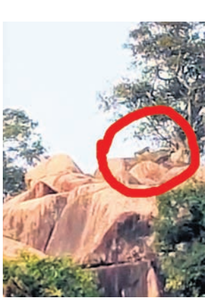
ହଳଦିଗାଁ ପାହାଡ଼ ଶୀର୍ଷ ସାରଦା ଦେବୀ ମନ୍ଦିର ଚଟାଣ ଉପରେ ରହିଥିବା ବାଘ ।

ନୂଆପଡ଼ା ଜିଲ୍ଲାରେ ଗତ କିଛି ଦିନ ହେଲା ବାଘ ଆକ୍ରମଣ ବୋଧହୋଇଥିବାରୁ ଲୋକେ ଭୟଭୀତ ହୋଇ ବଣପାହାଡ଼ କିମ୍ବା ଜମିବାଡ଼ିକୁ ଯାଉଛନ୍ତି। ଏବେ ପୁଣି ଥରେ ରବିବାର ରାତି ଏବଂ ସୋମବାର ଦିନରେ ଖରିଆର ରୋଡ଼ ବନାଞ୍ଚଳ ହଳଦିଗାଁରେ ୪ଟି କଲରାପତରିଆ ବାଘ ରୁହୁଥିବା ଦେଖି ଗାଁ ଲୋକେ ଭୟରେ ବାହାରକୁ ବାହାରୁ ନାହାନ୍ତି। ପାହାଡ଼ ତଳିଆ ଗାଁ ହୋଇଥିବାରୁ ଦିନରେ ବିବାସ ଗାଁ ଭିତରକୁ ପଶିଆସୁଛି। ସୁନାବେତା ଅଭୟାଶ୍ୟ ଗୋଡ଼ା ପାହାଡ଼କୁ ଲାଗି ହଳଦି ଜଙ୍ଗଲ ରହିଥିବା ଯୋଗୁ ବାଘର ଆକ୍ରମଣ ପାଇଁ ଯାଇଛି। ପାହାଡ଼ ଶୀର୍ଷରେ ସାରଦା ଦେବୀ ମନ୍ଦିର ରହିଛି। ସେ ପାଖରେ ଥିବା ବଡ଼ ଚଟାଣ