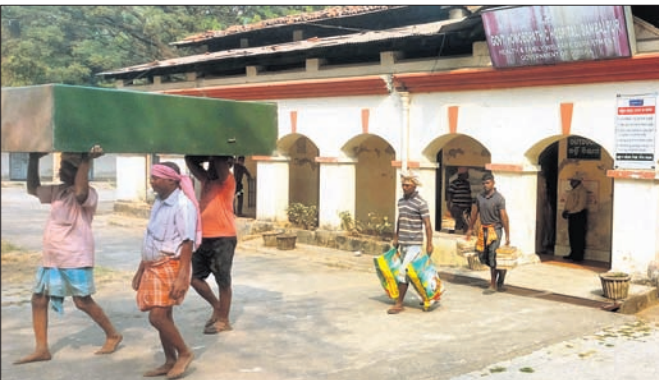
ସମ୍ବଲପୁର ହୋମିଓପାଥ୍ ଡାକ୍ତରଖାନାକୁ ସାମଗ୍ରୀ ସ୍ଥାନାନ୍ତର କରାଯାଇଛି।

ବନ୍ଧୁ ବିବାଦ ପରେ ଶେଷରେ ସମ୍ବଲପୁର ମହାନଗର ନିଗମର ଶ୍ରୀଅରବିନ୍ଦ ସ୍କୁଲ ନିକଟରେ ଥିବା ହୋମିଓପାଥ୍ ଡାକ୍ତରଖାନା ସୋମବାର ସ୍ଥାନାନ୍ତର ହୋଇଛି। ମାଟିପାଲିଠାରେ ଥିବା ଓଡ଼ିଶା ମେଡିକାଲ କଲେଜ ଅଫ୍ ହୋମିଓପାଥ୍ ରିସର୍ଚ୍ଚ ସେଣ୍ଟର ପରିସରକୁ ଏହା ଉଠାଇ ନିଆଯାଇଛି। ପୁରୁଣା ମେଡିକାଲ ସମସ୍ତ ସାମଗ୍ରୀ ମଧ୍ୟ ପରିବହନ କରାଯାଇଛି।