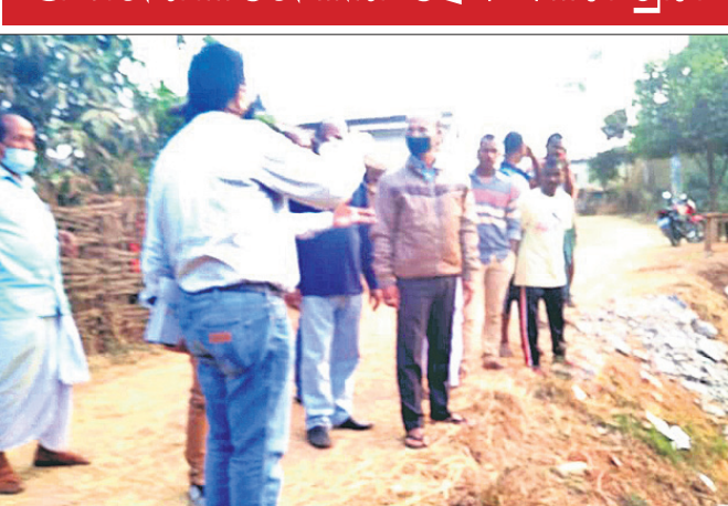
ସ୍ଥିତି ଅନୁଧ୍ୟାନ କରିବା ଅବସରରେ ବିଭାଗୀୟ ଅଧିକାରୀ ଓ ଅନ୍ୟମାନେ।