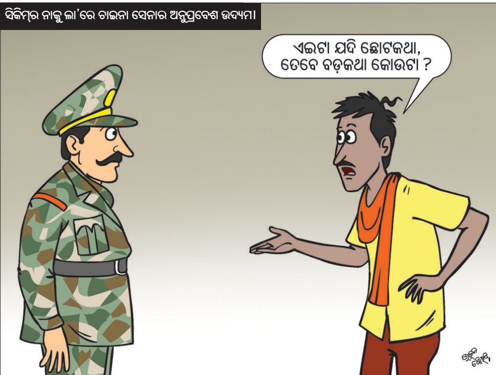
ସିକିମ୍ ନାକୁ ଲା'ରେ ଚାଇନା ସେନାର ଅନୁପ୍ରବେଶ ଉଦ୍ୟମ।