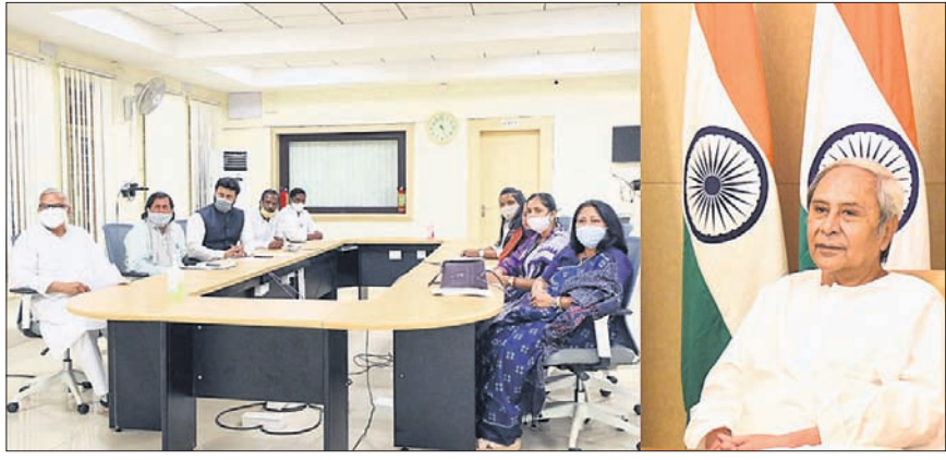
ଭିଡିଓ କନ୍ଫରେନ୍ସରେ ଦକାୟ ଏମ୍ପିମାନଙ୍କ ସହ ମୁଖ୍ୟମନ୍ତ୍ରୀ ନବୀନ ପଟ୍ଟନାୟକଙ୍କ ଆଲୋଚନା।