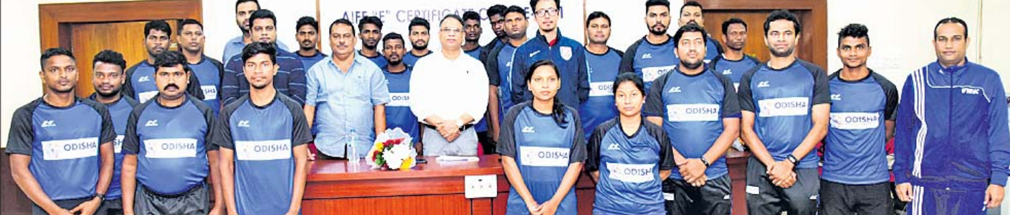
କଳିଙ୍ଗ ଷ୍ଟାଡ଼ିୟମରେ ଏଆଇଏଏଏଫ୍ ଇ-ସାର୍ଟିଫିକେଟ କୋର୍ସ ଆରମ୍ଭ ଅବସରରେ ଅଂଶଗ୍ରହଣକାରୀଙ୍କ ସହ ଅତିଥିମାନେ।

ଭୁବନେଶ୍ୱର, ୨୭।୧(ବ୍ରାହ୍ମା ପ୍ରତିନିଧି) ରାଜ୍ୟରେ ଫୁଟବଲର ବିକାଶ ପାଇଁ ସରକାରଙ୍କ ପକ୍ଷରୁ ଆଉ ଏକ ପଦକ୍ଷେପ ନିଆ ଯାଇଛି। ସର୍ବଭାରତୀୟ ଫୁଟବଲ ସେଡେରେଶନ (ଏଆଇଏଏଏଫ୍), ରାଜ୍ୟ ସରକାରଙ୍କ କ୍ରୀଡ଼ା ବିଭାଗ ଏବଂ ଫୁଟବଲ ଆସୋସିଏଶନ ଅଫ୍ ଓଡ଼ିଶା (ଫାଓ) ଆନୁକୂଲ୍ୟରେ ଇ-ସାର୍ଟିଫିକେଟ କୋର୍ସ ରୂପରେ ଆରମ୍ଭ ହୋଇଛି। ଗୁଣାମୂଳ ଗ୍ରାମରୁ ଫୁଟବଲକୁ ଉଦ୍ଧାରରେ ପହଞ୍ଚାଇବା ଏହାର ମୁଖ୍ୟ ଲକ୍ଷ୍ୟ। ଏହି କୋର୍ସରେ ଏହା ପୂର୍ଣ୍ଣ ସମୟରେ ଧରି ଚାଲିବ। ପ୍ରତି ବ୍ୟାଚ୍ରେ ୨୪ ଜଣ ଲେଖାଏ ଅଂଶଗ୍ରହଣକାରୀ ରହିବେ। ରାଜ୍ୟର