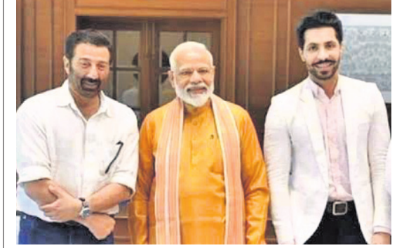
ଦୀପ ସିଞ୍ଚୁ (ବାହାରି)ଙ୍କ ସହ ଗୁରୁଦାସପୁର ଏମ୍ପି ସନ୍ଦିଦେଓଲ ଓ ପ୍ରଧାନମନ୍ତ୍ରୀ ନରେନ୍ଦ୍ର ମୋଦି ଏହି ଫଟୋକୁ ବନ୍ଧିଛନ୍ତି । ପ୍ରଶାନ୍ତ କୁମାର ଗୁରୁଦ୍ଧର କରୁଛନ୍ତି ।