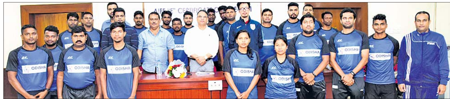
କଳିଙ୍ଗ ଷ୍ଟାଡ଼ିୟମରେ ଏଆଇଏଫଏଫ୍ ଇ-ସାର୍ଟିଫିକେଟ କୋର୍ସ ଆରମ୍ଭ ଅବସରରେ ଅଂଶଗ୍ରହଣକାରୀଙ୍କ ସହ ଅତିଥିମାନେ।

ଭୁବନେଶ୍ୱର, ୨୭।୧(ବ୍ରାହ୍ମା ପ୍ରତିନିଧି) ରାଜ୍ୟରେ ଫୁଟବଲର ବିକାଶ ପାଇଁ ସରକାରଙ୍କ ପକ୍ଷରୁ ଆଉ ଏକ ପଦକ୍ଷେପ ନିଆ ଯାଇଛି। ସର୍ବଭାରତୀୟ ଫୁଟବଲ ଫେଡେରେଶନ (ଏଆଇଏଫଏଫ୍), ରାଜ୍ୟ ସରକାରଙ୍କ କ୍ରୀଡ଼ା ବିଭାଗ ଏବଂ ଫୁଟବଲ ଆସୋସିଏଶନ ଅଫ ଓଡ଼ିଶା (ଫାଓ) ଆନୁକୂଲ୍ୟରେ ଇ-ସାର୍ଟିଫିକେଟ କୋର୍ସ ରୁପରେ ଆରମ୍ଭ ହୋଇଛି। ଗୁଣାମୂଳ ଗ୍ରାମରୁ ଫୁଟବଲକୁ ଉଚ୍ଚତରରେ ପହଞ୍ଚାଇବା ଏହାର ମୁଖ୍ୟ ଲକ୍ଷ୍ୟ। ଏହି କୋର୍ସରେ ୨୪ ଜଣ ଲେଖାଏ ଅଂଶଗ୍ରହଣକାରୀ ରହିବେ। ରାଜ୍ୟର