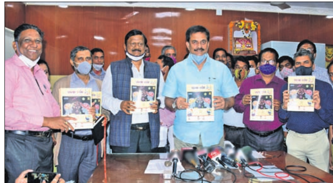
ରାଜ୍ୟର ମାତ୍ରିକ ପରୀକ୍ଷାର୍ଥୀଙ୍କ ପାଇଁ ପ୍ରସ୍ତୁତ ପୁସ୍ତିକା ‘ପରୀକ୍ଷା ଦର୍ପଣ’ ଉନ୍ମୋଚନ କରୁଛନ୍ତି।

ମାତ୍ରିକ ପରୀକ୍ଷାର୍ଥୀଙ୍କ ପାଇଁ ପ୍ରସ୍ତୁତ ପୁସ୍ତିକା ‘ପରୀକ୍ଷା ଦର୍ପଣ’ ରୁଧିର ଭଣ୍ଡାରରେ ଉନ୍ମୋଚିତ ହୋଇଛି।