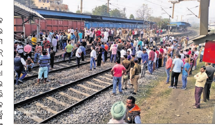
ବ୍ରଜରାଜନଗର ଷ୍ଟେଶନରେ ରେଳରୋକ୍ଷେ କରିଥିବା ନାଗରିକ କମିଟି ସଦସ୍ୟ।