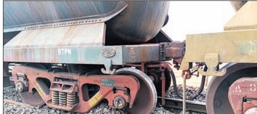
ପୁନିଗୁଡ଼ାରେ ଲାଇନରୁ ହୋଇଥିବା ଟ୍ରେନ୍ ।

କେନ୍ଦ୍ର, ୨୮/୧ (ସ.ପ୍ର./ଡି.ଏନ୍.ଏ.)- କେନ୍ଦ୍ରର ଚଳାଣି ଲାଇନରୁ ପୁନିଗୁଡ଼ା ଅପରାହ୍ଣ ୨ଟା ବେଳେ ଲୁହାପଥର ବୋର୍ଡେଇ ଟ୍ରେନ୍ ଲାଇନରୁ ହୋଇଛି । ଟ୍ରେନ୍ କୁ ଚଳାଣି ପାଇବା ପାଇଁ କେଉଁ କାରଣରୁ ଲାଇନରୁ ହୋଇଛି ତାହା ଜଣାପଡ଼ିନାହିଁ । ଏହାର ତଦ୍ୱାରା ରେଳବାଇ ପକ୍ଷରୁ କରାଯାଇଛି । ଉକ୍ତ ଲାଇନରେ ରେଳ ଚଳାଣି ବ୍ୟାହତ ହୋଇଛି । ଏଥିରେ କୌଣସି କ୍ଷତି ହୋଇ ନ ଥିବା ସୂଚନା ମିଳିଛି ।