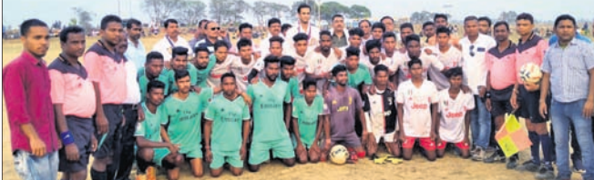
ଅତିଥିକ ସହ ପାଇନାଲ ମ୍ୟାଚ ଖେଳିଥିବା ଉଭୟ ଦଳର ଖେଳାଳିମାନେ।