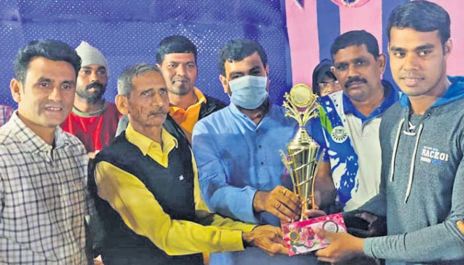
ଗାମ୍ପିୟନ ଦଳର ଖେଳାଳିମାନେ ଅଭିଭୂକ୍ତ ପୁରସ୍କାର ଗ୍ରହଣ କରୁଛନ୍ତି।