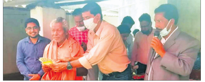
ଜଣେ ହିତାଧିକାରୀକୁ ଭଲ ବନ୍ଧନ କରାଯାଇଛି।