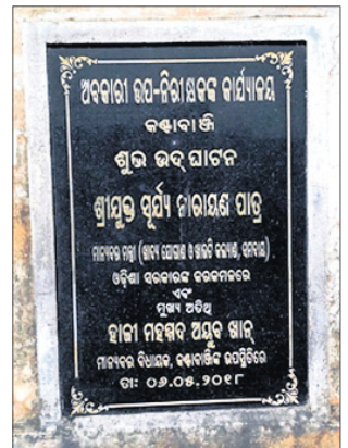
ଅବକାରୀ କାର୍ଯ୍ୟାଳୟ(ବାମ)। ଉଦ୍‌ଘାଟନା ଫଳକ।

କାମରେ ନ ଲାଗିବାରୁ କୋଠାର କେତେକ ଅଂଶ ଭାଙ୍ଗିରୁଛି ଗଲାଣି। ମଦ୍ୟପମାନେ ସେହି ସବୁ କୋଠାରେ ଆଖା କମାଇଛନ୍ତି। ସେହିପରି କଣ୍ଟାବାଞ୍ଚି-କାମୁଡ଼ୁଲ ରାସ୍ତାରେ ଅର୍ଥସ ଏକ ଆଇ ହୋଷ୍ଟେଲ, ଏଏନ୍‌ଏଏ ଉଦ୍‌ଘାଟିତ ହେବାର ୩ ବର୍ଷ ପରେ ବି କାର୍ଯ୍ୟାଳୟ ହୋଇପାରିନାହିଁ। ଅନୁରୂପ ହେଲା ନିର୍ମାଣ ହୋଇ ପଡ଼ିରହିଛି।