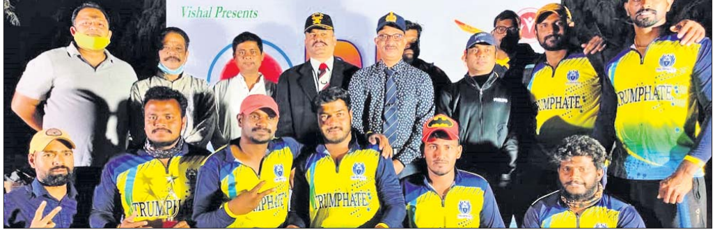
ଚାମ୍ପିୟନ ଗ୍ରୁପ୍‌ସ୍‌ର ଦଳ ଅଭିଭୂକ୍ତ ସହ।