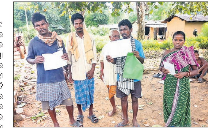
ଚାଉଳ ପାଇବାକୁ ବଞ୍ଚେ ହିତାଧିକାରୀମାନେ।