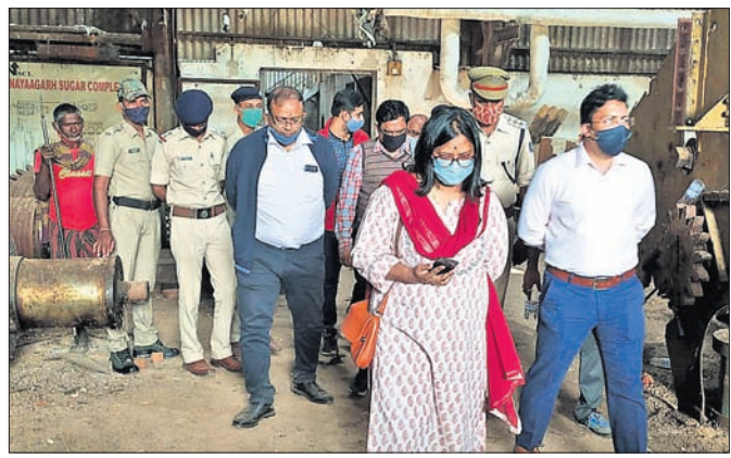
ଚିନିକଳରେ ସମ୍ପତ୍ତି ଆକଳନ ପାଇଁ ଆସିଥିବା ଟିମ୍ ।

■ ମାଜିଷ୍ଟ୍ରେଟ୍, ଆକଳନ ଟିମ୍ କୁ ବିରୋଧ ■ ସମ୍ପତ୍ତି ତାଲିକା ସାର୍ବଜନୀନ ଦାବିରେ କଂଗ୍ରେସ ଧାରଣା