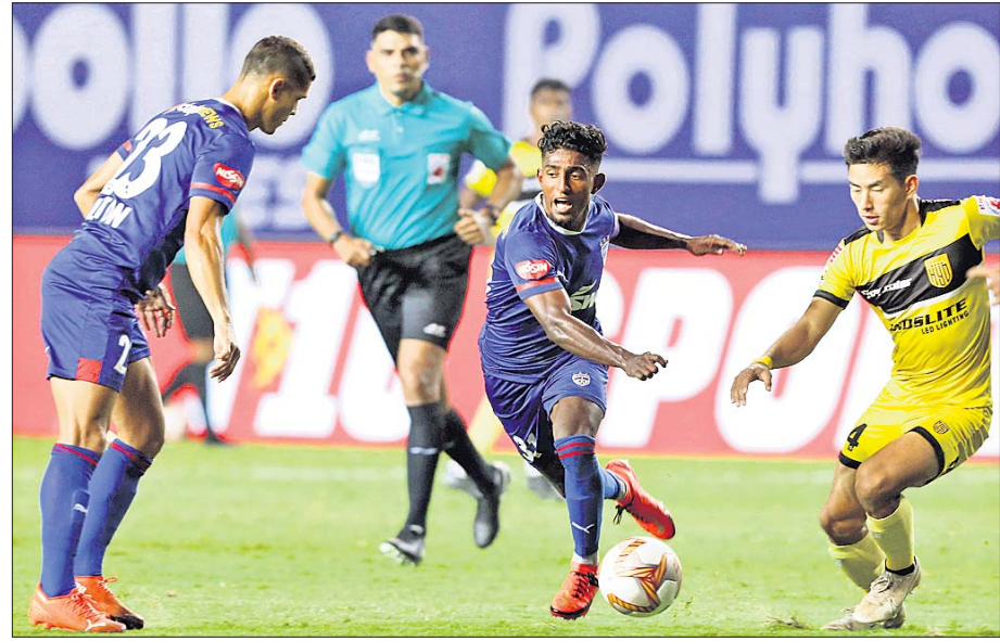
ଇଣ୍ଡିଆନ୍ ସୁପରଲିଗରେ ଗୁରୁବାର ହାଇଦ୍ରାବାଦ ଓ ବେଙ୍ଗାଲୁରୁ ଏହି ମଧ୍ୟରେ ଅନୁଷ୍ଠିତ ମ୍ୟାଚ୍ ।