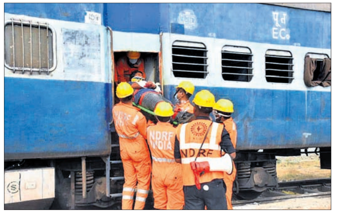
ବଲାଙ୍ଗୀର ରେଳଷ୍ଟେଶନରେ ଅନୁଷ୍ଠିତ ମିଳିତ ବିପର୍ଯ୍ୟୟ ପରିଚାଳନା ଅଭ୍ୟାସ କାର୍ଯ୍ୟକ୍ରମ।