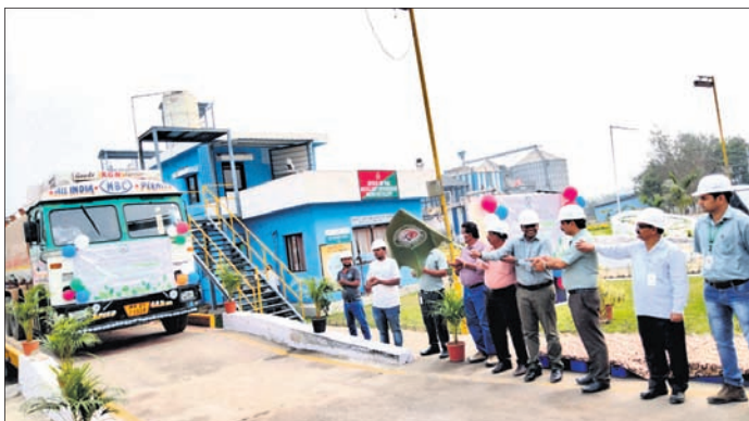
ପ୍ରଥମ ଯୋଗାଣ ଇଥାନଲ୍ ପଠାଯାଇଛି।

ବୌଦ୍ଧ ବିଲ୍‌ରୁ ରାଜ୍ୟର ପ୍ରଥମ ଇଥାନଲ୍ ଯୋଗାଣ ଆରମ୍ଭ ହୋଇଛି। ବିଲ୍‌ର ଏକମାତ୍ର ଶିଳ୍ପ ବୌଦ୍ଧ ଡିସ୍ଟିଲାରୀ ପ୍ରାଇଭେଟ୍ ଲିମିଟେଡ୍ (ବିତିପିଏଲ୍) ପକ୍ଷରୁ ଶୁକ୍ରବାର ଖେରପୁରୁଡ଼ା ଆଇଓସିଏଲ୍ ଡିପୋକୁ ପ୍ରଥମ ପର୍ଯ୍ୟାୟରେ ୨୫ ହଜାର ଲିଟର ଇଥାନଲ୍ ପଠାଯାଇଛି।