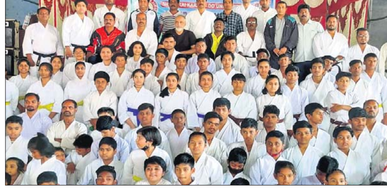
ବେଲ୍ ଚେଷ୍ଟରେ ଭାଗ ନେଇଥିବା କରାଟେକାମାନେ ଅତିଥି ଓ କର୍ମଚାରୀଙ୍କ ସହ।

ଭୁବନେଶ୍ୱର, ୨୯/୧ (ସ୍ପୋର୍ଟ୍ସ୍ ବ୍ୟୁରୋ) କୋରାପୁଟ୍ ସାଂସ୍କୃତିକ ପରିସରରେ ଶୁଭକାର ଉତ୍କଳ କରାଟେ ସ୍କୁଲ ଦ୍ୱାରା ଅତିକ୍ରମ କୋରାପୁଟ୍ ଜିଲ୍ଲାପ୍ରାୟଣ କରାଟେ ବେଲ୍ ପରୀକ୍ଷାର ଆୟୋଜନ କରାଯାଇଛି। ଏହି କାର୍ଯ୍ୟକ୍ରମରେ କୋରାପୁଟ୍, ସେମିଲିଗୁଡା, ଜୟପୁର, ନବରଞ୍ଜପୁର, ମାଲକାନଗିରି ଓ ଉତ୍କଳକୋଟରୁ ପ୍ରାୟ ୧୦୦ଜଣ ଛାତ୍ରଛାତ୍ରୀ ଅଂଶଗ୍ରହଣ କରିଥିଲେ। ଏଥିରେ ସମସ୍ତ ପ୍ରତିଯୋଗୀ ସଫଳତାର ସହ ଉତ୍ତୀର୍ଣ୍ଣ