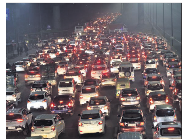
ଗାଜିପୁର ସୀମା ନିକଟ ଦିଲ୍ଲୀର ଜାତୀୟ ଏକ୍ସପ୍ରେସ୍ ନଂ. ୨୪ରେ ଗ୍ରାଫିକ୍ ଜାମ୍ ।

ଦିଲ୍ଲୀ ଓ ହରିୟାଣା ସଂଲଗ୍ନ ସିନ୍ଧୁ ସୀମାରେ ପୋଲିସ୍ ଉପସ୍ଥିତିରେ ଗୁଳିମାନଙ୍କୁ ଓ ଆନ୍ଦୋଳନକାରୀଙ୍କ ମଧ୍ୟରେ ସଂଘର୍ଷ ଦେଖିବାକୁ ମିଳିଛି। ସେହିପରି ଟିକି ଓ ଗାଜିପୁର ବର୍ତ୍ତରରେ ମଧ୍ୟ ପୁରସ୍କାର କର୍ମୀଙ୍କ ଉପସ୍ଥିତି ସତ୍ତ୍ୱେ ଉତ୍ତେଜନା ଲାଗିରହିଛି। ହରିୟାଣାର କର୍ନାଲରୁ ୯୬ କି.ମି ଦୂର ସିନ୍ଧୁ ସୀମାରେ ଆନ୍ଦୋଳନକାରୀଙ୍କୁ ଗୁଳିମାନଙ୍କୁ ଚାଲିଯିବା ପାଇଁ ୨୪ ଘଣ୍ଟା ମହଲତ ଦିଆଯାଇଥିଲା। ଆନ୍ଦୋଳନକାରୀଙ୍କ ଯୋଗୁଁ ସେମାନେ ନାନା ଅସୁବିଧାର ସମ୍ମୁଖୀନ ହେଉଥିବା କହି ଗୁଳିମାନଙ୍କ ଲୋକେ ସେମାନଙ୍କୁ ଘଉଡ଼ାଇବାବେଳେ ସଂଘର୍ଷ ଘଟିଥିଲା। ସେହିପରି ଟିକି ସୀମାରେ ଚାଷୀ ଆନ୍ଦୋଳନକୁ ବିରୋଧ କରି ଗୋଟିଏ ଗୋଷ୍ଠୀ ଗୁଳିମାନଙ୍କୁ ଚାଲିଯିବା ପାଇଁ ଗୋଷ୍ଠୀ ଅସମ୍ମାନ କରିବାକୁ ଦିଆଯିବ ନାହିଁ ବୋଲି ଗୁଳିମାନଙ୍କ ଲୋକେ କହିଥିବା ଶୁଣିବାକୁ ମିଳିଥିଲା। ପୂର୍ବ ଦିଲ୍ଲୀ ଗାଜିପୁର ସୀମା ନିକଟ ଦିଲ୍ଲୀର ଜାତୀୟ ଏକ୍ସପ୍ରେସ୍ ନଂ. ୨୪ରେ ଗ୍ରାଫିକ୍ ଜାମ୍ ।