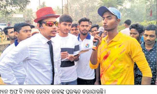
ଧାମନ ଅପ୍ ଦି ମ୍ୟାଚ୍‌ରେ ସେରସା ରାଜ୍ୟ ପୁରସ୍କୃତ କରାଯାଇଛି।

ଧାମନଗର, ୩୦।୧ ଉତ୍କଳ ଜିଲ୍ଲା ଧାମନଗର ବ୍ଲକ୍ ଦୋବାଇ ପଞ୍ଚାୟତ ଧରମପଦା ଖେଳପଡ଼ିଆରେ ବାଲିଥିବା ରାଜ୍ୟସ୍ତରୀୟ ମା' ପୁରଣ୍ଡାମୁଖୀ କ୍ରିକେଟ ଟୁର୍ଣ୍ଣାମେଣ୍ଟର ୪ର୍ଥ କ୍ୱାର୍ଟର ମ୍ୟାଚ୍‌ରେ ଭୁବନେଶ୍ୱର ପାରମାତ୍ମ ସୋନିଂକୁ ହରାଇ ସେରସା ରାଞ୍ଚି ସେମିଫାଇନାଲକୁ ଉନ୍ନତ ହୋଇଛି। ସେରସା ରାଞ୍ଚି ଚ୍ୟୁ ଛିଟି ନିର୍ଦ୍ଧାରିତ ୨୦