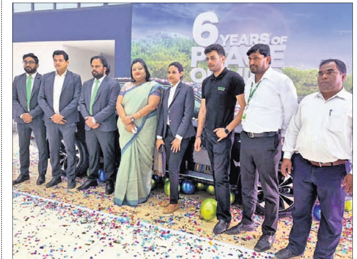
ନୂଆ ସାନିଟିଜିଂ ପ୍ରପେଟ ଅବସରରେ ଉପସ୍ଥାପନ କରାଯାଇଛି।

ସୁପର୍ ପ୍ରପେଟ ୨୦୦୪ରେ ବଜାରକୁ ଆସିଥିଲା। ଏହା କମ୍ପାନୀରେ ଏକ ଲୋକପ୍ରିୟ ମଡେଲ। ନୂଆ ସାନିଟିଜିଂ ପରିବର୍ତନ ଫିଟର ସହ ଆସିଛି।