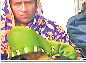
ମନ୍ତ୍ରୀଙ୍କ ବାସଭବନ ସମ୍ମୁଖରେ ଧାରଣାରେ ବସିଛନ୍ତି ପିନ୍ଧୁଙ୍କ ପରିବାରବର୍ଗ।

ହେଲେ ମନ୍ତ୍ରୀଙ୍କ ସାକ୍ଷାତ୍ ନ ମିଳିବାରୁ ସେଠାରୁ ଓଡ଼ିଶା ରାଜ୍ୟ ଶିଶୁ ଅଧିକାର ସୁରକ୍ଷା ଆୟୋଗ (ଏସ୍‌ସିସିସିଆର୍)କୁ ଭେଟି ପୋଲିସ ବିରୋଧରେ ଏପରି ଗୁରୁତର ଅଭିଯୋଗ ଆଣିବା ସହ ଝିଆରୀ ଖୋଜିଦେବାକୁ ନେହୁରା ହୋଇଛନ୍ତି।