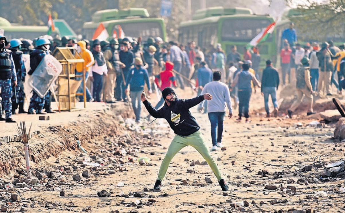
ସିନ୍ଧୁ ସୀମାରେ ଚାଷୀଙ୍କ ଉପରକୁ ବେକାମାଡ଼ କରୁଛନ୍ତି ନିଜକୁ ସ୍ଥାନୀୟ ବୋଲାଇଥିବା ଜଣେ ବ୍ୟକ୍ତି।

ପୂର୍ବରୁ ସୀମା କହିଲେ କେବଳ କମ୍ପ୍ୟୁଟର ସଂଲଗ୍ନ ନିୟନ୍ତ୍ରଣରେଖା ଓ ଉତ୍ତର ପୂର୍ବକୁ ଲାଗି ରହିଥିବା ଚାଲନା ସୀମାକୁ ବୁଝାଉଥିଲା। ହେଲେ ଦୁଇମାସ ହେବ ଚର୍ଚ୍ଚାରେ ରହିଛି ଭିନ୍ନ ଏକ ସୀମା। ତାହା ହେଉଛି ଦେଶ ଭିତରର ବର୍ତ୍ତର। କେନ୍ଦ୍ର ସରକାରଙ୍କ ୩ କୃଷି ଆଇନ ବିରୋଧରେ କୃଷକ ସଙ୍ଗଠନଗୁଡ଼ିକ ପକ୍ଷରୁ ଚାଲିଥିବା ଆନ୍ଦୋଳନ ପରିପ୍ରେକ୍ଷାରେ ଦିଲ୍ଲୀ ସଂଲଗ୍ନ ସିଲ୍ସ, ଟିକି ଓ ଗାଜିପୁର ସୀମା ପ୍ରତ୍ୟହ ଖବରର ଶିରୋନାମା ସାଉଁରୁଛି। ବିଶେଷକରି ସାଧାରଣତନ୍ତ୍ର ଦିବସର ଗ୍ରୀଷ୍ମ ଋତୁ ହିଁ ଏକ ଉପଦ୍ରବ ଜାତୀୟ ରାଜଧାନୀର ସୀମାକୁ ସମସ୍ତଙ୍କ ଦୃଷ୍ଟି ଆକର୍ଷଣ କରିଛି। ୩ ଦିନ ଧରି ଏଠାରେ ଛକାପଞ୍ଜା ସ୍ଥିତି ଲାଗିରହିଛି।