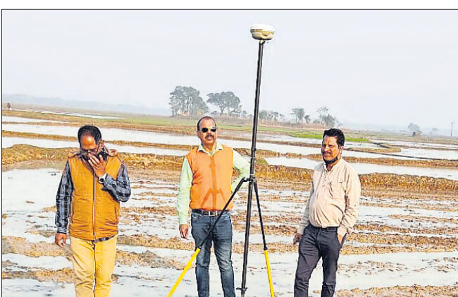
ସାଟେଲାଇଟ୍ ସର୍ଭେ କରାଯାଇଛି।

ଏହି ସମସ୍ତ ଗ୍ରାମର ସୀମାରେ ଜଳେଶ୍ୱର ତହସିଲ ପକ୍ଷରୁ ମାପରୁପ କରାଯାଇ ୩୬ଟି ପଏଣ୍ଟ ନିର୍ଦ୍ଧାରଣ କରାଯାଇଛି। ରାଜ୍ୟ ସରକାରଙ୍କ ନିର୍ଦ୍ଦେଶରେ ଜିଲ୍ଲା ଜଳେଶ୍ୱର ବ୍ଲକ୍‌ର ନଦୀକୂଳ ଗ୍ରାମ ବିକାସପୁର, ଗୋପାଳପୁର, କୁଞ୍ଜିରପୁର, ମାଳିକପୁର, ଗୋପାପୁର, ବେହେରାସାହି, ପ୍ରହରାଜପୁର, ଦକ୍ଷିଣ ପ୍ରହରାଜପୁର ଓ ମକରମପୁର ଗାଁ ପ୍ରତି ବିପଦ ସୃଷ୍ଟି ହୋଇଛି। ଏ ସମ୍ପର୍କରେ ଏନିଜିଡିରେ ମାମଲା ଚାଲୁ ରହିଥିଲା ବେଳେ ଉଭୟ ରାଜ୍ୟକୁ କୋର୍ଟ ଚାଲିବା ସହ ଏହାର ସୀମା ନିର୍ଦ୍ଧାରଣ ଲାଗି ପରାମର୍ଶ ଦେଇଥିଲେ। ଜିଲ୍ଲାପାଳଙ୍କ ନିର୍ଦ୍ଦେଶରେ