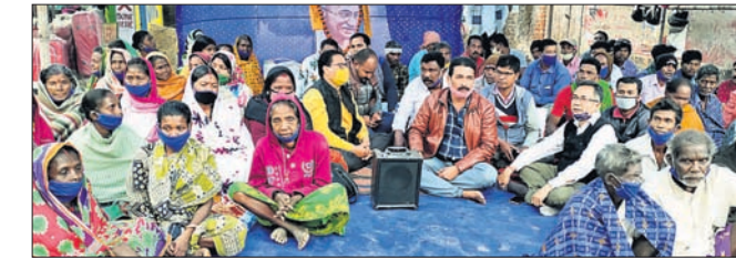
ନାକଗିରି ବ୍ଲକ୍ କାର୍ଯ୍ୟାଳୟ ସମ୍ମୁଖରେ ଗଣଧାରଣା ଦିଆଯାଇଛି।