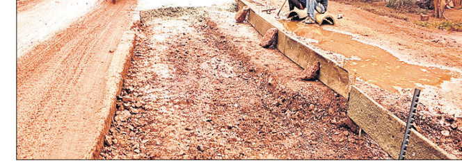
ନିମ୍ନମାନର କଂକ୍ରିଟ୍ ରାସ୍ତା।

ଭଦ୍ରକ, ୨୯।୧ (ଡି.ଏନ.ଏ.): ମୟୂରଭଞ୍ଜ ଜିଲ୍ଲା ଭଦ୍ରକ ବିଜେଡି ପକ୍ଷରୁ ଏନଏସି ଅଞ୍ଚଳରେ କାର୍ଯ୍ୟରେ ୪୫ ଜଣ ସଫେଇ କର୍ମଚାରୀଙ୍କୁ ସମର୍ଥନ କରାଯାଇଥିଲା। ବିଜେଡି କାମ୍‌ବନ୍ଦି ସଂଯୋଜକ ଅମୀୟ କୁମାର ବଳଙ୍କ ଅଧ୍ୟକ୍ଷତାରେ ଆୟୋଜିତ ଏହି କାର୍ଯ୍ୟକ୍ରମରେ ପୂର୍ବତନ ବିଧାୟକ ଶ୍ରୀନାଥ ଯୋଗେ, ନଗର ସଭାପତି ବନମାଳି ବେହେରା, ପୂର୍ବତନ ଏନଏସି ଅଧ୍ୟକ୍ଷା ପ୍ରେମଲତା ଜେନା, ବ୍ଲକ୍ ସଭାପତି ଗୋବିନ୍ଦ ନାୟକ ପ୍ରମୁଖ ଯୋଗଦେଇଥିଲେ।