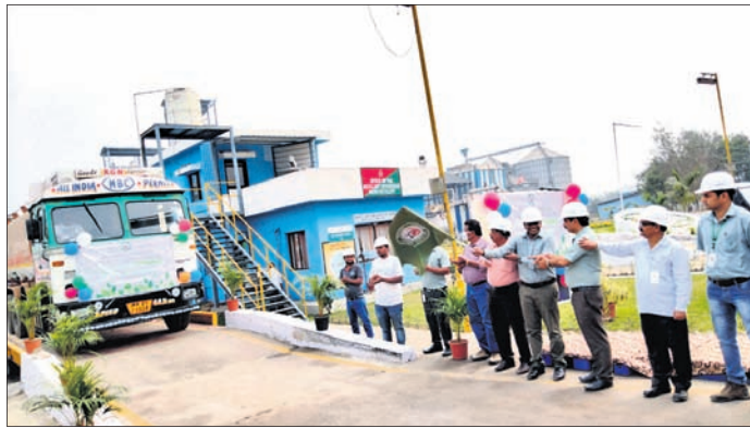
ପ୍ରଥମ ଇଥାନଲ୍ ପଠାଯାଇଛି।

ବୌଦ୍ଧ ବିଲ୍ଡିଂ ଉଦ୍ୟମ ପ୍ରଥମ ଇଥାନଲ୍ ଯୋଗାଣ ଆରମ୍ଭ ହୋଇଛି। ବିଲ୍ଡିଂ ଏକମାତ୍ର ଶିଳ୍ପ ବୌଦ୍ଧ ତିଷ୍ଣାଗାର ପ୍ରାଣକେନ୍ଦ୍ର ଲିମିଟେଡ୍ (ବିତିପିଏଲ୍) ପକ୍ଷରୁ ଶୁଭକାର ଖେଳପୁରୁଷ ଆଇଡିଏଏଲ୍ ତିପୋଲ୍ ପ୍ରଥମ ପର୍ଯ୍ୟାୟରେ ୨୫ ହଜାର ଲିଟର ଇଥାନଲ୍ ପଠାଯାଇଛି।