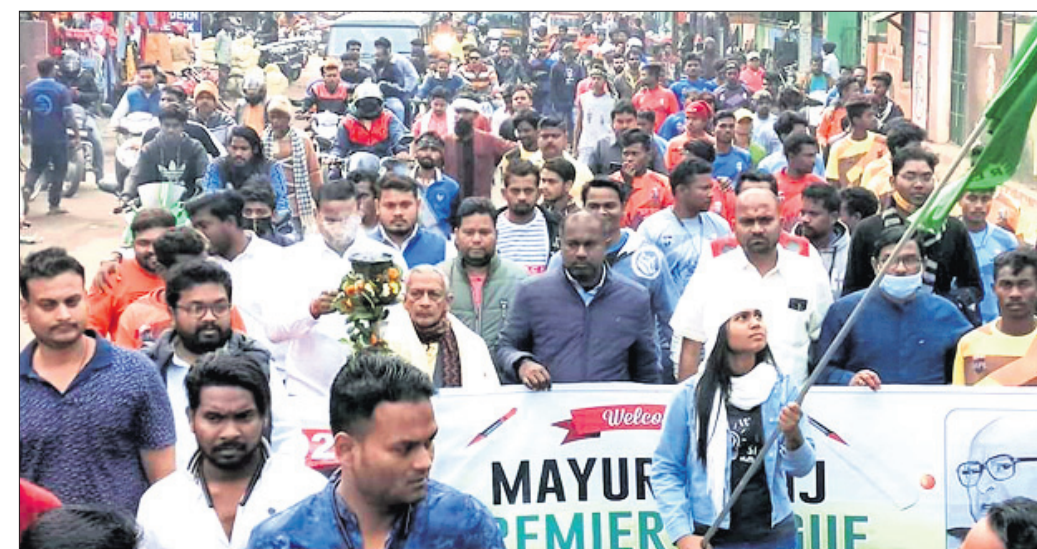
ମୟୂରଭଞ୍ଜ ପ୍ରିମିୟର ଲିଗ୍ ଉଦ୍‌ଘାଟନ ଅବସରରେ ଆୟୋଜିତ ମଣ୍ଡଳ ଶୋଭାଯାତ୍ରା।