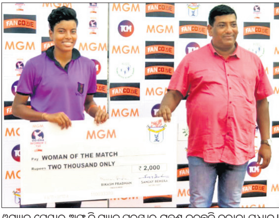
ଓମ୍ୟାନ ପ୍ଲେୟାର ଅଫ୍ ଦି ମ୍ୟାଚ୍ ପୁରସ୍କାର ଗ୍ରହଣ କରୁଛନ୍ତି ତରାନା ପ୍ରଧାନ।

କିଏ ଗ୍ରାଉଣ୍ଡରେ ଶନିବାର ଅନୁଷ୍ଠିତ ବିତୀୟ ମ୍ୟାଚ୍‌ରେ ଓଡ଼ିଶା ଭାଉଲେଟ୍ ୪୫ଟି ବଲ୍ ବାକି ରଖି ୬ ଉତ୍ତମରେ ବିଜୟୀ ପର୍ଯ୍ୟନ୍ତ ସହଜରେ ହରାଇଛି।