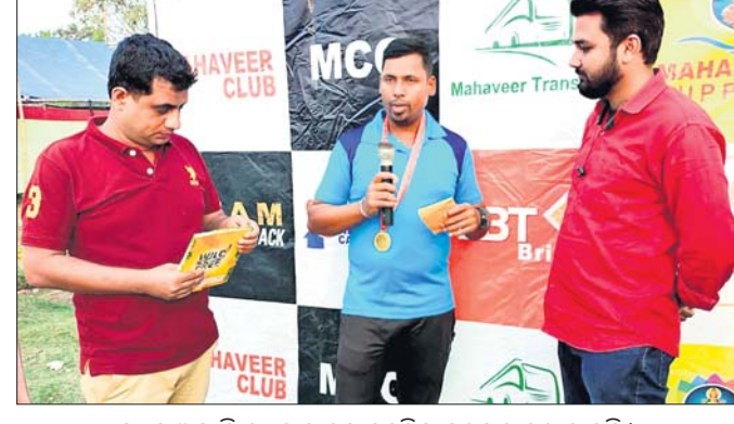
ମ୍ୟାନ ଅର୍ଥ ଦି ମ୍ୟାଚ୍ ମାନସ ପୁରୁଲିକୁ ପୁରସ୍କୃତ କରାଯାଇଛି।