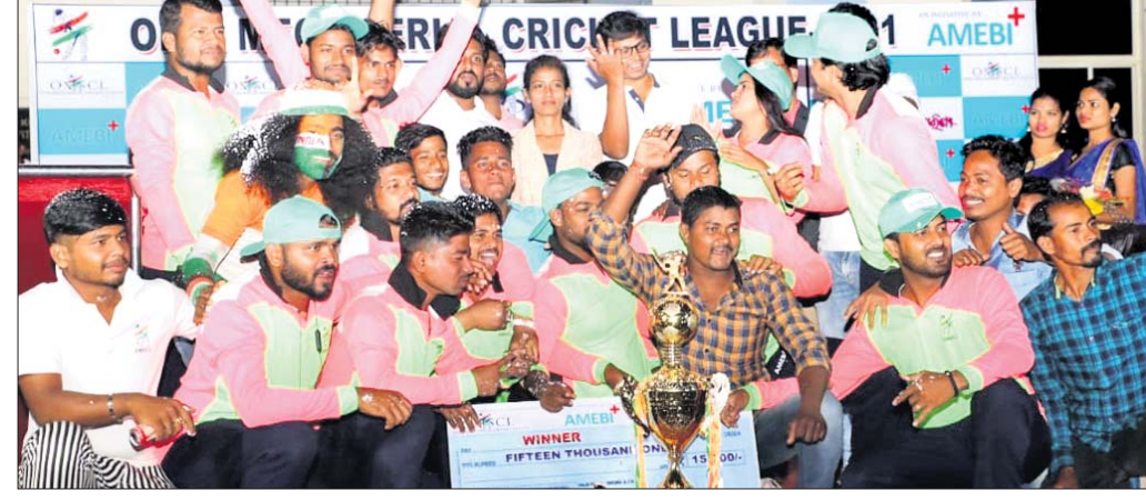
ଗାମ୍ପିୟନ ଜୀବନସାଥୀ ଦଳର ଖେଳାଳିମାନେ ଟ୍ରଫି ସହ ଅତିଥିଙ୍କୁ ଗୃହଣରେ।