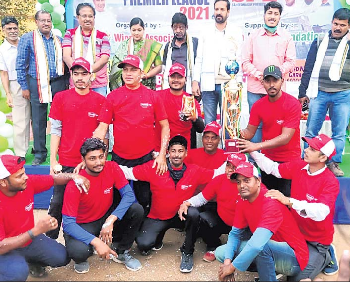
ଗାମ୍ପିୟନ ଭିତଳ ଇଲେଭେନ ଦଳର ଖେଳାଳିମାନେ ଅତିଥିଙ୍କଠାରୁ ପୁରସ୍କାର ଗ୍ରହଣ କରୁଛନ୍ତି।