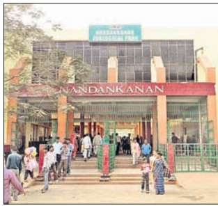
ବାରକ, ୩୧୧୧ (ଡି.ଏନ୍.ଏ.)

ପ୍ରାଣୀ ଉଦ୍ୟାନ ନନ୍ଦନକାନନରେ କେବଳ ରବିବାରରେ ପର୍ଯ୍ୟଟକମାନଙ୍କ ସଂଖ୍ୟା ବହୁଥିବାର ଲକ୍ଷ୍ୟ କରାଯାଉଥିବାବେଳେ ଏହି ରବିବାର ପର୍ଯ୍ୟଟକ ସଂଖ୍ୟା କମିଯାଇଛି। ଗତ ୨୪ତାରିଖ ରବିବାରଠାରୁ ମାସ ଶେଷ ୩୧ତାରିଖ ରବିବାରରେ ନନ୍ଦନକାନନରେ ପର୍ଯ୍ୟଟକ ମାନଙ୍କ ସଂଖ୍ୟା ତୁଳନାତ୍ମକ ଭାବେ କମିଥିବାବେଳେ ବଟାନିକାଲ ଗାର୍ଡେନରେ ପର୍ଯ୍ୟଟକ ସଂଖ୍ୟା ବଢିଛି। ରବିବାର ନନ୍ଦନକାନନକୁ ୧୩ହଜାର ୫୩୧ ଜଣ ପର୍ଯ୍ୟଟକ ବୁଲିବାକୁ ଆସିଥିବାବେଳେ ସେମାନଙ୍କ ମଧ୍ୟରୁ ୨୬୬୬ଜଣ ଅନଲାଇନରେ ପ୍ରବେଶ ଟିକେଟ କାଟିଥିଲେ। ସେହିଭଳି ଭାବେ ବଟାନିକାଲ ଗାର୍ଡେନକୁ ରବିବାର ୩୨୦୧୧ଜଣ ପର୍ଯ୍ୟଟକ ବୁଲିବାକୁ ଆସିଥିବାର ନନ୍ଦନକାନନ ଉପ ନିର୍ଦ୍ଦେଶକ ବିନା ଅନାମୀ କହିଛନ୍ତି। ତେବେ ନନ୍ଦନକାନନକୁ ଗତ ରବିବାର ଠାରୁ ୧୩୭୬ଜଣ ପର୍ଯ୍ୟଟକ କମ ଆସିଥିବାବେଳେ ବଟାନିକାଲ ଗାର୍ଡେନକୁ ୫୦୬ଜଣ ପର୍ଯ୍ୟଟକ ଅଧିକ ଆସିଛନ୍ତି। ତେବେ ୨୪ତାରିଖ ରବିବାରରେ ନନ୍ଦନକାନନକୁ ୧୨୪ହଜାର ୯୦୬ଜଣ ପର୍ଯ୍ୟଟକ ଆସିଥିବାବେଳେ ବଟାନିକାଲ ଗାର୍ଡେନକୁ ୩୧୫୪୧ଜଣ ପର୍ଯ୍ୟଟକ ଆସିଥିଲେ।