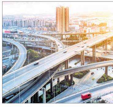
ଭିତ୍ତିଭୂମି ସେବା, ଗୁଣାମୁକ ଶିକ୍ଷା, ଦକ୍ଷ ପରିବହନ ବ୍ୟବସ୍ଥା ଏବଂ ସମସ୍ତଙ୍କ ଲାଗି ବାସଗୃହ ସାମିଲ ରହିଛି। ଭିତ୍ତିଭୂମି ନିବେଶ

ଭିତ୍ତିଭୂମି ନିବେଶ ଉପରେ ସରକାର ଗୁରୁତ୍ୱ ଦେଇ ଆସିଛନ୍ତି। ସାଧାରଣ ବଜେଟରେ ଭିତ୍ତିଭୂମି କ୍ଷେତ୍ର ଲାଗି କିଛି ବଡ଼ ଯୋଗ୍ୟ ଆସିପାରେ। ବଜେଟରେ ସରକାରୀ ଭିତ୍ତିଭୂମି କ୍ଷେତ୍ରରେ ଘରୋଇ ସହଭାଗିତାକୁ ଉତ୍ସାହ ଦେବା ସହ ପ୍ରୋଘାହନ ମଧ୍ୟ ଦେଖାଯାଉଛି। ଭିତ୍ତିଭୂମି ନିବେଶକୁ ବଢ଼ାଇବା ଲାଗି ସରକାର ପୁଞ୍ଜି ଖର୍ଚ୍ଚ ଉପରେ ଫୋକସ କରିପାରନ୍ତି। ଆଗାମୀ ୫ ବର୍ଷରେ ଭିତ୍ତିଭୂମିରେ ୧ ଲକ୍ଷ କୋଟି ଟଙ୍କା ନିବେଶ ନେଇ ସରକାର ଯୋଜନା ରଖିଛନ୍ତି। ଭିତ୍ତିଭୂମି ଭିତ୍ତି ୨୦୨୫ର ଅଗ୍ରଗତି ନେଇ ଅର୍ଥମନ୍ତ୍ରୀ ଯୋଗ୍ୟ ମଧ୍ୟ କରିପାରନ୍ତି। ଏହା ମଧ୍ୟରେ ୨୪ ଘଣ୍ଟିଆ ଶକ୍ତି ଯୋଗ୍ୟ,