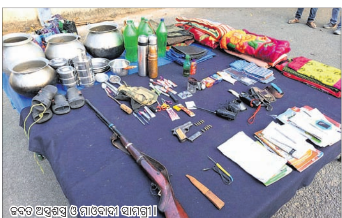
ଜବତ ଅସ୍ତ୍ରସାମଗ୍ରୀ ଓ ମାଓବାଦୀ ସାମଗ୍ରୀ।