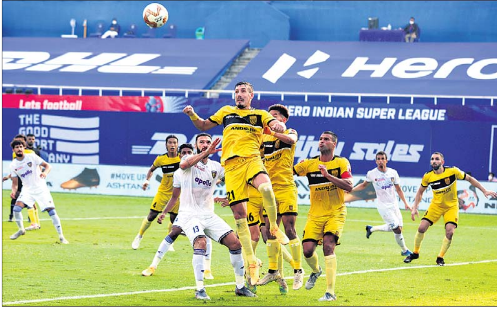
ଭାରତୀୟ ପ୍ରମୁଖ ଲିଗରେ ରବିବାର ହାଇଦ୍ରାବାଦ ଏଫସି ଓ ଚେନ୍ନାଇ ମଧ୍ୟରେ ଅନୁଷ୍ଠିତ ମ୍ୟାଚର ଏକ ସଂଘର୍ଷପୂର୍ଣ୍ଣ ମୁହୂର୍ତ୍ତ।

ପରେ ଚେନ୍ନାଇ ଦଳ ୨ଜଣ ଖେଳାଳିଙ୍କୁ ବଦଳ କରିଥିଲା। ଜର୍ମାନିଆର ସିଂ ଓ ହାସଲ କରିଥିଲେ ଏବଂ ହାଇଦ୍ରାବାଦକୁ ୧-୦ରେ ଅଗ୍ରଣୀ କରାଇଥିଲେ। ଗୋଲ ବରଣ ପରେ ଚେନ୍ନାଇ ଦଳ କିଛି ସମୟ ବଳକୁ ନିଜ ନିୟନ୍ତ୍ରଣରେ ରଖିଥିଲା। ଦୁର୍ବଳ ପାଦ ଯୋଗୁ ଗୋଲ ଦେବାରେ ସକ୍ଷମ ହୋଇପାରି ନ ଥିଲା। ପ୍ରଥମାର୍ଦ୍ଧ ଖେଳ