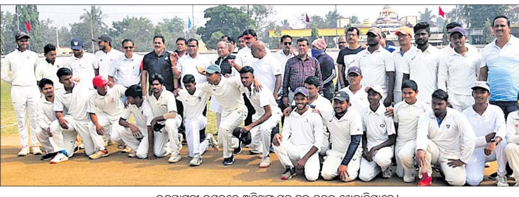
ଉଦ୍‌ଘାଟନା ଉତ୍ସବରେ ଅତିଥିଙ୍କ ସହ ବୁଲ୍ ବଳର ଖେଳାଳିମାନେ।

ନିମାପଡ଼ା, ୩୧।୧(ଡି.ଏନ୍.ଏ.) ନିମାପଡ଼ା କ୍ରିକେଟ ଆସୋସିଏସନ୍ ପକ୍ଷରୁ ସ୍ଥାନୀୟ ବାରବାଟୀ ଗ୍ରାମ୍ୟାଞ୍ଚଳରେ ରବିବାର ରାଜ୍ୟସ୍ତରୀୟ ବ୍ୟାଟିଂ ନିମାପଡ଼ା କମ୍ପ କ୍ରିକେଟ ପ୍ରତିଯୋଗିତା ଉଦ୍‌ଘାଟିତ ହୋଇଯାଇଛି।