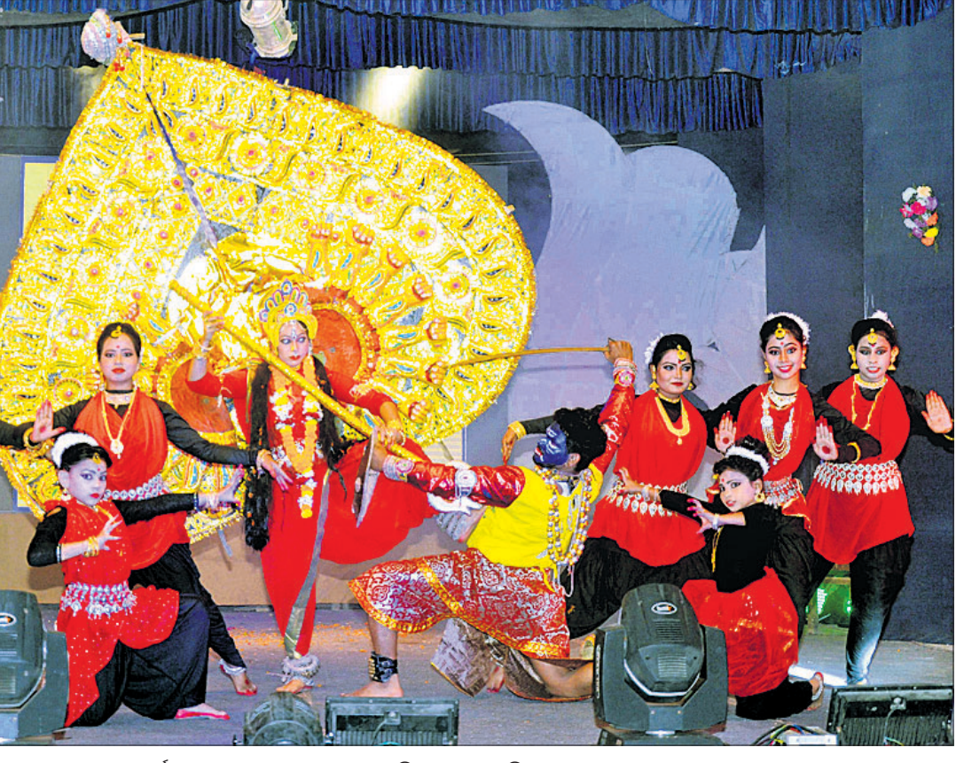
ପୁରୀ ଅନୁଷ୍ଠାନ ଥିଏଟରରେ ରବିବାର ଟାଲେଣ୍ଟ ଫେଷ୍ଟି ଉଦ୍‌ଘାଟନା କାର୍ଯ୍ୟକ୍ରମରେ କଳାକାରମାନେ ନୃତ୍ୟ ପରିବେଷଣ କରୁଛନ୍ତି