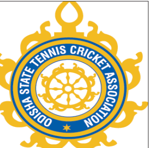
ଜାତୀୟ ଯିନିୟର ଚେନିକ କ୍ରିକେଟ

ଚେନିକ କ୍ରିକେଟ ଆସୋସିଏସନ ଅଫ୍ ଇଣ୍ଡିଆ ଆନୁକୁଲ୍ୟରେ ୫ମ ଜାତୀୟ ଯିନିୟର ଚେନିକ କ୍ରିକେଟ ଚାମ୍ପିୟନଶିପ୍ (ମହିଳା ଓ ପୁରୁଷ) ଭୁବନେଶ୍ୱରରେ