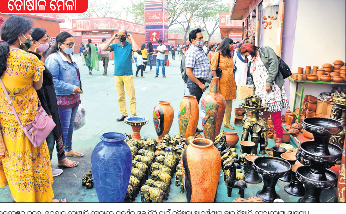
ଭୁବନେଶ୍ୱର ଜନତା ପଲକର ଡକ୍କାରୀ ମେଳାରେ ପ୍ରଦର୍ଶନ ସହ ବିକ୍ରି ପାଇଁ ରହିଥିବା ଆକର୍ଷଣୀୟ ହାତ ତିଆରି ଚେରାକୋଟା ସାମଗ୍ରୀ।