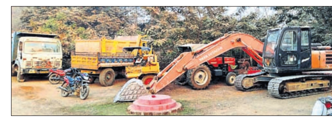
ଜବତ କମ୍ପେସ୍‌ସନ୍, ଟ୍ରାକ୍ଟର, ହାଲ୍‌ଡ୍ରା, ହିଟାଚି ମେଶିନ।

ଧର୍ମଶାଳା ତହସିଲ ଅନ୍ତର୍ଗତ ଡକ୍କାରୀ କଳାପଥର ଖାଦାନରେ ରବିବାର ଚଢ଼ାଉ କରାଯାଇ କମ୍ପେସ୍‌ସନ୍, ଟ୍ରାକ୍ଟର, ହାଲ୍‌ଡ୍ରା, ହିଟାଚି ମେଶିନ ଆଦି ୧୦ ଗାଡ଼ି ଜବତ କରାଯାଇଛି। ଏଥିସହିତ ୫ ଜଣଙ୍କୁ ଅଟଳ ରଖାଯାଇଛି। ଅଭିଯୋଗରେ ଡକ୍କାରୀରୁ ପୁଣି କଳାପଥର ଗୋଟି ଶାଞ୍ଜିକ ଖବର ପ୍ରକାଶ ପାଇବା ପରେ ଜିଲ୍ଲାପାଳ ନିର୍ଦ୍ଦେଶରେ ଚଢ଼ାଉ ହୋଇଥିବା ସୂଚନା ମିଳିଛି। ଏହାସହିତ ବେଆଇନ ଭାବେ ଉତ୍ତୋଳନ ହୋଇଥିବା କଳାପଥର ରହିଛି ବୋଲି କୁହାଯାଇଛି। ତେବେ ଡକ୍କାରୀରେ ପ୍ରାୟ ୨ ବର୍ଷ ମାମଲା (ନଂ. ୪୩, ୪୪/୨୧) ରୁଜୁ କରିବା ସହ ଗଞ୍ଜ ଥାନାରେ ଚଢ଼ାଉ କରାଯାଇଛି।