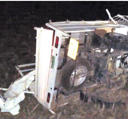
ବୁର୍ଯ୍ୟଗାଗ୍ରସ୍ତ ପିକ୍‌ଅପ୍ ଭ୍ୟାନ।

କୋଟପାଡ଼/କନ୍ଧପୁର, ୩୧।୧ (ଡି.ଏନ୍.ଏ./ନି.ପ୍ର.) କୋରାପୁଟ ଜିଲ୍ଲା କୋଟପାଡ଼ ଥାନା ମୂର୍ତ୍ତୀହାଣ୍ଡିରେ ରବିବାର ରାତି ପ୍ରାୟ ସାଢ଼େ ୮ଟାରେ ପିକ୍‌ଅପ୍ ଭ୍ୟାନ୍ ଓଲଟି ୯ ଜଣଙ୍କ ମୃତ୍ୟୁ ହୋଇଥିବାବେଳେ ୯ରୁ ଉର୍ଦ୍ଧ୍ୱ ଆହତ ହୋଇଥିବା ସୂଚନା ମିଳିଛି। ରିପୋର୍ଟ ପ୍ରସ୍ତୁତ ସୁଦ୍ଧା ମୃତକମାନଙ୍କ ପରିଚୟ ମିଳି ନ ଥିବାବେଳେ ସେମାନେ ସମସ୍ତେ ଛତିଶଗଡ଼ ଅଞ୍ଚଳର ବୋଲି ଜଣାପଡ଼ିଛି।