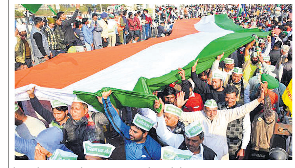
ଦିଲ୍ଲୀର ଗାଜିପୁର ସାମାଜିକ ରବିବାର ଆନ୍ଦୋଳନରତ ଚାଷୀ ତ୍ରିରଙ୍ଗା ଧରିଛନ୍ତି।

ଚଣ୍ଡିଗଡ଼, ୩୧।୧: ସ୍ୱାମୀଙ୍କୁ ହତ୍ୟା କରିଥିବା ମହିଳା ମଧ୍ୟ ଫ୍ୟାମିଲି ପେନ୍‌ସନ ପାଇବାର ହକ୍‌ଦାବ ବୋଲି କହିଛନ୍ତି ପଞ୍ଜାବ ଓ ହରିୟାଣା ହାଇକୋର୍ଟ। ଏକ ମାମଲାରେ ଶୁଣାଣି କରି କୋର୍ଟ କହିଛନ୍ତି, ସୁନା ଅଣ୍ଡାଦିଆ କୁକୁଡ଼ାକୁ କେହି କାଟିପାରି ଦେଇ ନାହିଁ। ସରକାରୀ କର୍ମଚାରୀଙ୍କ ମୃତ୍ୟୁ ପରେ ତାଙ୍କ ପରିବାରକୁ ଆର୍ଥିକ ସହାୟତା ଯୋଗାଇବା ପାଇଁ ଫ୍ୟାମିଲି ପେନ୍‌ସନ ଯୋଜନା ରହିଛି। ଯଦି ସ୍ୱାମୀଙ୍କ ହତ୍ୟାକାରୀ ହୋଇଥାଏ ତେବେ ମଧ୍ୟ ସେ ପେନ୍‌ସନର ହକ୍‌ଦାବ ବୋଲି ଅଧିକାରୀଙ୍କ ବଳକ୍ଷିତ କୌରବ୍ ଚିକିତ୍ସାଧିକାରୀ ଅଧିକ୍ଷ ପଦକୁ ଇସ୍ତଫା ଦେଇଥିଲେ।