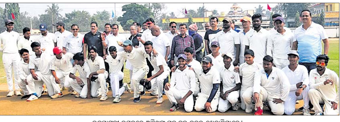
ଉଦ୍‌ଘାଟନା ଉତ୍ସବରେ ଅତିଥିଙ୍କ ସହ ଦୁଇ ଦଳର ଖେଳାଳିମାନେ।

ନିମାପଡ଼ା, ୩୧।୧ (ଡି.ଏନ୍.ଏ.) ନିମାପଡ଼ା କ୍ରିକେଟ ଆସୋସିଏସନ ପକ୍ଷରୁ ସ୍ଥାନୀୟ ବାରବାଟୀ ଗ୍ରାମ୍ୟରେ ରବିବାର ରାଜ୍ୟସ୍ତରୀୟ କ୍ରୀଡ଼ା ନିମାପଡ଼ା କର୍ମ କ୍ରିକେଟ ପ୍ରତିଯୋଗିତା ଉଦ୍‌ଘାଟିତ ହୋଇଯାଇଛି।