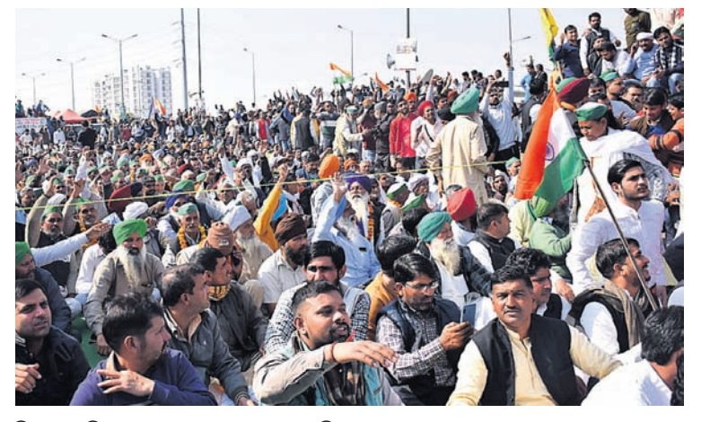
ଦିଲ୍ଲୀର ଗାଜିପୁର ସାମାଜିକ ସେଣ୍ଟରରେ ଆନ୍ଦୋଳନର ଚାଷୀ।

ଅମୃତସର, ୩୧।୧ ସାଧାରଣତନ୍ତ୍ର ଦିବସ ପ୍ରାୟ ଚାଲିଗଲା ଯୋଗଦେବା ପାଇଁ ଦିଲ୍ଲୀ ଯାଇଥିବା ପଞ୍ଜାବର ଶତାଧିକ ଚାଷୀ ନିଖୋଜ ହୋଇଯାଇଛନ୍ତି। ପଞ୍ଜାବ ମାନବାଧିକାର ସଂଗଠନ (ପିଏସ୍‌ଆର୍‌ଓ) ପକ୍ଷରୁ