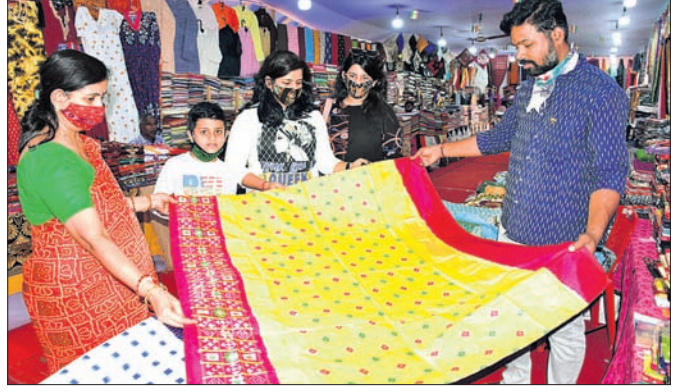
ଭୁବନେଶ୍ୱର, ୩୧୧୧ (ବୁଧବେଳା)

ଭୁବନେଶ୍ୱର ଯୁନିଟ୍-୩ରେ ପ୍ରଦର୍ଶନୀୟ ପଡ଼ିଆରେ ଚାଲିଥିବା ଗାତାୟ ହସ୍ତତନ୍ତ ବେଳାର ଉଦ୍ଘାଟନ ହୋଇଥିଲା। ଗୋଟିଏ ଦିନକୁ ଦିନ ମେଳାରେ ଗ୍ରାହକଙ୍କ ଭିଡ଼ ବୃଦ୍ଧି ପାଇଛି। ବିଶେଷକରି ଯାଧାରାଗଡ଼ନୁଦିନ, ଶନିବାର ଓ ରବିବାର ଦିନରେ ଅଧିକ ଭିଡ଼ ଦେଖାଯାଇଛି। ତେବେ କାର୍ଯ୍ୟକାରୀ ୨୦୦୦ ୩୧ ଚାରିଖ ପର୍ଯ୍ୟନ୍ତ ମେଳାରେ ପ୍ରାୟ ୩ କୋଟି ଟଙ୍କାର ବ୍ୟବସାୟ ହୋଇଛି। କେବଳ 'ବୟନିକା' ସ୍ଥଳରେ ୫୦ ଲକ୍ଷ ଟଙ୍କାରୁ ଅଧିକ ବିକ୍ରୟ ହୋଇଥିବାବେଳେ ଆନ୍ଧ୍ର ପ୍ରଦେଶର 'ଆପକୋ', ଚାମିଲାନାଟୁର 'କୋପ୍‌କୋ', ମଧ୍ୟପ୍ରଦେଶର 'ମୂଗନୟନା', ଜମ୍ମୁ-କଶ୍ମୀରର 'କାସ୍‌ପା', ପଶ୍ଚିମବଙ୍ଗ, ଦିଲ୍ଲୀ ଓ ହରିୟାଣାର ହସ୍ତତନ୍ତ ସମ୍ପତ୍ତି ଓ ଅନୁଷ୍ଠାନଗୁଡ଼ିକ ଭଲ ବ୍ୟବସାୟ କରିଥିବାରୁ ଖୁସି ଜାହିର କରିଛନ୍ତି। ସେଠାରେ ଅର୍ଥାତ୍ ମାତ୍ର ମାସ ବିବାହ ରୁ ପ୍ରାୟ ୧୨ ଦିନରେ ମେଳାରେ ଭଲ ବିକ୍ରି ହେବ ବୋଲି ସମସ୍ତ ଅଂଶଗ୍ରହଣକାରୀ ସଂଗଠନୀୟ ଶାଖାଗଣ ଦାବୀ କରିଛନ୍ତି। ଗାତାୟ ହସ୍ତତନ୍ତ ମେଳାରେ ପ୍ରାୟ ୩ କୋଟି ଟଙ୍କାର ବ୍ୟବସାୟ ହୋଇଛି। କେବଳ 'ବୟନିକା' ସ୍ଥଳରେ ୫୦ ଲକ୍ଷ ଟଙ୍କାରୁ ଅଧିକ ବିକ୍ରୟ ହୋଇଥିବାବେଳେ ଆନ୍ଧ୍ର ପ୍ରଦେଶର 'ଆପକୋ', ଚାମିଲାନାଟୁର 'କୋପ୍‌କୋ', ମଧ୍ୟପ୍ରଦେଶର 'ମୂଗନୟନା', ଜମ୍ମୁ-କଶ୍ମୀରର 'କାସ୍‌ପା', ପଶ୍ଚିମବଙ୍ଗ, ଦିଲ୍ଲୀ ଓ ହରିୟାଣାର ହସ୍ତତନ୍ତ ସମ୍ପତ୍ତି ଓ ଅନୁଷ୍ଠାନଗୁଡ଼ିକ ଭଲ ବ୍ୟବସାୟ କରିଥିବାରୁ ଖୁସି ଜାହିର କରିଛନ୍ତି।