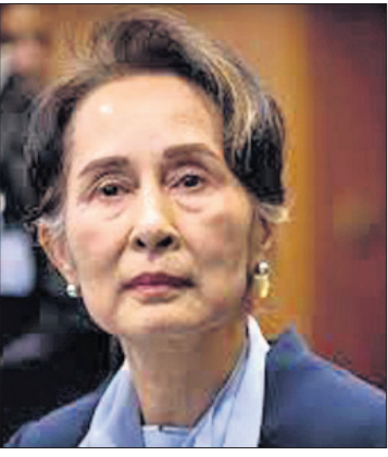
ଅଙ୍ଗ ସାନ୍ ସୁ କା