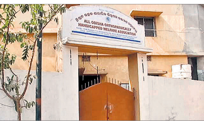
ନିଖୁଳ ଉତ୍କଳ ଶାରୀରିକ ଭିକ୍ଷଣ ତାଲିମ କେନ୍ଦ୍ର