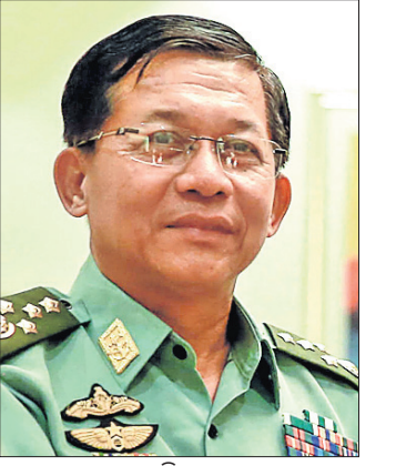
ସେନାମୁଖ୍ୟ ମିର୍ ଅଙ୍ଗ ହାଲଙ୍ଗ