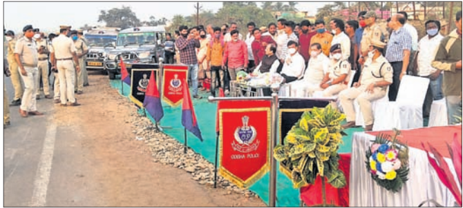
ଶୁଭାରମ୍ଭ ଅବସରରେ ଜିଲାପାଳ, କେନ୍ଦ୍ରାଞ୍ଚଳ ପୋଲିସ୍ ଡିଆଇଜି, ବିଧାୟକ ଓ ଅନ୍ୟମାନେ।