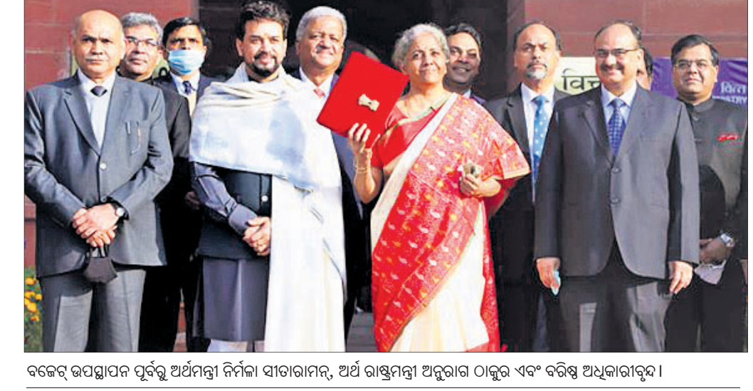
ବଜେଟ୍ ଉପସ୍ଥାପନ ପୂର୍ବରୁ ଅର୍ଥମନ୍ତ୍ରୀ ନିର୍ମଳା ସାତରାମନ, ଅର୍ଥ ରାଷ୍ଟ୍ରମନ୍ତ୍ରୀ ଅନୁରାଗ ଠାକୁର ଏବଂ ବରିଷ୍ଠ ଅଧିକାରୀଙ୍କ ସହିତ।