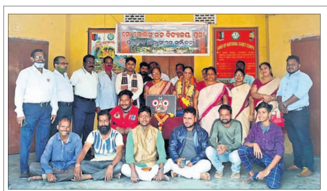
ପୁରୀ ପୋଲିସ୍ ଲାଇନ୍ ହାଇସ୍କୁଲର ପୁରୀତନ ଛାତ୍ରଙ୍କ ପକ୍ଷରୁ ପ୍ରଧାନଶିକ୍ଷୟିତ୍ରୀଙ୍କୁ ବିଦାୟକାଳୀନ ସମ୍ବର୍ଦ୍ଧନା ଦିଆଯାଇଛି।