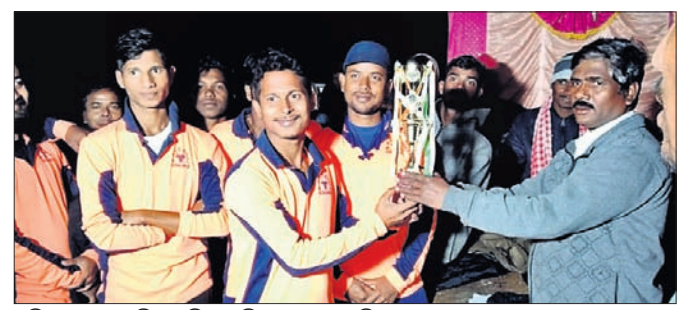
ଅତିଥିଙ୍କଠାରୁ ଚାମ୍ପିୟନ ଟିମ୍ ଟ୍ରଫି ଗ୍ରହଣ କରୁଛନ୍ତି।

ଖୋର୍ଦ୍ଧା ଜିଲା କୃଷ୍ଣପୁରସ୍ଥିତ ଯୋଗମାୟା କ୍ରିକେଟ୍ କ୍ଲବ୍ ଆନୁକୁଲ୍ୟରେ ଅନୁଷ୍ଠିତ ଦିବାରାତ୍ରି ଫର୍ଡ଼ାଫର୍ଡ଼ କ୍ରିକେଟ୍ ଟୁର୍ଣ୍ଣାମେଣ୍ଟ ଉଦ୍‌ଘାଟିତ ହୋଇଯାଇଛି।