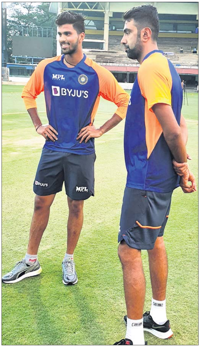
ଇଲଟ୍ ସିପକ୍ସ ପ୍ରଥମ ଡେଇଁ ଖେଳରେ ଚେପକ୍ ଷ୍ଟ୍ରାୟିଂମିନିରେ ଅଭ୍ୟାସ ଅବସରରେ ଇରାଜର ବଲ୍ ଷ୍ଟ୍ରାୟିଂମିନିର ପୁରୁଷ ଦଳରୁ ଇଶାନ୍ତ ସିପକ୍ସର ସଭ୍ୟତାରେ ଉପସାଧନ କରାଯାଇଥିଲା