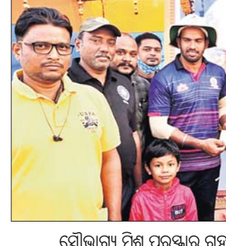
ସୋଲାର କ୍ରିକେଟ୍ କ୍ଳବ୍ ପକ୍ଷରୁ ଉଦ୍‌ଘାଟନା କରାଯାଇଛି।

କଟକ ସୋଲାର କ୍ରିକେଟ୍ କ୍ଳବ୍ ଉଦ୍‌ଘାଟନା କରାଯାଇଛି। କଟକ ସୋଲାର କ୍ରିକେଟ୍ କ୍ଳବ୍ ଉଦ୍‌ଘାଟନା କରାଯାଇଛି।