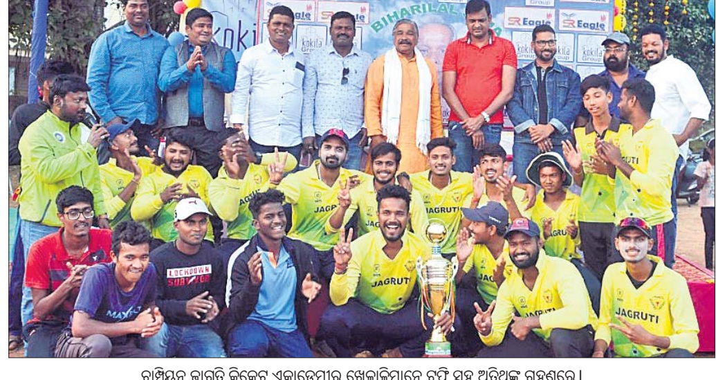
ଚାମ୍ପିୟନ ଜାଗୁଟି କ୍ରିକେଟ୍ ଏକାଡେମୀର ଖେଳାଳିମାନେ ସୁନା ଚାମ୍ପିୟନ ଟ୍ରଫି ସହ ଅଭିଯୁକ୍ତ ହେଲେ।

ପୁରୁଣା ଜୁବେନାଲ୍, ୨୧୨ (ଫି.ଟି.ଏଚ୍.ଏ.): ପୁରୁଣା ଜୁବେନାଲ୍, ୨୧୨ (ଫି.ଟି.ଏଚ୍.ଏ.):