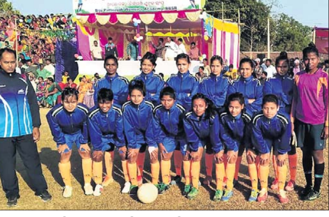
ୟୁନିଟ୍-୨ ଅଧିକାରୀଙ୍କ ଆୟୋଜିତ ଏକ ସମାବେଶରେ କଟକ-ୟୁନିଟ୍-୨ ମ୍ୟାଚ୍ ଡ୍ର ହୋଇଥିଲା।

କଟକ-ୟୁନିଟ୍-୨ ମ୍ୟାଚ୍ ଡ୍ର ହୋଇଥିଲା। କଟକ-ୟୁନିଟ୍-୨ ମ୍ୟାଚ୍ ଡ୍ର ହୋଇଥିଲା।