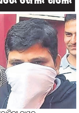
ବାମନ ନାମାଞ୍ଜର ପରେ ଜେଲ ଗଲେ

ଭୁବନେଶ୍ୱର, ୨୧୨ (ବୁଧବାର) ପ୍ରତି ମଣ୍ଡିରେ ସିସିଡିଭି ଲଗାଇବାକୁ ନିର୍ଦ୍ଦେଶ ଦିଆଯାଇଛି। ଆରକ୍ଷକ ଗୋଦାମ ଘର ନିର୍ମାଣ ଲାଗି କମିଟି ପରାମର୍ଶ ଦେଇଛି। ଏହାଛଡା ଚାଷୀଙ୍କୁ ଅଣ୍ଡା ବ୍ୟାଞ୍ଜ ପିଛା ୧୦ ଟଙ୍କା ଏବଂ ପ୍ଲାଷ୍ଟିକ ବ୍ୟାଞ୍ଜ ପିଛା ୫ ଟଙ୍କା ଲେଖାଏଁ ପ୍ରଦାନ ଲାଗି ସୋପାନବିଷୟକ ନିର୍ଦ୍ଦେଶ ଦିଆଯାଇଛି।