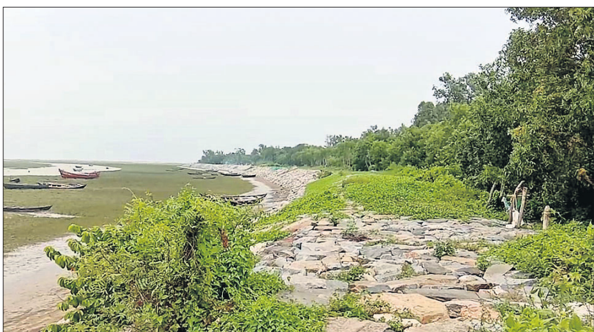
ଗୌରୁଞ୍ଚ ଚରଣା ବେଙ୍ଗାକୁମ୍ଭୀ