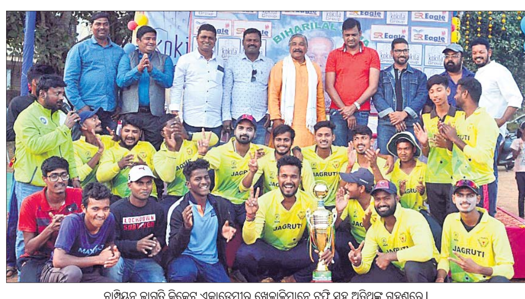
ଚାମ୍ପିୟନ ଜାଗୃତି ଟ୍ରିକେଟ ଏକାଡେମୀର ଖେଳାଳିମାନେ ଟ୍ରଫି ସହ ଅତିଥିଙ୍କ ଗହଣରେ।