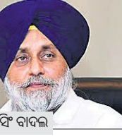
ସୁଖବୀର ସିଂ ବାଦଳ

ଶିରୋମଣି ଅକାଳୀ ଦଳ ଅଧ୍ୟକ୍ଷ ସୁଖବୀର ସିଂ ବାଦଳଙ୍କ ଉପରେ ମଙ୍ଗଳବାର ଚୁନିମାଡ଼ ହୋଇଥିବା ଅଭିଯୋଗ ହୋଇଛି। ତାଙ୍କ ସହ ଦଳର ଅନ୍ୟ ୩ ସଦସ୍ୟ ଏଥିରେ ଆହତ ହୋଇଛନ୍ତି। ଜଣେ କଂଗ୍ରେସ ବିଧାୟକଙ୍କ ଭାଇ ଏପରି କରିଥିବାବେଳେ ପୋଲିସ ତାଙ୍କୁ ସୁରକ୍ଷା ଯୋଗାଉଥିବା