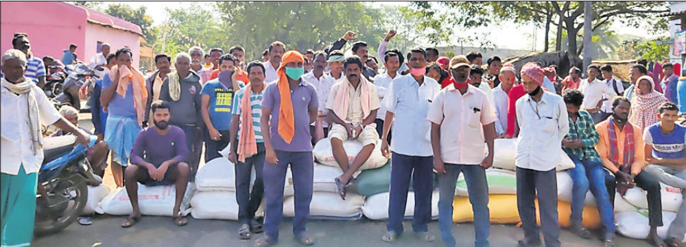
ଚାଷୀମାନେ ରାସ୍ତାରେ ଧାନବତ୍ସା ରଖି ଆନ୍ଦୋଳନ କରୁଛନ୍ତି।

ନ ଥିବା ଚାଷୀ ଅଭିଯୋଗ କରିଛନ୍ତି। ଚଳିତବର୍ଷ ମଣ୍ଡି ବିକ୍ରୟରେ ଆରମ୍ଭ ହୋଇଥିଲେ ମଧ୍ୟ ଶୀଘ୍ର ମଣ୍ଡି ଶେଷ