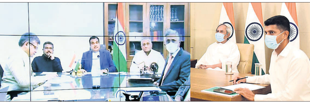
ଭିଡିଓ କନ୍ଫରେନ୍ସରେ କେନ୍ଦ୍ର ମନ୍ତ୍ରୀ ଓ ମୁଖ୍ୟମନ୍ତ୍ରୀଙ୍କ ଆଲୋଚନା।