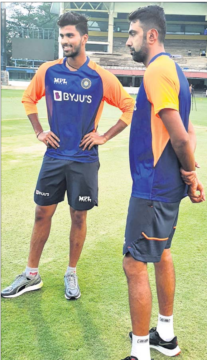
ଇଂଲଣ୍ଡ ବିପକ୍ଷ ପ୍ରଥମ ଟ୍ରିକେଟ ଟେଷ୍ଟ ପାଇଁ ଚେନ୍ନାଇରେ ଚେପକ୍ ଷ୍ଟାଡ଼ିୟମରେ ଅଭାସ୍ୟ ଅବସରରେ ଭାରତୀୟ ଦଳର ଦୁଇ ସିନିଗେଟ୍ ଖେଳାଳି ଓ ରବିଚନ୍ଦ୍ର ଅଶ୍ୱିନ।

ଚମକାର ଫର୍ମରେ ଅଛନ୍ତି। ସେ ନିଜ ପ୍ରଥମ ମ୍ୟାଚରେ ୪ ଉଇକେଟ ନେବାସହ ଅର୍ଦ୍ଧଶତକ ହାସଲ କରିଛନ୍ତି। ଏହା ବ୍ୟତୀତ ବାମହାତୀ ଅର୍ଥୋଡକ୍ସ ସ୍ଥିରର ଅକ୍ଷୟ ପଟେଲ, ସିନିଗେଟ୍ ଅଫ୍‌ବ୍ରେକ୍ ବୋଲର ରବିଚନ୍ଦ୍ର ଅଶ୍ୱିନ ଏବଂ ବାମହାତୀ ଚିଷ୍ଟ ସ୍ଥିରର କୁଲଦୀପ ଯାଦବ ଚୟନ ପାଇଁ ଉପଲବ୍ଧ ହେବେ। ରବୀନ୍ଦ୍ର ଜାଡେଜା ଫିଟ୍ ନାହାନ୍ତି। ଦଳ ଚୟନ ସମୟରେ ଏହା ମଧ୍ୟ ନକରରେ ରଖାଯିବ। ଅକ୍ଷୟ ପଟେଲ ମିଡିଲ ଅର୍ଡରରେ ଉପଯୋଗୀ ବ୍ୟାଟିଂ କରିବାର ମଧ୍ୟ ଦକ୍ଷତା ରଖିଛନ୍ତି। ଟେଷ୍ଟ ଅଭିଜ୍ଞ ସ୍ଥିରର କୁଲଦୀପ ମିଡିବା ସମ୍ଭାବନା ଅଧିକ।