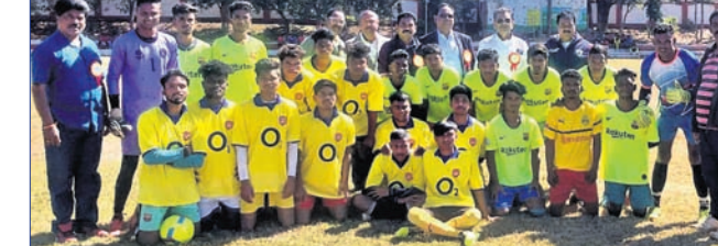
ଚନ୍ଦନ ଶିବିରରେ ଅଂଶଗ୍ରହଣ କରିଥିବା ଖେଳାଳି।