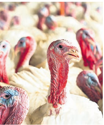
କୁକୁଡ଼ା ଛୁଆକୁ ରାଣାକ୍ଷେତ ରୋଗ ଓ ୧୫ ଦିନର ଛୁଆକୁ ଆଇ.ବି.ଡି. ରୋଗ ଦିଆଯାଏ । ନିମ୍ନଲିଖିତ ଲକ୍ଷଣମାନ ଦେଖାଦେଲେ ବାର୍ତ୍ତ ଫୁଲିନିୟନ୍ତ୍ରଣ ହେବାର ସୂଚନା ମିଳିଥାଏ ।

ବାର୍ତ୍ତ ଫୁଲିନିୟନ୍ତ୍ରଣ ପାଇଁ ପ୍ରତିଷ୍ଠାପକ ବ୍ୟବସ୍ଥା ଗ୍ରହଣ କରନ୍ତୁ । ଦିନରେ ବାୟୁମଣ୍ଡଳର ଉତ୍ତାପ ଅଧିକ ଥିବାରୁ ବ୍ରାହ୍ମଣ କୁକୁଡ଼ା ଛୁଆ ପାଳନ ପାଇଁ କମ୍ ଉତ୍ତାପ ଦିଅନ୍ତୁ (ଆବଶ୍ୟକ ୩୫୦ ସେଣ୍ଟିଗ୍ରେଡ୍) ।