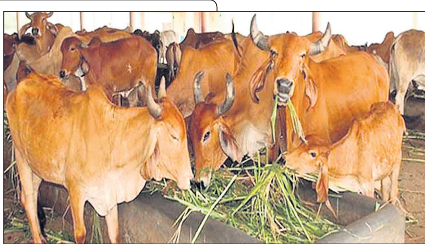
ଏ ମାସର କୃଷି ସୂଚନା

ଗୋରୁକୁ ନଡ଼ା ଖାଇବାକୁ ଦେବା ପୂର୍ବରୁ ପ୍ରଥମେ ନଡ଼ାକୁ କାଟି ପାଣିରେ ୪ ଘଣ୍ଟା ବହୁରାଇ ଦିଅନ୍ତୁ । ପରେ ନଡ଼ାକୁ ପାଣି ଛଡ଼ାଇ ଶୁଖାନ୍ତୁ । ଏହି ନଡ଼ାକୁ ଖାଇବାକୁ ଦେଲେ ନଡ଼ାରେ ଥିବା ଅକ୍ସାଲିକ୍ ଅମ୍ଳ ପରିମାଣ କମିଯାଏ ।