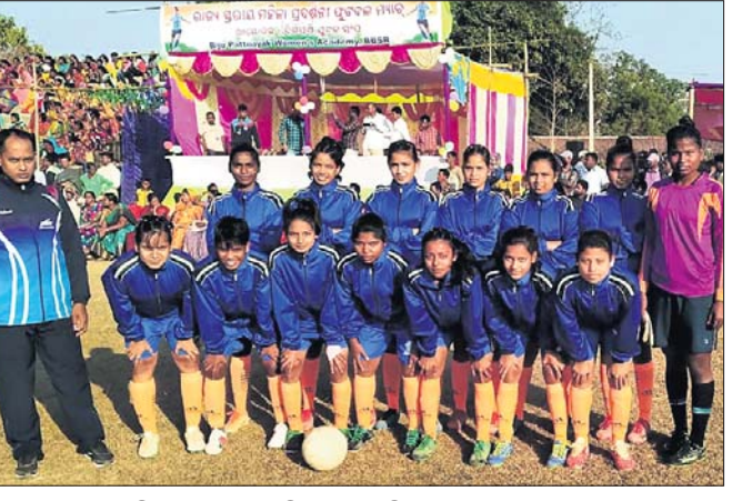
ୟୁନିଟ୍-୨ ଆଧିକାରୀଙ୍କ ଆସୋସିଏସନ ପୁସ୍ତକ ଦଳ।

କଟକନେଶ୍ୱର, ୨୧୨ (କ୍ରୀଡ଼ା ପ୍ରତିନିଧି) ଆସୋସିଏସନ (କ୍ରୁନେଶ୍ୱର) ମ୍ୟାଚ ଗୋଲ୍‌କ୍ରମ୍ସ ଡ୍ର ରହିଛି। ମ୍ୟାଚଟି ବେଶ୍ ସଂପୂର୍ଣ୍ଣସ୍ୱରୂପେ ହୋଇଥିଲେ ହେଁ କୌଣସି ଦଳ ଗୋଲ ଦେଇପାରି ନ ଥିଲା। ମ୍ୟାଚ୍ ୫ ପର୍ଯ୍ୟନ୍ତ ମ୍ୟାଚ୍‌ଟି ପାରଶ୍ୱା କୁଳର ଚୁରୁପୁଲ୍ଲୀ କଲେଜ ଷ୍ଟାଡ଼ିୟମରେ ଅନୁଷ୍ଠିତ ହେବ। ଗ୍ରାମାଞ୍ଚଳ ପୁସ୍ତକ ଦଳର ବିରୋଧୀ ପଢ଼ିଆରେ ଅନୁଷ୍ଠିତ କଟକ ଏବଂ ଯୁନିଟ୍-୨ ଆଧିକାରୀଙ୍କ