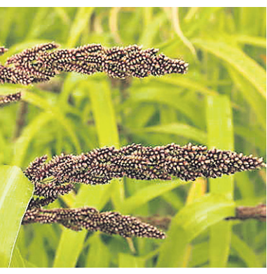
ମାଟି ପରାସା ପରେ ଅନୁମୋଦିତ ସାର ପ୍ରୟୋଗ କରନ୍ତୁ । ମାଟି ପରାସା ହୋଇ ନ ଥିଲେ ଏକର ପ୍ରତି ୨୪: ୧୬:୧୨ ଅନୁପାତରେ ଯବକ୍ଷାରଜାନ, ଫସଫରସ ଓ ପଟାସ ସାର ପ୍ରୟୋଗ କରନ୍ତୁ ।

ମାଣ୍ଡିଆ ଚଳି ତିନି ସପ୍ତାହର ହୋଇଗଲେ ଚଳିକୁ ଧାଡ଼ି ଧାଡ଼ି ୨୦ସେ.ମି ଓ ଗଛକୁ ଗଛ ୧୦ସେ.ମି ବ୍ୟବଧାନରେ ରୁଆନ୍ତୁ । ମାଟି ପରାସା ପରେ ଅନୁମୋଦିତ ସାର ପ୍ରୟୋଗ କରନ୍ତୁ ।