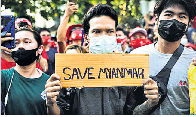
ମ୍ୟାନ୍ମାର ଦୂତାବାସ ସମ୍ମୁଖରେ ବିରୋଧ ପ୍ରଦର୍ଶନ କରାଯାଇଛି।

ଏକ ଅପ୍ରତ୍ୟାଶିତ ଘଟଣାକ୍ରମେ ମ୍ୟାନ୍ମାରର ସୈନ୍ୟବାହିନୀ ସୋମବାର ବିଦ୍ରୋହ ବଳରେ ଦେଶ ଶାସନକୁ ନିଜ ନିୟନ୍ତ୍ରଣକୁ ନେଇଥିଲା। ନୋବେଲ ପୁରସ୍କାର ବିଜେତା ନେତ୍ରୀ ଅଙ୍ଗ ସାନ୍ ଟାଙ୍କ ସମେତ ବହୁ ବରିଷ୍ଠ ନେତାଙ୍କୁ ରିଟ୍ ହାତ କରାଯାଇଥିଲା। ୫ ଦଶନ୍ଧିର ସାମରିକ ଶାସନ ପରେ ଗଣତନ୍ତ୍ର ହାସଲ କରିଥିବା ଏହି ଦେଶ ପୁଣିଥରେ ସେନା କବଳକୁ ଚାଲିଯାଇଛି ଓ ଦେଶରେ ରାଜନୈତିକ ଅନିଶ୍ଚିତତା ଦୃଷ୍ଟି ହୋଇଛି। ସାମରିକ ଶାସନ ବିରୋଧରେ ଆନ୍ଦୋଳନ ପାଇଁ ସୁ ଟା ଓ ଦଳର ଅନ୍ୟ ନେତାମାନେ ଆହ୍ଲାନ୍ ଦେଇଛନ୍ତି। ସାମରିକ ବିଦ୍ରୋହକୁ ବିରୋଧ କରିବା ନିମନ୍ତେ ମଙ୍ଗଳବାର ଯୁଦ୍ଧ ଯୋଦ୍ଧା ହସ୍ତାନ୍ତର ପାଇଁ ମ୍ୟାନ୍ମାରର ସୈନ୍ୟବାହିନୀ ଉପରେ ଅତ୍ୟନ୍ତ ଚାପ ସୃଷ୍ଟି କରିବା ପାଇଁ ପକାଇବା ଲାଗି ଆମେରିକା ରାଷ୍ଟ୍ରପତି ଜେ ବାଇଡେନ୍ ଆହ୍ଲାନ୍ ଦେବା ସହ କାର୍ଯ୍ୟାନୁଷ୍ଠାନ ଚେତାବନୀ ଦେଇଛନ୍ତି। ସାମରିକ ବିଦ୍ରୋହ ମ୍ୟାନ୍ମାରରେ ଗଣତନ୍ତ୍ରିକ ସଂସ୍କାର ପ୍ରତି ଶକ୍ତ ଧ୍ୟାନ ଦେଇ କାଠିସଂଘ ମହାସଭାରେ ଆଖ୍ୟେନିଠି ରୁଚେରେସ୍ କହିଛନ୍ତି।