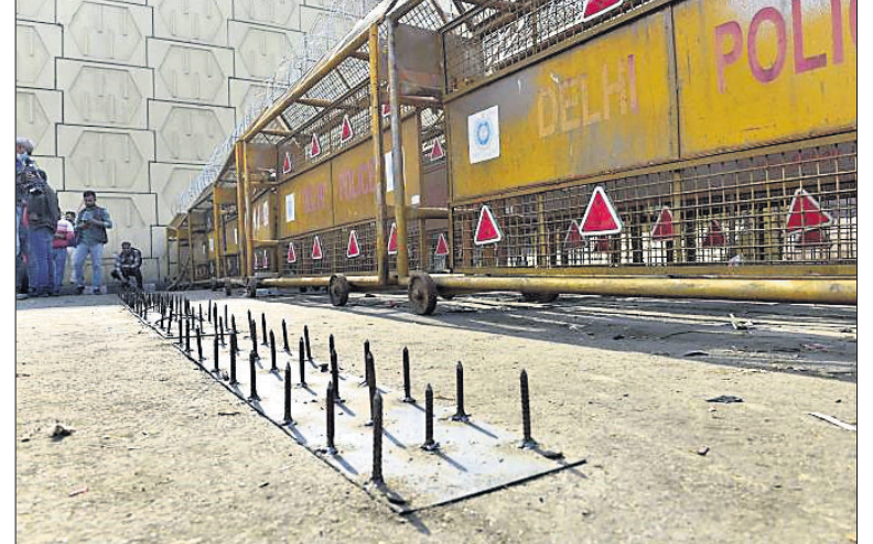
ସିବାକୁ ପଡ଼ୁଛି। ଏହା ସହ ଆନ୍ଦୋଳନ ପ୍ରତି ସମର୍ଥନ ଦେଖୁଥିବା ଭାରତୀୟ କିଷାନ ଯୁନିୟନ

ଗଣମାନେ ଆନ୍ଦୋଳନ ଚଳାଇଥିବା ଦିଲ୍ଲୀ ସୀମାରେ ବ୍ୟାପକ ସୁରକ୍ଷା ବ୍ୟବସ୍ଥା ସାଙ୍ଗକୁ ବହୁସୁରାୟ, ବ୍ୟାରିକେଡ୍ କରାଯାଇଛି। ଫଳରେ ଦିଲ୍ଲୀ ସୀମା ଏକପ୍ରକାର ଦୁର୍ଗରେ ପରିଣତ ହୋଇଛି। ରାସ୍ତାରେ ଲୁହାକଣ୍ଠା ପୋତାଯିବା ସହ କଣ୍ଠା ଚାରବାଡ଼ କରାଯାଇଛି। ଏଥିସହ ଚାନ୍ଦିଘାଟରେ ସିନେଟ୍ ଅବରୋଧ ରଖାଯାଇଛି। ଆନ୍ଦୋଳନ ସ୍ଥଳରେ ତିନିସି ବସଗୁଡ଼ିକୁ ନିୟୋଜିତ କରାଯାଇଛି। ଅତିରିକ୍ତ ସୁରକ୍ଷାବଳକୁ ମଧ୍ୟ ଦିଲ୍ଲୀ ସୀମାରେ ମୃତ୍ୟୁନ କରାଯାଇଛି। ଜାନୁୟାରୀ ୨୬ ହିଂସାକାଣ୍ଡ ପରେ ଆନ୍ଦୋଳନ ସ୍ଥଳରେ ସୁରକ୍ଷା ବ୍ୟବସ୍ଥା ବଢ଼ାଯାଇଛି। ଖବର ସଂଗ୍ରହ ପାଇଁ ଗଣମାଧ୍ୟମ ପ୍ରତିନିଧିମାନେ ବହୁ ଜଣଙ୍କୁ ସେଠାରେ ପହଞ୍ଚିଛନ୍ତି। ମାଞ୍ଚ ପରେ ବହୁସୁରାୟ, ବ୍ୟାରିକେଡ୍ ବେଳ ସେମାନଙ୍କୁ