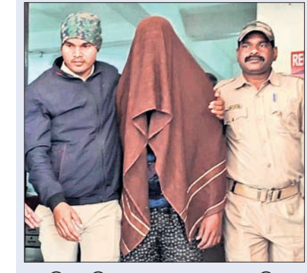
ପୋଲିସ୍ ଅଭିଯୁକ୍ତଙ୍କୁ ଘଟଣାସ୍ଥଳକୁ ନେଉଛି।