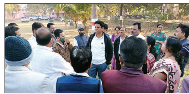
ବିଦ୍ୟାଳୟ ପରିସରରେ ଶିକ୍ଷୟିତ୍ରୀ ଶିକ୍ଷକଙ୍କ ସହ ଆଲୋଚନା କରୁଛନ୍ତି ପ୍ରଶାନ୍ତ।

କନ୍ଦପୁର ସରକାରୀ ଉଚ୍ଚ ବିଦ୍ୟାଳୟକୁ ପୋଷ୍ୟ ବିଦ୍ୟାଳୟ ଭାବେ ଗ୍ରହଣ କରିଛନ୍ତି ଯାଜପୁର ବିଧାୟକ ପ୍ରଶାନ୍ତ ପ୍ରକାଶ ଦାସ।