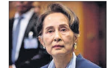
ସାମରିକ ବାହିନୀ ବିଦ୍ରୋହ ବଳରେ ଦେଶର ଶାସନକୁ କବ୍‌ଜା କରିଛି। ସୁ

ଝାନ୍ସୁନ, ୨୧: ମ୍ୟାନ୍ମାରରେ ଗଣତନ୍ତ୍ରିକ ସଂସ୍କାର ସମ୍ପର୍କରେ ସତର୍କତା ପ୍ରକାଶନାକାରୀ ସୈନ୍ୟବାହିନୀ ପରିବର୍ତ୍ତନକୁ ଗ୍ରହଣ କରିବି। ପାଞ୍ଚ ଦଶନ୍ଧିର ସାମରିକ ଶାସନ ପରେ ୨୦୧୬ରେ ମ୍ୟାନ୍ମାର ନେତ୍ରୀ ହୋଇଥିବା ଅଙ୍ଗ ସାନ୍ ସୁ ଟା ଅନେକ ଥର ଏଭଳି ସତର୍କ କରାଇଥିଲେ। ତାଙ୍କର ଏହି ସତର୍କବାଣୀ ସତ୍ୟ ସାବ୍ୟସ୍ତ ହୋଇଛି। ସୋମବାର