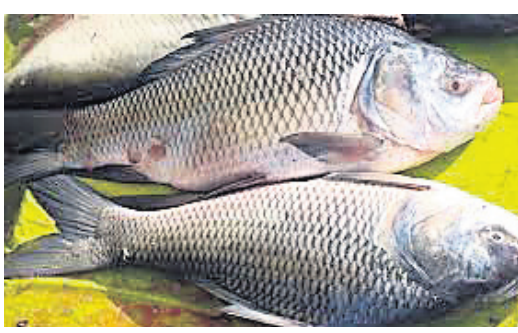
କ୍ଲୋରୋଫାଇଟିନକୁ ୧ ଲିଟର ପାଣିରେ ଦ୍ରବଣ ପ୍ରସ୍ତୁତ କରି ମାଛଗୁଡ଼ିକ ୫-୬ ମିନିଟ୍ ପର୍ଯ୍ୟନ୍ତ ବୁଡ଼ାଇ ରଖନ୍ତୁ । ଏହା ବ୍ୟତୀତ ପଟାସିୟମ ପରମାଙ୍ଗାନେଟ୍ ଦ୍ରବଣରେ (୫ ମିଲିଗ୍ରାମ୍ ୧ ଲିଟର ପାଣିରେ) ମାଛକୁ ପ୍ରାୟ ୫ରୁ ୬ ମିନିଟ୍ ପର୍ଯ୍ୟନ୍ତ ବୁଡ଼ାଇ ରଖାଯାଇପାରେ ।

ସାଧାରଣତଃ ଭାକୁର ମାଛର ଆଖିରୋଗ ଦେଖାଯାଇଥାଏ । ଏହାର ପ୍ରାଥମିକ ଲକ୍ଷଣରେ ଆଖିର ସ୍ପଷ୍ଟତା ଉପରେ ଆକ୍ରମଣ ହୋଇଯାଏ ଓ କିଛିଦିନ ପରେ ଏହା ଅସ୍ପଷ୍ଟ ହୋଇ କ୍ରମେ ପରିସାଧ୍ୟ ଆଖି ନଷ୍ଟ ହୋଇଯାଏ ।