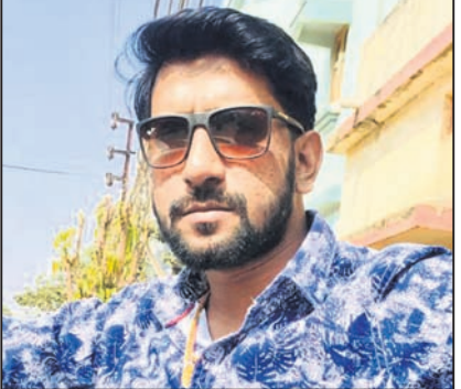
ପରଦା ପଛରେ/ ବ୍ୟୋମକେଶ