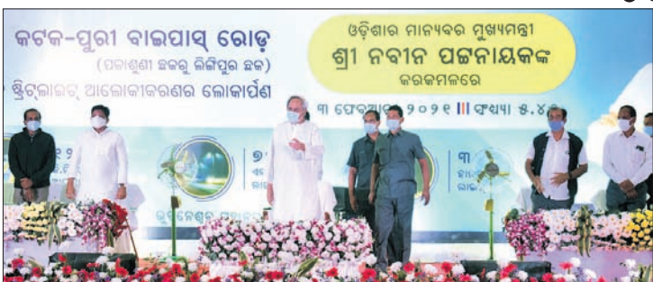
କଟକ-ପୁରୀ ବାଇପାସ୍ ରାସ୍ତା ଆଲୋକୀକରଣ ବ୍ୟବସ୍ଥାକୁ ମୁଖ୍ୟମନ୍ତ୍ରୀ ନବୀନ ପଟ୍ଟନାୟକ ଉଦ୍ଘାଟନ କରୁଛନ୍ତି।

ଭୁବନେଶ୍ୱର(ବ୍ୟବସ୍ଥା)/ ପୁରୁଣା ଭୁବନେଶ୍ୱର, ୩୨(ଡି.ଏ.ଏ.) ମୁଖ୍ୟମନ୍ତ୍ରୀ ନବୀନ ପଟ୍ଟନାୟକ ରୁଧିରୀ ସହଯୋଗୀ ଭାବେ ଭୁବନେଶ୍ୱର ଚଳାଯାଉଥିବା କଟକ-ପୁରୀ ବାଇପାସ୍ ରୋଡ୍‌ରେ ଏଲିକ୍ଟ୍ରିକାଲ ଆଲୋକୀକରଣ ବ୍ୟବସ୍ଥାର ଲୋକାର୍ପଣ କରିଛନ୍ତି। ଏହି ବ୍ୟବସ୍ଥା ବାଇପାସ୍ ରୋଡ୍‌ର ପକାଣ୍ଡ ଛକଠାରୁ ଲିଫ୍ଟପୁର ଛକ ପର୍ଯ୍ୟନ୍ତ ୧୨ କି.ମି. ରାସ୍ତାରେ କାର୍ଯ୍ୟକାରୀ କରାଯାଇଛି। ଏହାଦ୍ୱାରା ବିଦ୍ୟୁତ୍ ଶକ୍ତି ଖର୍ଚ୍ଚ କମିବା ସହିତ ଚୋରି ଓ ଲୁଟପାଟ ଉଚ୍ଚ ଆପତ୍ୟକାରୀ କାର୍ଯ୍ୟକଳାପ ମଧ୍ୟ ହ୍ରାସ ପାଇବ ବୋଲି ମୁଖ୍ୟମନ୍ତ୍ରୀ କହିଛନ୍ତି।