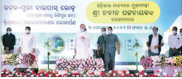
କଟକ-ପୁରୀ ବାଇପାସ୍ ରାସ୍ତା ଆଲୋକୀକରଣ ବ୍ୟବସ୍ଥାକୁ ମୁଖ୍ୟମନ୍ତ୍ରୀ ନବୀନ ପଟ୍ଟନାୟକ ଉଦ୍ଘାଟନ କରୁଛନ୍ତି।

ଭୁବନେଶ୍ୱର(ବ୍ୟବସ୍ଥା)/ ପୁରୁଣା ଭୁବନେଶ୍ୱର, ୩୨(ଡି.ଏ.ଏ.) ମୁଖ୍ୟମନ୍ତ୍ରୀ ନବୀନ ପଟ୍ଟନାୟକ ରୁଧିରୀ ସହଯୋଗୀ ଭାବେ ଭୁବନେଶ୍ୱର ଚଳାଯାଉଥିବା କଟକ-ପୁରୀ ବାଇପାସ୍ ରୋଡ୍ରେ ଏଲିକ୍ଟ୍ରିକାଲ ଆଲୋକୀକରଣ ବ୍ୟବସ୍ଥାର ଲୋକାର୍ପଣ କରିଛନ୍ତି। ଏହି ବ୍ୟବସ୍ଥା ବାଇପାସ୍ ରୋଡ୍ରେ ପକାଣ୍ଡୁଣୀ ଛକଠାରୁ ଲିଫ୍ଟପୁର ଛକ ପର୍ଯ୍ୟନ୍ତ ୧୨ କି.ମି. ରାସ୍ତାରେ କାର୍ଯ୍ୟକାରୀ କରାଯାଇଛି। ଏହାଦ୍ୱାରା ବିଦ୍ୟୁତ୍ ଶକ୍ତି ଖର୍ଚ୍ଚ କମିବା ସହିତ ଚୋରି ଓ ଲୁଚପାଟ ଭଳି ଆପଦାଧିକାରୀ କାର୍ଯ୍ୟକଳାପ ମଧ୍ୟ ହ୍ରାସ ପାଇବ ବୋଲି ମୁଖ୍ୟମନ୍ତ୍ରୀ କହିଛନ୍ତି।