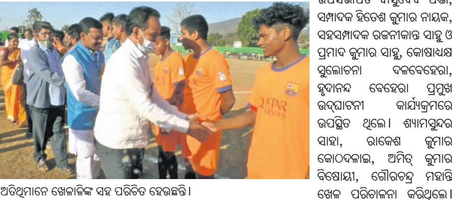
ଅତିଥିମାନେ ଖେଳାଳିଙ୍କ ସହ ପରିଚିତ ହେଉଛନ୍ତି।

ଫୁଲବାଣୀ ଜେ.ଡି. କ୍ଲବ୍ ଓ ସୋନପୁର କାମଧେନୁ କ୍ଲବ୍ ମଧ୍ୟରେ ଅନୁଷ୍ଠିତ ହୋଇଥିଲା। ଜେ.ଡି. କ୍ଲବ୍ ୩-୧ରେ ବିଜୟୀ ହୋଇଛି। ସମ୍ପୂର୍ଣ୍ଣ ଖାତାକୁ ମ୍ୟାନ ଅଫ୍ ଦି ମ୍ୟାଚ୍ ବିବେଚିତ କରାଯାଇଥିଲା।