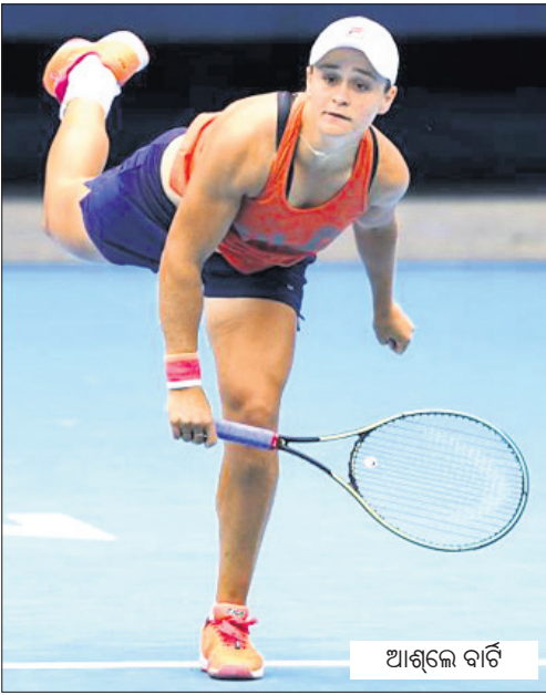
ସିଡ଼ନିରେ ୨-୧(୪), ୨-୩, ୨-୨ ସେଟ୍ରେ ଜେଲେନା ଅଷ୍ଟ୍ରେଲିଆ ଏବଂ ଏଲିସ ମେର୍ଟେନ୍ସ ୨-୨(୧), ୨-୩ ସେଟ୍ରେ କାରୋଲିନା ଗାର୍ସିଆଙ୍କୁ ହରାଇ ଆଗକୁ ବଢ଼ିଛନ୍ତି।

ଆଗାମୀ ସପ୍ତାହକୁ ଆରମ୍ଭ ହେବାକୁ ଯାଉଥିବା ଅଷ୍ଟ୍ରେଲିଆନ ଓପନ ଗ୍ରାଣ୍ଡସ୍ଲାମ୍ ଟେନିସ୍ ପୂର୍ବରୁ ଖେଳାଳିମାନେ ବିଭିନ୍ନ ଟୁର୍ଣ୍ଣାମେଣ୍ଟ ଖେଳି ନିଜକୁ ପ୍ରସ୍ତୁତ କରୁଛନ୍ତି।