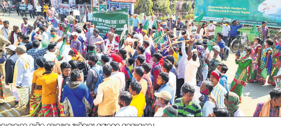
ଶୋଭାଯାତ୍ରାରେ ସାର୍ନା ହୋଇଥିବା ଆଦିବାସୀ ସଙ୍ଗଠନର ସଦସ୍ୟମାନେ।