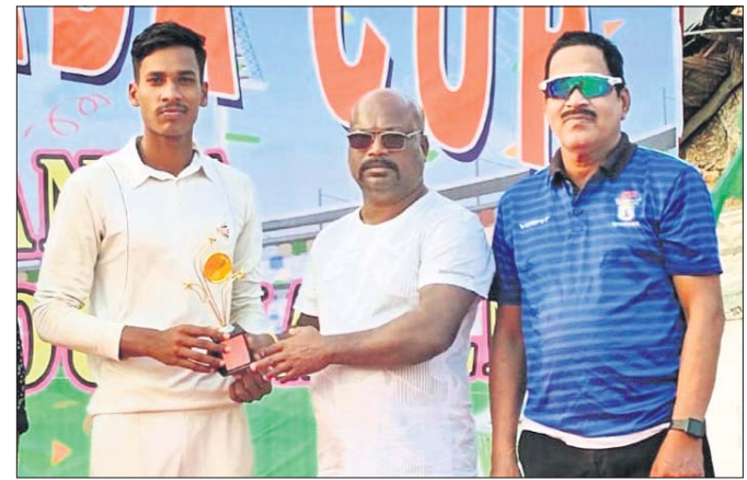
ଜନ୍ମଦିନ ନାମକ ଅତିଥି ପୁରସ୍କୃତ କରୁଛନ୍ତି ।