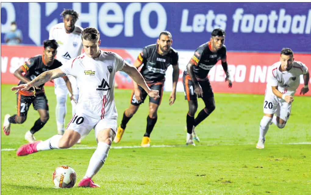
ଗୁରୁବାର ନର୍ଥଇଷ୍ଟ ଯୁବାଇଚେତ ଓ ଏସ୍‌ସି ଗୋଆ ମଧ୍ୟରେ ଅନୁଷ୍ଠିତ ମ୍ୟାଚର ଏକ ବିଶେଷ ମୁହୂର୍ତ୍ତ ।