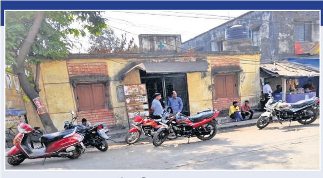
ତାଳଚେର ସହରରେ ଥିବା ପୌରପରିଷଦ ତାଲୁରଖାନା।

ନିମନ୍ତେ ହାଟଟୋପାଠାରେ ପୌର ପରିଷଦ ପକ୍ଷରୁ ଏକ ତାଲୁରଖାନା ଖୋଲାଯାଇଥିଲା। ଏହା ଉପରେ ପୌର ପରିଷଦର ୧୦ରୁ ୧୨ଟି ଖର୍ଚ୍ଚ (ଫାଷ୍ଟରେଟ୍ ଠାରୁ ହାଣ୍ଡିଆ ପର୍ଯ୍ୟନ୍ତ)ର ଜନସାଧାରଣ ନିର୍ଭର କରନ୍ତି। ପ୍ରତ୍ୟକ୍ଷ ଶତାଧିକ ରୋଗୀ ବିଭିନ୍ନ ରୋଗର ଚିକିତ୍ସା ପାଇଁ ଅବସର ନେଇଯାଉଥିଲେ ମଧ୍ୟ ତାଲୁର ପି.କେ. ଦାସଙ୍କୁ ଏଠାରେ ନିଯୁକ୍ତି ଦିଆଯାଇଥିଲା। କିନ୍ତୁ ତାଙ୍କ ପରଲୋକ ପରେ ପୌର ପରିଷଦ ତାଲୁରଖାନା ତାଲୁରଖିନି ହୋଇଗଲା। ଦୀର୍ଘ ୧୭ ମାସ ହେଲା ଏହି ତାଲୁରଖାନାରେ