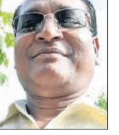
ଧାନ ଦେଉନାହାନ୍ତି। ବାପତଳ ଅଧାର ଭଳି ଅଞ୍ଚଳବାସୀ ଭାଗ୍ୟକୁ ଆଦରି ରହିଛନ୍ତି।

ପୌରପରିଷଦ ତାଲୁରଖାନା ଯୋଗୁ ୨୧ଟି ଖର୍ଚ୍ଚଦାୟକ ସହକରେ ସ୍ୱାସ୍ଥ୍ୟସେବା ମିଳିପାରୁଥିଲା। କିନ୍ତୁ ଦୀର୍ଘଦିନ ହେଲା ତାଲୁର ନ ଥିବାରୁ ସେବା ବ୍ୟାହତ ହୋଇଛି। ପ୍ରଶାସନ, ରାଜ୍ୟ ସରକାର ଏଥିପ୍ରତି