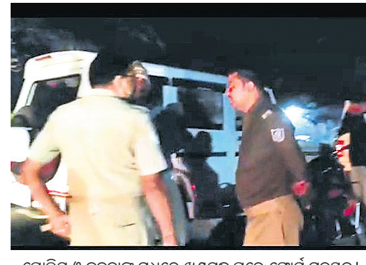
ପୋଲିସ ଓ ଜନତା ମଧ୍ୟରେ ଖଣ୍ଡଯୁଦ୍ଧ ପରେ ଫୋର୍ସ ମୁତୟନ।