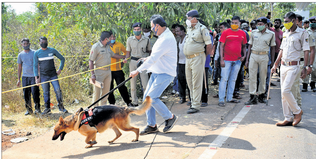
ସନ୍ଧ୍ୟା ୬ଟିରୁ ପୂର୍ବରୁ ଘଟଣାସ୍ଥଳକୁ ନିଆଯାଇଛି।

ଭୁବନେଶ୍ୱରରେ ବଳିଗଳା ଅପରାଧୀଙ୍କ ବନ୍ଦରତା। ଉପାଦେୟା ଛାତ୍ରୀ ଓଡ଼ିଆ ଲେଖିକା ମୁଖ୍ୟ ଉପରୁ ପର୍ଯ୍ୟନ୍ତ ହଟି ନ ଥିବାବେଳେ ରାଜଧାନୀ ଉପକଣ୍ଠରେ ଜଣେ ମହିଳାଙ୍କୁ ଅତି ବାଉଁଶ ଭାବେ ହତ୍ୟା କରାଯାଇଛି। ଗୁରୁବାର ଚନ୍ଦନା ଆନା ଅନ୍ତର୍ଗତ ଅନ୍ଧାରୁଆ ବାସପୁର ରାସ୍ତାକଡ଼ରୁ ତାଙ୍କର ମୁଣ୍ଡବିହୀନ ମୃତଦେହ ମିଳିଛି। ଅପରାଧୀମାନେ ତାଙ୍କ ବେକ କାଟି ମୁଣ୍ଡ ନେଇଯାଇଛନ୍ତି। ମହିଳାଙ୍କ ଶରୀରସାରା କ୍ଷତ ଚିହ୍ନ ଥିବାବେଳେ ବକାଳାର ପରେ ଏକଜି ନୃଶ୍ୟ କାଣ୍ଡ ଘଟାଇଥିବା ଅନୁମାନ କରାଯାଇଛି। ଡିପି, ଅତିରିକ୍ତ ଡିପି, କ୍ଷେତ୍ରାଳୟ ଓ ଏସିପି ଓ ୩ ଥାନାର ଆଇଆଇସି ଘଟଣାସ୍ଥଳରେ ପହଞ୍ଚି ତଦନ୍ତ ଆରମ୍ଭ କରିଛନ୍ତି। ମୁଣ୍ଡ ନ ଥିବାରୁ ପିତରତ୍ୟ ପାଇବା କଷ୍ଟକର ହୋଇପାରେ। ଫରେନସିକ୍ ଟିମ୍ ମହିଳାଙ୍କ ରକ୍ତ ଓ ନମୁନା ସଂଗ୍ରହ କରି ପରୀକ୍ଷା ପାଇଁ ପଠାଇଛି। ମୃତଦେହଠାରୁ ଅଳ୍ପ କିଛି ଦୂର ଜଙ୍ଗଲିଆ ସ୍ଥାନରୁ ଏକ ଛୁରି, ରକ୍ତଭିଜା ହାତୀ ଗୋଠୁର ଓ ମହିଳାଙ୍କ ପୋଷାକ ମିଳିଛି। ନିକଟରେ ଭଙ୍ଗା ମଦ ବୋତଲ ପଡ଼ିଥିବାବେଳେ କାର୍ ତକା ଚିହ୍ନ ରହିଛି। ସନ୍ଧ୍ୟା ୬ଟିରୁ ପୂର୍ବରୁ ଘଟଣାସ୍ଥଳରେ କଟାମୁଣ୍ଡ ସହ ଅନ୍ୟ କିଛି ପ୍ରମାଣ ପାଇବା ପାଇଁ ପୋଲିସ୍ ଉଦ୍ୟମ କରିଥିଲେ ମଧ୍ୟ ସେପରି କିଛି ସୂଚନା ମିଳିପାରି ନାହିଁ। ଶେଷରେ ମୃତଦେହ କବଚ କରି ବ୍ୟବହୃତ ପାଇଁ କ୍ୟାମିଟାଲ ହସ୍ପିଟାଲ ପଠାଇଛି। ନିଜଆଁ ଏକ ହତ୍ୟା ମାମଲା (ନଂ.୨୭/୨୧) ରୁକ୍ଷ କରି ଅଧିକ ତଦନ୍ତ ଚଳାଇଛି ଚନ୍ଦନା ପୋଲିସ୍। ସକାଳ ପ୍ରାୟ ସାଢ଼େ ୮ଟା ହେବା ବାସପୁର ରାସ୍ତା ବେଳେ ଗୁମାସ୍ତା ଅଞ୍ଚଳର