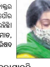
ଧାନ ଦେଉନାହାନ୍ତି। ବାପତଳ ଅଧାର ଭଳି ଅଞ୍ଚଳବାସୀ ଭାଗ୍ୟକୁ ଆଦରି ରହିଛନ୍ତି।

ହେଉଥିବାରୁ ଯେତେଶାସ୍ତ୍ର ସମୟ ତାଲୁର ନିଯୁକ୍ତି ଦିଆଯିବ। ଏଥିପାଇଁ ପୌର ପ୍ରଶାସନ ପକ୍ଷରୁ ଉଦ୍ୟମ ଜାରି ରହିଛି।