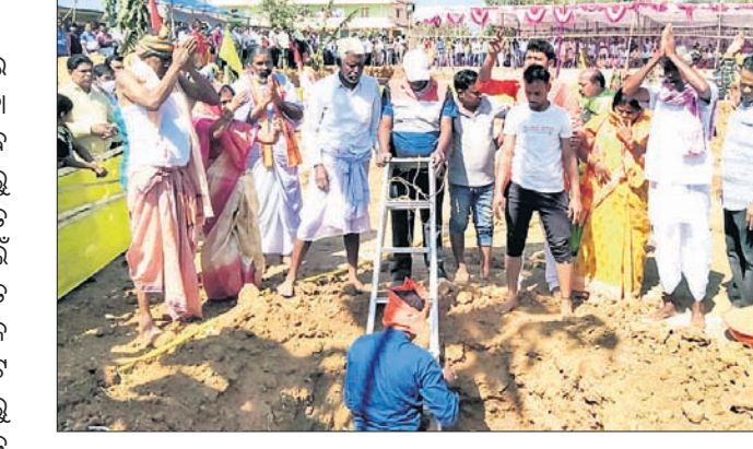
ମନ୍ଦିରର ଭୂମିପୂଜା କରାଯାଇଛି।

କିଶୋରନଗର ବୁକ ବଜଣାଠାରେ ଗୁରୁବାର ଶିବ ଓ ରାଧାକୃଷ୍ଣ ମନ୍ଦିରର ଭୂମିପୂଜା କାର୍ଯ୍ୟକ୍ରମ ଅନୁଷ୍ଠିତ ପରୀକ୍ଷା କରାଯାଇଛି। ସେହିପରି ଜିଲ୍ଲା ଗତ ୨ ତାରିଖ ସୁଦ୍ଧା ୧୨ ହଜାର ୫୦୨ ଜଣ ଆକ୍ରାନ୍ତ ହୋଇଥିବାବେଳେ ୧୨ ହଜାର ୧୬୧ ଜଣ ସ୍ତବ୍ଧ ହୋଇଛନ୍ତି। ୩୪ ଜଣଙ୍କ ଜୀବନ ଯାଇଥିବା ଜିଲା ପ୍ରଶାସନ ପକ୍ଷରୁ ଅବଗତ କରାଯାଇଛି।