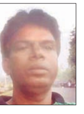
ଧାନ ଦେଉନାହାନ୍ତି। ବାପତଳ ଅଧାର ଭଳି ଅଞ୍ଚଳବାସୀ ଭାଗ୍ୟକୁ ଆଦରି ରହିଛନ୍ତି।

ଏହି ତାଲୁରଖାନା ଉପରେ ଆଖପାଖ ଅଞ୍ଚଳର ଲୋକ ନିର୍ଭର କରନ୍ତି। କିନ୍ତୁ କୋଭିଡ୍ ସମୟରେ ତାଲୁର ନ ଥିବାରୁ ଲୋକମାନେ ଉପକୃତ ହୋଇପାରିଲେ ନାହିଁ। ଜିଲା ଖଣିକ ପାଣ୍ଡିଠୁ ତୁରନ୍ତ ତାଲୁର ନିଯୁକ୍ତି ଦିଆଯାଇ ସହରବାସୀଙ୍କୁ ସ୍ୱାସ୍ଥ୍ୟସେବା ଯୋଗାଇ ଦେବା ନିମନ୍ତେ ପଦକ୍ଷେପ ନିଆଯାଉ।