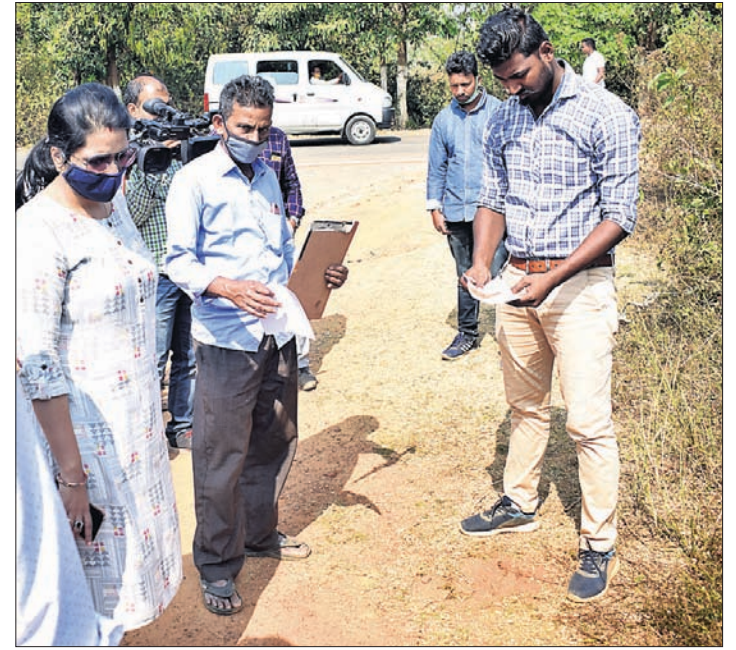
ଘଟଣାସ୍ଥଳରେ ସାଇଣିଫିକ୍ ଟିମ୍ ତଦନ୍ତ।

ପହିଳାଙ୍କୁ ବଳାହାର ପରେ ହତ୍ୟା କରାଯାଇଥିବା ପ୍ରାଥମିକ ତଦନ୍ତରୁ ପୋଲିସ୍ ସନ୍ଦେହ କରୁଥିବାବେଳେ ଏହା ପଛରେ ଆଉ ଏକ ବଡ଼ କାରଣ କୁଟି ରହିଥିବା ଜଣାପଡ଼ିଛି। ପହିଳାଙ୍କୁ ହତ୍ୟା କରାଯିବାବେଳକୁ ସେ ଗର୍ଭବତୀ ଥିବା ତାଙ୍କୁ ମାଲିନୀରୁ ଜଣାପଡ଼ିଥିବା ବିଶ୍ୱସ୍ତ ସୂଚନା ସୂଚନା ମିଳିଛି। ଏହା ତାଙ୍କ ହତ୍ୟାର କାରଣ ଥିବା ସନ୍ଦେହ କରାଯାଉଛି। ପୋଲିସ୍ ଏଭଳି ବିଭିନ୍ନ ଦିଗକୁ ନେଇ ତଦନ୍ତ କରୁଛି।