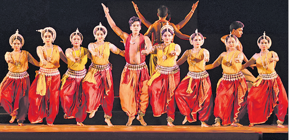
ଧଉଳି କଳିଙ୍ଗ ମହୋତ୍ସବରେ ଶନିବାର ଓଡ଼ିଶା ତ୍ୟାଗୁ ଏକାଡେମୀ କଳାକାରଙ୍କ ଦ୍ୱାରା ଓଡ଼ିଶା ନୃତ୍ୟ ପରିବେଷଣ କରାଯାଇଛି।