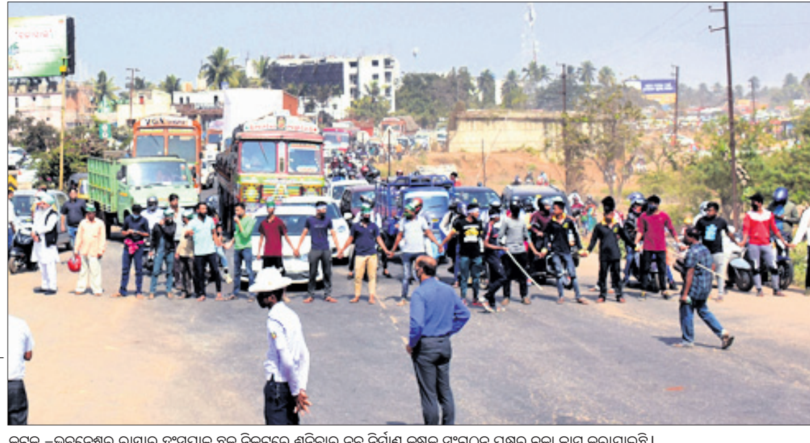
କଟକ - ଭୁବନେଶ୍ୱର ରାସ୍ତାର ହଠାତ୍ ସଂଘଟଣା ଯୋଗୁଁ ଗୋଟିଏ ବସ ନିର୍ମାଣ କ୍ଷେତ୍ର ସଂଗଠନ ପକ୍ଷରୁ ଚଳା ଯାଉଥିଲା।