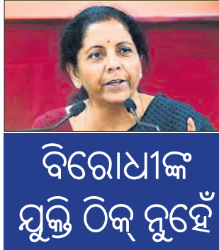
ବିରୋଧୀଙ୍କ ମୁକ୍ତି ଠିକ୍ ନୁହେଁ

ଦେଶର ସମଗ୍ର ସରକାର ଘରୋଇ କ୍ଷେତ୍ର ହାତକୁ ନେଇ ଦେଇଥିବା ବିରୋଧୀ ଦଳଗୁଡ଼ିକ ଅଭିଯୋଗ ଆଣିବା ପରେ ଅର୍ଥମନ୍ତ୍ରୀ ନିର୍ମଳା ସାତାଭାନୀ ଏହାର ଉତ୍ତର ରଖିଛନ୍ତି। ବିରୋଧୀଙ୍କୁ ଏହି ମୁକ୍ତିକୁ ଅର୍ଥମନ୍ତ୍ରୀ ଖଣ୍ଡନ କରିଛନ୍ତି। ଉଲ୍ଲେଖଯୋଗ୍ୟ, ନିକଟରେ ଆସିଥିବା ବଜେଟରେ ସରକାର ଘରୋଇକରଣ ନେଇ କେତେକ ପ୍ରସ୍ତାବ ରଖିଛନ୍ତି। ଏହାକୁ ବିରୋଧୀ ଦଳଗୁଡ଼ିକ ପରିବାରର ସମ୍ପତ୍ତି ଭିତ୍ତି କରି ଅଭିଯୋଗ ଆଣିଛନ୍ତି। ଏଠାରେ ଏକ କାର୍ଯ୍ୟକ୍ରମକୁ ସମୋଧିତ କରି ଅର୍ଥମନ୍ତ୍ରୀ କହିଛନ୍ତି, ପୂର୍ବ ସରକାରଙ୍କ ସମୟରେ ପୁଣି ପ୍ରତ୍ୟାହାର କରାଯାଇଛି। ପ୍ରଧାନମନ୍ତ୍ରୀ ନରେନ୍ଦ୍ର ମୋଦିଙ୍କ ସମୟରେ ଏ ନେଇ ପ୍ରତ୍ୟାହାର କରାଯାଇଛି। କେଉଁ କମ୍ପାନୀଗୁଡ଼ିକରୁ ଅଂଶଧନ ପ୍ରତ୍ୟାହାର ହେଉଛି, ବିରୋଧୀ