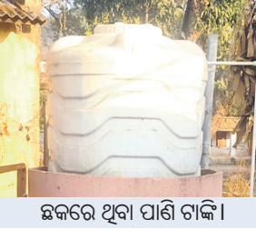
ଛକରେ ଥିବା ପାଣି ଟାଙ୍କି।

ବାହାରିବା ଲୋକେ ଦେଖୁନାହାନ୍ତି। ଏହି ଛକ ନିକଟରେ କୌଣସି ନଳକୂପ ଅବା କୂଅ ନାହିଁ। ପ୍ରତିଦିନ ଶତାଧିକ ଜନସାଧାରଣ ବିଭିନ୍ନ କାମରେ ଯିବାକୁ ଏଠାକୁ ଆସି ବିଶ୍ରାମାଗାରଠାରେ