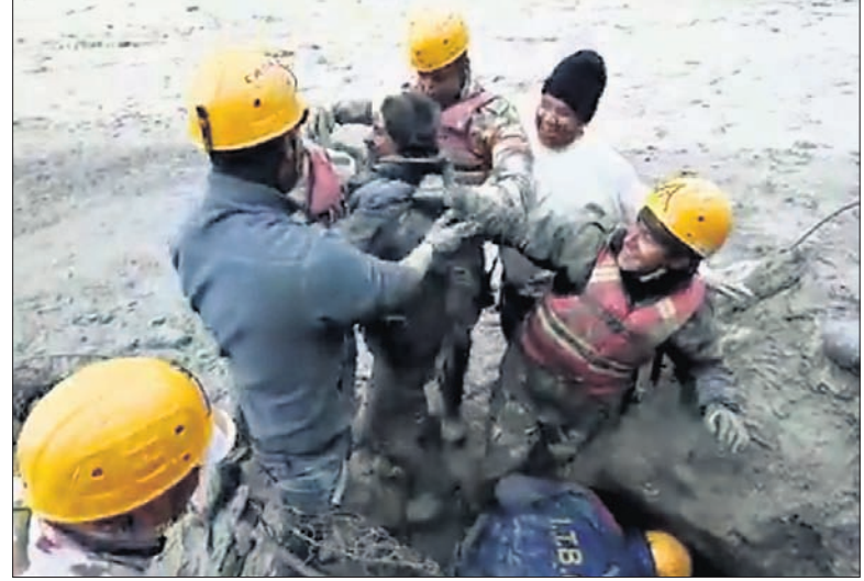
ମାଟିତରୁ ଜଣେ ଯୁବକଙ୍କୁ ଯବାନମାନେ ଉଦ୍ଧାର କରୁଛନ୍ତି।