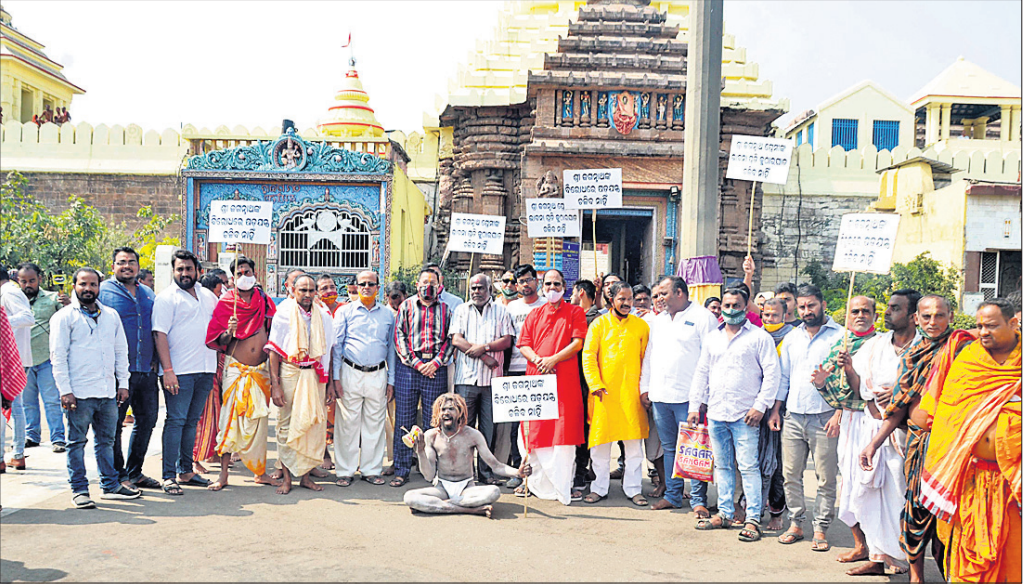
ଏନ୍‌ଏମ୍‌ଏ ପକ୍ଷରୁ କାରି ପ୍ରସ୍ତାବିତ ଅଧିନିୟମକୁ ବିରୋଧ କରି ଶ୍ରୀମନ୍ଦିର ସମ୍ମୁଖରେ ବିଭିନ୍ନ ନିଯୋଗ ଓ ସଂଗଠନ ପକ୍ଷରୁ ବିରୋଧ କରାଯାଇଛି।

ନ୍ୟାଶନାଲ ମନୁମେଣ୍ଟ କର୍ତ୍ତୃପକ୍ଷ (ଏନ୍‌ଏମ୍‌ଏ)ଙ୍କ ପକ୍ଷରୁ ଶ୍ରୀମନ୍ଦିର ଐତିହ୍ୟ ପାଇଁ ପ୍ରସ୍ତାବିତ ଚିଠି ଅଧିନିୟମ (ବାଲ-ଲ) କାରି ହେବା ପରେ ଏହାକୁ ନେଇ ବିଭିନ୍ନ ମହଲରେ ଚାନ୍ଦ୍ର ଅସନ୍ତୋଷ ପ୍ରକାଶ ପାଇଛି। ଶ୍ରୀମନ୍ଦିର ରାଜପତେ ରହୁଥିବା ସ୍ଥାନୀୟ ବାସିନ୍ଦା ଓ ସେବାୟତ ପରିବାର ଏହି ଚିଠି ଅଧିନିୟମକୁ ଚାନ୍ଦ୍ର ବିରୋଧ କରିଛନ୍ତି। ଏହାକୁ ପ୍ରତ୍ୟାହାର କରିନେବା ପାଇଁ ଶ୍ରୀମନ୍ଦିରର ମୁଖ୍ୟ ପ୍ରଶାସକ କୁମ୍ଭୀର ରବିବାର କେନ୍ଦ୍ର ସଂସ୍କୃତି ମନ୍ତ୍ରଣାଳୟର ସଚିବଙ୍କୁ ଚିଠି ଲେଖି ଅନୁରୋଧ କରିଛନ୍ତି। ଏହି ଅଧିନିୟମ କାର୍ଯ୍ୟକାରୀ ହେଲେ ଦୀର୍ଘବର୍ଷ ଧରି ଶ୍ରୀମନ୍ଦିର ପାର୍ଶ୍ଵବର୍ତ୍ତୀ ଅଞ୍ଚଳରେ ରହୁଥିବା ସେବାୟତ ପରିବାର ବିଶେଷତାଭାବେ କ୍ଷତି ସହିବେ। ଏଣୁ ଭକ୍ତ, ସେବାୟତ ଓ ଭଗବାନଙ୍କ ସମୂହ ସ୍ଵାର୍ଥକୁ ଧ୍ୟାନ ଦେଇ ଏହି ପ୍ରସ୍ତାବିତ ଚିଠି ଅଧିନିୟମକୁ ପ୍ରତ୍ୟାହାର କରାଯାଉ। ଶ୍ରୀମନ୍ଦିର ନାଟକାଳିନି ନିମନ୍ତେ ବର୍ଷ ବର୍ଷ ଧରି ଶ୍ରୀମନ୍ଦିର ପାର୍ଶ୍ଵବର୍ତ୍ତୀ ଅଞ୍ଚଳରେ ବହୁ ସେବାୟତ ପରିବାର ରହି ଆସୁଛନ୍ତି। ନ୍ୟାଶନାଲ