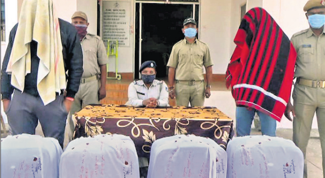
ଜବତ ଗଞ୍ଜେଇ ଓ ୨ ଗିରଫ ଅଭିଯୁକ୍ତ।