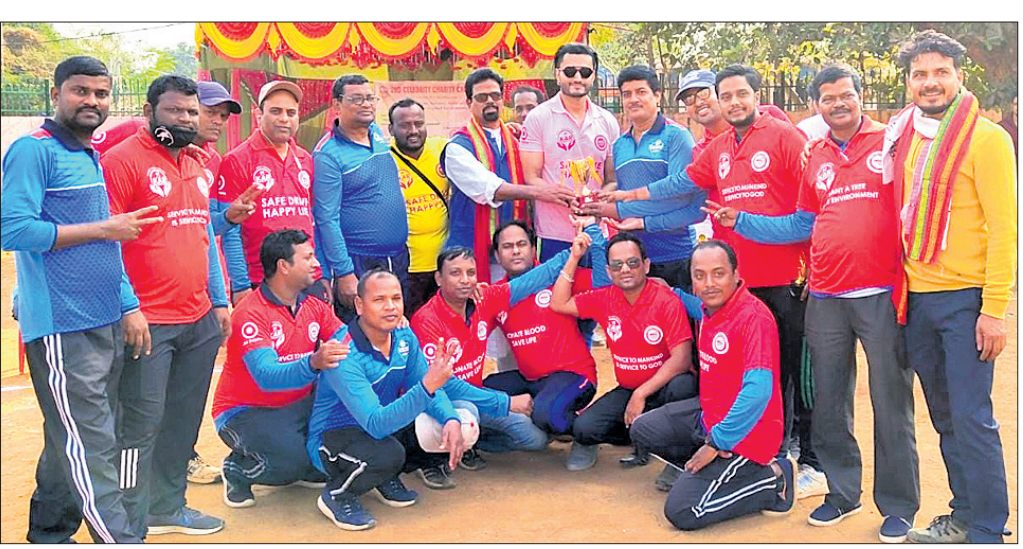
ଚାମ୍ପିୟନ ଭୁବନେଶ୍ୱର ମିଡିଆ ସ୍କୋର୍ସ କ୍ଲବ୍ ଖେଳାଳିମାନେ ଅତିଥିଙ୍କଠାରୁ ପୁରସ୍କାର ଗ୍ରହଣ କରୁଛନ୍ତି।

ସେକ୍ସଟୁଆର ସାମାଜିକ ସଂଗଠନ 'ସ୍ଥୂପ' ଫୁଲ୍ ଡିଭିଜନ ଓ 'କର ଫାଉଣ୍ଡେସନ୍' ମିଳିତ ଆନୁକୂଲ୍ୟରେ ଗ୍ଲୋବାଲ ସ୍ପୋର୍ଟ୍-ସ୍ପୋର୍ଟିଭ ପ୍ରଗତି ସ୍କୋର୍ସ ପଡ଼ିଆରେ ରବିବାର ଦି୍ୱିତୀୟ 'ସେଲିବ୍ରିଟି'