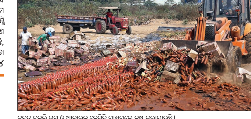
କଟକ ନକଲି ସସ୍ ଓ ଆଚାରକୁ କେସିବି ମାଧ୍ୟମରେ ନଷ୍ଟ କରାଯାଇଛି।

ପୋଲିସ୍, ପୁଠ ଇନ୍‌ସପେକ୍ଟରମାନେ କାଣିଶୁଣି ନାବର ରହୁଥିବାରୁ ଏହି ପୃଷ୍ଠା-୪