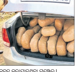
ଜବତ କରାଯାଇଥିବା ଗଞ୍ଜେଇ।