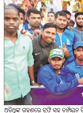
ଅତିଥିକ ଗ୍ରହଣରେ ଚୁପ୍ ସହ ଚାମ୍ପିୟନ ଚିମ୍ପା

ଚଳିତ ଲକ୍ଷ୍ମୀଆନ ସୁପର ଲିଗ୍ (ଆଇଏସଏଲ)ରେ ରବିବାର ଖେଳାଯାଇଥିବା ପ୍ରଥମ ମ୍ୟାଚରେ ଏସ୍‌ଇ ଇଷ୍ଟବେଙ୍ଗଲ ୨-୧ ଗୋଲରେ ଜାମସେଦପୁର ଏସ୍‌ସିକୁ ହରାଇ ଦେଇଛି। ପାଖାପାଖି ଏକ ମାସ ବ୍ୟବଧାନରେ ଦଳର ଏହା ପ୍ରଥମ ବିଜୟ। ବୋଲବାତାଭିଳିକ ଏହି ଦଳା ବର୍ତ୍ତମାନ ୧୬ ପଏଣ୍ଟ ସହ ପଏଣ୍ଟ ଚେନ୍ଦୁଲର ୯ମ ସ୍ଥାନକୁ ଉନ୍ନତ ହୋଇଛି। ରବିବାର ହାଇଡ୍ରାବାଦ ଓ ନର୍ଥଇଷ୍ଟ ମୁନାଇଚେର୍ ମଧ୍ୟରେ ଅନୁଷ୍ଠିତ ଦ୍ୱିତୀୟ ମ୍ୟାଚ ଗୋଲଶୂନ୍ୟ ଭାବେ ଶେଷ ହୋଇଛି।