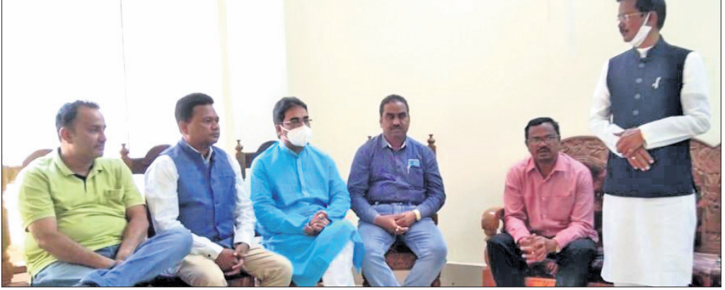
ବୈଠକରେ କର୍ମକର୍ତ୍ତାମାନେ ଆଲୋଚନା କରୁଛନ୍ତି।

ମାଲକାନଗିରି, ୨୧ (ଡି.ଏନ୍.ଏ.) ବିଜୁ ଯୁବ ଜନତା ଓ ବିଜୁ ଛାତ୍ର ଜନତା ଦଳର ଆସପା ୧୧ରେ ହେବାକୁ ଥିବା ଜିଲ୍ଲାସ୍ତରୀୟ ସମାବେଶ ନେଇ ରବିବାର ମାଲକାନଗିରି ଜିଲ୍ଲା ବିଜେଡି ପକ୍ଷରୁ ଏକ ପ୍ରସ୍ତୁତି ବୈଠକ ସର୍ବଜ୍ଞ ହାତରୁ ଠାରେ ଅନୁଷ୍ଠିତ ହୋଇଯାଇଛି। ଏଥିରେ ମାଲକାନଗିରି ଜିଲ୍ଲା ବିଜୁ ଜନତା ଦଳର