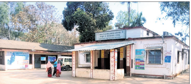
ରାଇଘର ସ୍ୱାସ୍ଥ୍ୟ କେନ୍ଦ୍ର।

ନବରଙ୍ଗପୁର ଜିଲ୍ଲା ରାଇଘର ବ୍ଲକ୍‌ରେ ସ୍ୱାସ୍ଥ୍ୟ ସେବା ସମ୍ପୂର୍ଣ୍ଣ ବିପର୍ଯ୍ୟୟ ହୋଇପଡ଼ିଛି। ଫଳରେ ରାଇଘରବାସୀ ଉନ୍ନତ ଚିକିତ୍ସା ବୁଦ୍ଧିଧା ନିମନ୍ତେ ସାମାଜିକ ଛତିଶଗଡ଼ ଏବଂ ଆନ୍ଧ୍ରପ୍ରଦେଶ ଉପରେ ନିର୍ଭର କରୁଛନ୍ତି। ବିଶେଷ କରି ତାନ୍ତ୍ରିକ ଏବଂ କର୍ମଚାରୀଙ୍କ ଅଭାବ ଯୋଗୁ ରାଇଘରରେ ସ୍ୱାସ୍ଥ୍ୟ ସେବା ଏକପ୍ରକାର ଅଟକ ହୋଇପଡ଼ିଥିବା ବାରମ୍ବାର ଅଭିଯୋଗ ହେଉଛି।