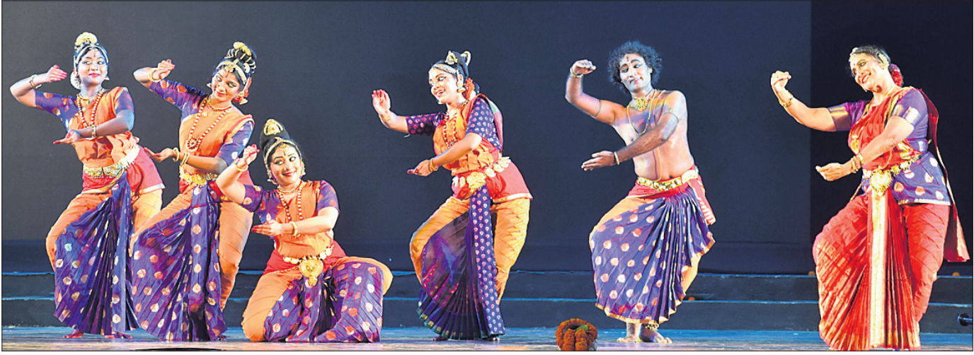
ଶାନ୍ତିସୂତ୍ର ପାଦଦେଶରେ ରାଲିଥିବା ୧୭ତମ ଧଉଳି-କଳିଙ୍ଗ ମହୋତ୍ସବର ସୋମବାର ଉଦ୍‌ଘାଟନୀ ସନ୍ଧ୍ୟାରେ ବାହାର ରାଜ୍ୟର କଳାକାରମାନେ ନୃତ୍ୟ ପରିବେଷଣ କରୁଛନ୍ତି ।