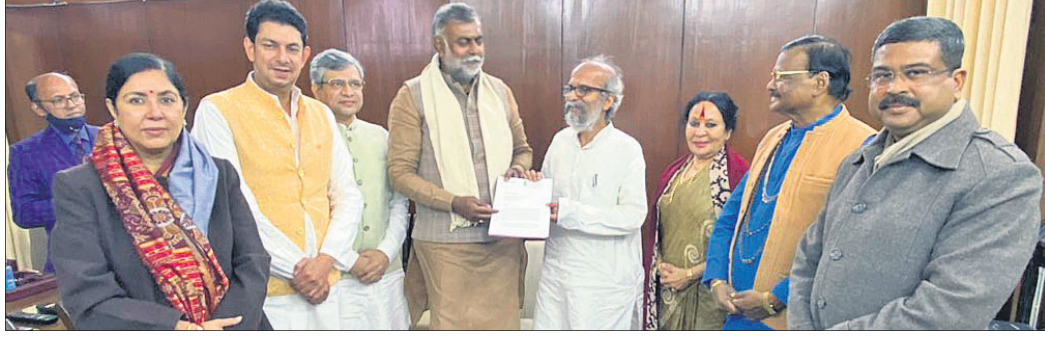
କେନ୍ଦ୍ର ସଂସ୍କୃତି ମନ୍ତ୍ରୀ ପ୍ରହଲ୍ଲାଦ ସିଂହ ପଟ୍ଟେନକୁ ବିଜେଡି (ଉପର) ଓ ଭାଜପା ଏମ୍ପିମାନେ ଭେଟୁଛନ୍ତି।