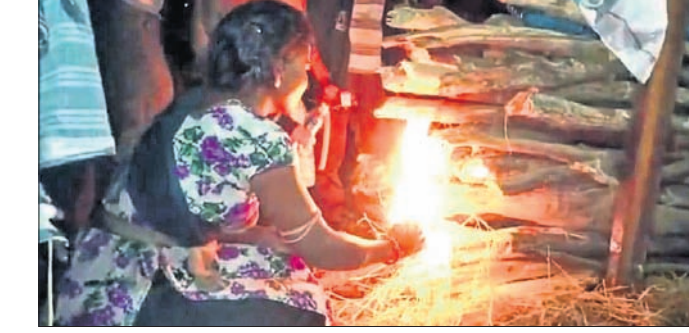
ବାପାଙ୍କ ଚିତାଗ୍ନିରେ ମୁଖାଗ୍ନି ଦେଉଛନ୍ତି ସଂଯୁକ୍ତ।

ଜଣକ ରାତିରେ ବନ୍ଧ ପର୍ଯ୍ୟନ୍ତ ସେମାନଙ୍କ ସହିତ ଯାଇଥିଲେ। ସମୁଦ୍ର ବାଲିରେ ଭିତରକୁ ପ୍ରାୟ ଦୁଇ କି.ମି. ଯିବା ପରେ ତାଙ୍କୁ ପୋଡି ଦେଇଥିଲେ। ଆକ୍ରମଣରେ ବ୍ୟବହୃତ ମାରଣାସ୍ତ୍ରଗୁଡ଼ିକୁ ଏକ ବନିଗଛ ମୂଳେ ପୋତାବା ସହ ରକ୍ତକ୍ଷିତା ଲାଗିଥିବା ଜ୍ୟାକେଟକୁ ଅନ୍ୟ ଏକ ବନିଗଛ ପାଖରେ ପୋଡି ଦେଇଥିଲେ। ଏସବୁ କାମ ରାତି ପ୍ରାୟ ସାଠେ ୧୦ଟା ଭିତରେ ସରିବା ପରେ ସମସ୍ତେ ଘରକୁ ପଳାଇ ଯାଇଥିଲେ। ଘଟଣା ପରେ ପୋଲିସ୍ ଗୋପାଳପୁର ଫୋନ ଟ୍ରାକ୍ ଓ ଲୋକଙ୍କୁ ପଚରାଉଚରା କରି ଅଭିଯୁକ୍ତମାନଙ୍କ ପାଖରେ ପହଞ୍ଚିଥିଲା। ସମସ୍ତେ ଅପମାନ ପାଇବା ପରେ ପୋଲିସ୍ ୫ ଅଭିଯୁକ୍ତଙ୍କୁ ଯୋମବାର ଗିରଫ କରି କୋର୍ଟଚାଲାଣ କରିଛି।