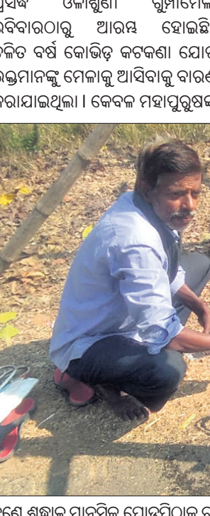
ଜଣେ ଶ୍ରଦ୍ଧାଳୁ ମାନସିକ ଯୋଡ଼ିପାଠକୁ ରାସ୍ତାରେ ଥୋଇ ସମର୍ପଣ କରୁଛନ୍ତି।

ପ୍ରସିଦ୍ଧ ଓଳାଶୁଣୀ ଗୁମ୍ଫାମେଳା ରବିବାରଠାରୁ ଆରମ୍ଭ ହୋଇଛି। ଚଳିତ ବର୍ଷ କୋଭିଡ଼ କଟକଣା ଯୋଗୁ ଭକ୍ତମାନଙ୍କୁ ମେଳାକୁ ଆସିବାକୁ ବାରଣ କରାଯାଇଥିଲା। କେବଳ ମହାପୁରୁଷଙ୍କ ପୂଜାବିଧି ଓ ନାଟକାନ୍ତ ପାଳନ ହେବ ବୋଲି ନିଷ୍ପତ୍ତି ପ୍ରସ୍ତୁତ ହେବାପରେ ନିଆଯାଇଥିଲା। ମାତ୍ର ରବିବାର ମହାପୁରୁଷଙ୍କ ମହାପ୍ରୟାଣ ଦିବସରେ ନାଟକାନ୍ତ ହେବା ସହ ବହୁ ଭକ୍ତଙ୍କୁ ବୋଲି ନିଷ୍ପତ୍ତି ପ୍ରସ୍ତୁତ ହେବାପରେ ନିଆଯାଇଥିଲା। ମାତ୍ର ରବିବାର ମହାପୁରୁଷଙ୍କ ମହାପ୍ରୟାଣ ଦିବସରେ ଏହାପରେ ମେଳା ପଡ଼ିଆର ପ୍ରବେଶ ପଥରେ ପ୍ରଶାସନ ପକ୍ଷରୁ ବ୍ୟାରିକେଡ୍ କରାଯାଇ ପୋଲିସ୍ ଜରି ବସିଥିଲା। ଜଣେ ହେଲେ ଭକ୍ତଙ୍କୁ ପୋଲିସ୍ ଦର୍ଶନ ପାଇଁ ଛାଡି ନ ଥିଲା। ଏଥିପାଇଁ ମାନସିକ ଯୋଡ଼ିପାଠ ଧରି ଆସିଥିବା ଶ୍ରଦ୍ଧାଳୁମାନେ ନିରାଶ ହୋଇଥିଲେ। ସେମାନେ ଆଣିଥିବା ଯୋଡ଼ିପାଠକୁ ରାସ୍ତା ଉପରେ ଥୋଇ ମହାପୁରୁଷଙ୍କ ନାମରେ ପାଣି ଚୁଲାଇ ଦୁଇ ହାତ ବେକିଦେଇ ଫେରିଯାଉଥିବା ଦେଖିବାକୁ ମିଳିଥିଲା। ପ୍ରଥମ ଦିନ ୧୪୪ ଧାରା ସମ୍ପୂର୍ଣ୍ଣ କୋହଳ କରାଯାଇଥିବା ବେଳେ ସୋମବାର ଦ୍ୱିତୀୟ ଦିନ ଏହାକୁ କଡ଼ାକଡ଼ି ଭାବେ ପାଳନ କରାଯାଇଛି। ପ୍ରଶାସନର ଏପରି ନିଷ୍ପତ୍ତିକୁ ସାଧାରଣରେ ନାପସନ୍ଦ କରାଯାଇଛି।