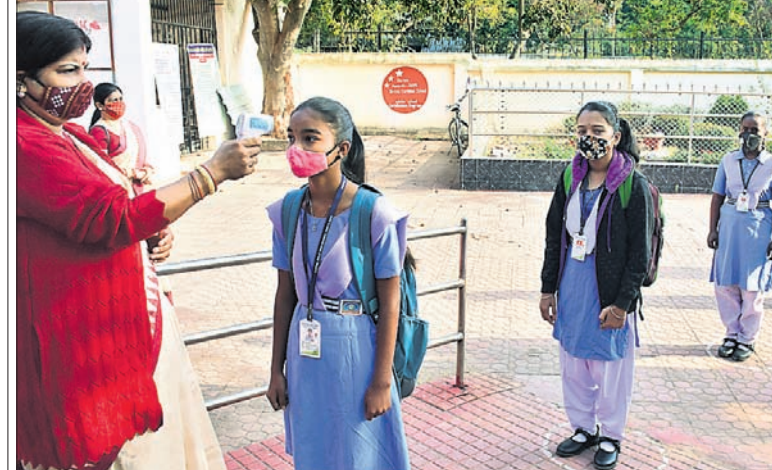
ସୋମବାର ଭୁବନେଶ୍ୱର ଯୁନିଟ୍-୨ ବାଳିକା ଉଚ୍ଚ ବିଦ୍ୟାଳୟକୁ ପ୍ରବେଶ ସମୟରେ ଛାତ୍ରୀଙ୍କ ସ୍ତ୍ରୀ କରାଯାଇଛି। ରମାଦେବୀ ମହିଳା ବିଶ୍ୱବିଦ୍ୟାଳୟରେ ଯୁକ୍ତ ୨ ପ୍ରଥମ ବର୍ଷର ଛାତ୍ରୀମାନେ ପାଠ ପଢୁଛନ୍ତି।