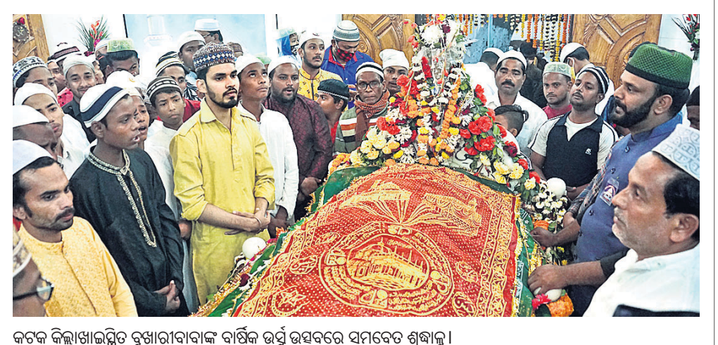
କଟକ କିଲ୍ଲାଖାଇଲିତ ରୁଖାରୀବାବାଙ୍କ ବାର୍ଷିକ ଉତ୍ସବରେ ସମବେତ ଶ୍ରଦ୍ଧାକୁ।