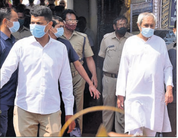
ଶ୍ରୀଜୀଉଙ୍କ ଦର୍ଶନ ସାରି ମୁଖ୍ୟମନ୍ତ୍ରୀ ନବୀନ ପଟ୍ଟନାୟକ ଫେରୁଛନ୍ତି।