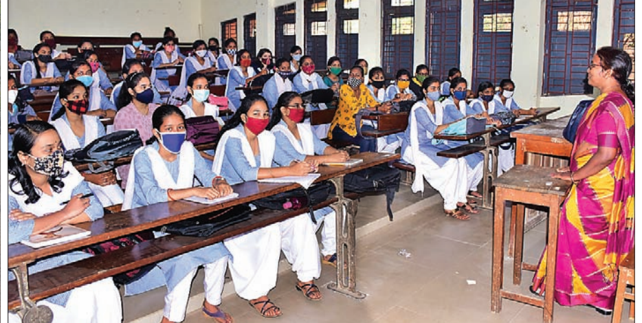
ସୋମବାର ଭୁବନେଶ୍ୱର ଯୁନିଟ୍-୨ ବାଳିକା ଉଚ୍ଚ ବିଦ୍ୟାଳୟକୁ ପ୍ରବେଶ ସମୟରେ ଛାତ୍ରୀଙ୍କ ସ୍ତ୍ରୀ କରାଯାଇଛି। ରମାଦେବୀ ମହିଳା ବିଶ୍ୱବିଦ୍ୟାଳୟରେ ଯୁକ୍ତ ୨ ପ୍ରଥମ ବର୍ଷର ଛାତ୍ରୀମାନେ ପାଠ ପଢୁଛନ୍ତି।