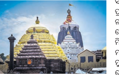
ସମ୍ଭାଷଣ କୌଣସି ପ୍ରସ୍ତାବିତ ଉପନିୟମ ପ୍ରକାଶ ପାଇବାକୁ ଥିଲେ, ଏହା ପୂର୍ବରୁ ରାଜ୍ୟ ସରକାର ଓ ଶ୍ରୀମନ୍ଦିର ସହ ସମ୍ପୃକ୍ତ ପ୍ରଶ୍ନାବଳୀର ଅନୁମତିକୁ

ପ୍ରାଥମିକତା ଦିଆଯିବ ପରେ କହିଛନ୍ତି। ଉକ୍ତ ବିଜେଡି ଓ ଭାଜପା ଏମ୍ପିଏଙ୍କ ୨ଟି ପ୍ରତିନିଧି ଦଳ ନୂଆଦିଲ୍ଲୀରେ କେନ୍ଦ୍ର ସଂସ୍କୃତି ମନ୍ତ୍ରୀଙ୍କୁ ଭେଟି ଉପନିୟମ ଚିଠାକୁ ପ୍ରତ୍ୟାହାର ଦାବି କରିଥିଲେ। ପୁଞ୍ଜୀମନ୍ତ୍ରୀ ନବୀନ ପଟ୍ଟନାୟକଙ୍କ ନିର୍ଦ୍ଦେଶ କ୍ରମେ ସୋମବାର ପୂର୍ବାହ୍ନରେ ପୁରୀ ଏମ୍ପି ପିନାକା ମିଶ୍ରଙ୍କ ଅଧ୍ୟକ୍ଷତାରେ ବିଜେଡି ଏମ୍ପି ଭର୍ତ୍ତୃହରି ମହାପାତ୍ର, ସମ୍ବିତ ପାତ୍ର, ଅନୁଭବ ମହାନ୍ତି ଓ ପୁନା ଖାଁଙ୍କ ସମେତ ଏକ ପ୍ରତିନିଧି ଦଳ ପ୍ରଥମେ କେନ୍ଦ୍ରମନ୍ତ୍ରୀ ପତେଲଙ୍କୁ ସାକ୍ଷାତ କରି ଏନ୍ଏମ୍ଏ ଦ୍ୱାରା ପ୍ରକାଶିତ ଚିଠା ଉପନିୟମକୁ ପ୍ରତ୍ୟାହାର କରିନେବା ଲାଗି ଦାବି କରିଥିଲେ। ପ୍ରତ୍ୟାହାର କରିବାକୁ ପୁଞ୍ଜୀମନ୍ତ୍ରୀ ଦୃଢ଼ ପୃଷ୍ଠା-୪