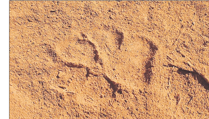
ଗାଁରେ ମିଳିଥିବା ବାଘ ପାଦଚିହ୍ନ।