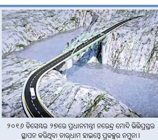
୨୦୧୭ ଡିସେମ୍ବର ୨୭ରେ ପ୍ରଧାନମନ୍ତ୍ରୀ ନରେନ୍ଦ୍ର ମୋଦି ଭିଜିପ୍ରସ୍ତର ଗୁମାସତୀ ଚାର୍ଯ୍ୟାମ ହାଇଡ୍ରୋ ପ୍ରକଳ୍ପର ନମୁନା।

ଭରତୀୟଶାସନରେ ରବିବାର ହିମାଳୟ ଜନିତ ବନ୍ୟା ଆସି ୨୭ ଜଣଙ୍କ ମୃତ୍ୟୁ ହେବା ସହ ଶତାଧିକ ନିଃଶାଳ ହୋଇଛନ୍ତି। ତେବେ ଏହି ବିପର୍ଯ୍ୟୟ ପଛର ପ୍ରକୃତ କାରଣ ଏପର୍ଯ୍ୟନ୍ତ ସ୍ପଷ୍ଟ ହୋଇନାହିଁ। ୨୦୧୭ରେ କୋଦାମଧୀରେ ମଧ୍ୟ ଅନୁଭୂତ ଭାବେ ବନ୍ୟା ଆସିଥିଲା।