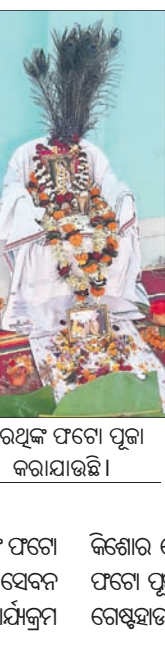
ସାରଥିଙ୍କ ଫଟୋ ପୂଜା କରାଯାଇଛି।