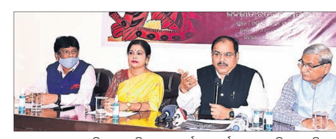
ଖବରଦାତା ସମ୍ମିଳନୀରେ ଚିତ୍ରକଳା ପ୍ରଦର୍ଶନୀ ସମ୍ପର୍କରେ ସୂଚନା ଦିଆଯାଇଛି।

ରାଜ୍ୟ ସଂଗ୍ରହାଳୟ ପରିସରରେ ମଙ୍ଗଳବାରଠାରୁ ଆରମ୍ଭ ହେଉଛି ଅନ୍ତର୍ଜାତୀୟ ଲୋକକଳା ଓ ଜନଜାତି ଚିତ୍ରକଳା ପ୍ରଦର୍ଶନୀ।