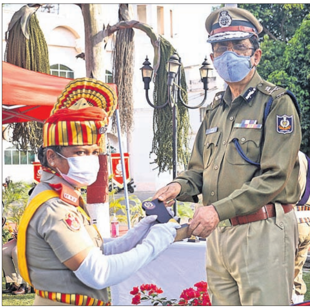
ପ୍ଲାଜ୍ଜା ଦାନ କରିଥିବା ମହିଳା ପୋଲିସ କର୍ମଚାରୀଙ୍କୁ ତିନିପି ଅଭୟ ସମ୍ବର୍ଦ୍ଧନ କରୁଛନ୍ତି।