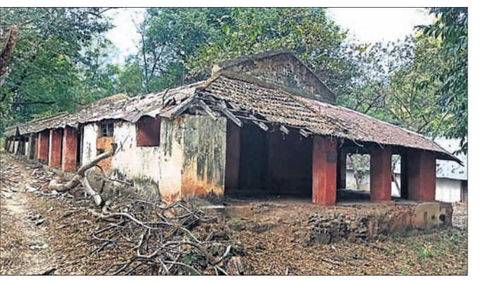
ଗୋପାଳବାଡ଼ି ଗାଁରେ ଅବହେଳିତ ଅବସ୍ଥାରେ ରହିଥିବା ସ୍ଵାସ୍ଥ୍ୟ ସଂଗ୍ରାମୀ ନିକଟକୁ ପଠାଯାଇଥିଲା।