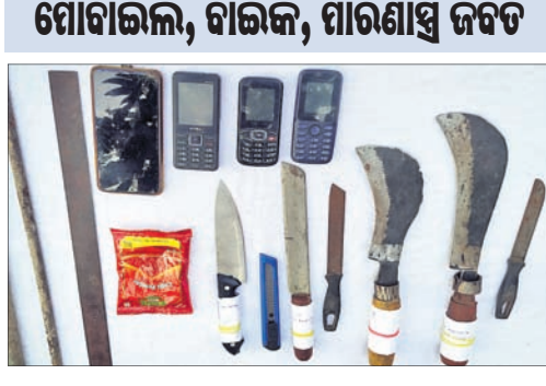
କହିଥିଲେ। ଡକାୟତି ଯୋଜନା କରୁଥିବା ଗ୍ୟାଙ୍ଗର ସଦସ୍ୟଙ୍କୁ ଗିରଫ କରିବା ପାଇଁ ପୋଲିସ ଗୁରୁତ୍ୱ ଦେଇଥିଲା।

ଡକାୟତି ଯୋଜନା କରୁଥିବା ଏକ ଗ୍ୟାଙ୍ଗର ୫ ଜଣ ସଦସ୍ୟଙ୍କୁ ମାଲଗୋଦାମ ପୋଲିସ ଗିରଫ କରିଛି।