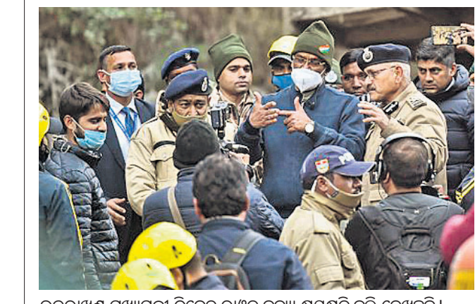
ଉତ୍ତରାଖଣ୍ଡ ମୁଖ୍ୟମନ୍ତ୍ରୀ ତ୍ରିବେନ୍ଦ୍ର ରାଓଙ୍କ ସମ୍ପର୍କରେ ସୂଚନା ଦେଖିଛନ୍ତି।

ହିମଞ୍ଚଳନନଗର ବନ୍ୟାରେ ଭାସିଯାଇ ଚପୋବନର ଏକ ଭୂତଳ ଚନେଲରେ ଫର୍ସି ରହିଥିବା କେତେଜଣଙ୍କୁ ଫୋନ୍ କଲ୍ ବଞ୍ଚାଇ ଦେଇଥିବା ସେମାନେ କହିଛନ୍ତି।