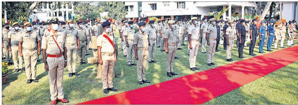
ସମ୍ବର୍ଦ୍ଧନା ଉତ୍ସବରେ ପ୍ଲାଜ୍ଜା ଦାନ କରିଥିବା ପୋଲିସ କର୍ମଚାରୀ।