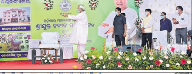
ମୁଖ୍ୟମନ୍ତ୍ରୀ ନବୀନ ପଟ୍ଟନାୟକ ୪ ବିଲ୍ଡିଂ ଉଦ୍‌ଘାଟନା କରୁଛନ୍ତି (ଉପର)। କାର୍ଯ୍ୟକ୍ରମରେ ଯୋଗଦେଇଥିବା ଅଧ୍ୟାପିକା, ଛାତ୍ରୀ ଓ ଅନ୍ୟମାନେ।

ରମାଦେବୀ ମହିଳା ବିଶ୍ୱବିଦ୍ୟାଳୟରେ ନବନିର୍ମିତ ୪ ବିଲ୍ଡିଂ ଯୋଜନାରେ ଉଦ୍‌ଘାଟନା କରାଯାଇଛି।