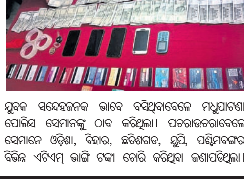
ଯୁବକ ସମେହଜନକ ଭାବେ ବସିଥିବାବେଳେ ମଧୁପାଟଣା ପୋଲିସ ସେମାନଙ୍କୁ ଠାରୁ ଗିରଫ କରୁଥିଲା। ପରାଭରତରାବେଳେ ସେମାନେ ଓଡିଶା, ବିହାର, ଛତିଶଗଡ, ୟୁପି, ପଶ୍ଚିମବଙ୍ଗର ବିଭିନ୍ନ ଏଟିଏମ୍ ଭାଇ ଟଙ୍କା ଚୋରି କରିଥିବା ଜଣାପଡିଥିଲା।

ମଧୁପାଟଣା ପୋଲିସ ଡିଭିଜନ ଏକ ଏଟିଏମ୍ ଲୁଟେରା ଗ୍ୟାଙ୍ଗକୁ ଠାରୁ ଗିରଫ କରିଛି। ଏଥିରେ ଉଚ୍ଚ ଗ୍ୟାଙ୍ଗର ୪ ସଦସ୍ୟଙ୍କୁ ଗିରଫ କରି ସେମାନଙ୍କୁ କୋର୍ଟଚାଲିଛି।