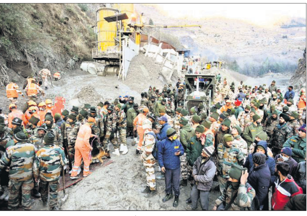
କୋଷୀମଠର ତପୋବନ ଚନେଲ ନିକଟରେ ଉଦ୍ଧାର କାର୍ଯ୍ୟ ଚାଲି ରହିଛି।