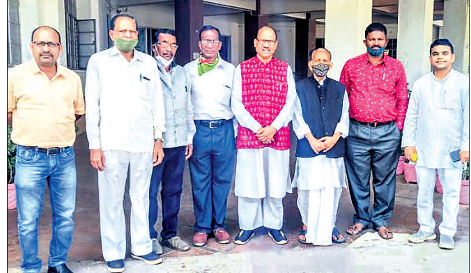
ପିସିସିଏସ୍‌କୁ ଭେଟିବାକୁ ଆସିଥିବା କେନ୍ଦ୍ରପତ୍ର କର୍ମଚାରୀ ସଂଘ କର୍ମକର୍ମୀମାନେ।