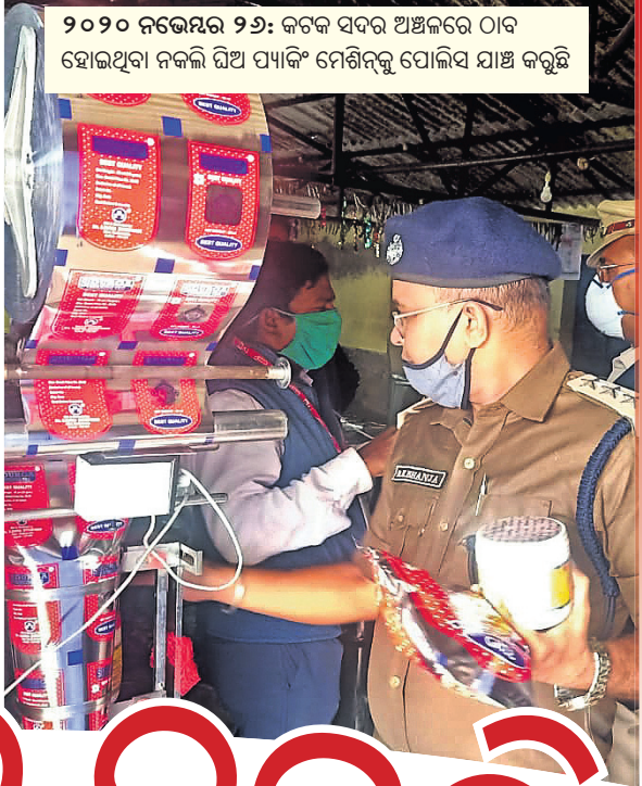
୨୦୨୦ ନଭେମ୍ବର ୨୬: କଟକ ସଦର ଅଞ୍ଚଳରେ ଠାବ ହୋଇଥିବା ନକଲି ଦିଅ ପ୍ୟାକିଂ ମେଶିନ୍‌କୁ ପୋଲିସ୍ ଯାଞ୍ଚ କରୁଛି