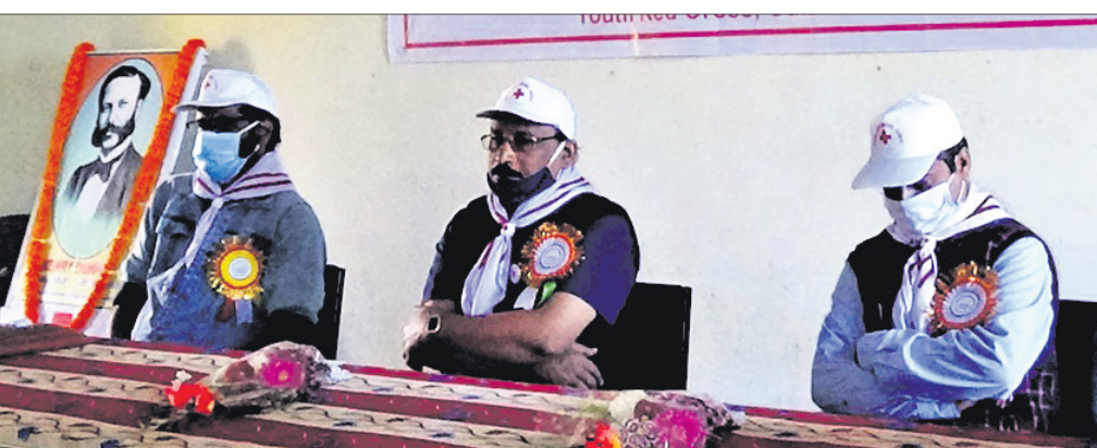
ସଭାରେ ଯୋଗ ଦେଇଥିବା ଅତିଥିବୃନ୍ଦ ।

ବଡ଼ଗାଁ, ୯/୨ (ଡି.ଏନ.ଏ) : ଯୁବରଗତ ଜିଲ୍ଲା ବଡ଼ଗାଁ ପିଏସ୍ ମୁକ୍ତ ୨ କଲେଜରେ ବ୍ରଦିବସାୟ କୁଷ୍ଠରପୁରାୟ ଯୁବ ରେଡକ୍ରସ୍ ଶିକ୍ଷା ତାଲିମ ଶିବିର ସୋମବାର ଆରମ୍ଭ ହୋଇଛି । ଏଥିରେ ବଡ଼ଗାଁ ତିନି କଲେଜ, କୁନ୍ତା ସାଇନ୍ସ କଲେଜ, ବରଜାକନ୍ଧାର କଲେଜ, ବିରବିରା କଲେଜ ଓ ସ୍ଥାନୀୟ ଉଚ୍ଚ