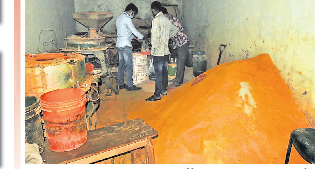
୨୦୨୦ ନଭେମ୍ବର ୧୨: କଟକ ମାଲଗୋଦାମ ଅଞ୍ଚଳରେ ଥିବା ଏକ ଅପମିଶ୍ରିତ ହଳଦା ଓ ଲଙ୍କାଗୁଣ୍ଡ କାରଖାନାକୁ ଠାବ କରାଯାଇଛି।