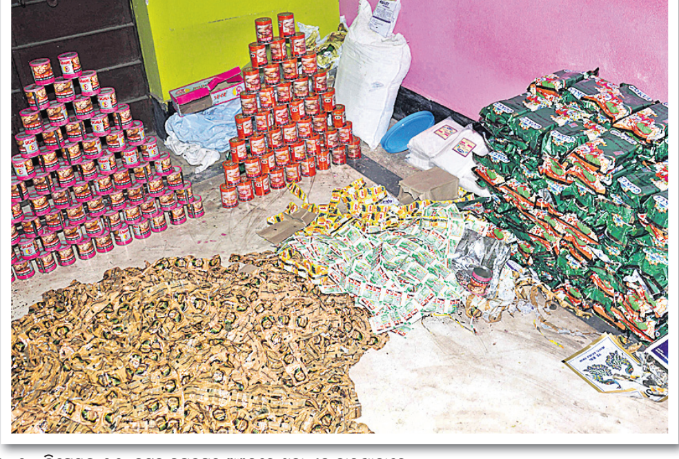
୨୦୨୦ ଡିସେମ୍ବର ୧୬: କଟକ ଜଗତପୁର ଅଞ୍ଚଳରେ ଥିବା ଏକ କାରଖାନାରେ ଚଢ଼ାଇ କରାଯାଇ ବିପୁଳ ପରିମାଣର ନକଲି ଜର୍ଦୀ କଟକ କରାଯାଇଛି।