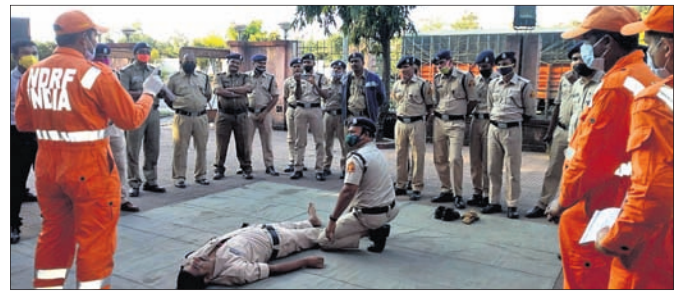
ଏନଡିଆରଏଫ୍ ପକ୍ଷରୁ ମକ୍ ଡ୍ରିଲ୍ ପ୍ରଶିକ୍ଷଣ ଚାଲିଛି ।