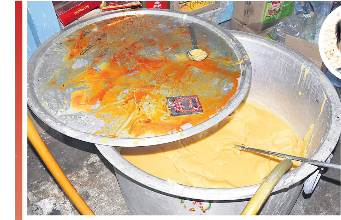
୨୦୨୦ ଡିସେମ୍ବର ୨୧: କଟକ ବାଦାମବାଡ଼ି ଥାନା ଅନ୍ତର୍ଗତ ମୁନିଲାଲଟ୍ ରଜିରେ ଠାବ ହୋଇଥିବା ନକଲି ଦିଅ କାରଖାନା।

ବଜାରରେ ବଢ଼ିଚାଲିଛି ନକଲି ସାମଗ୍ରୀର କାରବାର। ଗତ ୩ ମାସ ମଧ୍ୟରେ ରାଜ୍ୟର ବିଭିନ୍ନ ସ୍ଥାନରୁ କଟକ ହୋଇଥିବା ନକଲି ସାମଗ୍ରୀକୁ ଅନୁଧ୍ୟାନ କଲେ ଏବେ ଯେକୌଣସି ସାମଗ୍ରୀ କିଣିବା ପୂର୍ବରୁ ଏହାର ମାନକୁ ନେଇ ମନରେ ଉଠୁଛି ଅନେକ ପ୍ରଶ୍ନ। ନାନାଦିନୀ ବ୍ରାଣ୍ଡର ଲୋଗୋକୁ ସାମାନ୍ୟ ପରିବର୍ତ୍ତନ କରାଯାଇ ଚାଲିଛି ଅବାଧ କାରବାର। ପୂର୍ବରୁ ନକଲି ସାମଗ୍ରୀ କେବଳ ଡିଜେଲ ଓ ମୋଟର ପ୍ରସ୍ତୁତରେ ସୀମିତ ଥିବାବେଳେ ଏବେ ଖାଦ୍ୟ ସାମଗ୍ରୀକୁ କରାଯାଉଛି ଚାଟେଟ। ଏହି ନକଲି ଖାଦ୍ୟ ସାମଗ୍ରୀ ମନୁଷ୍ୟ ଶରୀର ପାଇଁ ବହୁ କ୍ଷତିକାରକ ହୋଇଥିଲେ ମଧ୍ୟ କେତେକ ଅସାଧୁ ବ୍ୟବସାୟୀ ସେମାନଙ୍କ ଲାଭଖୋର ଲାଲସାକୁ ପୁରଣ କରିବା ପାଇଁ ଲୋକଙ୍କ ଜୀବନ ସହ ଖେଳ ଖେଳୁଛନ୍ତି। ଭିତ୍ତିମଧ୍ୟରେ ରାଜ୍ୟର ବିଭିନ୍ନ ସ୍ଥାନରୁ ନକଲି ସସ୍, ସିନ୍ଥେଟିକ ପନିର, ମସଲା, ଦିଅ, ତେଲ, ଚା' ପତ୍ର, ମୃଦୁ ପାନାୟ, ମିଞ୍ଚର, ଜର୍ଦୀ ଆଦି ଅନେକ ନକଲି ସାମଗ୍ରୀ ବିପୁଳ ପରିମାଣରେ କଟକ ହୋଇଛି। ବିଶେଷକରି କଟକ ଜିଲ୍ଲା ଜଗତପୁର ଅଞ୍ଚଳ ନକଲି କାରଖାନାର ଏକ ପେଣ୍ଠସ୍ଥଳୀ ପାଲଟିଯାଇଛି। ସେହିପରି ଭୁବନେଶ୍ୱର, ବ୍ରହ୍ମପୁର, ଭଦ୍ରକ, ବଲାଙ୍ଗୀରର ବିଭିନ୍ନ ଅଞ୍ଚଳରୁ ମଧ୍ୟ ଅପମିଶ୍ରିତ ଖାଦ୍ୟପଦାର୍ଥ କଟକ ହୋଇଛି। ଏଭଳି ସ୍ଥିତିରେ ନକଲି ସାମଗ୍ରୀ ପ୍ରସ୍ତୁତ କରୁଥିବା ଲୋକଙ୍କ ବିରୋଧରେ କଠୋର କଠୋର କାର୍ଯ୍ୟାନୁଷ୍ଠାନ ଗ୍ରହଣ କରାଯିବା ସହ ଲୋକମାନଙ୍କୁ ଖାଦ୍ୟ ପଦାର୍ଥ କିଣିବା ସମୟରେ ସତେଚନ ହେବା ଜରୁରୀ ହୋଇପଡ଼ିଛି।