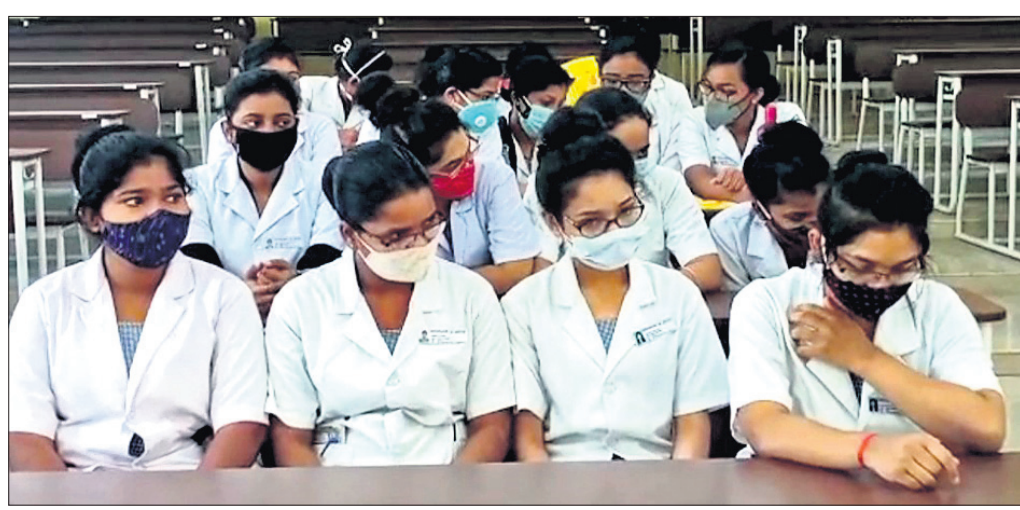
ବୁର୍ଲାଠାର ନର୍ସିଂ କଲେଜ ଛାତ୍ରାମାନେ।