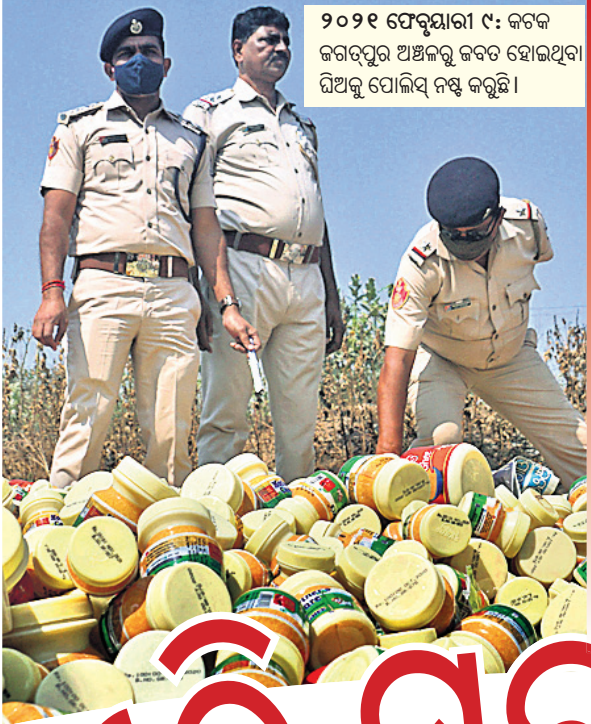
୨୦୨୧ ଫେବୃଆରୀ ୯: କଟକ ଜଗତପୁର ଅଞ୍ଚଳରୁ କଟକ ହୋଇଥିବା ଦିଅକୁ ପୋଲିସ୍ ନଷ୍ଟ କରୁଛି।