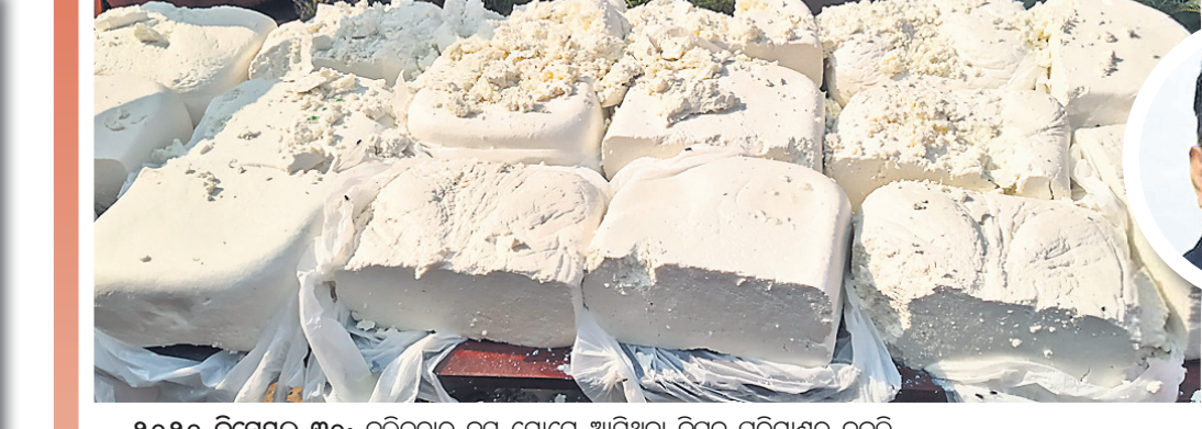
୨୦୨୦ ଡିସେମ୍ବର ୩୦: କଲିକତାରୁ ବସ୍ ଯୋଗେ ଆସିଥିବା ବିପୁଳ ପରିମାଣର ନକଲି ପନିରକୁ କଟକ ଚାଇଲିଆଗଞ୍ଜ ଥାନା ପୋଲିସ୍ ଓଏମ୍ପି ଛକଠାରେ କଟକ କରିଛି।