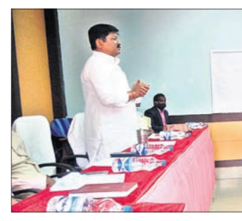
ମନ୍ତ୍ରୀ ପ୍ରତାପ ଜେନା ବିଭିନ୍ନ ଯୋଜନାର ସମୀକ୍ଷା କରୁଛନ୍ତି ।

କୁଆଁରପୁଣ୍ଡା, ୯/୨ (ଡି.ଏନ.ଏ.) : ସୁନ୍ଦରଗଡ଼ ଜିଲ୍ଲାର ବିକାଶ ପାଇଁ ରାଜ୍ୟ ସରକାର ସଙ୍କଳ୍ପ ନେଇଛନ୍ତି । ଏଥିପାଇଁ ୪ ହଜାର କୋଟିର ସ୍ଵତନ୍ତ୍ର ପ୍ୟାକେଜ୍ ବ୍ୟବସ୍ଥା କରାଯାଇଛି । ମଙ୍ଗଳବାର କୁଆଁରପୁଣ୍ଡା ବ୍ଲକ୍‌ରେ ଅନୁଷ୍ଠିତ ସମୀକ୍ଷା ବୈଠକରେ ରାଜ୍ୟ ପଞ୍ଚାୟତରାଜ ଓ ଆଇନମନ୍ତ୍ରୀ ପ୍ରତାପ ଜେନା ଯୋଗଦେଇ ଏହା ପ୍ରକାଶ କରିଛନ୍ତି । ମନ୍ତ୍ରୀ ଜେନା ଆହୁରି କହିଥିଲେ ଯେ, ସୁନ୍ଦରଗଡ଼କୁ ବିଶ୍ଵସ୍ତରରେ ପରିଚିତ କରିବା ପାଇଁ ବିଶ୍ଵସ୍ତରୀୟ ହିଁ ଶ୍ଵତିୟମ ରାଉରକେଲାରେ ନିର୍ମାଣ ହେବାକୁ ଯାଉଛି । ଆସନ୍ତା ୧୬ ତାରିଖରେ ପୂଜ୍ୟମନ୍ତ୍ରୀ ନବୀନ ପଟ୍ଟନାୟକ ସୁନ୍ଦରଗଡ଼ ଜିଲ୍ଲା ଗସ୍ତ କରି ଉକ୍ତ ଶ୍ଵତିୟମ ଏବଂ ଅନ୍ୟାନ୍ୟ ମେଳା ପ୍ରକଳ୍ପଭିତ୍ତିକ ଶିଳାମାଧ୍ୟ ଓ ଉଦ୍‌ଘାଟନ