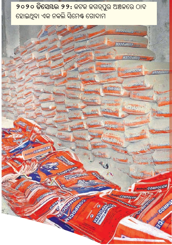
୨୦୨୦ ଡିସେମ୍ବର ୨୨: କଟକ ଜଗତପୁର ଅଞ୍ଚଳରେ ଠାବ ହୋଇଥିବା ଏକ ନକଲି ସିମେଣ୍ଟ ଗୋଦାମ