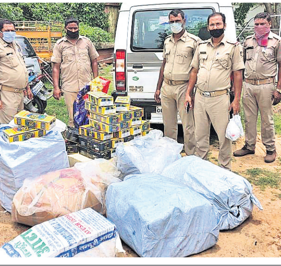
୨୦୨୧ ଜାନୁୟାରୀ ୧୭: ଭଦ୍ରକ ପୁରୁଣା ବଜାର ପୋଲିସ୍ ଦ୍ୱାରା କଟକ ହୋଇଥିବା ନକଲି ଜର୍ଦୀ।

ଯାଞ୍ଚ କଡ଼ାକଡ଼ି ସହ କାର୍ଯ୍ୟାନୁଷ୍ଠାନ ଚାଲିଛି ଭୁବନେଶ୍ୱର ମହାନଗର ନିଗମ (ବିଏମସି) ଅଞ୍ଚଳରେ ନକଲି ଖାଦ୍ୟପଦାର୍ଥ ବିକ୍ରି ଓ ବ୍ୟବହାର ଦିନକୁ ଦିନ ବୃଦ୍ଧି ପାଇବାରେ ଲାଗିଛି। ସେ ସବୁ ନକଲି ସାମଗ୍ରୀର ବିକ୍ରି ଏବଂ ବ୍ୟବହାରକୁ ରୋକିବା ପାଇଁ ବିଏମସି ପକ୍ଷରୁ ବ୍ୟାପକ ପ୍ରସ୍ତୁତି କରାଯାଇଛି। ସେହିଭଳି ନକଲି ସାମଗ୍ରୀ ପ୍ରସ୍ତୁତ କରାଯାଉଥିବା କାରଖାନାଗୁଡ଼ିକ ଉପରେ ନଜର ରଖାଯାଇଛି। ସରକାରଙ୍କ ଗାଭତଲାଭନ ଅନୁସାରେ ପ୍ରତିଦିନ ବିଏମସିର ୩ କୋର୍ଟରେ ୩ଟି ଟିମ କାର୍ଯ୍ୟ କରୁଛି। ସରକାରଙ୍କ ନିର୍ଦ୍ଦେଶାବଳୀ ଅନୁସାରେ ଆମେ କେବଳ ବଜାରରେ ବିକ୍ରି କରାଯାଉଥିବା ଖାଦ୍ୟ ପଦାର୍ଥର ମାନ ଯାଞ୍ଚ ସହ ଏହାର ହାଲକେନିଂ ଖାଦ୍ୟର ସ୍ୱାଦ ପରୀକ୍ଷା ସହ ପରିବେଶ ଆଦି ଉପରେ ତଦାରଖ କରାଯାଇଥାଏ। ଯାଞ୍ଚ ସମୟରେ ଯଦି କୌଣସି ପ୍ରକାରର ଅପମିଶ୍ରିତ କିମ୍ବା ଅଭିଯୋଗ ସାମ୍ନାକୁ ଆସେ, ତା'ହେଲେ ନିୟମ ଅନୁସାରେ ଦଣ୍ଡଦିଆନ ଓ କରମାନା କରାଯିବା ସହିତ ଖାଦ୍ୟସୁଚିକୁ ନଷ୍ଟ କରାଯାଇଥାଏ। ଗତ ୧୫ ଦିନ ମଧ୍ୟରେ ବିଏମସି ଅଞ୍ଚଳରୁ ୮୦ ହଜାର ଟଙ୍କା ଫାଇନ କରାଯିବା ସହିତ ୫୭ ୭ ଟି ସ୍ଥାନରେ ନକଲି କାରଖାନା ଚାଲୁଥିବାର ଖବର ପାଇ ତଦାର ମଧ୍ୟ କରାଯାଇଛି। -ସତ୍ୟଜିତ ପଟ୍ଟେକ, ଖାଦ୍ୟ ସୁରକ୍ଷା ଅଧିକାରୀ, ଭୁବନେଶ୍ୱର ମହାନଗର ନିଗମ