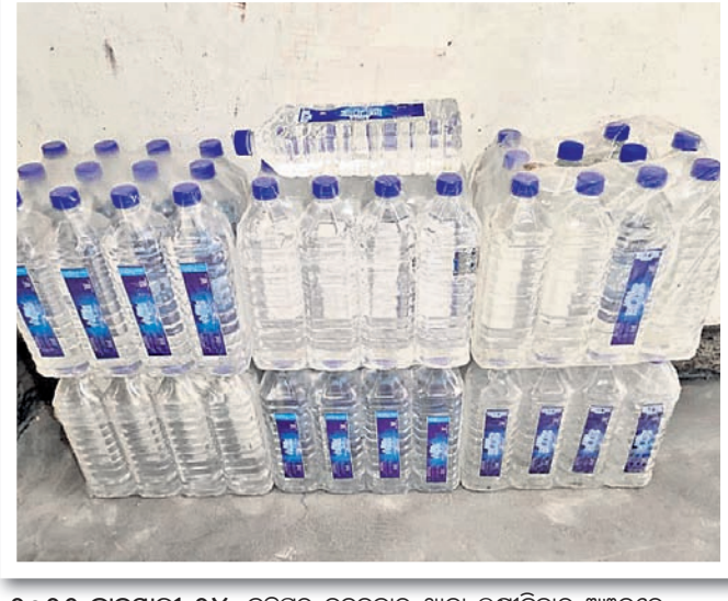
୨୦୨୧ ଜାନୁୟାରୀ ୨୪: ବ୍ରହ୍ମପୁର ବଡ଼ବଜାର ଥାନା ଲକ୍ଷ୍ମୀବିହାର ଅଞ୍ଚଳରେ ଠାବ ହୋଇଥିବା ନକଲି ପାଣି ପ୍ୟାକିଂ କାରଖାନାରୁ କଟକ ପାଣି ବୋତଲ।