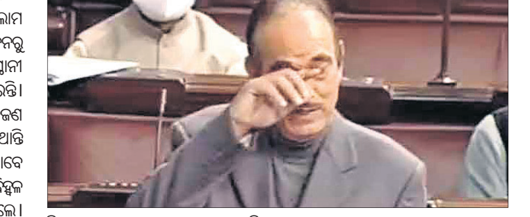
ବିବାୟା ଭାଷଣ ବେଳେ ରାଜ୍ୟ ସଭାରେ ବିରୋଧୀ ଦଳ ନେତା ଗୁଲାନ ନବା ଆଜାଦ ।

ବିଶ୍ୱର ମୁସଲମାନ ସମାଜଗୁଡ଼ିକ ଅନ୍ତର୍ଭୁକ୍ତ ହେବାରୁ ଥିବାବେଳେ ଭାରତୀୟ ମୁସଲମାନ ସେଥିରେ ପ୍ରଭାବିତ ନ ହୋଇ ଏକତ୍ର ବସବାସ କରୁଛନ୍ତି ଓ ଏହା ଜାରି ରହିବା ଉଚିତ ବୋଲି ବରିଷ୍ଠ କଂଗ୍ରେସ ନେତା କହିଥିଲେ। ତାଙ୍କ କାର୍ଯ୍ୟକ୍ରମ ପ୍ରଶଂସା କରିଥିବା ପ୍ରଧାନମନ୍ତ୍ରୀ ନରେନ୍ଦ୍ର ମୋଦି ଓ ଏକତ୍ର ବସବାସ କରୁଛନ୍ତି ଓ ଏହା ଜାରି ରହିବା ଉଚିତ ବୋଲି ବରିଷ୍ଠ କଂଗ୍ରେସ ନେତା କହିଥିଲେ। ତାଙ୍କ କାର୍ଯ୍ୟକ୍ରମ ପ୍ରଶଂସା କରିଥିବା ପ୍ରଧାନମନ୍ତ୍ରୀ ନରେନ୍ଦ୍ର ମୋଦି ଓ ଏକତ୍ର ବସବାସ କରୁଛନ୍ତି ଓ ଏହା ଜାରି