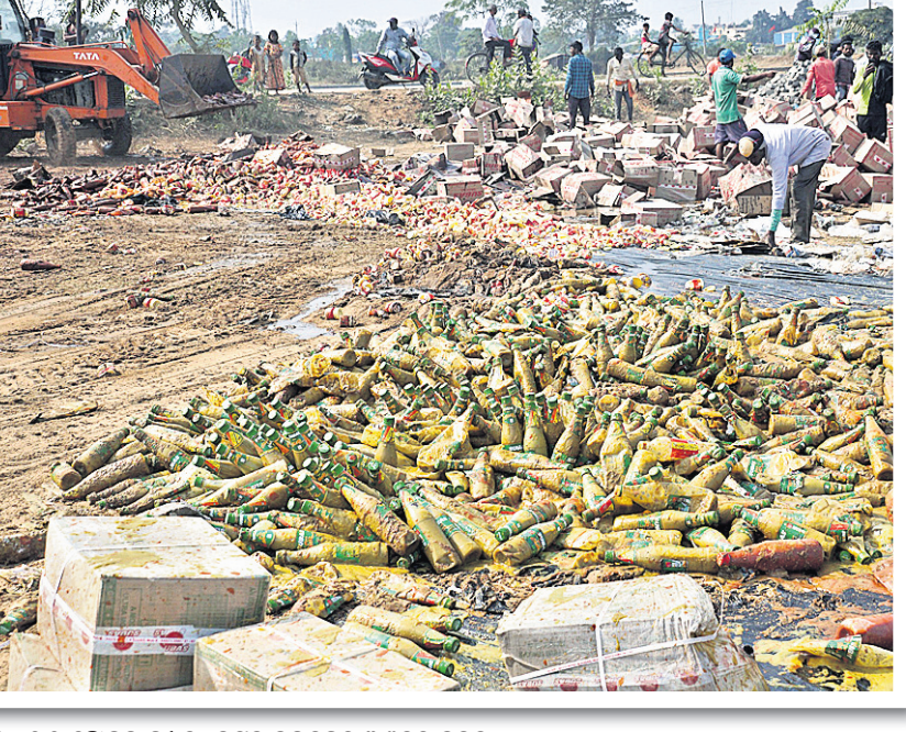
୨୦୨୧ ଫେବୃଆରୀ ୬: କଟକ ଜଗତପୁର ଅଞ୍ଚଳରୁ କଟକ ହୋଇଥିବା ନକଲି ସସ୍‌କୁ ଜେସିବି ଚଢ଼ାଇ ନଷ୍ଟ କରାଯାଇଛି।