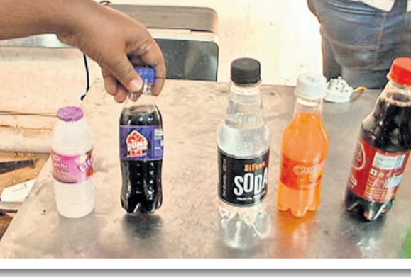
୨୦୨୧ ଫେବୃଆରୀ ୨: ଭୁବନେଶ୍ୱର ମଞ୍ଜେଶ୍ୱର ଶିଳ୍ପାଞ୍ଚଳରେ ଚାଲିଥିବା ଏକ ନକଲି କାରଖାନାରୁ କଟକ ହୋଇଥିବା ମୃଦୁପାନାୟ।