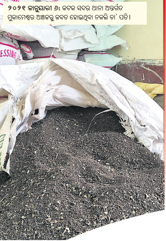
୨୦୨୧ ଜାନୁୟାରୀ ୬: କଟକ ସଦର ଥାନା ଅନ୍ତର୍ଗତ ମୁକାମେଶ୍ୱର ଅଞ୍ଚଳରୁ କଟକ ହୋଇଥିବା ନକଲି ଚା' ପତ୍ର।