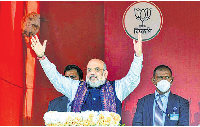
କୁଚବିହାରରେ ସଭାକୁ ସମୋ୍ଥ୍ୟ କରିବା ପାଇଁ ମମତା ଶ୍ରୀରାମ କହିବେ ।

କୁଚବିହାର, ୧୧୧୨: ପଶ୍ଚିମବଙ୍ଗ ମୁଖ୍ୟମନ୍ତ୍ରୀ ମମତା ବାନାର୍ଜୀ କଳେ ବିପକ୍ଷ ପ୍ରଶଂସା କରିବା ପାଇଁ ଆସନ୍ତା ଦିନ ଶ୍ରୀରାମ କହିବେ । ଏହା ପରେ ସେ ଆୟୋଜିତ ଏକ ପୂଜାରେ ବସିଥିଲେ ।