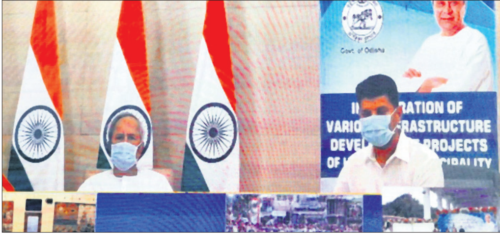
ଭିଡିଓ କର୍ମରେଶ୍ୱର ମୁଖ୍ୟମନ୍ତ୍ରୀ ନବୀନ ପଟ୍ଟନାୟକ ଉଦ୍‌ଘାଟନ କଲେ।

ହିଞ୍ଜିଳିକାର୍ଯ୍ୟ(ଡି.ଏନ୍.ଏ.)/ ଭୁବନେଶ୍ୱର(ବ୍ୟବହାର), ୧୧/୨