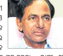
କେ. ଚନ୍ଦ୍ରଶେଖର ରାଓ

ନାଲଗୋଣା, ୧୧୧୨: ଚେଲଙ୍ଗାନା ମୁଖ୍ୟମନ୍ତ୍ରୀ କେ. ଚନ୍ଦ୍ରଶେଖର ରାଓ (କେସିଆର୍) ଏକ ସଭାରେ ଉଦ୍‌ବେଗିତ ହୋଇ କୁକୁର କହିଥିଲେ ।