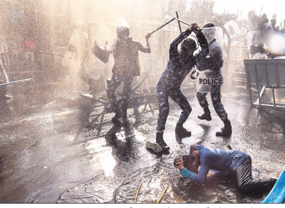
କୋଲକାତାରେ କଂଗ୍ରେସ ଓ ବାମଦଳ କର୍ମୀଙ୍କ ଉପରେ ରାପିଡ୍ ଆକ୍ସନ୍ ଫୋର୍ସ ଲାଠି ଚାର୍ଜ କରିଛି ।

କୋଲକାତା, ୧୧୧୨: କଂଗ୍ରେସ ଓ ବାମ ସଂଗଠନଗୁଡ଼ିକ ପକ୍ଷରୁ ଗୁରୁବାର ପଶ୍ଚିମବଙ୍ଗ ମୁଖ୍ୟମନ୍ତ୍ରୀ ମମତା ବାନାର୍ଜୀଙ୍କ କାର୍ଯ୍ୟାଳୟ ନିକଟରେ ଘୋର ଭାଙ୍ଗିବା ଏକ ପ୍ରତିବାଦ ଶୋଭାଯାତ୍ରା ବାହାରିଥିବାବେଳେ କୋଲକାତା ପୋଲିସ ଏହାକୁ ରୋକିଥିଲା ।