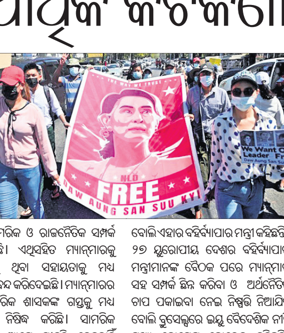
ସମସ୍ତ ସାମରିକ ଓ ରାଜନୈତିକ ସର୍ଜନ ଛିନ୍ନ କଲେ । ଏଥିପ୍ରତି ମ୍ୟାନ୍‌ମାରକୁ ବିପାତୀଙ୍କୁ ଥିବା ସହାୟତାକୁ ମଧ୍ୟ ସମର୍ଥନ ଦେବାକୁ କେସିଆର୍ କହିଛନ୍ତି ।

ସର୍ଜନ ଛିନ୍ନ କଲେ ବିଭିନ୍ନ ଦେଶ ଘୃଣିତନ, ୧୧୧୨ ମ୍ୟାନ୍‌ମାର ସୈନ୍ୟବାହିନୀ ବିଦ୍ରୋହ ବଳରେ ଗଣତାନ୍ତ୍ରିକ ସରକାରକୁ ପଦଚ୍ୟୁତ କରିଛନ୍ତି ।