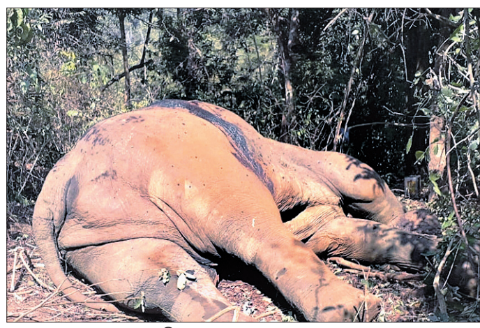
ଶିକାର ହୋଇଥିବା ଦନ୍ତାହାତୀ ।

ଡେକାନାଲ ଅଫିସ, ୧୧/୨ ଡେକାନାଲ ଜିଲ୍ଲା ହିନ୍ଦୋଳ ରେଞ୍ଜ ଅଧୀନ କନ୍ଧରା ସଂରକ୍ଷିତ ଜଙ୍ଗଲରେ ଛକାପଞ୍ଜା ହୋଇଛନ୍ତି ବନ ବିଭାଗ ଏବଂ ଶିକାରୀ । ଦାନ୍ତ ଲୋଭରେ ଏକ ଦନ୍ତାହାତୀ ଶିକାର କରାଯାଇଥିବାବେଳେ ସୂଚନା ପାଇ ଚଢ଼଼ାଉ କରିଥିଲେ ବନ କର୍ମଚାରୀ । ମୂଲ୍ୟବାନ ହାତୀଦାନ୍ତ ହରାଇବା ଆଶଙ୍କାରେ ଶିକାରୀମାନେ ଚଳାଇଥିଲେ ୧୭ ରାଉଣ୍ଡ ଗୁଳି । ସୌଭାଗ୍ୟବଶତଃ ଏଥିରୁ ବର୍ତ୍ତି ଯାଇଛନ୍ତି ୧୦ ବନ କର୍ମଚାରୀ । ଗତ ଫେବୃଆରୀ ୯ ତାରିଖରେ ଘଟିଥିବା ଏହି ଘଟଣା ଗୁରୁତାର ପଦାକୁ ଆସିଥିବାବେଳେ ସାରା ଜିଲ୍ଲାରେ ଚଢ଼଼ାଉ ପୁଣି କରିଛି । ଅନ୍ୟପକ୍ଷରେ ଏଭଳି ସମ୍ଭବନାଶୀଳ ୧୦ଦିନ ଘଟଣାରେ ଜିଲ୍ଲା ବନ ବିଭାଗ ଚପୁର ହୋଇଉଠିଛି । ଡିଏଫ୍‌ଓ ଡା. ପ୍ରକାଶ ଚାନ୍ଦ ଗୋରିନେନି ଘଟଣାସ୍ଥଳ ପରିବର୍ତ୍ତନ କରିବା ସହ ତନାଘନା କାରି ରଖିଛନ୍ତି ।