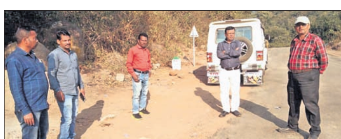
କୋରାପୁଟ ଜିଲା ପ୍ରଶାସନ ପକ୍ଷରୁ ଅଧିକାରୀମାନେ ଛୁଟି ଅନୁଧ୍ୟାନ କରୁଛନ୍ତି ।