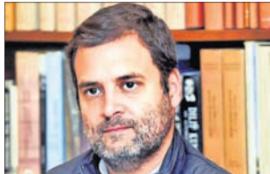
ନୂଆଦିଲ୍ଲୀ, ୧୧୧୨ (ପି.ଟି.): କୃଷି ଆଇନ ପ୍ରତ୍ୟାହାର କରାଯାଇ ନଥିବାରୁ କେନ୍ଦ୍ର ସରକାରକୁ ଚାଡ଼ି ସମାଲୋଚନା କରିଛନ୍ତି

ନୂଆଦିଲ୍ଲୀ, ୧୧୧୨ (ପି.ଟି.): କୃଷି ଆଇନ ପ୍ରତ୍ୟାହାର କରାଯାଇ ନଥିବାରୁ କେନ୍ଦ୍ର ସରକାରକୁ ଚାଡ଼ି ସମାଲୋଚନା କରିଛନ୍ତି ।