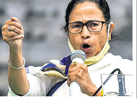
ପଶ୍ଚିମବଙ୍ଗ ମୁଖ୍ୟମନ୍ତ୍ରୀ ମମତା ବାନାର୍ଜୀ

କୋଲକାତା, ୧୧୧୨: ଭାଜପାକୁ କ୍ଷମତାରୁ ଦୂରେଇ ରଖିବା ପାଇଁ ପଶ୍ଚିମବଙ୍ଗ ଶାନ୍ତିରେ ରହିବାକୁ ଦିଅନ୍ତୁ ବୋଲି ମୁଖ୍ୟମନ୍ତ୍ରୀ ମମତା ବାନାର୍ଜୀ କହିଛନ୍ତି ।