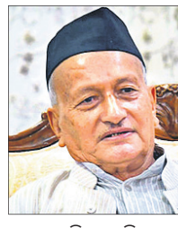
ଉତ୍ତର ସିଂ କୋଣିୟାଡ଼ା

ମୁମ୍ବାଇ, ୧୧୧୨: ମହାରାଷ୍ଟ୍ର ସରକାର ଓ ରାଜ୍ୟପାଳଙ୍କ ମଧ୍ୟରେ ପୂଣି ସୂତ୍ର ହୋଇଛି । ରାଜ୍ୟପାଳଙ୍କୁ ବିମାନ ଦେଲେନି ଉତ୍ତର ସରକାର ।