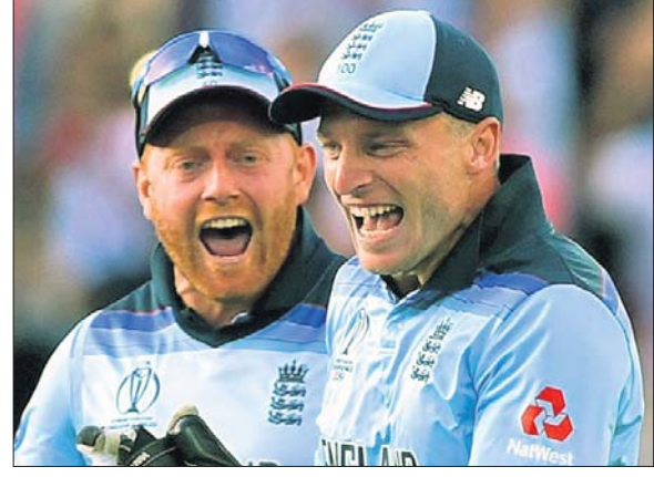
ଜନି ବେୟାରଣ୍ଡୋ ଓ ଜୋସ୍ ବଟଲର।

ଭାରତ ବିପକ୍ଷ ୫ ମ୍ୟାଚ ବିଶିଷ୍ଟ ଅନ୍ତର୍ଜାତୀୟ ଟି୨୦ ସିରିଜ ପାଇଁ ଗୁରୁବାର ୧୬ ଜଣିଆ ଇଂଲଣ୍ଡ କ୍ରିକେଟ ଦଳ ଘୋଷଣା କରାଯାଇଛି। ଏଥିରେ ସିନିୟର ଉଇକେଟକିପର ବ୍ୟାଟ୍ସମ୍ୟାନ ଜୋସ୍ ବଟଲର ଓ ଜନି ବେୟାରଣ୍ଡୋ ସ୍ଥାନ ପାଇଛନ୍ତି। ଟି୨୦ ସିରିଜ ଅନ୍ତର୍ଦ୍ଦେଶ୍ୟରେ ମାର୍ଚ୍ଚ ୧୨ରୁ ୨୦ ମଧ୍ୟରେ ହେବ। ଭାରତ ବିପକ୍ଷ ଓପନିଂ ଟେଷ୍ଟ ପରେ ବଟଲର ସ୍ୱଦେଶ ଫେରିଛନ୍ତି। ଇଂଲଣ୍ଡର ରୋଟେଶନ ନୀତି ଅନୁସାରେ ବେୟାରଣ୍ଡୋଙ୍କୁ ଭାରତ ବିପକ୍ଷ ପ୍ରଥମ ଦୁଇ ଟେଷ୍ଟରୁ ବିଶ୍ରାମ ଦିଆଯାଇଛି। ଆଇପିଏଲ ପ୍ରାଞ୍ଚିକର ଚେନାଇ ପ୍ରଥମ କିଲ୍ଲି ଅଲାଇଭର ସାମ୍ କୁରାନଙ୍କୁ ଟେଷ୍ଟ ସିରିଜରୁ ବିଶ୍ରାମ ଦିଆଯାଇଥିଲା। ତାଙ୍କୁ ଇଂଲଣ୍ଡ ଟି୨୦ ଦଳରେ ନିଆଯାଇଛି। ଭେଟେରାନ ପେସର