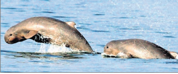
ଡଲ୍‌ଫିନଙ୍କ ଗଣନା କରାଯାଇଥିଲା । ପ୍ରଥମ ଗଣନାରେ ଭରାପାର୍ଡ, ବଟଲନୋକ, ହଫ୍‌ବ୍ୟାକ, ଫିନଲେସ ପରିପ୍ୟସ ଓ ଗାଙ୍ଗୋଟିକ ପ୍ରଭୃତି ୫ ପ୍ରଜାତିର ୨୭୦ ଡଲ୍‌ଫିନଙ୍କୁ ଚିହ୍ନିତ କରାଯାଇଥିଲା । ରାଜନଗର ବନ୍ୟପ୍ରାଣୀ ତିର୍କନ ପକ୍ଷରୁ ଚଳିତବର୍ଷ ଭିତରକନିକାରେ କାରୁୟାରୀ ୧୭ ପୂର୍ବାହ୍ନରେ ୯ଟି ଟନ ଡଲ୍‌ଫିନ

କେନ୍ଦ୍ରାପଡ଼ା ଜିଲ୍ଲା ଗହୀରମଥା ସାମୁଦ୍ରିକ ଅଭୟାରଣ୍ୟ ଜଳବାଣୀରେ ୩୦୦ ଡଲ୍‌ଫିନ ଗୁରୁତାର ସକାଳେ ଜଳକ୍ରୀଡ଼ା କରୁଥିବା ଦେଖିବାକୁ ମିଳିଛି । ଏକଦା ଡଲ୍‌ଫିନଙ୍କ ଜଳକ୍ରୀଡ଼ା ସ୍ଥାନ ଭାବେ ଓଡ଼ିଶାର ଚିଲିକା ପରିଚିତ ଥିଲା । ଗହୀରମଥା ସାମୁଦ୍ରିକ ଅଭୟାରଣ୍ୟରେ ଡଲ୍‌ଫିନଙ୍କ ସଂଖ୍ୟା ବୃଦ୍ଧି ପ୍ରାଣବିଜ୍ଞାନୀଙ୍କ ମଧ୍ୟରେ ଉଦ୍‌ଘାଟନ ହେଉଛି । ୨୦୧୫ରେ ପ୍ରଥମ କରି ଭିତରକନିକାରେ ପ୍ରାପ୍ତ ନବୀ ନାଳ ଓ ଗହୀରମଥା ସାମୁଦ୍ରିକ ଅଭୟାରଣ୍ୟରେ