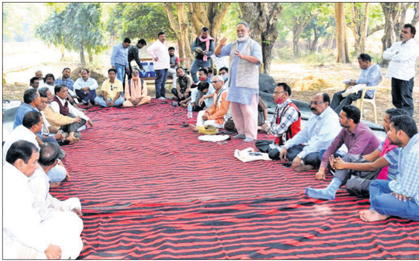
ବରେଇପାଲି ମାର୍ଚ୍ଚେଟରେ ଚାଷୀ ସଂଗଠନର ବୈଠକ।

ସମ୍ବଲପୁର ବରେଇପାଲି ମାର୍ଚ୍ଚେଟ ଯାଏଁ ପରିସରରେ ପଶ୍ଚିମ ଓଡ଼ିଶା କୃଷକ ସଂଗଠନ ସମନ୍ୱୟ ସମିତିର ଏକ ଜରୁରୀ ବୈଠକ ଶୁକ୍ରବାର ଅନୁଷ୍ଠିତ ହୋଇଯାଇଛି।