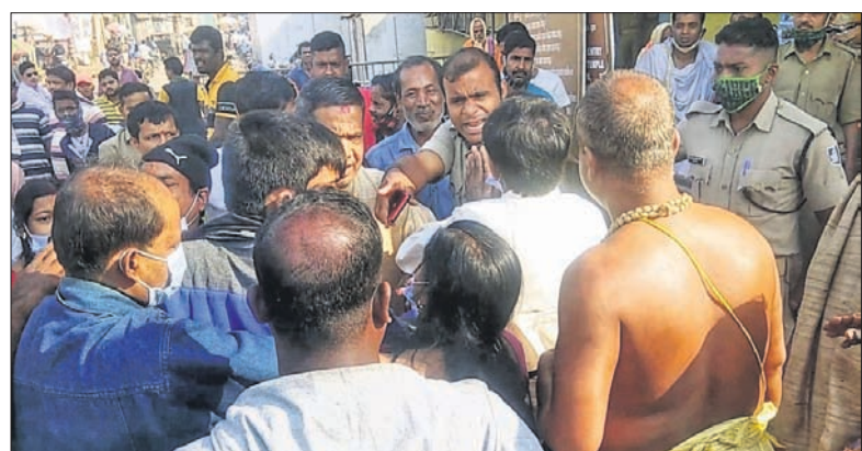
ପୋଲିସକୁ ବଙ୍ଗାୟ ପର୍ଯ୍ୟଟକ ଜଣକ ହାତ ଯୋଡ଼ି ନେହୁରା ହେଉଛନ୍ତି ।