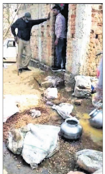
ଅବକାରୀ କର୍ମଚାରୀ ଯୋଗୁଁ ମଦ ନଷ୍ଟ କରୁଛନ୍ତି