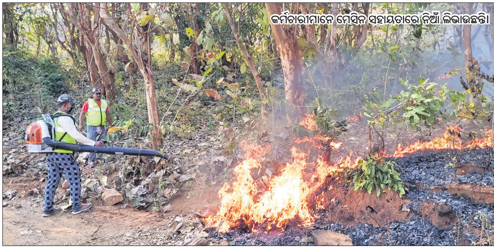
କର୍ମଚାରୀମାନେ ନିଆଁ ସମାପ୍ତକରିବା ପାଇଁ ଲାଗିପାରି ନାହାନ୍ତି।

ଭଞ୍ଜନଗର, ୧୨୨ (ଡି.ଏନ.ଏ) ନିଆଁଲାଗି ଗଞ୍ଜାମ ଜିଲ୍ଲା ଭଞ୍ଜନଗର ଜଙ୍ଗଲର ପୁରୁସର ବନଖଣ୍ଡ ପୁଲଗଡ଼ିରେ ଖୋରାଦେବୀ ଶାରୁଆନ ଜଙ୍ଗଲରେ ନିଆଁ ଲାଗିବା ସହ ଚାଷୀମାନଙ୍କୁ ବଞ୍ଚାଇବା ପାଇଁ ଲାଗିପାରି ନାହାନ୍ତି।