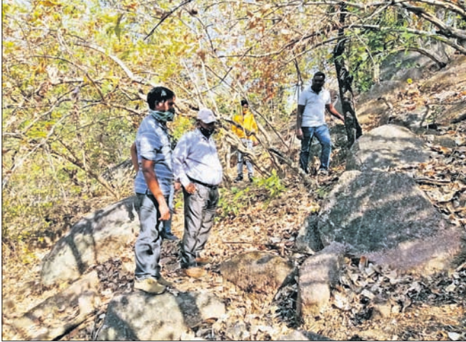
ବନ ବିଭାଗ ଓ ପୋଲିସ୍ ଘଟଣାସ୍ଥଳ ପରିବର୍ତ୍ତନ କରୁଛନ୍ତି।