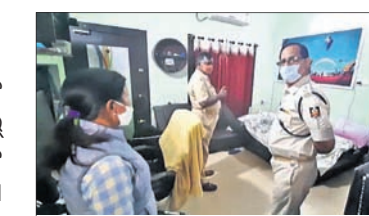
ସ୍କୁଲରେ ଏସ୍ପି ପହଞ୍ଚି ଘଟଣାର ଅନୁଧ୍ୟାନ କରୁଛନ୍ତି

ଲକ୍ଷନପୁର, ୧୨୧୨ (ଡି.ଏନ୍.ଏ.): ଝରପୁରୀ ସହର ବଡ଼େଇମୁଣ୍ଡିତ ସେଣା ପୋମାସ୍ ଇଞ୍ଜିନିୟରିଂ ସ୍କୁଲ କ୍ୟାମ୍ପସ୍ରେ ଥିବା ନିର୍ଦ୍ଦେଶକ ବାବୁବନ୍ଦନ ବନ୍ଦ କୋଠିରୁ ଶୁକ୍ରବାର ପୋଲିସ୍ ଜଣେ ମୁକ୍ତକାଳ ମୁକ୍ତଦେହ ଜବତ କରିଛି।