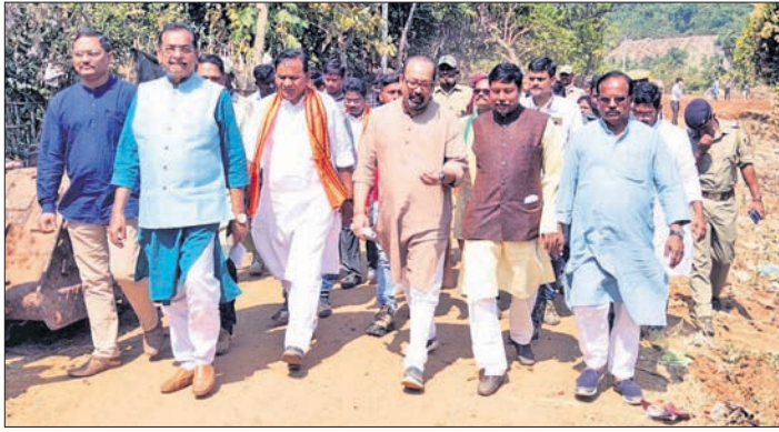
ଭାଜପା ପ୍ରତିନିଧି ବଳ ମାଣିକପାଟଣା ଗ୍ରାମ ପରିବର୍ତ୍ତନ କରୁଛନ୍ତି।

ରାଜ୍ୟ ଭାଜପାର ଏକ ଚିଫ୍ ଶୁକ୍ରବାର ଗଜପତି ଜିଲ୍ଲା ଗସ୍ତରେ ଆସି ଆନ୍ଧ୍ରପ୍ରଦେଶ ନିର୍ବାଚନ କମିଶ୍ନର ଗଙ୍ଗାବାଡ଼ ପଞ୍ଚାୟତ ଗସ୍ତ କରିଥିଲେ।