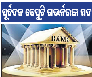
ପୂର୍ବତନ ଡେପୁଟି ଗଭର୍ନରଙ୍କ ଫଟ