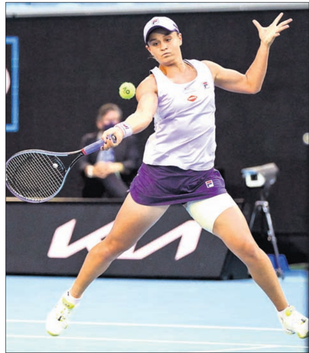
ବିଗ୍ ଶର୍ ଖେଳିବା ଅବସରରେ ଆସଲେ ବାଟି

ମେଲବର୍ନ, ୧୩୧୨: ବର୍ଷର ପ୍ରଥମ ଗ୍ରାଣ୍ଡସ୍ଲାମ ଟୁର୍ନାମେଣ୍ଟ ଶନିବାର ଷଷ୍ଠ ଦିବସରେ ପହଞ୍ଚିଛି। ପୁରୁଷ ଓ ମହିଳା ସିଙ୍ଗଲ୍ସରେ ସିଡେନ୍ ଖେଳାଳିମାନେ ଚତୁର୍ଥ ରାଉଣ୍ଡ ଅର୍ଥାତ୍ ପ୍ରି-କ୍ଵାର୍ଟର ଫାଇନାଲରେ ପ୍ରବେଶ କରିଛନ୍ତି। ପୁରୁଷ ସିଙ୍ଗଲ୍ସରେ ଦ୍ଵିତୀୟ ସିଡେନ୍ ଖେଳନା ରାଫାଲ ନାଡାଲ, ୧୨ତମ ସିଡେ ଲଗାଲାର ଫାବିଓ ଫୋଗନିନି, ପଞ୍ଚମ ସିଡେ ଗ୍ରାସ୍ ଷ୍ଟିଫାନୋଜି ସିଡେପାସ, ନବମ ସିଡେ ଲଗାଲାର ମାଟେଓ ବେରେଟିନି, ଚତୁର୍ଥ ସିଡେ ରୁଷିଆର ଡାନିଲି ମେଡଭେଡେଭ, ଆମେରିକାର ଅଣସିଡେ ଖେଳାଳି ମ୍ୟାକେଞ୍ଜି ମ୍ୟାକଡୋନାଲ୍ଡ ଓ ସପ୍ତମ ସିଡେ ରୁଷିଆର ଆନ୍ଦ୍ରେ ରୁବ୍ଲେଭ୍ ଓ ୨୪ତମ ସିଡେ ନଭୋର କାସପେର ରୁଡ୍ର ପ୍ରଭୃତି ଖେଳାଳି ତୃତୀୟ ରାଉଣ୍ଡରେ ବିଜୟୀ ହୋଇ ଅଗ୍ରଗତି କରିଛନ୍ତି।