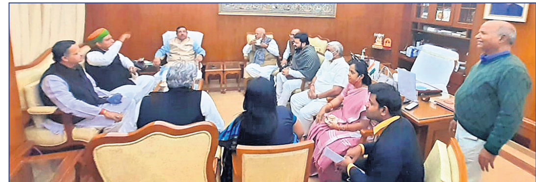
ସଂସଦୀୟ ବ୍ୟାପାର ମନ୍ତ୍ରୀ ପ୍ରହଲାଦ ଲୋଖାଙ୍କ ସହ ବିଜେଡି ପ୍ରତିନିଧି ଦଳର ଆଲୋଚନା।