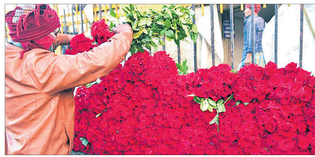
ଭାଲେଣ୍ଡାଇନ ଡେ ପାଇଁ ବେଙ୍ଗାଳୁରୁରେ ଜଣେ ବୋକାମୀ ଗୋଲାପ ପୁଲ୍ଲର ପସରା ମେଲାଉଛନ୍ତି।

ନୂଆଦିଲ୍ଲୀ, ୧୩୧୨: ପ୍ରତିରକ୍ଷା ସଂସଦୀୟ ଷ୍ଟାଫ୍ କମିଟି ପୂର୍ବ ଲଦାଖର ଗଲ୍ଡମାନ ଉପତ୍ୟକା ଓ ପାଟୋକ୍ ହ୍ରଦ ଅଞ୍ଚଳ ଗସ୍ତ କରିବାକୁ ନିଷ୍ପତ୍ତି ନେଇଛି। ଗତବର୍ଷ ମେ’ରୁ ସେଠାରେ ଭାରତ ଓ ଚାଇନା ସୈନ୍ୟକ ମଧ୍ୟରେ ପୂର୍ବପୂର୍ବ ସ୍ଥିତି ଲାଗିରହିଥିଲା। ପୂର୍ବତନ କେନ୍ଦ୍ରମନ୍ତ୍ରୀ କୁଏଲ୍ ଓରାମ୍‌ଙ୍କ ଅଧକ୍ଷତାରେ ମେ’ ଶେଷ ସପ୍ତାହ କିମ୍ପା କ୍ରମରେ ପୂର୍ବ ଲଦାଖ ଯିବାକୁ ଥିବା ୩୦ ଜଣିଆ ସଂସଦୀୟ କମିଟିରେ କଂଗ୍ରେସ ନେତା ରାହୁଲ ଗାନ୍ଧୀ ସଦସ୍ୟ ଅଛନ୍ତି।