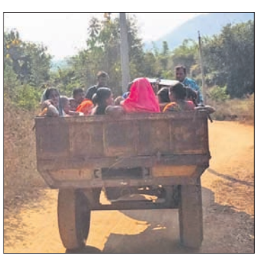
ପାତ୍ରପୁର ବ୍ଲକ୍ ରୁ ପଞ୍ଚାୟତ ଲାଭକାରୀ ଗ୍ରାମବାସୀ ଗ୍ରାହକ ଯୋଗେ ଭୋଟକେନ୍ଦ୍ରକୁ ଯାଉଛନ୍ତି।

ପାତ୍ରପୁର/ପାରଳାଖେମୁଣ୍ଡି, ୧୩୧୨ (ଡି.ଏନ୍.ଏ.)