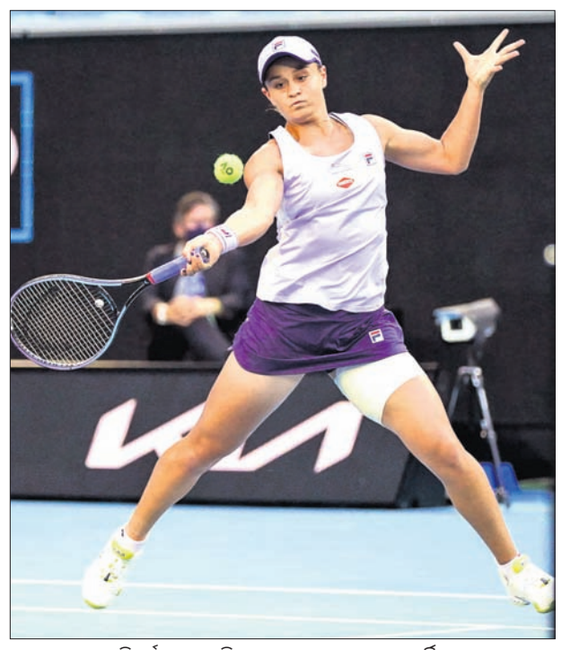
ବିଗ୍ ଶର୍ ଖେଳିବା ଅବସରରେ ଆସଲେ ବାଟି

ମେଲବୋର୍ନ, ୧୩୧୨: ବର୍ଷର ପ୍ରଥମ ଗ୍ରାଣ୍ଡସ୍ଲାମ ଟୁର୍ନାମେଣ୍ଟ ଶନିବାର ଷଷ୍ଠ ଦିବସରେ ପହଞ୍ଚିଛି। ପୁରୁଷ ଓ ମହିଳା ସିଙ୍ଗଲ୍ସରେ ସିଡେନ୍ ଖେଳାଳିମାନେ ଚତୁର୍ଥ ରାଉଣ୍ଡ ଅର୍ଥାତ୍ ପ୍ରି-କ୍ୱାର୍ଟର ଫାଇନାଲରେ ପ୍ରବେଶ କରିଛନ୍ତି। ପୁରୁଷ ସିଙ୍ଗଲ୍ସରେ ଡିଡାୟ ସିଡ୍ ସ୍ପେନର ରାଫାଲ ନାଡାଲ, ୧୬ତମ ସିଡ୍ ଇଟାଲୀର ଫାବିଓ ଫୋଗନିନି, ପଞ୍ଚମ ସିଡ୍ ଗ୍ରାସ୍ ଷ୍ଟିଫାନୋଜି ସିଡିପାସା, ନବମ ସିଡ୍ ଇଟାଲୀର ମାଟେଓ ବେରେଟିନି, ଚତୁର୍ଥ ସିଡ୍ ରୁଷିଆର ଡାନିଲ ମେଡଭେଡେଭ, ଆମେରିକାର ଅଣସିଡ୍ ଖେଳାଳି ମ୍ୟାକେଞ୍ଜି ମ୍ୟାକଡୋନାଲ୍ଡ ଓ ସପ୍ତମ ସିଡ୍ ରୁଷିଆର ଆନ୍ଦ୍ରେ ଚୁକୋଭ୍ ଓ ୨୪ତମ ସିଡ୍ ନରୱେର କାସପେର ରୁଡ୍ ପ୍ରଭୃତି ଖେଳାଳି ତୃତୀୟ ରାଉଣ୍ଡରେ ବିଜୟୀ ହୋଇ ଅଗ୍ରଗତି କରିଛନ୍ତି।