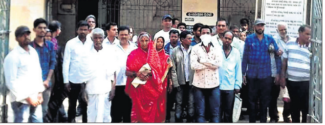
ଉପନିବନ୍ଧକଙ୍କ କାର୍ଯ୍ୟାଳୟ ସମ୍ମୁଖରେ କମ୍ପା ହୋଇଛନ୍ତି ଲୋକେ।

ଦିଗପହଣ୍ଡି ଉପନିବନ୍ଧକ ଓ ବିବାହ କାର୍ଯ୍ୟାଳୟରେ ବହୁ ଅବ୍ୟବସ୍ଥା ଦେଖିବାକୁ ମିଳୁଛି। ଘାୟା ଅଧିକାରୀ ନଥିବାରୁ କାର୍ଯ୍ୟାଳୟକୁ ଆସୁଥିବା ବହୁ ଲୋକ ଅସୁବିଧାର ସମ୍ମୁଖୀନ ହେଉଛନ୍ତି। ଶୁକ୍ରବାର ପ୍ରାୟ ୫୦ରୁ ଉର୍ଦ୍ଧ୍ଵ ଦଳିଲ୍ ରେଜିଷ୍ଟ୍ରେସନ ହୋଇପାରି ନଥିବାରୁ କ୍ରେତା ଓ ବିକ୍ରୟକାରୀ ମଧ୍ୟରେ ଉତ୍ତେଜନା ପ୍ରକାଶ ପାଇଥିଲା।