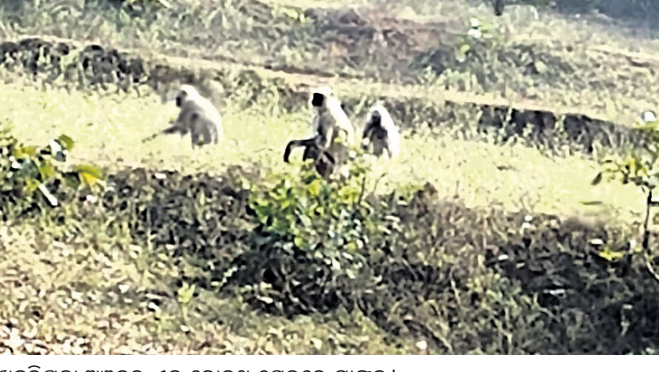
ଖଜୁରିପଡ଼ା ଅଞ୍ଚଳର ଏକ କୋଳଥ ଖେତରେ ମାଙ୍କଡ଼।

ବୈଦ୍ୟନାଥ ବେହେରା ଖଜୁରିପଡ଼ା, ୧୪୧୨ (ଡି.ଏନ୍.ଏ.)