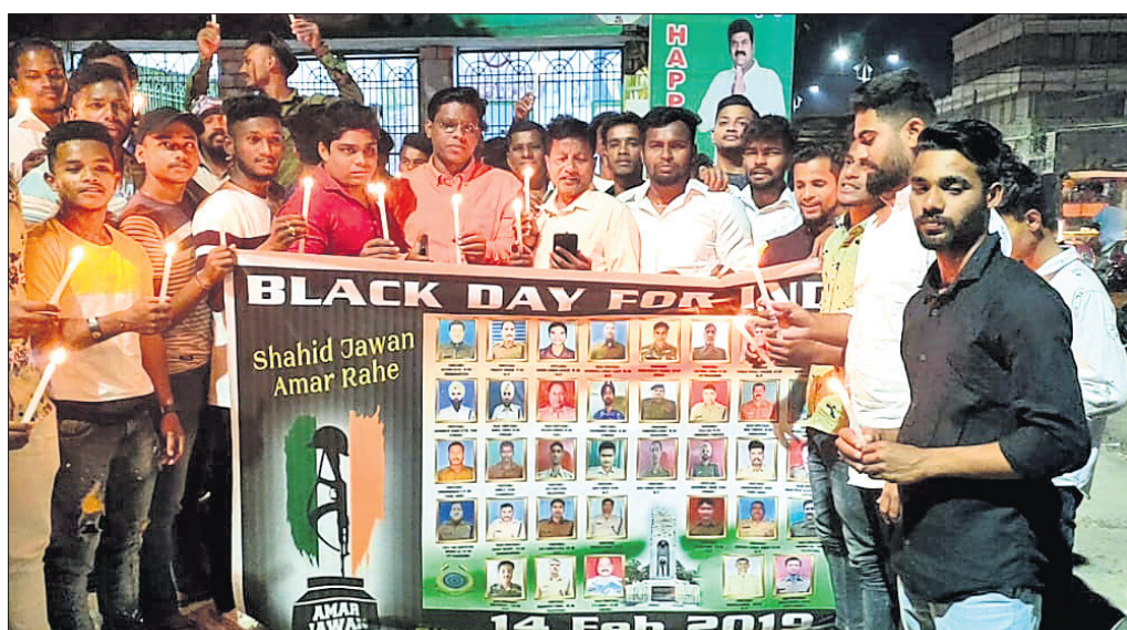
କ୍ୟାଣ୍ଡେଲ ଶୋଭାଯାତ୍ରାରେ ଉପସ୍ଥିତ ଛାତ୍ର ଓ ଯୁବ ବିଜେଡି କର୍ମକର୍ତ୍ତା।

ବ୍ରହ୍ମପୁର ଅଫିସ୍, ୧୪୧୨ ବିନାୟକ ଆଚାର୍ଯ୍ୟ କଲେଜ ଛାତ୍ରଙ୍କ ପକ୍ଷରୁ ରବିବାର ପୁଲ୍‌ଖାନା ଶହୀଦଙ୍କ ଉଦ୍‌ଘୋଷଣାରେ କ୍ୟାଣ୍ଡେଲ ଶୋଭାଯାତ୍ରା ଅନୁଷ୍ଠିତ ହୋଇଯାଇଛି। ଘ୍ନାନାୟ ଶ୍ରୀଧର ଦିନକୁ କଳା ଦିବସ ଭାବେ ଧ୍ୟାନମୋଚା ସାହିତ୍ୟ ଆଦିକା ରୋଡ଼ ପର୍ଯ୍ୟନ୍ତ ଏକ କ୍ୟାଣ୍ଡେଲ ଶୋଭାଯାତ୍ରା କରାଯାଇ ପୁଲ୍‌ଖାନା ଆକ୍ରମଣ ଘଟଣାରେ ଶହୀଦ ହୋଇଥିବା ଯବାନଙ୍କ ଫତୋରେ ପୁଷ୍ଟମାଲ୍ୟ ଅର୍ପଣ କରାଯାଇ ଶ୍ରଦ୍ଧାଞ୍ଜଳି ଜ୍ଞାପନ କରାଯାଇଥିଲା। ଆଜିର ଦିନକୁ କଳା ଦିବସ ଭାବେ ଧ୍ୟାନମୋଚା ସାହିତ୍ୟ ଆଦିକା ରୋଡ଼ ପର୍ଯ୍ୟନ୍ତ ଏକ କ୍ୟାଣ୍ଡେଲ ଶୋଭାଯାତ୍ରା କରାଯାଇ ପୁଲ୍‌ଖାନା ଆକ୍ରମଣ ଘଟଣାରେ ଶହୀଦ ହୋଇଥିବା ଯବାନଙ୍କ ଫତୋରେ ପୁଷ୍ଟମାଲ୍ୟ ଅର୍ପଣ କରାଯାଇ ଶ୍ରଦ୍ଧାଞ୍ଜଳି ଜ୍ଞାପନ କରାଯାଇଥିଲା। ଏଥିରେ