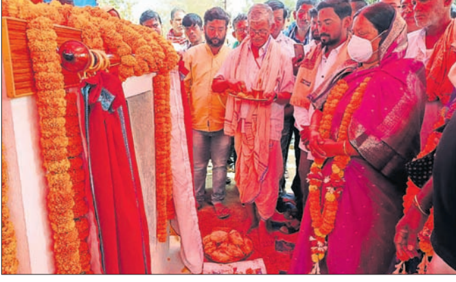
ବିଧାୟକା ଭିତ୍ତିପ୍ରସ୍ତର ଗ୍ରାମନ କରୁଛନ୍ତି।