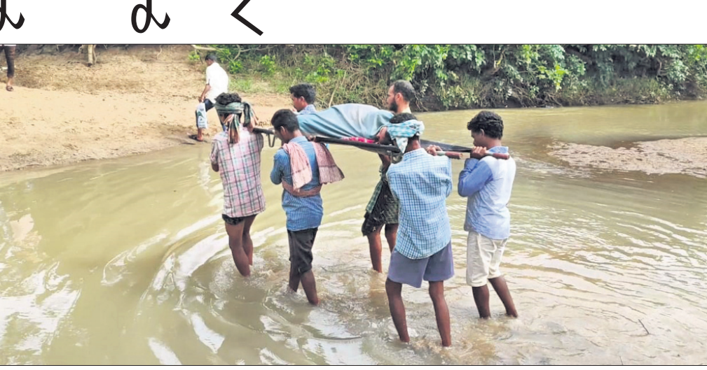
ଖେଚରରେ ରୋଗୀଙ୍କୁ ବୁଝାଯାଇଛି।