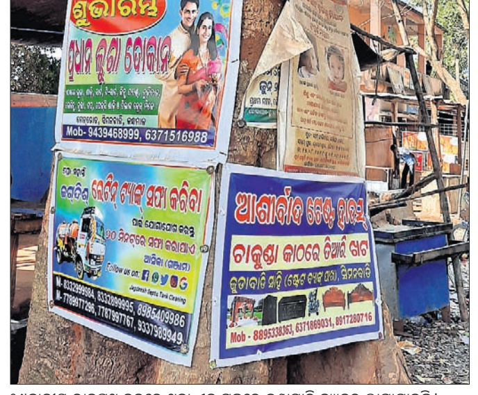
୫୯କାଡ଼ାସର ରାଜପଥ କଡ଼ରେ ଥିବା ଏକ ଗଛରେ କଣ୍ଠାମାରି ବ୍ୟାନର ଲାଗାଯାଇଛି।