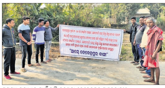
ସମସ୍ୟା ସମାଧାନ ପାଇଁ ଦାବି କରୁଥିବା ଦେବେନ୍ଦ୍ରପୁର ଅଞ୍ଚଳବାସୀ ।

ମୟୂରଭଞ୍ଜ ଜିଲ୍ଲା ବାରିପଦା ସ୍ଥିତ ଦେବେନ୍ଦ୍ରପୁର ଅଞ୍ଚଳରେ ତ୍ରେନେଜ ବ୍ୟବସ୍ଥା, ତତ୍ତ୍ୱବିତ୍ ସେଣ୍ଟର, ଅଙ୍ଗନୱାଡି କେନ୍ଦ୍ର ଓ ଶିଶୁ ଉଦ୍ୟାନ ପାଇଁ ଅଞ୍ଚଳବାସୀଙ୍କ ପକ୍ଷରୁ ଦାବି ହୋଇଛି । ଏନେଇ ବାରମ୍ବାର ଅଭିଯୋଗ କରାଯାଇଥିଲେ ହେଁ ପ୍ରଶାସନ ପକ୍ଷରୁ କୌଣସି କାର୍ଯ୍ୟାନୁଷ୍ଠାନ ଗ୍ରହଣ କରାଯାଇନାହିଁ । ଫଳରେ ସରକାରଙ୍କ ଯୋଜନାରୁ ଅଞ୍ଚଳବାସୀ ବଞ୍ଚିତ ହେଉଛନ୍ତି । ଖର୍ଚ୍ଚ ନଂ.୨୫୪ ଲୋକେ ମୌଳିକ ସୁବିଧାରୁ ବଞ୍ଚିତ ହୋଇଛନ୍ତି ।