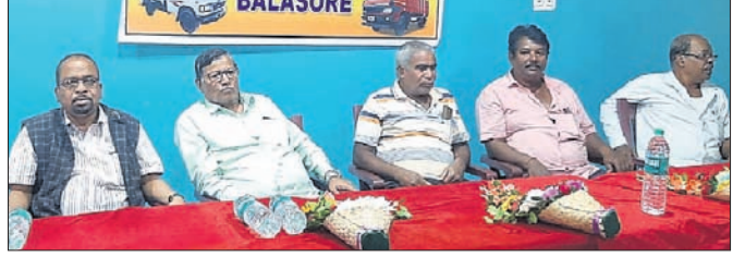
ସାଧାରଣ ସଭାରେ ମିନି ଟ୍ରକ୍ ମାଲିକ ସଂଘର କର୍ମକର୍ତ୍ତା ।