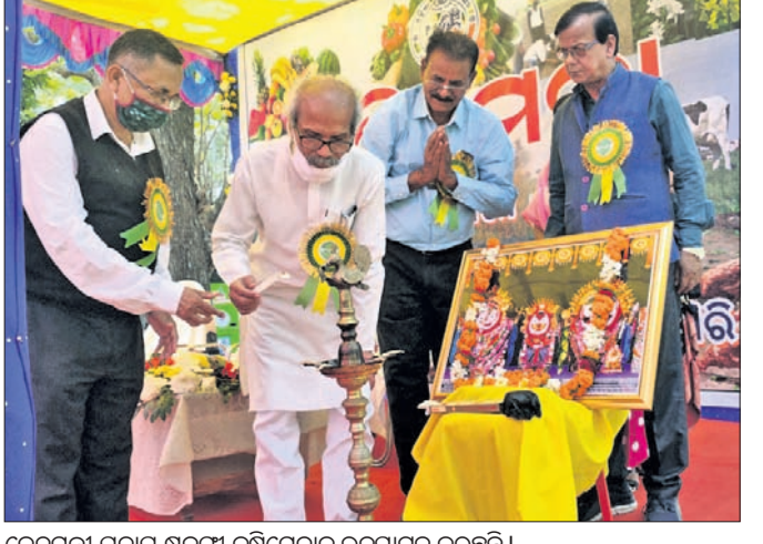
କେନ୍ଦ୍ରମନ୍ତ୍ରୀ ପ୍ରତାପ ଷଡ଼ଙ୍ଗୀ କୃଷିମେଳାକୁ ଉଦ୍ଘାଟନ କରୁଛନ୍ତି।

ସକଳଗତ, ୧୪/୧ (ଡି.ଏ.ଏ.ଏ.): କୃଷିକ୍ଷେତ୍ରରେ କାର୍ଯ୍ୟକାରୀ ହେଉଥିବା ବିଭିନ୍ନ ଯୋଜନା ସମ୍ପର୍କରେ ସଚେତନତା ଓ ଲୋକାଭିମୁଖୀ କରିବା ପାଇଁ ରିବିଭାର ବାଲେଶ୍ୱର ଜିଲ୍ଲା ନୀଳଗିରି ଡାକବଜାର ପରିସରରେ ବୁଢ଼ଦିନିଆ ଜିଲ୍ଲାପ୍ରତୀୟ କୃଷିମେଳା ଉଦ୍ଘାଟିତ ହୋଇଛି। ବାଲେଶ୍ୱର ଏମିପି ତଥା କେନ୍ଦ୍ରମନ୍ତ୍ରୀ ପ୍ରତାପ ଚନ୍ଦ୍ର ଷଡ଼ଙ୍ଗୀ ପୁଞ୍ଜୀଅତିଥି ଭାବେ ଯୋଗଦେଇ କାର୍ଯ୍ୟକ୍ରମକୁ ଉଦ୍ଘାଟନ କରି କୃଷକମାନଙ୍କର ଉତ୍ସର୍ଗାକୃତ କାର୍ଯ୍ୟର ସୁଫଳ ଆମେ ଯେପରି ପାଇଛୁ, ସେହିପରି ସେମାନଙ୍କର କଲ୍ୟାଣ ନିମନ୍ତେ କାର୍ଯ୍ୟକାରୀ ହେଉଥିବା ବିଭିନ୍ନ କୃଷିଭିତ୍ତିକ ଯୋଜନାକୁ ସଫଳତାର ସହିତ କାର୍ଯ୍ୟକାରୀ କରିବା ଉପରେ ଗୁରୁତ୍ୱାରୋପ କରିଥିଲେ। ସରକାରଙ୍କ ଆଧୁନିକ ପ୍ରଣାଳୀ, ବୈଷୟିକ ଜ୍ଞାନକୌଶଳ, ପ୍ରଶିକ୍ଷଣ ଓ ପ୍ରୋତ୍ସାହନ ଯୋଗୁ କୃଷକମାନେ ବିଶେଷ ଉପକୃତ ହୋଇପାରୁଛନ୍ତି ବୋଲି କେନ୍ଦ୍ରମନ୍ତ୍ରୀ ଷଡ଼ଙ୍ଗୀ ମତବକ୍ତ୍ୱ କରିଥିଲେ। ଏହି