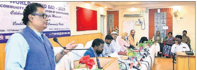
ଉଦ୍‌ଯାପନା ସମାରୋହରେ ଉପସ୍ଥିତ ଅତିଥିମାନେ।

ଓଡ଼ିଶା କମ୍ୟୁନିଟି ରେଡିଓ ମହାସଂଘ ତରଫରୁ ଇମେଡ଼ିଓରେ ବୁକ୍ସର ଧରି ଚାଲିଥିବା ବିଶ୍ୱ ରେଡିଓ ଦିବସ ସମାରୋହ ଓ ରେଡିଓ କନକ୍ରେଟ ରବିବାର ଉଦ୍‌ଯାପିତ ହୋଇଯାଇଛି। ଏଥିରେ ଓଡ଼ିଶାର ୧୭ ଗୋଷ୍ଠୀ ବେତାର କେନ୍ଦ୍ରରୁ ୧୦୦ରୁ ଅଧିକ ରେଡିଓ ପ୍ରସାରକ, ଉପସ୍ଥାପକ, ଉପସ୍ଥାପକ, ସାମାଜିକକର୍ମୀ ଓ ବିଭିନ୍ନ ସରକାରୀ ବିଭାଗର ଅଧିକାରୀ ଯୋଗଦେଇଥିଲେ। ସାମ୍ପ୍ରତିକ ସମୟରେ ମୁଖ୍ୟସ୍ତ୍ରୋତ ଗଣମାଧ୍ୟମ ଉପରେ ସାଧାରଣ ଲୋକଙ୍କର ବିଶ୍ୱସନାୟତା କମିଶନରେ ଲାଗିଛି ଓ ଅପରପକ୍ଷରେ ସୋସିଆଲ ମିଡିଆରେ ବିଭାଜିତର ସୂଚନା ସାଧାରଣ ଲୋକଙ୍କୁ ବ୍ୟଥୁତ କରୁଛି। ଏ ପରିସ୍ଥିତିରେ ଗୋଷ୍ଠୀଭିତ୍ତିକ ଗଣମାଧ୍ୟମ ହିସାବରେ କମ୍ୟୁନିଟି ରେଡିଓ ନିଜର ସ୍ଥିତି କାହିଁକି କରି ଅପହଞ୍ଚି ଲୋକାଗର ସାଧାରଣ ଲୋକଙ୍କ ମନ ଜିଣିବାରେ ସକ୍ଷମ ହୋଇଛି। ଓଡ଼ିଶାରେ ବର୍ତ୍ତମାନ ୧୯ କମ୍ୟୁନିଟି ରେଡିଓ କାର୍ଯ୍ୟକ୍ରମ ରହିଛି। ଆଗାମୀ ଦିନରେ ଓଡ଼ିଶାର ପ୍ରତି ବୁକ୍ସରେ ସ୍ଥାନୀୟ ସଙ୍ଗଠନଗୁଡ଼ିକ ଦ୍ୱାରା କମ୍ୟୁନିଟି ରେଡିଓ ସ୍ଥାପନ କରାଯିବ। 'ମିଶନ୍ ସି.ଆର୍. ୩୧୪' ସଫଳ ହେବାକୁ ଯାଉଛି