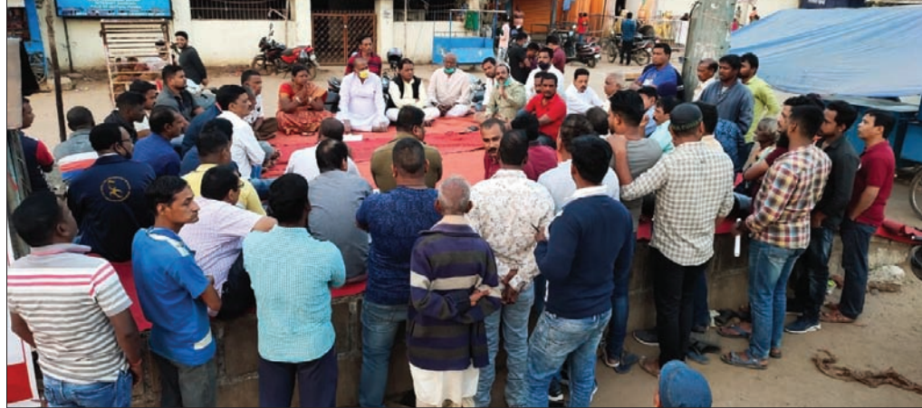
ବୈଠକରେ ଉପସ୍ଥିତ ସହରବାସୀ ।