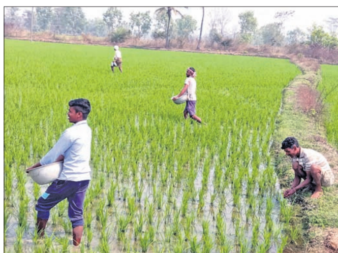
ଅଗାଧିକା ବୃଦ୍ଧ ସିନ୍ଦୂରବାହାଳ ଗ୍ରାମରେ ଜଣେ ଗଣ୍ୟା ଜମିରେ ସାର ପ୍ରୟୋଗ କରୁଛନ୍ତି।

ବରଗଡ଼ ଜିଲ୍ଲାରେ ରବି ଗଣ୍ୟାମାନ କୋର ଧରିଛି। ଅଧିକାଂଶ ଗ୍ଲାମରେ ଗଣ୍ୟାମାନେ ଚଳିପକା, ଧାନ ବୁଣା ସାରିଦେଲେଣି। କେତେକ ଗ୍ଲାମରେ ଚୁଆକାର୍ଯ୍ୟ ମଧ୍ୟ ଶେଷ ହୋଇଛି। ବର୍ତ୍ତମାନ ସମୟରେ ଧାନ ଫସଲ ପାଇଁ ଯୁକ୍ତିଆ ସାର ଆବଶ୍ୟକତା ରହିଛି। ମାତ୍ର ଏହି ସାରର ଅଭାବ ଏବଂ ନୂନାଫୋଷରେ ବେପାରୀଙ୍କ କଳାବଜାର ଗଣ୍ୟାମାନଙ୍କୁ ଚିନ୍ତାରେ ପକାଇଛି। ଯୁକ୍ତିଆ ଅଭାବ ଯୋଗୁ ଗଣ୍ୟାମାନଙ୍କୁ ଖୁବ୍ ହତଚରୀ ସମ୍ମୁଖୀନ ହେବାକୁ ପଡ଼ିଛି। ଆବଶ୍ୟକତା ଦୃଷ୍ଟିରୁ ଗଣ୍ୟାମାନେ ଚଳାବଦରେ ସାର କିଣିବାକୁ ବାଧ୍ୟ ହେଉଛନ୍ତି। ଯୁକ୍ତିଆ ସାର ପ୍ୟାକେଟ୍ (୪୫ କି.ଗ୍ରା) ପ୍ରତି ୨୬୫ ଟଙ୍କା ରହିଛି। କିନ୍ତୁ ଅସାଧୁ ବ୍ୟବସାୟୀମାନେ ଏହାକୁ ୩୦୦ରୁ ୩୫୦ ଟଙ୍କା ଦରରେ ବିକ୍ରି କରୁଥିବା ଅଭିଯୋଗ ହୋଇଛି।