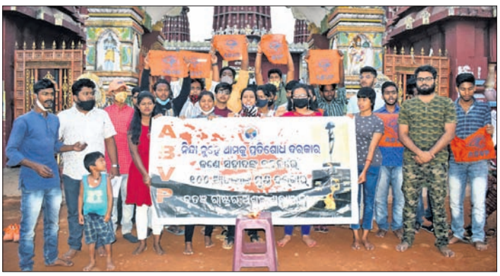
ପୁଲ୍ ଡ୍ରାମା ଆତକବାଦୀ ଆକ୍ରମଣରେ ଶହୀଦ ବୀର ଯବାନଙ୍କୁ ରବିବାର ଚିନ୍ମୟ ଇନ୍ଦ୍ରାନିୟାୟ ପକ୍ଷରୁ ଭୁବନେଶ୍ୱର ମାଷ୍ଟରକ୍ୟାଣ୍ଟିନ ଛକରେ ଶ୍ରଦ୍ଧାଞ୍ଜଳି ଅର୍ପଣ କରାଯାଇଛି। ବାଣାବିହାର ଛାତ୍ର ସଂଗଠନ ପକ୍ଷରୁ ବାହାରିଥିବା ତ୍ରିରଙ୍ଗା ଶୋଭାଯାତ୍ରା। ଏବିଭିପି ପକ୍ଷରୁ ରାମମନ୍ଦିର ସମ୍ମୁଖରେ ଶ୍ରଦ୍ଧାଞ୍ଜଳି ଦିଆଯାଇଛି।