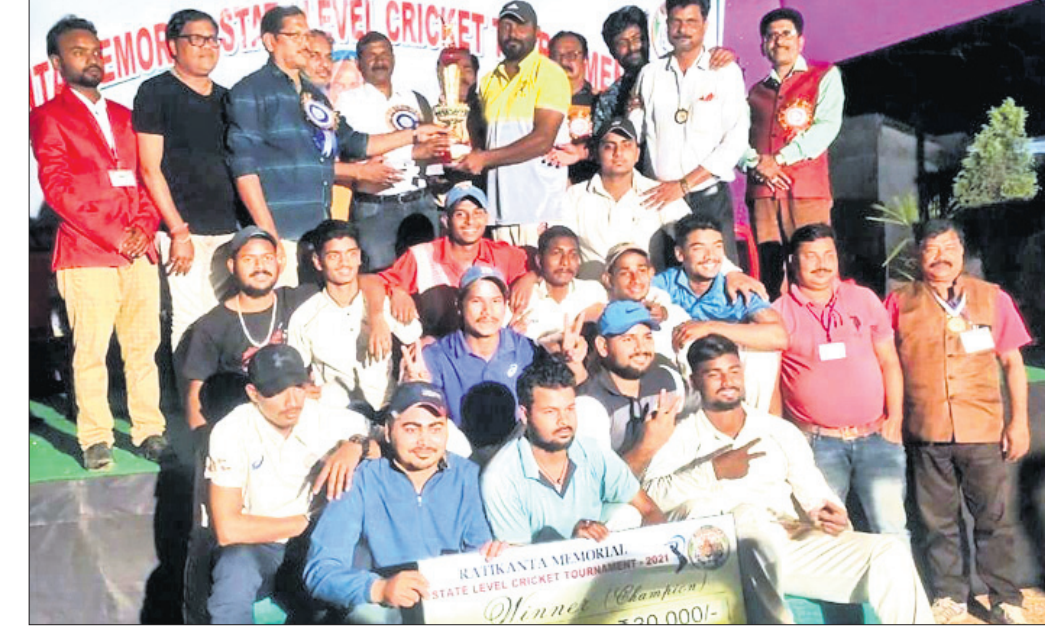
ଅତିଥିକ୍ ରହଣରେ ଚାମ୍ପିୟନ ଦଳର ଖେଳାଳିମାନେ ।