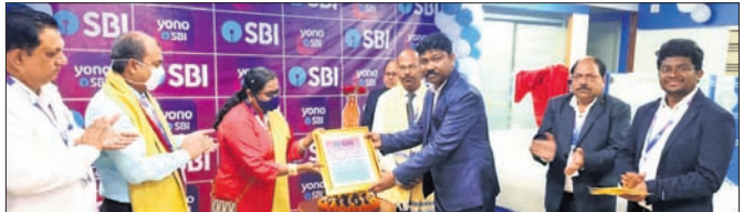
ରାଜନଗରସ୍ଥିତ ନବାକରଣ ଶାଖାକୁ ଉଦଘାଟନ କରୁଛନ୍ତି ଏସ୍ବିଆଇର କର୍ମଚାରୀ।