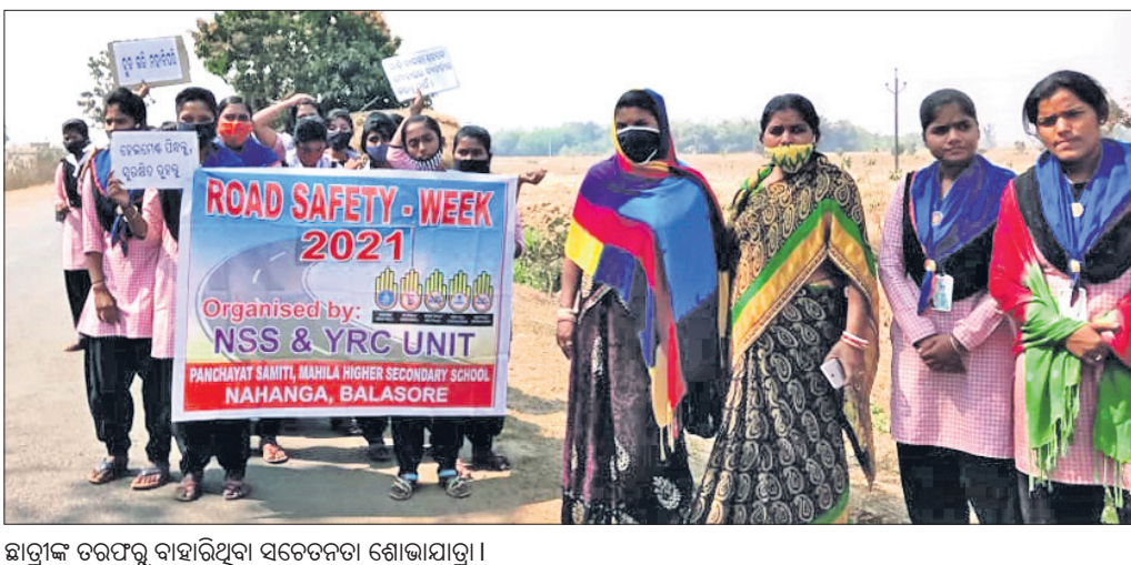
ଛାତ୍ରୀଙ୍କ ତରଫରୁ ବାହାରିଥିବା ସଚେତନତା ଶୋଭାଯାତ୍ରା।

ଖଇରା, ୧୪/୧ (ଡି.ଏ.ଏ.ଏ.): ବାଲେଶ୍ୱର ଜିଲ୍ଲା ଖଇରା ବ୍ଲକ ଅଧୀନ ନହଙ୍ଗପୁର ପଞ୍ଚାୟତ ସମିତି ମହିଳା ଉଚ୍ଚ ମାଧ୍ୟମିକ ବିଦ୍ୟାଳୟ ଜାତୀୟ ସେବା ଯୋଜନା ଓ ମୁବ ରେଡକ୍ରସର ମିଳିତ ସହଯୋଗରେ ସଡ଼କ ସୁରକ୍ଷା ମାସ ପାଳନ ଅବସରରେ ଶନିବାର ସଭା ଶୋଭାଯାତ୍ରା ଅନୁଷ୍ଠିତ