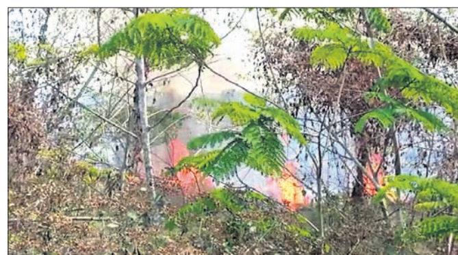
ବତାନିକାଳ ଗାଡ଼େନରେ ଲାଗିଯାଇଥିବା ନିଆଁ।