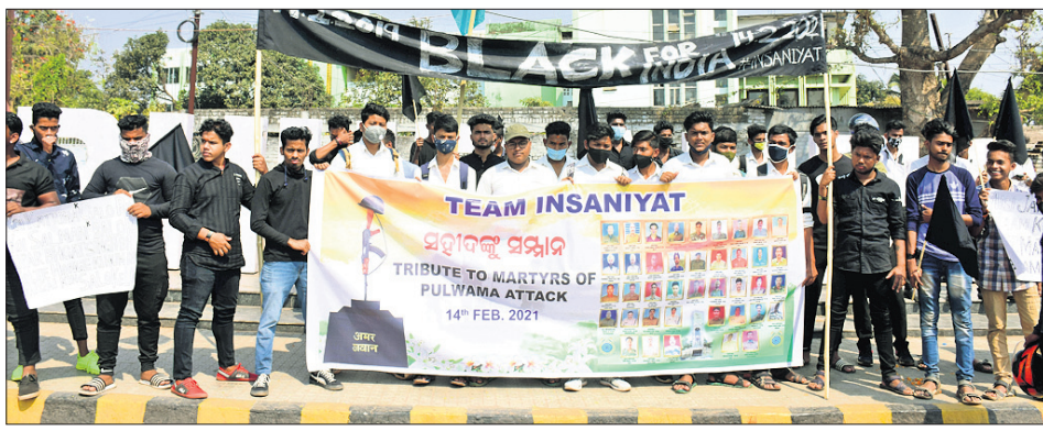
ପୁଲ୍ ଡ୍ରାମା ଆତକବାଦୀ ଆକ୍ରମଣରେ ଶହୀଦ ବୀର ଯବାନଙ୍କୁ ରବିବାର ଚିନ୍ମୟ ଇନ୍ଦ୍ରାନିୟାୟ ପକ୍ଷରୁ ଭୁବନେଶ୍ୱର ମାଷ୍ଟରକ୍ୟାଣ୍ଟିନ ଛକରେ ଶ୍ରଦ୍ଧାଞ୍ଜଳି ଅର୍ପଣ କରାଯାଇଛି। ବାଣାବିହାର ଛାତ୍ର ସଂଗଠନ ପକ୍ଷରୁ ବାହାରିଥିବା ତ୍ରିରଙ୍ଗା ଶୋଭାଯାତ୍ରା। ଏବିଭିପି ପକ୍ଷରୁ ରାମମନ୍ଦିର ସମ୍ମୁଖରେ ଶ୍ରଦ୍ଧାଞ୍ଜଳି ଦିଆଯାଇଛି।