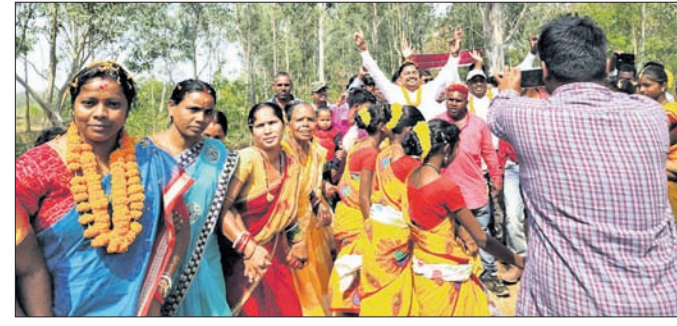
ଝୁମର ଗୀତରେ ରାଜ୍ୟସଭା ସଦସ୍ୟା ମମତା ମହାନ୍ତ ନୃତ୍ୟ କରୁଛନ୍ତି ।