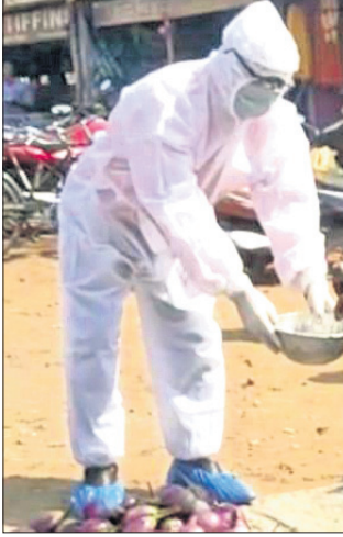
କୋଭିଡ଼ ଯୋଦ୍ଧା ଅଭିନବ ପ୍ରୟାସ ଗ୍ରହଣ କରୁଛନ୍ତି।

ଖବରଦାତା ରିପୋର୍ଟ ପାଇଁ ଗଙ୍ଗାବାଡ଼ ଯାଇଥିଲେ। ଖବର ସଂଗ୍ରହ କରିବା ବେଳେ ତାଙ୍କୁ ଦୁର୍ବ୍ୟବହାର କରିବା ହେବାର ସମ୍ଭାବନା ରହିଛି।