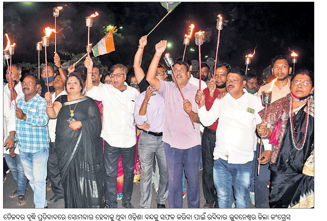
ଡ଼େକଦର ବୃଦ୍ଧ ପ୍ରତିବାଦରେ ସୋମବାର ହେବାକୁ ଥିବା ଓଡ଼ିଶା ବନ୍ଦକୁ ସଫଳ କରିବା ପାଇଁ ରବିବାର କୁବନେଶ୍ୱର ଜିଲ୍ଲା କଂଗ୍ରେସ ପକ୍ଷରୁ ମାଣ୍ଡବିଧିରେ ଉପନାୟକ ସମାଜ ଶୋଭାଯାତ୍ରା।

ଗ୍ରୀମଦିନ ରତ୍ନସିଂହାସନରେ ରବିବାର ମହାପ୍ରଭୁ ପଦ୍ମବେଶରେ ଦର୍ଶନ ଦେଇଛନ୍ତି। ଲକ୍ଷ୍ମୀଧଳ ଶ୍ରୀକାଞ୍ଚଳ ଏହି ଅନନ୍ୟ ବେଶ ଦର୍ଶନ କରି କୃତାର୍ଥ ହୋଇଛନ୍ତି। ଶନିବାର ରାତିରେ ବଡ଼ସିଂହାର ନୀତି ସମୟରେ ପଦ୍ମବେଶ ହୋଇଥିବାବେଳେ ରବିବାର ଅବକାଶ ନୀତି ପର୍ଯ୍ୟନ୍ତ ରହିଥିଲା।