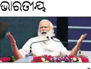
ପୁଲୁପ୍ପାମା ଆକ୍ରମଣକୁ ୨ ବର୍ଷ ସେନାକୁ ମିଳିଲା ଅର୍ଜୁନ ଯୁଦ୍ଧ ଟ୍ୟାଙ୍କ

ଦେଖାଇ, ୧୫୧୨: କର୍ମ-କର୍ମାନ୍ତର ପୁଲୁପ୍ପାମାରେ ହୋଇଥିବା ଆକ୍ରମଣକୁ ରବିବାର ୨ ବର୍ଷ ପୂରିଛି। ଏଥିରେ ଶହାଦ ୪୦ ଯବାନଙ୍କ ପ୍ରତି ଶ୍ରଦ୍ଧାଞ୍ଜଳି ଅର୍ପଣ କରିଛନ୍ତି ପ୍ରଧାନମନ୍ତ୍ରୀ ନରେନ୍ଦ୍ର ମୋଦି।