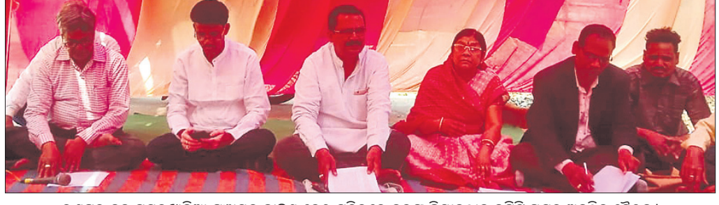
ରଣପୁର ବ୍ଲକ ମୟୂରଖାଲିଆ ପଞ୍ଚାୟତ ଦ୍ୱାରା ବୃତ୍ତଙ୍ଗ ଜଳସେଚନ ପ୍ରକଳ୍ପର ଉଦ୍ଘାଟନ କରାଯାଇଛି ।

ନୟାଗଡ଼ ଅଧିକ, ୧୪୧୨ ନୟାଗଡ଼ ଜିଲ୍ଲାରେ ବୃତ୍ତଙ୍ଗ ଜଳସେଚନ ପ୍ରକଳ୍ପ ପୀଠାଳ ଭିତରେ ଅନୁଷ୍ଠିତ ହେବ । ଦଶପଲ୍ଲୀ ବ୍ଲକର ମଞ୍ଜରୀ ଗାଁ ନିକଟରେ ହେବାକୁ ଥିବା ଏହି ପ୍ରକଳ୍ପ କାର୍ଯ୍ୟକାରୀ ହେବା ପାଇଁ ୨୦୦୦ରୁ କେନ୍ଦ୍ର ସରକାରଙ୍କର ଚେକିକାଲ ଆଡଭାଇଜର କମିଟି ଅନୁମୋଦନ ପାଇ ସାରିଛି । ୩୫୫୨ ହେକ୍ଟର ଜମିରେ ୧୦୧୪.୬୬ କୋଟି ଟଙ୍କା ବ୍ୟୟ ଅଟକଳରେ ଏହି ପ୍ରକଳ୍ପ ହେବ । ଏଥିରେ ଦଶପଲ୍ଲୀ, ନୂଆଗାଁ, ଖଣ୍ଡପଡା, ନୟାଗଡ, ଓଡଗାଁ ବ୍ଲକର ୨୩ ହଜାର ହେକ୍ଟର ଜମିରେ ଜଳସେଚନ ହେବାକୁ ଲକ୍ଷ୍ୟ ରହିଛି ।