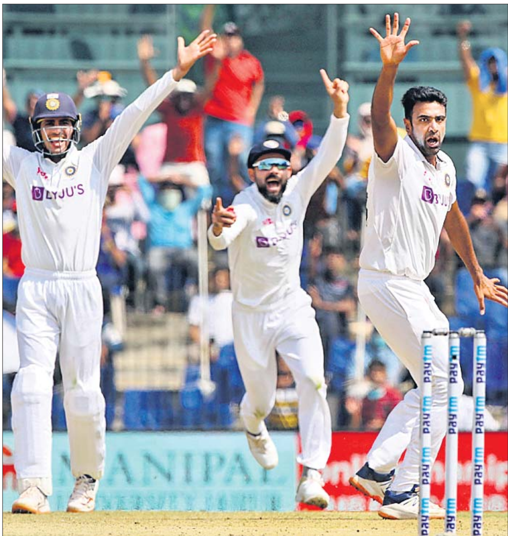
ତୋମିନିକ୍ ସିଦ୍ଧିଲଙ୍କ ଉଇକେଟ ପଡ଼ନ ପରେ ରବିଚନ୍ଦ୍ରନ ଅଶ୍ୱିନ ଓ ଅନ୍ୟ ଭାରତୀୟ ଖେଳାଳି ।

ଇଲଣ୍ଡ ବିପକ୍ଷ ଦ୍ୱିତୀୟ ଦିନରେ ଉଇକେଟ ପଡ଼ନ ପ୍ରଭାବ ବିପ୍ରାଣ କରି ଖେଳିବା ସହ ସ୍ଥିତି ଦୃଢ଼ କରିଛି। ବୋଲିଂ ଓ ବ୍ୟାଟିଂରେ ଦମ୍ଭାବର ପ୍ରଦର୍ଶନ କରି ଭାରତ ପ୍ରଥମ ଇନିଂସରେ ବୃହତ୍ ଅଗ୍ରଣୀ ହାସଲ କରି ମ୍ୟାଚ୍‌କୁ ନିୟନ୍ତ୍ରଣକୁ ନେଇଛି। ସିନରଙ୍କୁ ସୁହାରଥୁବା ଏହି ଦିନରେ ଦ୍ୱିତୀୟ ଦିନରେ ମୋଟ ୧୫ଟି ଉଇକେଟର ପଡ଼ନ ହୋଇଛି। ପିଚ୍ ତଥା ଉଇକେଟ କ୍ରମାଗତ ଭାବେ ଖରାପ ହେଉଥିବା ବେଳେ ନିର୍ଦ୍ଧାରିତ ସମୟର ବହୁ ପୂର୍ବରୁ ମ୍ୟାଚ୍‌ର ଫଳାଫଳ ମିଳିଯିବ ବୋଲି ଆଶା କରାଯାଉଛି। ଭାରତୀୟ ଅଭିଜ୍ଞ ସିନର ରବିଚନ୍ଦ୍ରନ ଅଶ୍ୱିନ ୫ ଉଇକେଟ ସଫଳତା ହାସଲ କରିବା ସହ ଇଲଣ୍ଡର ବିପର୍ଯ୍ୟୟ ଘଟାଇଛନ୍ତି। ୧୫ ଜିଟି ଭାରତ ପ୍ରଥମ ଇନିଂସରେ ୯୫.୫ ଓଭରରେ ୩୨୯ ରନ କରି ଅଲଆଉଟ ହୋଇଥିଲା। ଜବାବରେ ଇଲଣ୍ଡ ଦ୍ୱିତୀୟ ଇନିଂସ ଆରମ୍ଭ କରି ରବିବାର ୫୯.୫ ଓଭରରେ ୧୩୪ ରନ କରି ଅଲଆଉଟ ହୋଇଥିଲା। ଫଳରେ ଭାରତ ୧୯୫୫ ରନର ଅଗ୍ରଣୀ ହାସଲ