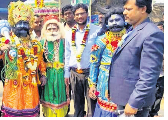
ସଡ଼କ ସୁରକ୍ଷା ଲାଗି ପଥପ୍ରାନ୍ତ ନାଟକ ମାଧ୍ୟମରେ ସଚେତନତା ।