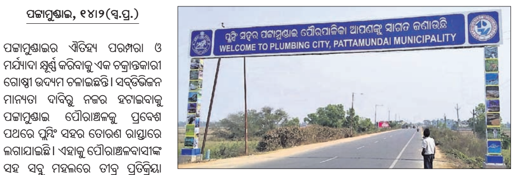
ପୁଲିଂ ସହର ପଟ୍ଟାମୁଣ୍ଡାଳର ଚୋରଣ ପୌରପାଳିକା ପକ୍ଷରୁ କରାଯାଇଛି ।