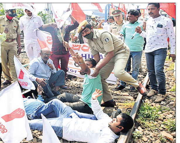
କୃଷି ଆଇନ ପ୍ରତ୍ୟାହାର ଦାବିରେ ଅଖିଳ ଭାରତ କୃଷକ ସଂଘର୍ଷ ସମିତି ପକ୍ଷରୁ କୁହୁଡ଼ି ସ୍ଟେଶନରେ ରେଳ ରୋକ୍ଷେ କରାଯାଇଛି।