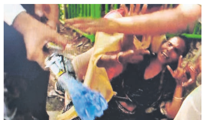
ଆତ୍ମହତ୍ୟା ଉଦ୍ୟମ କରୁଥିବା ମହିଳାଙ୍କୁ ଠାକୁର କରାଯାଇଛି ଏହା ତାଙ୍କୁ ଉଦ୍ଧାର କରାଯାଇଛି।

ଭୁବନେଶ୍ୱର, (ଡି.ଏନ.ଏ.)-କୁଳଜ, ୧୮୧୭(ଡି.ଏନ.ଏ.)