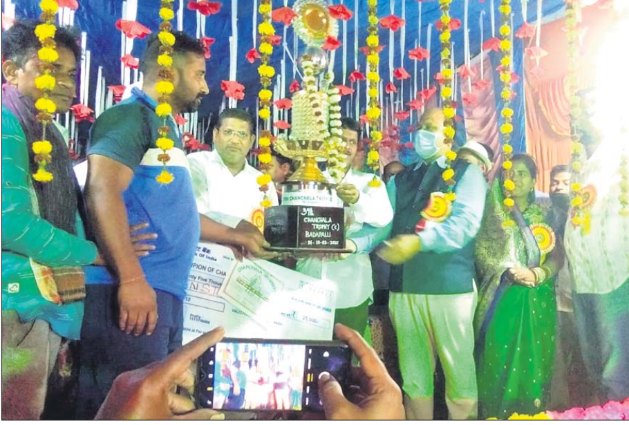
ଚାମ୍ପିୟନ ଇଲେଭେନ ଷ୍ଟାର ବଳର ଷେକାଳିମାନେ ଅତିଥିଙ୍କଠାରୁ ପୁରସ୍କାର ଗ୍ରହଣ କରୁଛନ୍ତି।