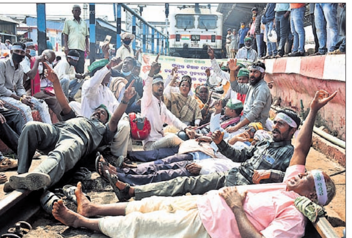
ଭୁବନେଶ୍ୱର ରେଳଷ୍ଟେଶନରେ ନବନିର୍ମାଣ କୃଷକ ସଙ୍ଗଠନର କର୍ମୀମାନେ ରେଳ ଧାରଣାରେ ଶୋଇ ରହି ପ୍ରତିବାଦ ଜଣାଇଛନ୍ତି।