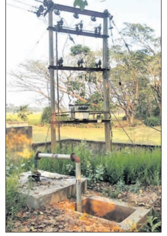
ବିଭାଗର ପ୍ରଭାବୀ ପାଇପ୍‌ଲାଇନ୍ କମିଶନ୍ ଆୟତନ (ପିଡିଏସ) ଗତ କୁଳାଳ ଓ ଅଗଷ୍ଟ ବନ୍ୟାରେ କ୍ଷତିଗ୍ରସ୍ତ ହୋଇଥିଲା ।

ଆର୍ଦ୍ରବ୍ୟୟକୁ ସୁହାଇଛି ପ୍ରାକୃତିକ ବିପର୍ଯ୍ୟୟ ନିର୍ବାହୀ ଯନ୍ତ୍ରୀ ଦାଖଲ କରିଥିବା ବିଭାଗର ପ୍ରଭାବୀ ପାଇପ୍‌ଲାଇନ୍ କମିଶନ୍ ଆୟତନ (ପିଡିଏସ) ଗତ କୁଳାଳ ଓ ଅଗଷ୍ଟ ବନ୍ୟାରେ କ୍ଷତିଗ୍ରସ୍ତ ହୋଇଥିଲା ।