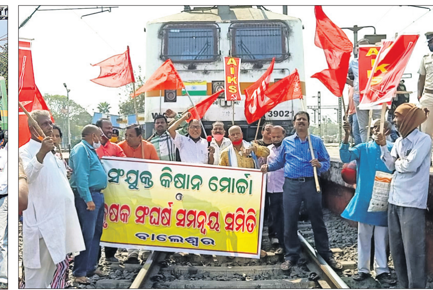
ବାଲେଶ୍ୱର ରେଳଷ୍ଟେଶନରେ ବିଭିନ୍ନ କୃଷକ ସଙ୍ଗଠନ ପକ୍ଷରୁ ବିକ୍ଷୋଭ ପ୍ରଦର୍ଶନ କରାଯାଇଛି।