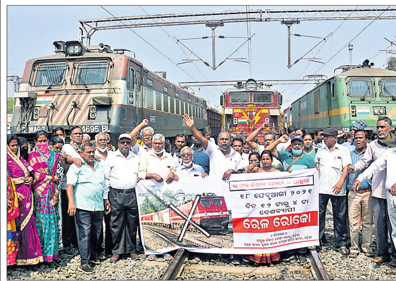
ସଂଯୁକ୍ତ କିଷାନ ମୋର୍ଚ୍ଚା ଆହ୍ୱାନରେ କଟକ ରେଳଷ୍ଟେଶନରେ ବିଆଯାଇଥିବା ଧାରଣା।