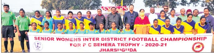
ଭୁବନେଶ୍ୱର ବି' ଓ ରାଉରକେଲା ଷ୍ଟିଲ୍ସର ଦଳର ଷେକାଳିମାନେ ଅତିଥିଙ୍କ ସହ।