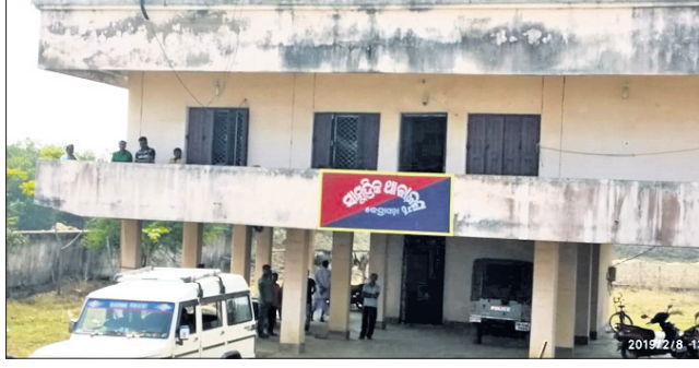
ଜନ୍ମ ସାମୁଦ୍ରିକ ଥାନା ।