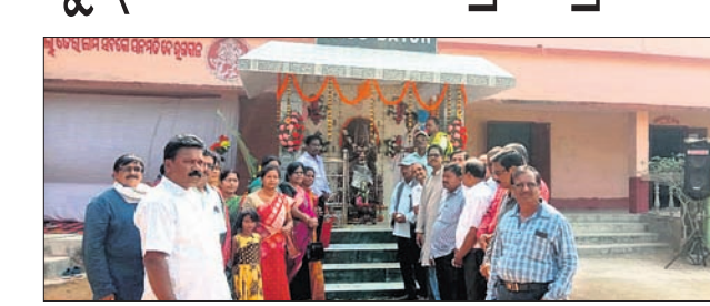
ଆଳି, ୧୮୧୨ (ଡି.ଏନ.ଏ.)

ଆଳିଊତ ବିଦ୍ୟାଳୟରେ ୧୯୮୩ ବ୍ୟାଚର ଛାତ୍ରାଛାତ୍ରୀ ସରସ୍ୱତୀ ପୂଜା ଅବସରରେ ସମବେତ ହୋଇଥିଲେ । ପରିସରରେ ନାଁ ସରସ୍ୱତୀଙ୍କ ଏକ ପଥର ମୂର୍ତ୍ତି ପ୍ରତିଷ୍ଠା କରାଯାଇଛି । ଉନ୍ନତି ପାଇଁ ଚେଷ୍ଟା କରିବାକୁ ଶପଥ ନେଇଥିଲେ । ଏହି ପରିପ୍ରେକ୍ଷାରେ ପୁରାତନ ଛାତ୍ରାଛାତ୍ରୀଙ୍କ ପକ୍ଷରୁ ବିଦ୍ୟାଳୟର ପୁରାତନ ଛାତ୍ର