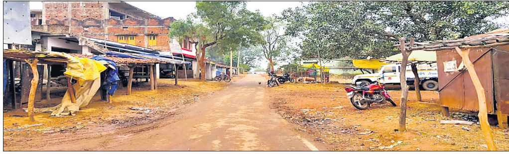
ସୁନ୍ଦରଗଡ଼ ଜିଲ୍ଲା ନୂଆଗାଁ ବ୍ଲକର ଖାଡ଼ଖଣ୍ଡ ସୀମାନ୍ତ ଗ୍ରାମ।

ଓଡ଼ିଶାର ଅନ୍ୟତମ ଉପାଦାନ ଭାବେ ସୁନ୍ଦରଗଡ଼ର ସୀମାରେ ଭାଷାଗତ ସଙ୍କଟର ବୃଦ୍ଧି ହେଉଛି।