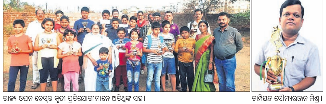
ରାଜ୍ୟ ଓପନ ଚେଷ୍ଟା କ୍ରୀଡ଼ା ପ୍ରତିଯୋଗୀମାନେ ଅଭିଭାବକ ସହ।

କିଏ ଉଇକେଟରେ ପରାସ୍ତ ହେବେ। ଭୁବନେଶ୍ୱର ରାଉରକେଲା ୯ ଉଇକେଟରେ କିଏ ପରାସ୍ତ କରିଛି। ପ୍ରଥମେ ବ୍ୟାଟିଂ କରି କିଏ ୪୯.୧ ଓଭରରେ ୨୦୦ ରନକରି ଅଲଆଉଟ ହୋଇଥିଲା। କଟକରେ ରାଉରକେଲା ୪୬ ଓଭରରେ ମାତ୍ର ଗୋଟିଏ ଉଇକେଟ ହରାଇ ୨୦୩ ରନ ସଂଗ୍ରହ କରି ବିଜୟୀ ହୋଇଥିଲା।