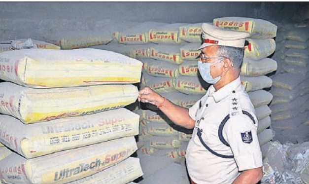
କାରଖାନାରେ ପୋଲିସ୍ ଯାଞ୍ଚ କରୁଛି ।