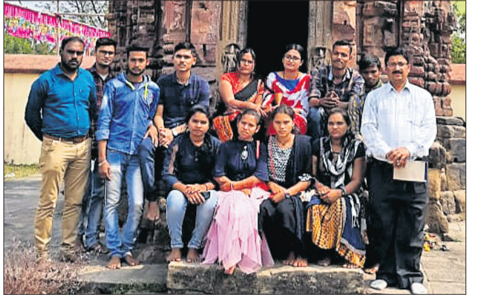
ଐତିହାସିକ ପୀଠ ପରିଦର୍ଶନ ଅବସରରେ ଛାତ୍ରୀଛାତ୍ର ।