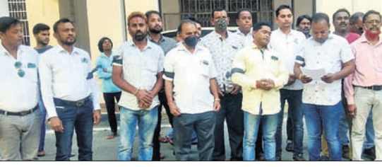
ବରଗଡ଼ ଜିଲ୍ଲାପାଳଙ୍କୁ ଫେରାଦ ହୋଇଥିବା କଂଗ୍ରେସ ପ୍ରତିନିଧି ଦଳ ।