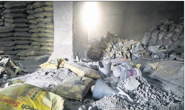
ଜବତ ଅପମିଶ୍ରିତ ସିମେଣ୍ଟ ।