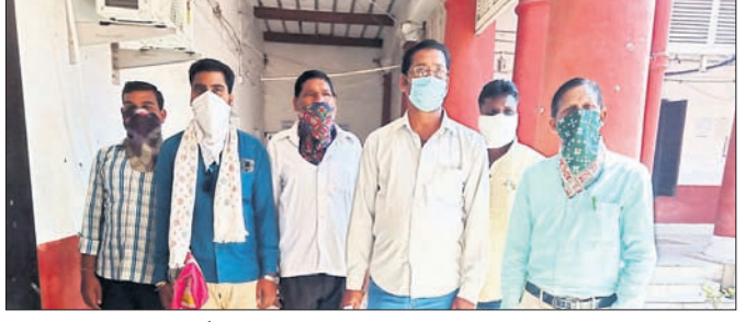
ବଲାଙ୍ଗୀର ଜିଲ୍ଲାପାଳ କାର୍ଯ୍ୟାଳୟରୁ ଅଭିଯୋଗ କରିବାକୁ ଆସିଥିବା ଯୁବା ପ୍ୟାକ୍ଟର ଗଣାମାନେ ।

ଗୁରୁତର ଅଭିଯୋଗ ଆଣିଥିଲେ । ଜମିର କିସମ ବଦଳାଇ ଓ ଅଗଣାଧାରୀଙ୍କ ନାଁରେ ତୋକର୍ କରି ଶତାଧିକ କୁଳଖଣ୍ଡ ଧାନ ବିକ୍ରୟ କରାଯାଇଥିବା ଅଭିଯୋଗ ହୋଇଛି । ସେହିପରି ଆଜି ଜମିକୁ ବାହାଲ ଦର୍ଶାଇ ଧାନ ବିକ୍ରୟ କରିଥିବା ଅଭିଯୋଗ କରିଛନ୍ତି । ସମ୍ପାଦକ ଓ ଡାକ୍ତରୀ ଏଞ୍ଚି ଯାଚ୍ଚରେ ପୂର୍ଣ୍ଣ କିସମ ଲିଷ୍ଟ ଥିବା ସେମାନେ ଦର୍ଶାଇଛନ୍ତି । ଏହି ଅଭିଯୋଗ କରିଥିଲେ । ସେମାନେ ଯୁବା ପ୍ୟାକ୍ଟର ସମ୍ପାଦକଙ୍କ ବିରୋଧରେ