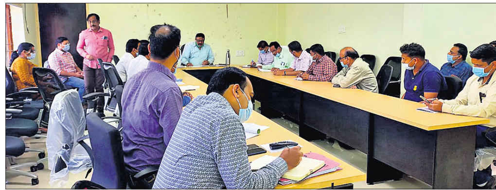
ଜିଲ୍ଲାପାଳଙ୍କ ସମ୍ମିଳନୀ କକ୍ଷରେ ଗ୍ରାହ୍ୟଯୋଗ୍ୟ ବୈଠକ ।