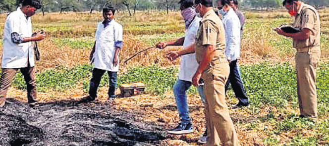
ଘଟଣାସ୍ଥଳରେ ପୋଲିସ୍ ତଦନ୍ତ କରୁଛି ।