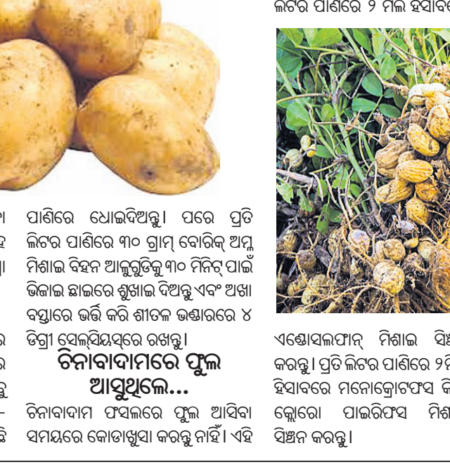
ଏହାପରେ ପତ୍ରକଣା ଓ ପତ୍ରଖୁଆ ପୋକ ଲାଗିବାର ଦେଖାଗଲେ ପ୍ରତି ଲିଟର ପାଣିରେ ୨ ମିଲି ହିସାବରେ

କଦଳୀ ମାଟିରୁ ଆରମ୍ଭ କରି ଏପ୍ରକାର ଶେଷ ପର୍ଯ୍ୟନ୍ତ ବୁଣାଯାଇଥାଏ। ପ୍ରଥମେ ଜମିକୁ ଭଲଭାବେ ବୁଣିବା କରି ଘାସ ବାଛି ଦିଅନ୍ତୁ। ଏକର ପ୍ରତି ୫ଗାଡ଼ି ଗୋବର ଖତ ଚାଷ ବେଳେ ପ୍ରୟୋଗ କରନ୍ତୁ। ଶେଷ ଓଡ଼ ଚାଷରେ ଏକର ପ୍ରତି ପିତା ନଳିତାରେ ୧୨ କି.ଗ୍ରା. ଯବକ୍ଷାରଜାନ, ୧୨କି.ଗ୍ରା. ଫସଫରସ ଓ ୧୨କି.ଗ୍ରା. ପଟାସ୍ ଏବଂ ମଧୁର ନଳିତାରେ ୮କି.ଗ୍ରା. ଯବକ୍ଷାରଜାନ, ୮କି.ଗ୍ରା. ଫସଫରସ ଓ ୮କି.ଗ୍ରା. ପଟାସ୍ ମୂଳ ସାର ଆକାରରେ ପ୍ରୟୋଗ କରନ୍ତୁ।