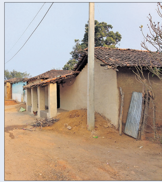
ସାମାଜିକ ରହିଥିବା ଝାରବନ୍ଧ ବ୍ଲକ ସୁକମାନୀପୁର ଗ୍ରାମ ।

ଆମେ ଓଡ଼ିଶାର ନାଗରିକ। ଏଠାରେ ଭୋର୍ ଦେଉଛି। କିନ୍ତୁ ରାଜ୍ୟର ସାମାଜିକ ଥିବାକୁ ଆମକୁ ସରକାରଙ୍କ ଯୋଜନା ସୁଫଳ ମିଳିପାରୁନାହିଁ। ଶିକ୍ଷା, ସ୍ୱାସ୍ଥ୍ୟ, ପାନୀୟଜଳ, ଗମନାଗମନ, ସାଧାରଣ ବ୍ୟବସ୍ଥା ଆଦି କ୍ଷେତ୍ରରେ ଆମେ ଅବହେଳିତ। ଓଡ଼ିଶାରେ ଥାଇ ମଧ୍ୟ ଛତିଶଗଡ଼ ଉପରେ ନିର୍ଭର କରିବାକୁ ବାଧ୍ୟ ହେଉଛି।