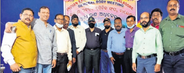
ଅତିଥିକ ରହଣରେ ନୂତନ କର୍ମକର୍ତ୍ତା ବାଲେଶ୍ୱର ଅଫିସ, ୨୩।୨