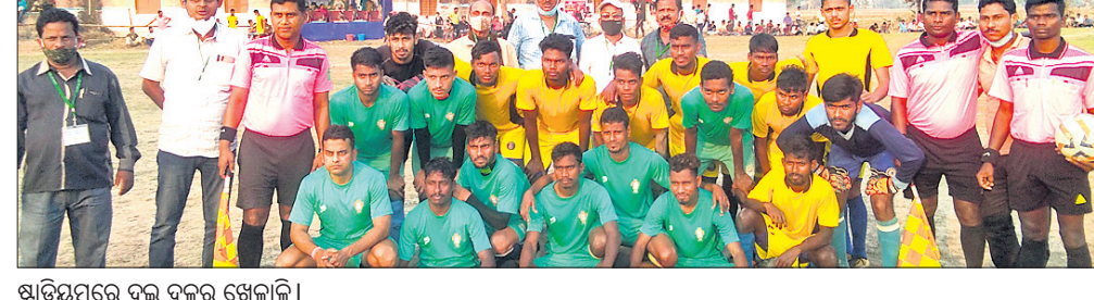
ଷ୍ଟାଡ଼ିୟମରେ ଦୁଇ ଦଳର ଖେଳାଳି

ଭଦ୍ରକ ଜିଲ୍ଲା ବାସୁଦେବପୁରର ଶୁକ୍ଳଡ଼ା ଗ୍ରାମ ସ୍ଥିତ ନାକମଣି ମିନିଷ୍ଟାଡ଼ିୟମରେ ଗଣେଶ କ୍ଲବ୍ ଆରୁକୁଲ୍ୟରେ ଚାଲିଛି। ଦିବାକର ମେମୋରିଆଲ ଆନ୍ତର୍ଜାତୀୟ ଫୁଟବଲ ଟୁର୍ଣ୍ଣାମେଣ୍ଟର ୨ୟ ପାଞ୍ଚକୋଡ଼ା ଫାଇନାଲ ଖେଳରେ ପାଞ୍ଚକୋଡ଼ା ଏକାଦଶି ଟାଇଟେକର ଗୋଲ ଜରିଆରେ ଖଡ଼ଗପୁର ଏକାଦଶିକୁ ହରାଇ ଫାଇନାଲରେ ପ୍ରବେଶ କରିଛି।