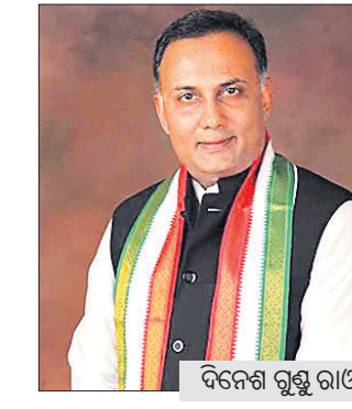
ସିରିଆଲ, ପ୍ରବର୍ତ୍ତନ ନିର୍ଦ୍ଦେଶାଳୟ (ଇଡି) ଏବଂ ଆୟକର (ଆଇଟି)

ପୁଡୁଚେରୀରେ କଂଗ୍ରେସ ସରକାର ଭାଙ୍ଗିବା ପରେ ବର୍ଷକ ମଧ୍ୟରେ ଏହି ଦଳ ଦୁଇଟି ରାଜ୍ୟରେ କ୍ଷମତା ହରାଇଛି। ଏହା ପୂର୍ବରୁ ମଧ୍ୟପ୍ରଦେଶରେ କଂଗ୍ରେସ ହାତକୁ କ୍ଷମତା ହାସଲ କରିଥିଲା। ଉଭୟ ରାଜ୍ୟରେ ଦଳର ବିଧାୟକମାନଙ୍କ ଇସ୍ତଫା ଯୋଗୁ ସରକାର ବ୍ୟାଘ୍ୟଗରିଷ୍ଠତା ହରାଇଥିଲେ। ଏଥିପାଇଁ କଂଗ୍ରେସ କେନ୍ଦ୍ରର ଭାଜପା ନେତୃତ୍ୱାଧୀନ ସରକାରକୁ ଦାୟୀ କରିଛି। ବିଭିନ୍ନ ରାଜ୍ୟର ନିର୍ବାଚିତ ସରକାରକୁ ଭାଙ୍ଗିବା ଲାଗି କେନ୍ଦ୍ର ସରକାର