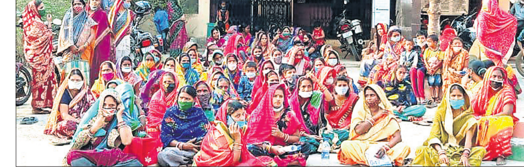
କୁଳ ସମ୍ମୁଖରେ ଧାରଣାଗତ ମହିଳାମାନେ। ଭଦ୍ରକ ଅଫିସ/ଧାମନଗର, ୨୩।୨

ଧାମନଗର କୁଳ ଭଗବାନପୁର ପଞ୍ଚାୟତ ମହିଳା ମହାସଂଘ ପକ୍ଷରୁ ମଙ୍ଗଳବାର ମହାସଂଘ ପକ୍ଷରୁ କୁଳ ସମ୍ମୁଖରେ ଧାରଣା ଦିଆଯାଇଥିଲା। ବିଭାଗୀୟ ଅଧିକାରୀମାନେ ପହଞ୍ଚି ପୋଲିସ୍ ଉପସ୍ଥିତିରେ ପ୍ରତିଶ୍ରୁତି ଦେବା ପରେ ମହିଳାମାନେ ଧାରଣା ଛାଡ଼ିଥିଲେ।