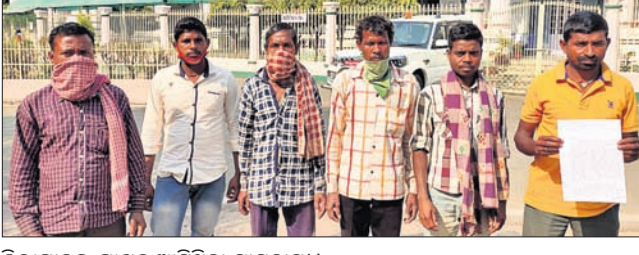
ଜିଲ୍ଲାପାଳଙ୍କ ଦ୍ୱାରସ୍ଥ ଆସିଥିବା ଗ୍ରାମବାସୀ। ଗର୍ଭବତୀ ମହିଳା ଓ ରୋଗୀଙ୍କୁ ଖବର ଦେବା ପରେ ଦୂର ନେବାପରେ ପଞ୍ଚାୟାତରେ ଆହୁଲାସ୍ତୁରେ ପଞ୍ଚାୟାତରେ ସେହିପରି ପାନୀୟ ଜଳ ସମସ୍ୟା ଆହୁଲାସ୍ତୁ ସେବା ଅପହଞ୍ଚ ହୋଇ ପଡ଼ିଛି।

କେନ୍ଦୁଝର ଜିଲ୍ଲା ବାଂଶପାଳ କୁଳ ଅନ୍ତର୍ଗତ ସୁନାଝରୀ ଗ୍ରାମର ଆଦିବାସୀ ମାନେ ସୋମବାର ଜିଲ୍ଲାପାଳଙ୍କ ଦ୍ୱାରସ୍ଥ ହୋଇ ବିଭିନ୍ନ ସମସ୍ୟା ଜଣାଇଛନ୍ତି। ଉକ୍ତ ଗ୍ରାମରେ ଉନ୍ନୟନ ମୂଳକ କାମ ହୋଇ ପାଉ ନ ଥିବାରୁ ଲୋକମାନେ ମୌଳିକ ସୁବିଧା ପାଇବାରୁ ବଞ୍ଚିତ ରହିଛନ୍ତି। ବିଦ୍ୟୁତ୍ ସଂଯୋଗ ନ ଥିବାରୁ ଅଧାରରେ ଗ୍ରାମବାସୀ ରହୁଥିବା ବେଳେ ରାସ୍ତାଘାଟ ସମସ୍ୟା ଯୋଗୁଁ ଆଦିବାସୀମାନେ ସମସ୍ୟା ଭୋଗୁଛନ୍ତି। ଏପରିକି ଜରୁରୀ କାଳୀନ ଆହୁଲାସ୍ତୁ ସେବା ଅପହଞ୍ଚ ହୋଇ ପଡ଼ିଛି।