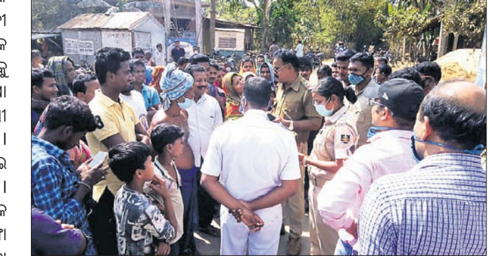
ବିରୋଧୀଙ୍କୁ ରୁଖାଶୁଖା କରୁଛନ୍ତି ବାଲିଆପାଳ ଥାନା ଆଇଆଇସି। ପଢୁଛି। ପ୍ରାକୃତିକ ଦୁର୍ଘଟଣା ସମୟରେ ବହୁ କଷ୍ଟରେ କୁଳକୁ ଫେରୁଥିବା ଅନେକ ମହାଧର୍ମାଦା ଦିଗହରା ହୋଇ