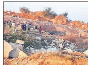
ବିଘ୍ନୋରଣରେ ୬ ମୃତ

କର୍ନାଟକର ବିଘ୍ନୋରଣ ଏବଂ ବେଲ୍ଗାଲୁର ସୀମାରେ ଏକ ଗ୍ରାମରେ ମଙ୍ଗଳବାର ବିଘ୍ନୋରଣ ଘଟଣା ଜଣକ ମୃତ୍ୟୁ ହୋଇଛି। ଏହି ଘଟଣାରେ ୬ ଜଣଙ୍କୁ ଗିରଫ କରାଯାଇଛି। ଖବର ଅନୁଯାୟୀ ଜିଲ୍ଲାଟିନି ଷ୍ଟିକ୍ସ୍‌ଟ୍ରିଟ୍ ଗାଡ଼ିରେ ନେବାବେଳେ ତାହା ବିଘ୍ନୋରଣ ହୋଇଥିଲା। ପୋଲିସ ଘଟଣାର ତଦନ୍ତ କରୁଛି। ବିଘ୍ନୋରଣ ଏବେ ଶକ୍ତିଶାଳୀ ଥିଲା ଯେ ଗାଡ଼ିଟି ସମ୍ପୂର୍ଣ୍ଣ ଧ୍ୱଂସ ହୋଇଯାଇଥିବା ବେଳେ ମୃତଦେହଗୁଡ଼ିକୁ ଚିହ୍ନଟ କରିହେଉନାହିଁ। ଖାଦ୍ୟାନରେ ବିଘ୍ନୋରଣ ପାଇଁ ଜିଲ୍ଲାଟିନି ଷ୍ଟିକ୍ସ୍ ବ୍ୟବହାର କରାଯାଉଥିଲା। ଗତ ୬ ତାରିଖରେ ପୋଲିସ୍ ଚଢ଼ାଉ ବର୍ତ୍ତିବା ଲାଗି ଖଣି ମାଲିକ ଉକ୍ତ ଜିଲ୍ଲାଟିନି ଷ୍ଟିକ୍ସ୍‌ଟ୍ରିଟ୍ ଆଣି ଲୁଚାଇ ରଖିଥିଲେ। ପୁଣି ଥରେ ଚଢ଼ାଉ ହେବା ଆଶଙ୍କାରେ ମଙ୍ଗଳବାର ଭୋର ସମୟରେ ସେ ଜିଲ୍ଲାଟିନି ଷ୍ଟିକ୍ସ୍‌ଟ୍ରିଟ୍ ଖଣି ନିକଟବର୍ତ୍ତୀ ଜଙ୍ଗଲ ମଧ୍ୟକୁ ନେଉଥିବାବେଳେ ତାହା ବିଘ୍ନୋରଣ ହୋଇଥିଲା। ବିଘ୍ନୋରଣ ଜିଲ୍ଲାର ହିରେନାଗଭାଲି ଗ୍ରାମରେ ଏହି ବିଘ୍ନୋରଣ ଘଟିଛି। ଏସିପିକ୍ ନେତୃତ୍ୱରେ ଏକ ପୋଲିସ୍ ଟିମ୍ ବିଘ୍ନୋରଣ ସ୍ଥଳ ଯାଞ୍ଚ କରିଛି।