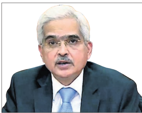
କେନ୍ଦ୍ର-ରାଜ୍ୟ ସରକାରଙ୍କୁ ଶକ୍ତିକାନ୍ତ ପରାମର୍ଶ

ଲୋକମାନେ ବର୍ତ୍ତମାନ କରୋନା ମହାମାରୀ ସମସ୍ୟାକୁ ବାହାରି ନ ଥିବା ବେଳେ ଲଗାତର ତେଲ ଦର ବୃଦ୍ଧି ଚିନ୍ତା ବଢ଼ାଇଛି। ଦେଶର ବିଭିନ୍ନ ପ୍ରାନ୍ତରେ ପେଟ୍ରୋଲ ଲିଟରେ ଲାଗି ଲୋକଙ୍କୁ ପ୍ରାୟ ୧୦୦ ଟଙ୍କା ଦେବାକୁ