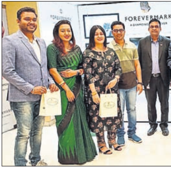
ଭୁବନେଶ୍ୱର, ୨୩/୨: ଖୁମଜୀ କୁମ୍ଭୀରୀ ପକ୍ଷରୁ ଏହାର ଭୁବନେଶ୍ୱରସ୍ଥିତ ଜନପଥ ଷ୍ଟୋରର ୧୨ତମ ବାର୍ଷିକ ଉତ୍ସବ ପାଳିତ ହୋଇଯାଇଛି।

ଫ୍ଲୁଇଡ୍ ୨୦% ରିହାତି, ରୁପା ଅଳଙ୍କାର କିଣା ମୂଲ୍ୟ ଉପରେ ଫ୍ଲୁଇଡ୍ ୧୦% ରିହାତି ଏବଂ ରୁପା ସାମଗ୍ରୀ ମୂଲ୍ୟ ଉପରେ ଫ୍ଲୁଇଡ୍ ୧୦% ରିହାତି ପ୍ରଦାନ କରାଯାଇଛି। ଚଳିତ ମାସ ୨୦ରୁ ମାର୍ଚ୍ଚ ୨୦ ପର୍ଯ୍ୟନ୍ତ ଭୁବନେଶ୍ୱରର ଖୁମଜୀର ଜନପଥ ଷ୍ଟୋର ଏବଂ ବନ୍ଦୁଶେଖରପୁର ଷ୍ଟୋରରୁ ଏହି ଅଫର ଉପଲବ୍ଧ ହେବ। ଏହି ଅବସରରେ ଖୁମଜୀ କୁମ୍ଭୀରୀ ସିଲଭ୍ ଯୋଗ୍ୟତା ଦାବିପତ୍ର ପ୍ରଦାନ କରିବାକୁ ଆମେ ଅତ୍ୟନ୍ତ ଆନନ୍ଦିତ। ଏହି ଷ୍ଟୋର ଆରମ୍ଭ ଦିନରୁ କେବଳ ଏକ