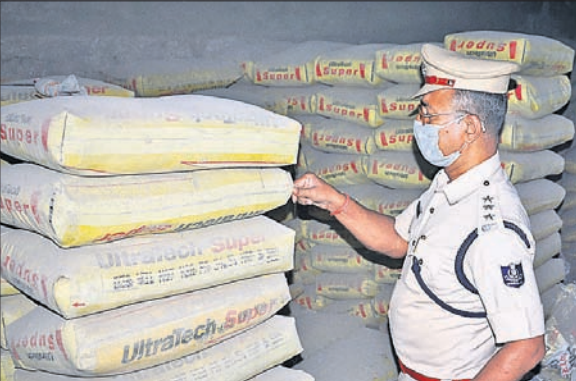
କାରଖାନାରେ ପୋଲିସ୍ ଯାଞ୍ଚ କରୁଛି ।