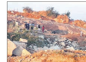
ବିଝୋରଣରେ ୬ ମୃତ

କର୍ନାଟକର ବିଝୋରଣ ଏବଂ ବେଲ୍ଗାଲୁର ସୀମାନ୍ତ ଏକ ଗ୍ରାମରେ ମଙ୍ଗଳବାର ବିଝୋରଣ ଘଟଣା ଜଣଙ୍କ ମୃତ୍ୟୁ ହୋଇଛି। ଏହି ଘଟଣାରେ ୬ ଜଣଙ୍କୁ ଗିରଫ କରାଯାଇଛି। ଖବର ଅନୁଯାୟୀ ଜିଲ୍ଲେଟିନ୍ ଷ୍ଟିକ୍‌ଗୁଡ଼ିକୁ ଗାଡ଼ିରେ ନେବାବେଳେ ତାହା ବିଝୋରଣ ହୋଇଥିଲା। ପୋଲିସ ଘଟଣାର ତଦନ୍ତ କରୁଛି। ବିଝୋରଣ ଏବେ ଶକ୍ତିଶାଳୀ ଥିଲା ଯେ ଗାଡ଼ିଟି ସମ୍ପୂର୍ଣ୍ଣ ଧ୍ୱଂସ ହୋଇଯାଇଥିବା ବେଳେ ମୃତଦେହଗୁଡ଼ିକୁ ଚିହ୍ନଟ କରିହେଉନାହିଁ। ଖାଦ୍ୟାନରେ ବିଝୋରଣ ପାଇଁ ଜିଲ୍ଲେଟିନ୍ ଷ୍ଟିକ୍ ବ୍ୟବହାର କରାଯାଉଥିଲା। ଗତ ୬ ତାରିଖରେ ପୋଲିସ ଚଢ଼ାଉ ବର୍ତ୍ତିବା ଲାଗି ଖଣି ମାଲିକ ଉକ୍ତ ଜିଲ୍ଲେଟିନ୍ ଷ୍ଟିକ୍‌ଗୁଡ଼ିକୁ ଆଣି ଲୁଚାଇ ରଖିଥିଲେ। ପୁଣି ଥରେ ଚଢ଼ାଉ ହେବା ଆଶଙ୍କାରେ ମଙ୍ଗଳବାର ଭୋର ସମୟରେ ସେ ଜିଲ୍ଲେଟିନ୍ ଷ୍ଟିକ୍‌ଗୁଡ଼ିକୁ ଖଣି ନିକଟବର୍ତ୍ତୀ ଜଙ୍ଗଲ ମଧ୍ୟକୁ ନେଇଥିବାବେଳେ ତାହା ବିଝୋରଣ ହୋଇଥିଲା। ବିଝୋରଣ ଜିଲ୍ଲାର ହିରେନାଗଭାଲି ଗ୍ରାମରେ ଏହି ବିଝୋରଣ ଘଟିଛି। ଏସିଏମ୍ ନେତୃତ୍ୱରେ ଏକ ପୋଲିସ ଟିମ୍ ବିଝୋରଣ ସ୍ଥଳ ଯାଞ୍ଚ କରିଛି।