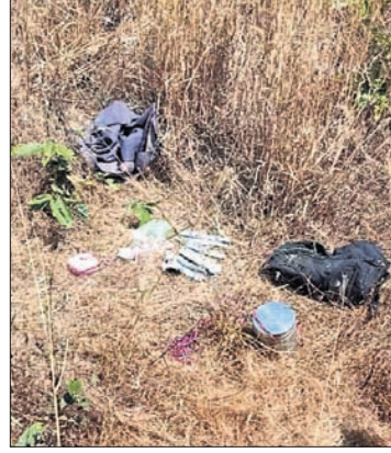
ବୋମାକୁ ନିଷ୍ଠୁର କରିଥିଲେ । ସୂଚନାଯୋଗ୍ୟ, କିଛିଦିନ ଧରି ସ୍ୱାଭିମାନ ଅଞ୍ଚଳରେ ବିସ୍ଫୋଟ ସମ୍ବନ୍ଧରେ ମାଓବାଦୀ ସାମଗ୍ରୀ ଜବତ କରି ଆସୁଛନ୍ତି । ତଥାପି ମାଓବାଦୀଙ୍କ ସେମାନଙ୍କ ଉଦ୍ଧାର କରି ରଖିଛନ୍ତି ।

ମାଲକାନଗିରି ଜିଲ୍ଲା ଡିବ୍ରୁକୋଣ୍ଡା ବ୍ଲକ୍ ସ୍ୱାଭିମାନ ଅଞ୍ଚଳର ହାତାଳକୁଡ଼ା ୯ ବାଟାଲିୟନ ବିସ୍ଫୋଟ ସମ୍ବନ୍ଧରେ ପୁଣିଥରେ ମାଓବାଦୀଙ୍କ ଯୋଜନାକୁ ପଞ୍ଚ କରିଛନ୍ତି । ଯବାନଙ୍କ ଉଦ୍ଦେଶ୍ୟରେ ସେମାନେ ଜଙ୍ଗଲ ରାସ୍ତାରେ ଖଣ୍ଡିଥିବା ଲ୍ୟାଣ୍ଡମାଇନ ଓ ଟିଫିନ ବୋମାକୁ ଠାବ କରାଯାଇଛି । ଏଥିସହ ମାଓବାଦୀଙ୍କ ଅନ୍ୟାନ୍ୟ ବ୍ୟବହୃତ ସାମଗ୍ରୀ ସେଠାରୁ ମିଳିଛି । ଗୋଲ୍ଡା ପୁତ୍ରୁ ଖବର ପାଇ ଯବାନମାନେ ସର୍ତ୍ତ ଅପରେଶନ କରୁଥିବା ବେଳେ କର୍ମଚରୀ ଗ୍ରାମ ନିକଟ ପାହାଡ଼ ପାଖରେ ମାଓବାଦୀଙ୍କ ଏକ ବ୍ୟାଗ୍ରୁ ପଡ଼ିଥିବା ଦେଖିବାକୁ ପାଇଥିଲେ । ସେହି ବ୍ୟାଗ୍ରୁ ସର୍ତ୍ତ କରିବାକୁ ସେଥିରୁ ୨ଟି ପ୍ରେସର ବୋମା, ଗୋଟିଏ ଟିଫିନ ବୋମା, ମେଡ଼ିସିନ, ବେଲ୍ଡ୍ରୋପ୍ ସାମଗ୍ରୀ ଆଦି ମିଳିଥିଲା । ଖବରପାଇ କୁରନ୍ତ ସେଠାରେ ବୋମା ନିଷ୍ଠୁରକାରୀ ଟିମ୍ ପହଞ୍ଚି ସେମାନଙ୍କ ଉଦ୍ଧାର କରି ରଖିଛନ୍ତି ।