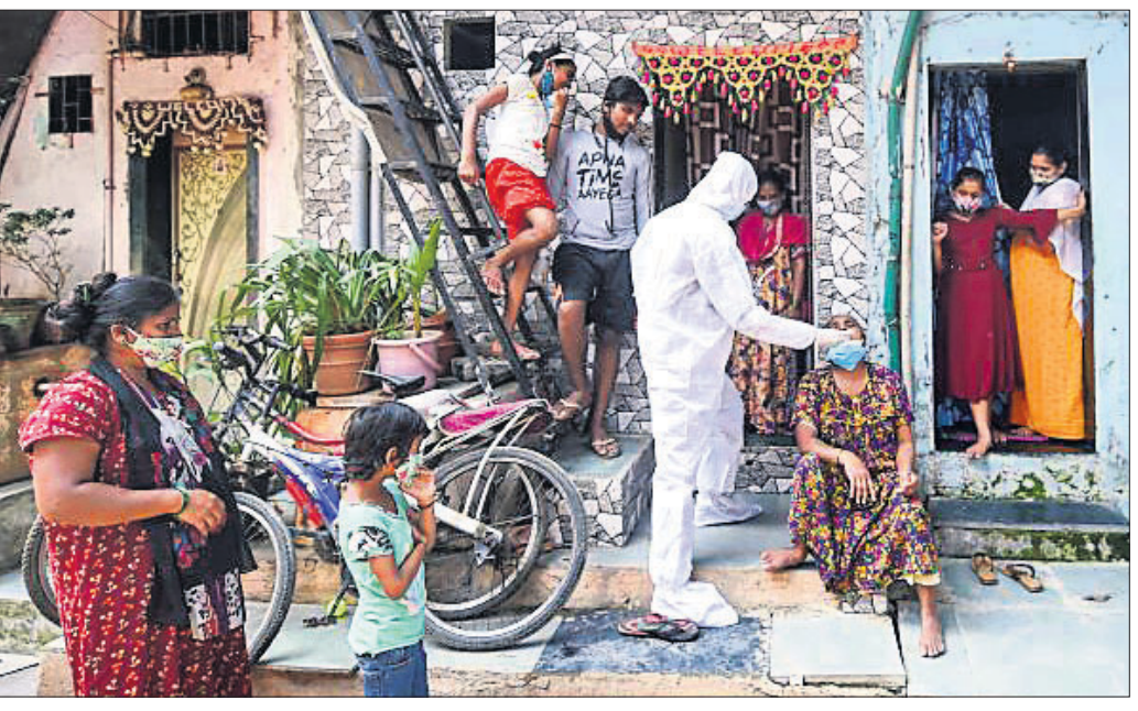
ମୁୟାଲ ଧରାଦି ବସ୍ତିରେ ବିଦର୍ଭ କର୍ମଚାରୀ କୋଭିଡ୍ ପରୀକ୍ଷା ପାଇଁ ସ୍ୱାଦ୍ ନମୁନା ସଂଗ୍ରହ କରୁଛନ୍ତି।

ମହାରାଷ୍ଟ୍ରର ମୁୟାଲ ଏବଂ ପୁଣେ ପରେ ଏବେ ବିଦର୍ଭ ଅଞ୍ଚଳ କରୋନା ସଂକ୍ରମଣର କେନ୍ଦ୍ରସ୍ଥଳ ପାଲଟିଛି। ଏହି ଅଞ୍ଚଳର ଯାଜପାଲ, ଆକୋଲା, ଅମରାବତୀ ଏବଂ ଓ଼ାଙ୍ଗା ଜିଲ୍ଲାରେ ଦୈନିକ ସଂକ୍ରମଣ ହାର ବଢ଼ିଚାଲିଛି। ସେଠାରେ ସଂକ୍ରମଣ ହାର ସେପ୍ଟେମ୍ବରର ସର୍ବୋଚ୍ଚ ଛୁଟିଠାରୁ ଅଧିକ ବୋଲି କୁହାଯାଉଛି। ଯାଜପାଲରେ ରବିବାର ସଂକ୍ରମଣ ହାର ୪୧.୪ ପ୍ରତିଶତ ଥିଲା, ଯାହାକି ସେପ୍ଟେମ୍ବର ୧୫ର ସଂକ୍ରମଣ ହାରର ଦୁଇଗୁଣ। ସେହିପରି ଅମରାବତୀରେ ସଂକ୍ରମଣ ହାର ୩୮ ପ୍ରତିଶତ ରହିଛି। ସେପ୍ଟେମ୍ବରରେ ସେଠାରେ ସଂକ୍ରମଣ ହାର ଥିଲା ୩୨.୫ ପ୍ରତିଶତ। ସେହିପରି ଓ଼ାଙ୍ଗାରେ ସଂକ୍ରମଣ ହାର ସେପ୍ଟେମ୍ବରରେ ୮.୫ ପ୍ରତିଶତ ଥିବାବେଳେ ଏବେ ତାହା ୨୪ ପ୍ରତିଶତକୁ ବୃଦ୍ଧି ପାଇଛି। ଉପରୋକ୍ତ ଅଞ୍ଚଳରେ କୋଭିଡ୍ ପରୀକ୍ଷା ଦୁଇଗୁଣ ବଢ଼ାଇ ଦିଆଯାଇଛି।