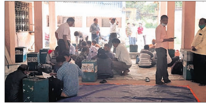
ପୋଲିଂ ଟିମ୍ ଭୋଟବାକ୍ସ ନେଇ ବୁଥକୁ ଯିବାକୁ ପ୍ରସ୍ତୁତ ହେଉଛନ୍ତି।

ଖଣ୍ଡପଡ଼ା, ୨୩୧୨ (ସ୍ୱ.ପ୍ର.): ଖଣ୍ଡପଡ଼ା ବ୍ଲକ ଅଧୀନ ରୟତ ଭୋଲମରା ପଞ୍ଚାୟତର ସରପଞ୍ଚ ପଦବୀ ପାଇଁ ଉପନିର୍ବାଚନ ରୁଧିର ଅନୁଷ୍ଠିତ ହେବ। ଏଥିପାଇଁ ବ୍ଲକ ପ୍ରଶାସନ ପକ୍ଷରୁ ଆନୁଷ୍ଠାନିକ ବ୍ୟବସ୍ଥା କରାଯାଇଛି। ଭୋଟ ଗ୍ରହଣ ପାଇଁ ୧୮ ବୁଥରେ ପୁରୁଣା ବ୍ୟବସ୍ଥା କରାଯାଇଛି। ୨ ପ୍ଲାଟ୍ଟିନ ପୋଲିସ ଫୋର୍ସ ସେଠାରେ ପୂର୍ତ୍ତୟନ କରାଯାଇଥିବା ବେଳେ ୬୦ରୁ ଊର୍ଦ୍ଧ୍ୱ ଶିକ୍ଷକଙ୍କୁ ନିର୍ବାଚନ ପରିଚାଳନା ପାଇଁ ନିଯୋଜିତ କରାଯାଇଛି। ସକାଳ ୭ଟାରୁ ୧୨ଟା ମଧ୍ୟରେ ଭୋଟ ଗ୍ରହଣ କରାଯିବ। ମୋଟ ୩୯୨୫ ଜଣ ମତଦାତା ସେମାନଙ୍କ ମତଦାନ ଅଧିକାର ସାଧ୍ୟ ହେବ। ଚିକିତ୍ସା ବେହେରା ଓ ପ୍ରଶାନ୍ତ କୁମାର ସେଠାରେ ସରପଞ୍ଚ ପଦବୀ ପାଇଁ ପ୍ରତିଦ୍ୱନ୍ଦିତା କରୁଛନ୍ତି। ଆସନ୍ତା ୨୫ରେ ଖଣ୍ଡପଡ଼ା ବ୍ଲକ କାର୍ଯ୍ୟାଳୟ ପରିସରରେ ଭୋଟ ଗଣତି କରାଯାଇ ଫଳାଫଳ ଘୋଷଣା କରାଯିବ।