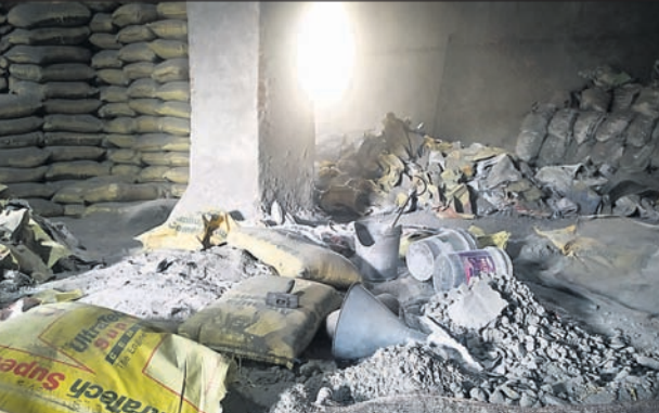
ଜବତ ଅପମିଶ୍ରିତ ସିମେଣ୍ଟ ।