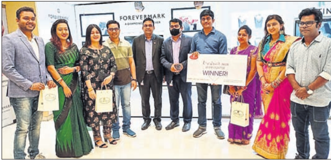
ଭୁବନେଶ୍ୱର, ୨୩/୨: ଖୁମଜୀ କୁମ୍ଭୀରୀ ପକ୍ଷରୁ ଏହାର ଭୁବନେଶ୍ୱରସ୍ଥିତ ଜନପଥ ଷ୍ଟୋରର ୧୨ତମ ବାର୍ଷିକ ଉତ୍ସବ ପାଳିତ ହୋଇଯାଇଛି। ଏହି ଅବସରରେ ହଲ୍‌ମାର୍କ ସୁନା ଅଳଙ୍କାରର ଗଢ଼ା ମୂଲ୍ୟ ଉପରେ ୮୦% ରିହାତି ଏବଂ ହାରା ଉପରେ ୫୦% ରିହାତି ଏବଂ ହାରା ଉପରେ