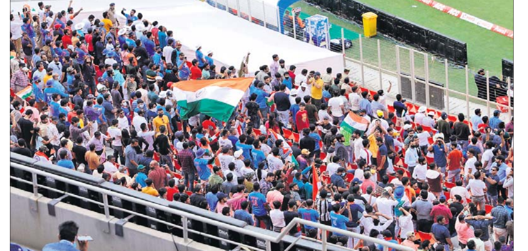
ତୃତୀୟ କ୍ରିକେଟ ଚେଷ୍ଟା ଅବସରରେ ଷ୍ଟାଡ଼ିୟମ୍‌ରେ ଉପସ୍ଥିତ ଦର୍ଶକ ।

ଅହମଦାବାଦ, ୨୪।୨ (ପି.ଟି.) ମୋଟେରା ଷ୍ଟାଡ଼ିୟମ୍‌ରୁ ନୂଆ ନାମକରଣ ହୋଇଛି । ଏବେ ଏହା ନରେନ୍ଦ୍ର ମୋଦି ଷ୍ଟାଡ଼ିୟମ୍ ରୂପେ ପରିଚିତ ହୋଇଛି ।