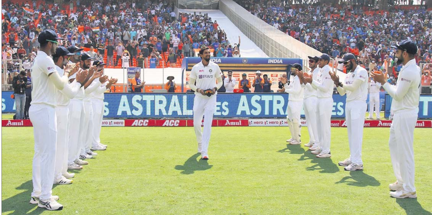
ରାଷ୍ଟ୍ରପତି ରାମନାଥ କୋବିନ୍ଦ ଏକ ସ୍ମରଣିକା ଦେଇ ୧୦୦ତମ ଚେଷ୍ଟା ଖେଳିଥିବା ଛଣାଡ଼ ଶର୍ମାଙ୍କୁ ସମର୍ଥନ କରୁଛନ୍ତି । ନିକଟରେ ଅଧିକ ଗୃହ ମନ୍ତ୍ରୀ ଅମିତ ଶାହା । ଭାରତୀୟ ଖେଳାଳିଙ୍କ ଗାର୍ତ୍ ଅଫ୍ ଅନର ।