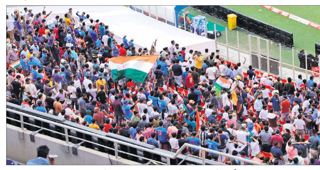
ତୃତୀୟ ଟେଷ୍ଟ ଅବସରରେ ଷ୍ଟାଡ଼ିୟମରେ ଉପସ୍ଥିତ ଦର୍ଶକ ।

ଅହମଦାବାଦ, ୨୪।୨(ପି.ଟି.) ମୋଡେରା ଷ୍ଟାଡ଼ିୟମରେ ଗୁଣା ନାମକରଣ ହୋଇଛି ଏବେ ଏହା ନରେନ୍ଦ୍ର ମୋଦି କ୍ଷୁଭିତମାନଙ୍କ ଦ୍ୱାରା ପରିଚିତ ହୋଇଛି ।