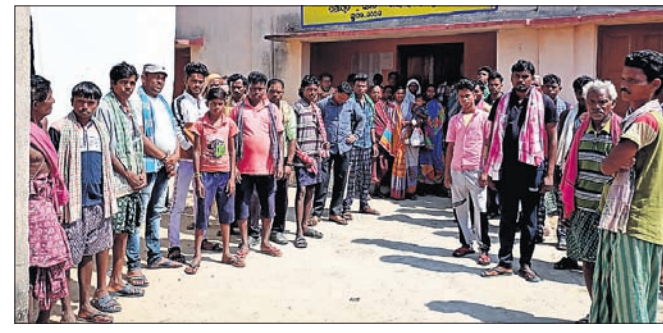
ଦୁର୍ଦ୍ଦିନଟେକା ପଞ୍ଚାୟତ ଆଗରେ ହିତାଧିକାରୀଙ୍କ ଧାରଣା ।

ସୁବର୍ଣ୍ଣପୁର ଜିଲ୍ଲା ବାରମହାରାଜପୁର ନୂତନ ଅଞ୍ଚଳର ଦୁର୍ଦ୍ଦିନଟେକା ପଞ୍ଚାୟତରେ ଗୁରୁବାର ପିଡିଏସ ଚାଉଳ ବନ୍ଧନ ନ ହେବାରୁ ଶତାଧିକ ହିତାଧିକାରୀ ଫେରି ଯାଇଛନ୍ତି । ଏହାକୁ କେନ୍ଦ୍ର କରି ଉଦ୍ଦେଶ୍ୟ ପ୍ରକାଶ ପାଇବା ସହିତ ପଞ୍ଚାୟତ କାର୍ଯ୍ୟାଳୟ ଆଗରେ ଶତାଧିକ ମହିଳା ଓ ପୁରୁଷ ଧାରଣା ଦେଇଥିଲେ । ପ୍ରକାଶ ଯେ, ପୂର୍ବ ଘୋଷଣା ଅନୁସାରେ ଗୁରୁବାର ହିତାଧିକାରୀଙ୍କୁ ଚାଉଳ ବନ୍ଧନ କରାଯିବାର ଥିଲା । ତେଣୁ ପୂର୍ବରୁ ୧୦୦୦ ସମୟରୁ ପଞ୍ଚାୟତ ଆଗରେ ହିତାଧିକାରୀଙ୍କ ଭିଡ ଜମିଥିଲା । ମାତ୍ର ମଧ୍ୟାହ୍ନ ୧୨ଟା ପର୍ଯ୍ୟନ୍ତ ଚାଉଳ ବନ୍ଧନ କରିବା ପାଇଁ କେହି ଆସି ନ ଥିଲେ । ଦୀର୍ଘ ସମୟ ପର୍ଯ୍ୟନ୍ତ ଚାଉଳ ବନ୍ଧନ ଆରମ୍ଭ ନ ହେବାରୁ ଲୋକେ ପାଟିରୁଷ