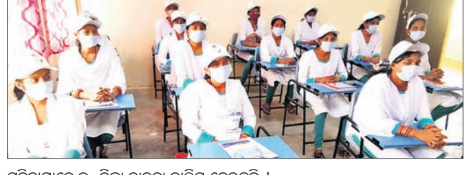
ମହିଳାମାନେ ଇ-ରିକ୍ୱା ଚାଳନା ତାଲିମ ନେଉଛନ୍ତି ।