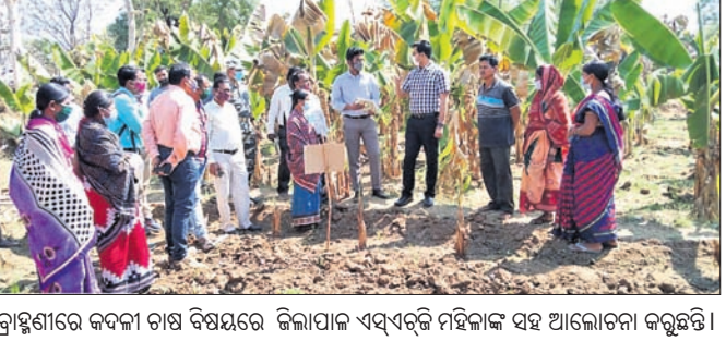
ବ୍ରାହ୍ମଣୀରେ କର୍ମଳା ଚାଷ ବିଷୟରେ ଜିଲ୍ଲାପାଳ ଏସ୍‌ଏଚ୍‌ଇ ମହିଳାଙ୍କ ସହ ଆଲୋଚନା କରୁଛନ୍ତି ।