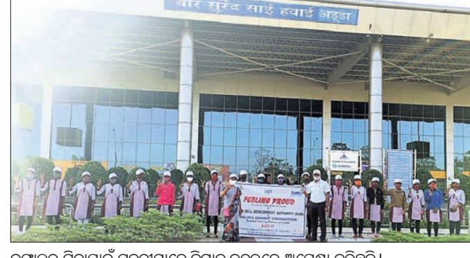
ବଙ୍ଗାଳୁରୁ ଯିବାପାଇଁ ମୁକତାମାନେ ବିମାନ ବନ୍ଦରରେ ଅପେକ୍ଷା କରିଛନ୍ତି।

ରାଜ୍ୟରେ ରଣ ଭାର ବଢ଼ିଚାଲିଛି। ଶାସକଙ୍କ ବଜେଟ୍ ଆଲୋଚନାରେ ରାଜ୍ୟ ଉପରେ ରଣ ଭାର ବଢ଼ିଚାଲିଛି। ସମାଜ ଓ ଶାସକଙ୍କ ମଧ୍ୟରେ ଏହି ବଜେଟ୍ ଆଲୋଚନାରେ ରାଜ୍ୟ ଉପରେ ରଣ ଭାର ବଢ଼ିଚାଲିଛି।