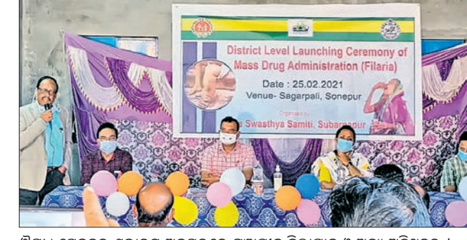
ଔଷଧ ସେବନର ଶୁଭାରମ୍ଭ ଅବସରରେ ମହାସାଧନ ଜିଲ୍ଲାପାଳ ଓ ଅନ୍ୟ ଅତିଥିବୃନ୍ଦ ।