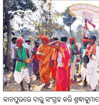
କାନପୁରରେ ଦାବୁ ସଂଗ୍ରହ କରି ଶ୍ରଦ୍ଧାଳୁମାନେ ଆସୁଛନ୍ତି ।

ଓ ମହୁଲ ବୃକ୍ଷ ଚିତ୍କଟ ହୋଇଥିଲା । ବୃକ୍ଷ ନିକଟରେ ପୂଜା, ହୋମ ଆଦି କରାଯାଇ ଦାବୁ ସଂଗ୍ରହ କରାଯାଇଥିଲା । ଦାବୁ ସଂଗ୍ରହ କାର୍ଯ୍ୟକ୍ରମରେ ଗ୍ରାମର ଗୌଡ଼ିଆ ସ୍ୱୟମ୍ଭୂତା ଖଣ୍ଡବିରା ଓ ପଦ୍ମା ପୁଷ୍ପା କର୍ମକଳେବର । ଏଥିପାଇଁ ଦାବୁ ସଂଗ୍ରହ କାର୍ଯ୍ୟକ୍ରମ ଆରମ୍ଭ ହୋଇଯାଇଛି । ଠାକୁରାଣୀଙ୍କଠାରୁ ଆଞ୍ଚଳିକ ନେଇ ଏକ ଶୋଭାଯାତ୍ରାରେ ପୂଜକ, କର୍ତ୍ତା ଓ ଶ୍ରଦ୍ଧାଳୁ ଦାବୁ ସଂଗ୍ରହ ପାଇଁ ବାହାରିଥିଲେ । ନିକଟସ୍ଥ ସରଗିପାଲି ଜଙ୍ଗଲରେ ରୋହିଣୀ