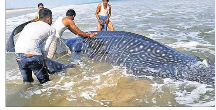
ସମୁଦ୍ର ଉପକୂଳରେ ବିରଳ ହେଲ୍ ସାର୍କ।

ଗଞ୍ଜାମ ଜିଲା ଚିକିତ୍ସା ବ୍ଲକ୍ ସୁନୁପୁରସ୍ଥିତ ସମୁଦ୍ର ଉପକୂଳରେ ଗୁରୁବାର ଅପରାହ୍ନରେ ଏକ ବିରଳ ପ୍ରଜାତିର ହେଲ୍ ସାର୍କ ଦେଖିବାକୁ ମିଳିଥିଲା। ପର୍ଯ୍ୟଟକମାନେ ବେଳାଭୂମିରେ ବୁଲୁଥିବାବେଳେ ହଠାତ୍ ସାର୍କ କୁଳକୁ ଆସିଥିବା ଦେଖିଥିଲେ। ଖବର ପ୍ରଚାର ହେବାପରେ ଏହାକୁ ଦେଖିବାକୁ ବେଳାଭୂମିରେ ଲୋକଙ୍କ ଭିଡ଼ ଜମିଥିଲା। ଗ୍ରାମବାସୀ ବ୍ରହ୍ମପୁର ବନଖଣ୍ଡ ଅଧିକାରୀଙ୍କୁ ଜଣାଇବା ପରେ ଡିଏଫ୍‌ଓଙ୍କ ନିର୍ଦ୍ଦେଶରେ ଗମନା ଫରେଷ୍ଟର ରୂପକ କ୍ରମାଗତ ପ୍ରଧାନଙ୍କ ସମେତ କେତେଜଣ ବନ କର୍ମଚାରୀ ପହଞ୍ଚି ଗ୍ରାମବାସୀଙ୍କ ସହାୟତାରେ ସାର୍କକୁ ସମୁଦ୍ର ମଧ୍ୟକୁ ଛାଡ଼ିଥିଲେ। ସେହିଭଳି ୨୦୧୮ରୁ ୨୦୨୧ ମଧ୍ୟରେ ଏହି ବେଳାଭୂମିରେ ୩ ଥର