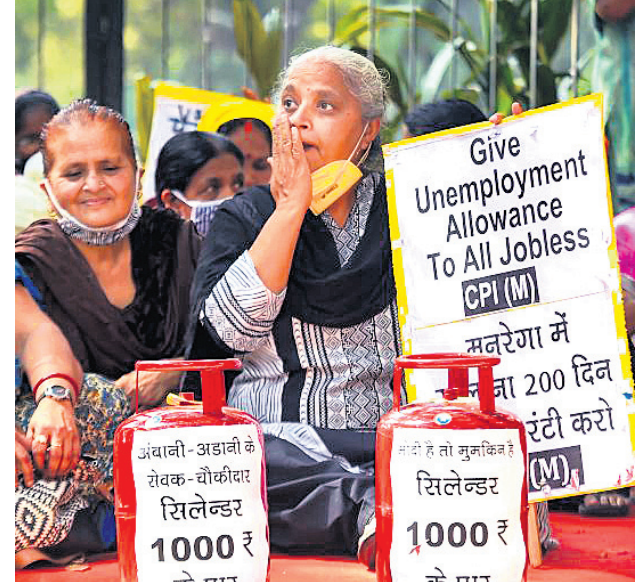
ନୂଆଦିଲ୍ଲୀର ଯତନମୟରେ ସିପିଆଇ (ଏମ୍) ପକ୍ଷରୁ ଟେକ ଦର ବୃଦ୍ଧି ବିରୋଧରେ ବିରୋଧ କରାଯାଇଛି।