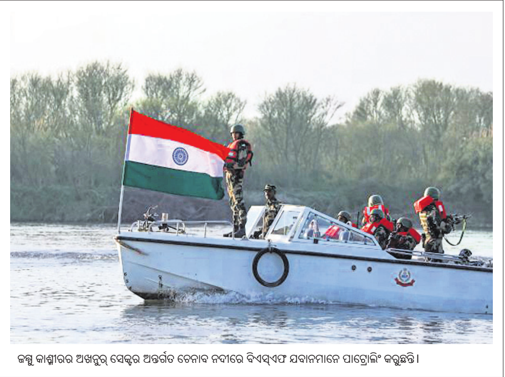
କଳ୍ପ କାଶ୍ମୀରର ଅଖିର ସେକ୍ଟର ଅନ୍ତର୍ଗତ ଚେନାବ ନଦୀରେ ବିଏସ୍‌ଏସ୍ ସମାଜମାନେ ପାଟ୍ରୋଲିଂ କରୁଛନ୍ତି।

କିଛିଦିନ ପୂର୍ବରୁ ମରାଠାଓଡ଼ିଶା ଲାଗୁର ଜିଲ୍ଲା ଅନ୍ତର୍ଗତ ଏକ ହଠାତ୍ରେ ୩୯ ଛାତ୍ରଛାତ୍ରୀ ଓ ୫ କର୍ମଚାରୀ କରୋନା ସଂକ୍ରମିତ ହୋଇଥିଲେ। ମହାରାଷ୍ଟ୍ରରେ କରୋନା ସଂକ୍ରମଣ ବଢ଼ିଯାଇଛି। ରୁଧିରା ସେଠାରେ ୧୦୦ରୁ ଊର୍ଦ୍ଧ୍ୱ କରୋନା ସଂକ୍ରମିତ ହୋଇଛନ୍ତି।