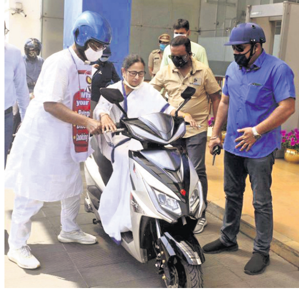
ତେଲ ଦର ବୃଦ୍ଧି ପ୍ରତିବାଦରେ ପଶ୍ଚିମବଙ୍ଗ ମୁଖ୍ୟମନ୍ତ୍ରୀ ମମତା ବାନାର୍ଜୀ ବିପ୍ଳବ ଚାଳିତ ସ୍କୂଟର ଚଳାଉଛନ୍ତି।