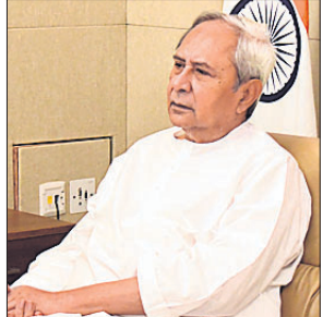
ପୁଖ୍ୟମନ୍ତ୍ରୀ ନବୀନ ପଟ୍ଟନାୟକ

ପୁରୀ ଶ୍ରୀକ୍ଷେତ୍ରକୁ ବିଶ୍ଵପ୍ରସିଦ୍ଧ ଐତିହାସିକ ପରିଗଣିତ କରିବା ପାଇଁ ଶନିବାର ବିଧାନସଭାରେ ସର୍ବସମ୍ମତରେ ଶ୍ରୀମନ୍ଦିର ପରିକ୍ରମା ଯୋଜନା ସଂକଳ୍ପ ଗୃହୀତ କରାଯାଇଛି। ପୁଖ୍ୟମନ୍ତ୍ରୀ ନବୀନ ପଟ୍ଟନାୟକ ଭିତ୍ତି ଉପରେ କର୍ମକ୍ରମରେ ଏହି ସଂକଳ୍ପକୁ ଉପସ୍ଥାପନ କରିବା ପରେ ଏହା ବାଚନିକ ଭାବରେ ପାରିତ ହୋଇଛି। ଏଥିରେ ପୁଖ୍ୟମନ୍ତ୍ରୀ ଶ୍ରୀମନ୍ଦିର ପୁରୁଷୋତ୍ତମ ଦିଆଯାଇଛି। ସେଗୁଡ଼ିକ ହେଲା ଶ୍ରୀମନ୍ଦିର ସୁରକ୍ଷା, ମହାପ୍ରଭୁଙ୍କ ଦର୍ଶନ ପାଇଁ ଆସୁଥିବା ଲକ୍ଷ ଲକ୍ଷ ଭକ୍ତମାନଙ୍କର ନିରାପତ୍ତା ଓ ଭକ୍ତ ପାଇଁ ଏକ ସୁନ୍ଦର ଆଧ୍ୟାତ୍ମିକ ପରିବେଶ ସୃଷ୍ଟି କରିବା। ଭକ୍ତମାନେ