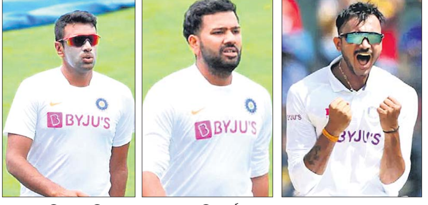
ଉଦ୍ଘାଟନୀ ଅଶ୍ଵିନ ରୋହିତ ଶର୍ମା ଅକ୍ଷୟ ପଟ୍ଟେଲ