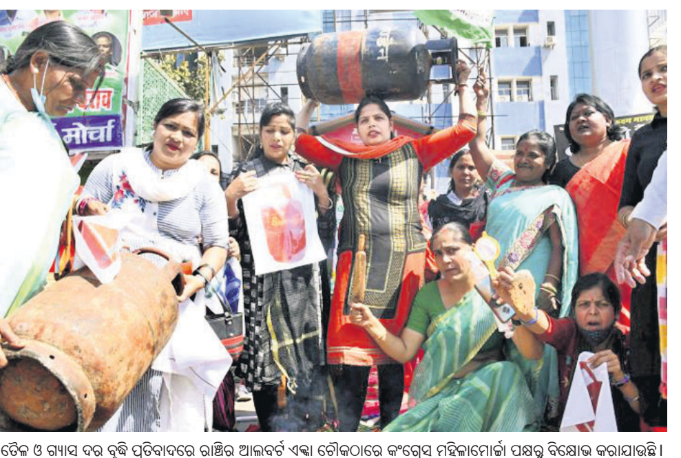
ଟେକ୍ ଓ ଗ୍ୟାସ୍ ଦର ବୃଦ୍ଧି ପ୍ରତିବାଦରେ ରାଷ୍ଟ୍ର ଆଲବର୍ଟ୍ ଏକା ଟେକ୍‌ଠାରେ କଂଗ୍ରେସ୍ ମହିଳାମାନେ ପକ୍ଷରୁ ବିକ୍ଷୋଭ କରାଯାଇଛି।

ସର୍ବସାଧାରଣରେ ହେବାର ନୀତି ଥିବାରୁ ଏ ସମସ୍ତ ଦୃଶ୍ୟର ଲାଇଭ୍ ଟେଲିକାଷ୍ଟ ହୋଇଥିଲା। ଅସ୍ତ୍ରୋପଚାର କରୁଥିଲେ ମଧ୍ୟ ଶୁଣାଣିରେ ଯୋଗଦେବାକୁ ଏକ ରାଜି ହୋଇଥିଲେ। ଏକ ଠିକ୍ ଭାବେ ଗ୍ରାଏଲରେ ଭାଗ ନେଉ ନ ଥିବାରୁ ଜଜ୍ ଗ୍ରେ ଲିଙ୍କ୍ ଶୁଣାଣି ଆରମ୍ଭ କରିବାକୁ ଉଚିତ୍ ମନେ କରି ନ ଥିଲେ।